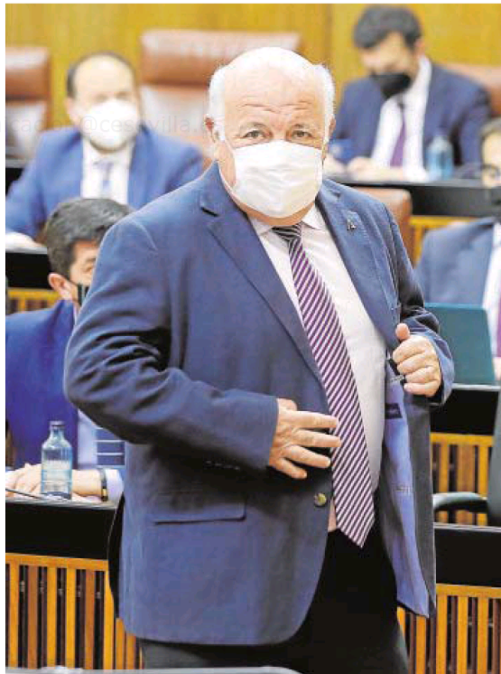
El consejero de Salud, Jesús Aguirre, ayer en el Parlamento

Desde la Consejería de Salud explicaban a ABC que Andalucía cumplirá con los protocolos establecidos en el plan de vacunación, inoculando a cada