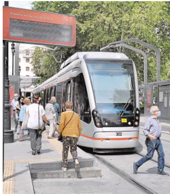
El tranvía a su paso por la Plaza Nueva

En total, el proyecto completo de corredor verde y la transformación urbanística y de la movilidad supondrá una importante inversión que superará los 45 millones de euros, de los cuales 19,5 proceden de fondos europeos a través de la convocatoria del Instituto de Di-