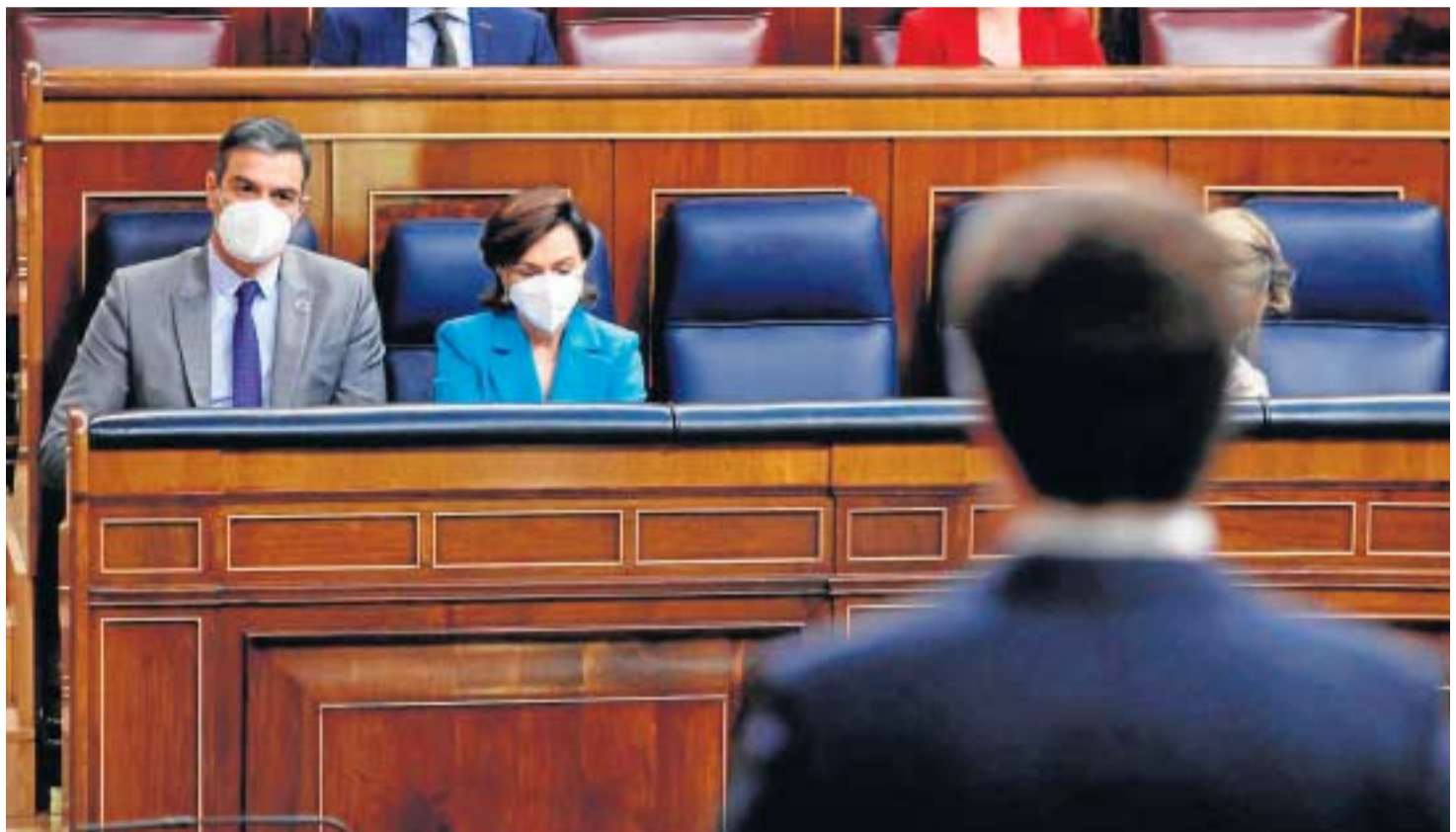
El presidente del Gobierno, Pedro Sánchez, y la vicepresidenta primera, Carmen Calvo, escuchando ayer la intervención del líder del PP, Pablo Casado.

Y ayer quien mejor lo escenificó a nivel local fue el alcalde de Madrid, José Luis Martínez Almeida, y la delegada del Gobierno, la socialista Mercedes González. En una rueda de prensa, tras reunirse para abordar restricciones de cara al día de San Isidro (15 de mayo), y con el fin de que no se repitan las aglomeraciones