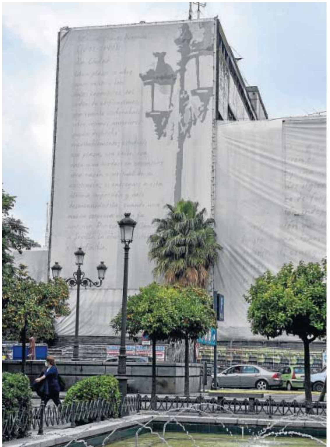
El proyecto incluye una intervención en la Plaza de la Concordia.

Una de las principales novedades es que el promotor asume la reurbanización tanto del entorno inmediato del céntrico inmueble como de la Plaza de la Concordia de acuerdo con los criterios que marque Urbanismo. La idea de los técnicos municipales es ampliar los accesos e itinerarios peatonales integrando la entrada al aparcamiento. Un ejemplo son los varios desniveles que presenta y que serían corregidos mediante la su-