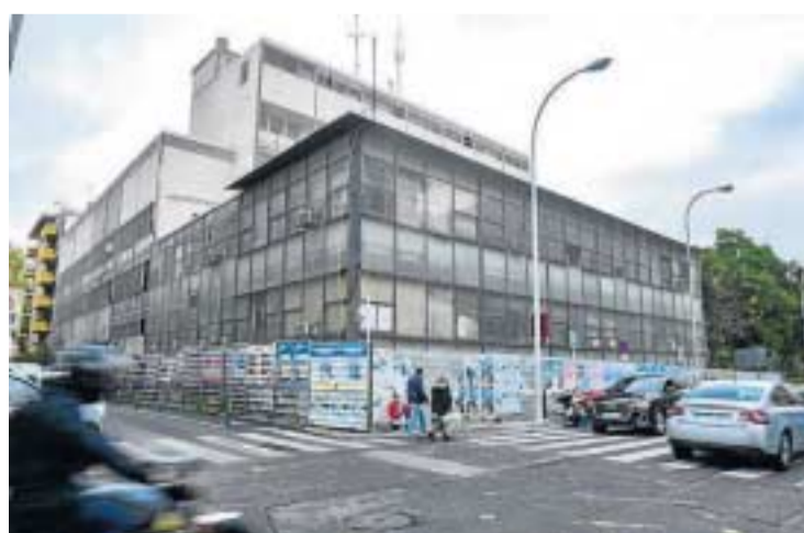
Vista de la trasera de la antigua comisaría de la Gavidia.

presión de los escalones. Incluso no descartan peatonalizar algunos tramos, algo que sería más complicado, ya que requiere una reordenación completa ese espacio.