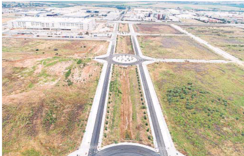
A la derecha, parcela donde construirá Grupo Puma, y al final a la izquierda, el centro de Amazon en Megapark

El grupo Puma ha diversificado y cuenta con una división deportiva a través del Club Recreativo y Polideportivo Mirabueno. Además, cuenta con el 60% de la sociedad propietaria de Bodegas Campos, que registró una cifra de negocio de 7,3 millones en 2019. La firma, que en origen se dedicaba a la crianza de vinos de los pagos de Montilla y Moriles, ofrece servicios de restauración y hostelería, lo que incluye servicio de catering y la organización de eventos sociales, banquetes y celebraciones a empresas o particulares.