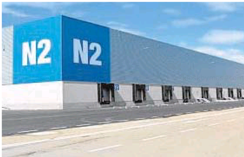
Plataforma logística que la socimi Trajano Iberia acaba de vender en Zaragoza a UBS Asset Management