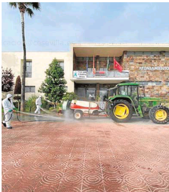
Tareas de desinfección en La Campana durante el primer confinamiento

En el caso de La Campana se espera que la tasa siga creciendo los próximos días después de que el regidor detallara que hay más de 80 casos confirmados, por lo que ante esta situación ha pedido a la propia Consejería un cribado masivo entre sus vecinos. Pero tendrá que aguardar a conocer si