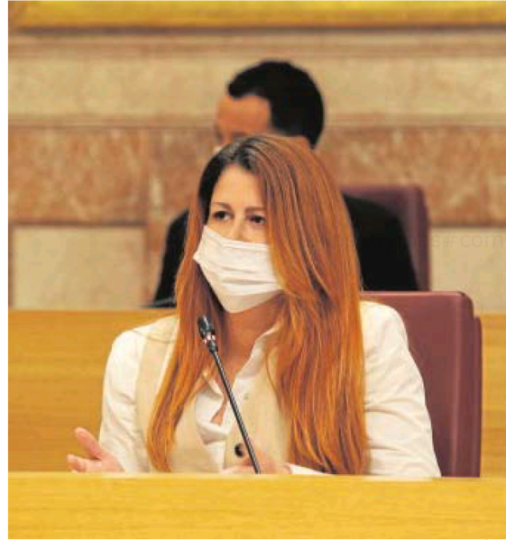
El alcalde, el socialista Juan Espadas, y la concejala de Adelante Sevilla Susana Serrano, durante el pleno extraordinario de ayer