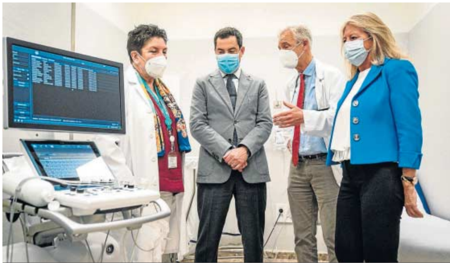
Juanma Moreno, la semana pasada en el Hospital Costa del Sol, uno de los gestionados por estas agencias públicas empresariales.