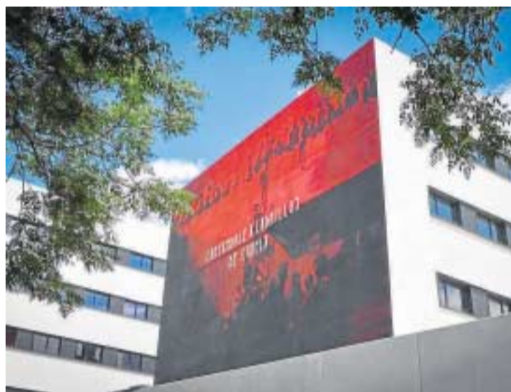
El otro mural colocado en Livensa Living.