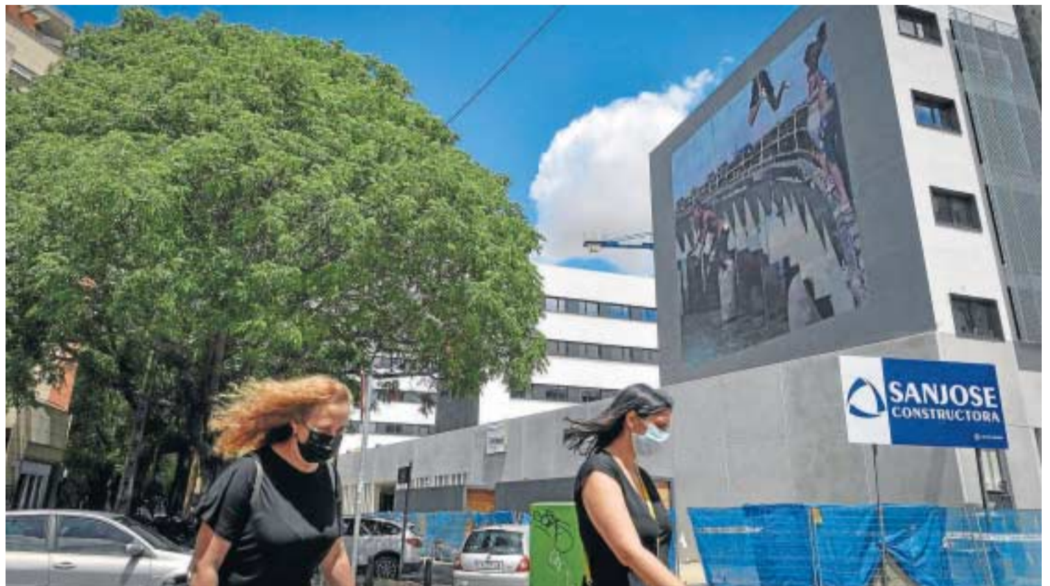
Dos personas pasan antes las obras de la residencia de estudiantes, que ya cuenta con los murales de Axel Void.

Void, cuyas raíces biográficas se encuentran en Haití, Miami y Andalucía, es parte de una generación de pintores cuya educación artística proviene de la cultura del arte urbano, a la vez que recibe una fuerte influencia de la pintura y el dibujo clásicos, que ha adquirido en su formación en Bellas Artes entre Cádiz, Sevilla y Granada. Sus murales se pueden ver en países como Alemania, Italia, Polonia, India, México, Noruega, Estados Unidos, Cuba, Puerto Rico o República Dominicana. Además, en Reino Unido participó en 2015 como artista invitado en Dismaland , el proyecto más ambicioso hasta la fecha de Banksy. Para la intervención en Livensa Living Sevilla, Void es-