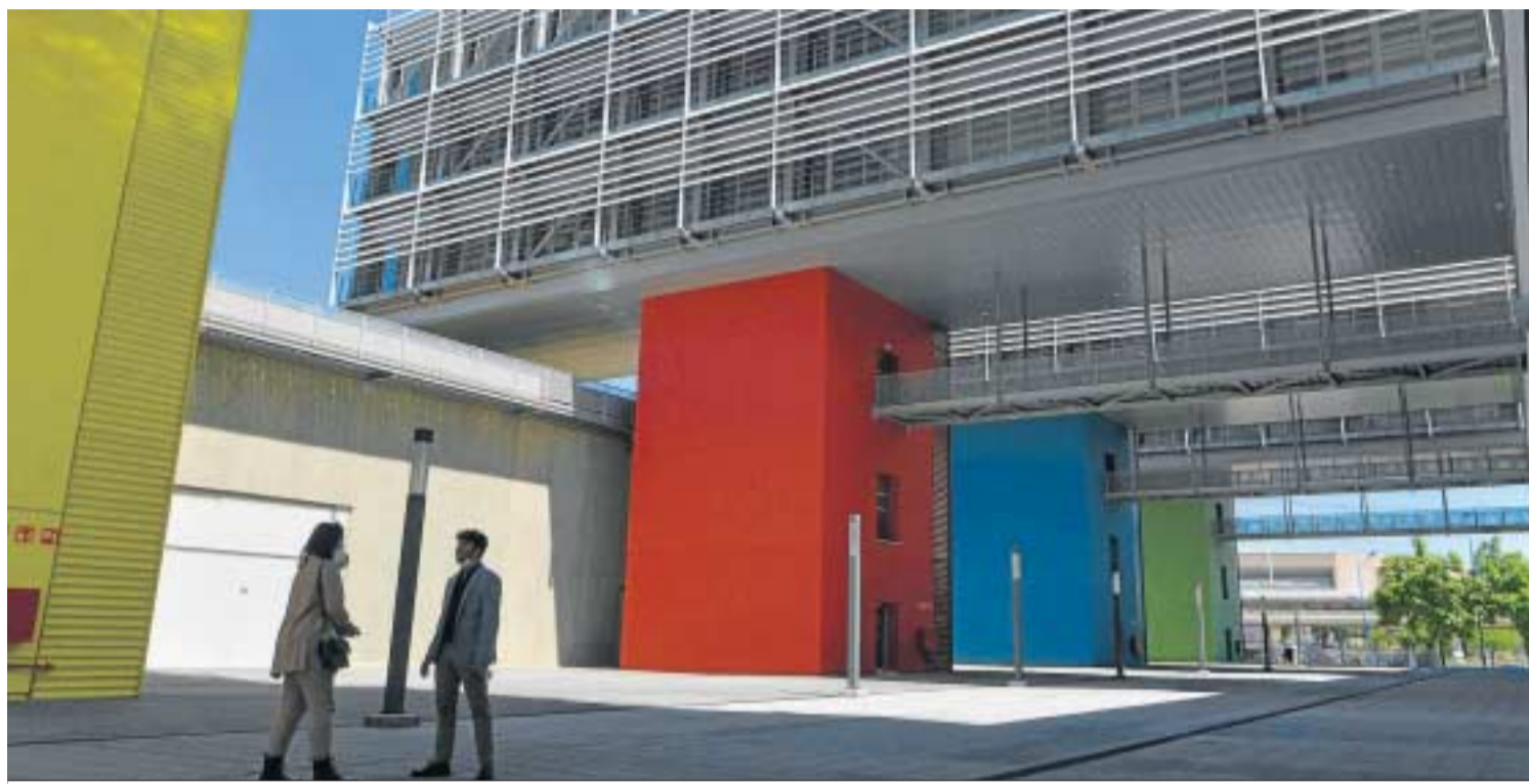
Los distintos bloques que componen el complejo universitario construido en la Cartuja.

Otros escenarios La presencialidad máxima es la principal opción que se baraja, aunque no se descarta el modelo híbrido y el telemático