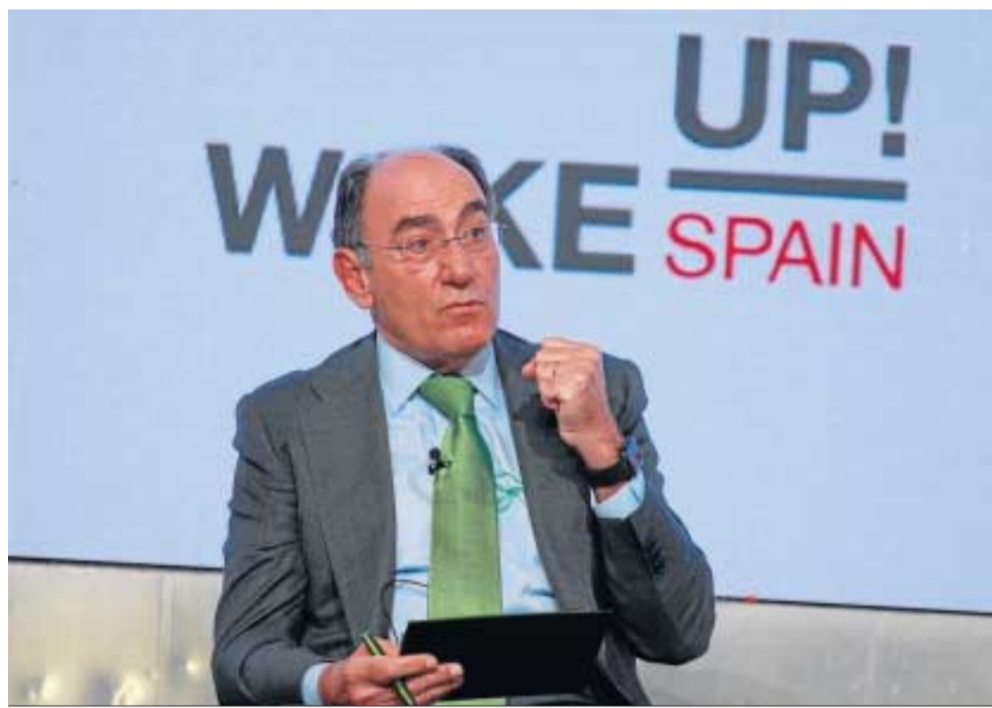
Ignacio Galán, presidente de Iberdrola.

En la acería, Acerinox ha destinado casi 6 millones de euros a la instalación de una nueva conducción para la extracción del polvo de humo, de manera que se han reducido las emisiones de polvo. Esta obra se ha complementado con un nuevo depurador de humos con capacidad para 250.000 metros cúbicos y que pasa a ser el octavo de la fábrica. Acerinox también ha construido un nuevo depósito temporal de residuos para mejorar la clasificación previa de los residuos antes de su traslado para tratamiento.