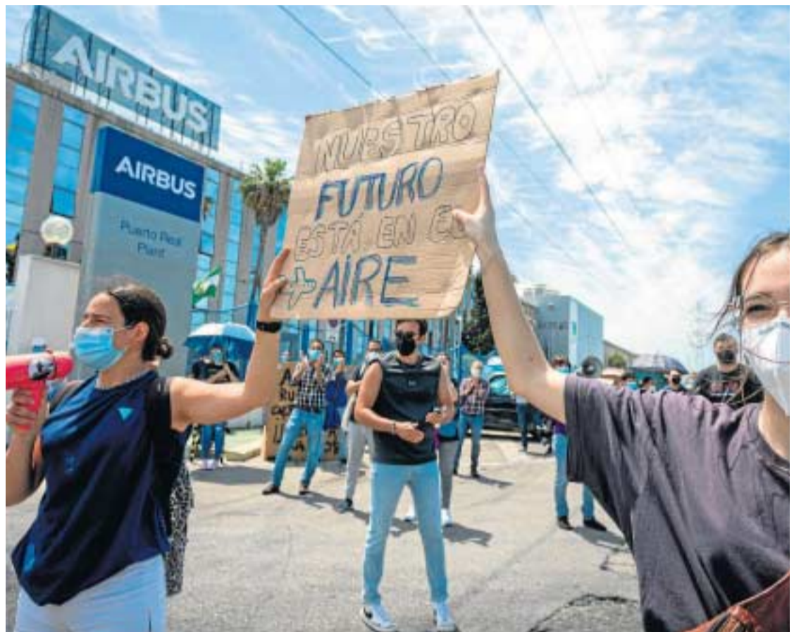
Estudiantes de la UCA se manifiestan la pasada semana en defensa de la planta de Airbus Puerto Real.

El momento laboral es especialmente complicado ya que el próximo 31 de mayo expira el Expediente de Regulación Temporal de Empleo (ERTE) que se aplica en todos los centros de trabajo de la división de Operaciones y que afecta a más de 3.200 trabajadores en España. Este ERTE es una consecuencia de la falta de demanda de aviones por la pandemia, que llevó a la compañía a reducir el año pasado en un tercio el ritmo de fabricación del A320, A330 y A350, programas en los que participa la factoría de Puerto Real y buena parte de la in-