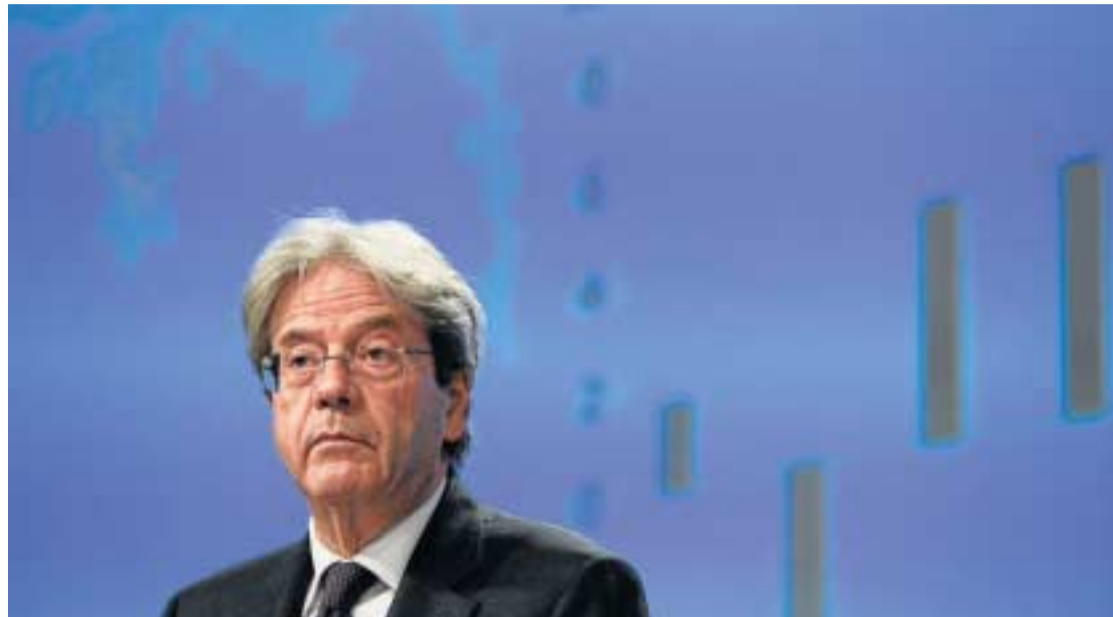
Paolo Getiloni, comisario de Economía de la UE, ayer, en Bruselas.

La Comisión prevé que el PIB rebote en el segundo trimestre y tome brío en la segunda mitad de 2021 gracias al aumento del consumo privado y la inversión a cuenta del ahorro acumulado durante la pandemia, a lo que en