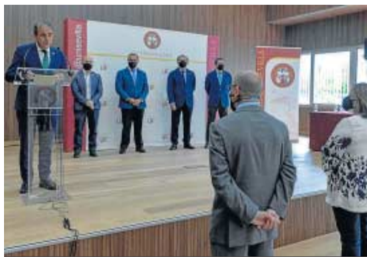
El rector de la US en su discurso de recepción del nuevo edificio.