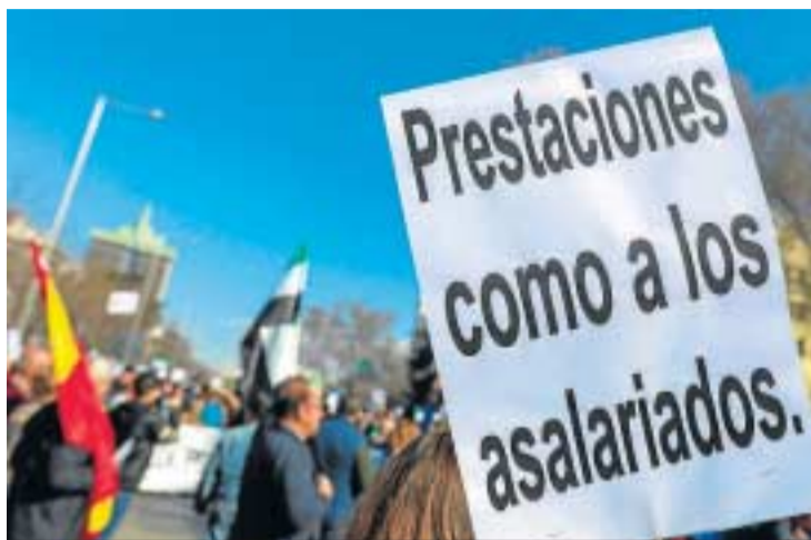
Manifestación de autónomos.

Una vez que finalice el periodo de despliegue de la reforma de 9