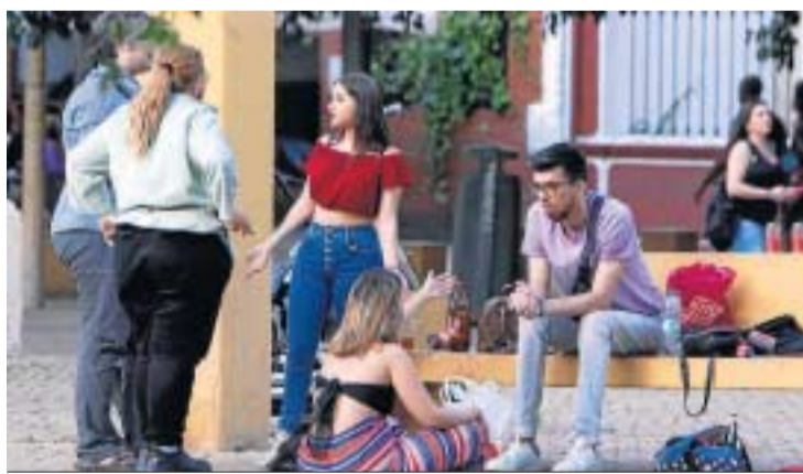
Un grupo de jóvenes beben en un banco de la Alameda de Hércules.

Batallas de gallos, escape room o manga son algunas de las ocupaciones que aparece en el programa Espacio Sevilla Joven , un proyecto que incluye actividades culturales, deportivas, artísticas, lúdicas, recreati-