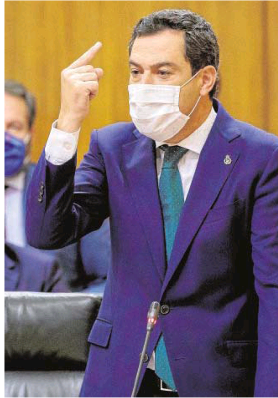
Juanma Moreno, el pasado jueves en el Parlamento andaluz.

'Geometría variable' Una «mayoría se puede hacer de muchas maneras», advierte el mandatario andaluz