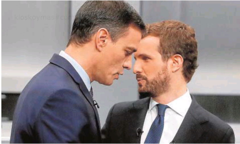
Sánchez y Casado se cruzan antes de un debate electoral

Los nacionalistas ya han avisado a la vicepresidenta Calvo en el Congreso: si se abre el 'melón', de forma inevitable se pondrán sobre la mesa los artículos 1,2 y 8, entre otros.