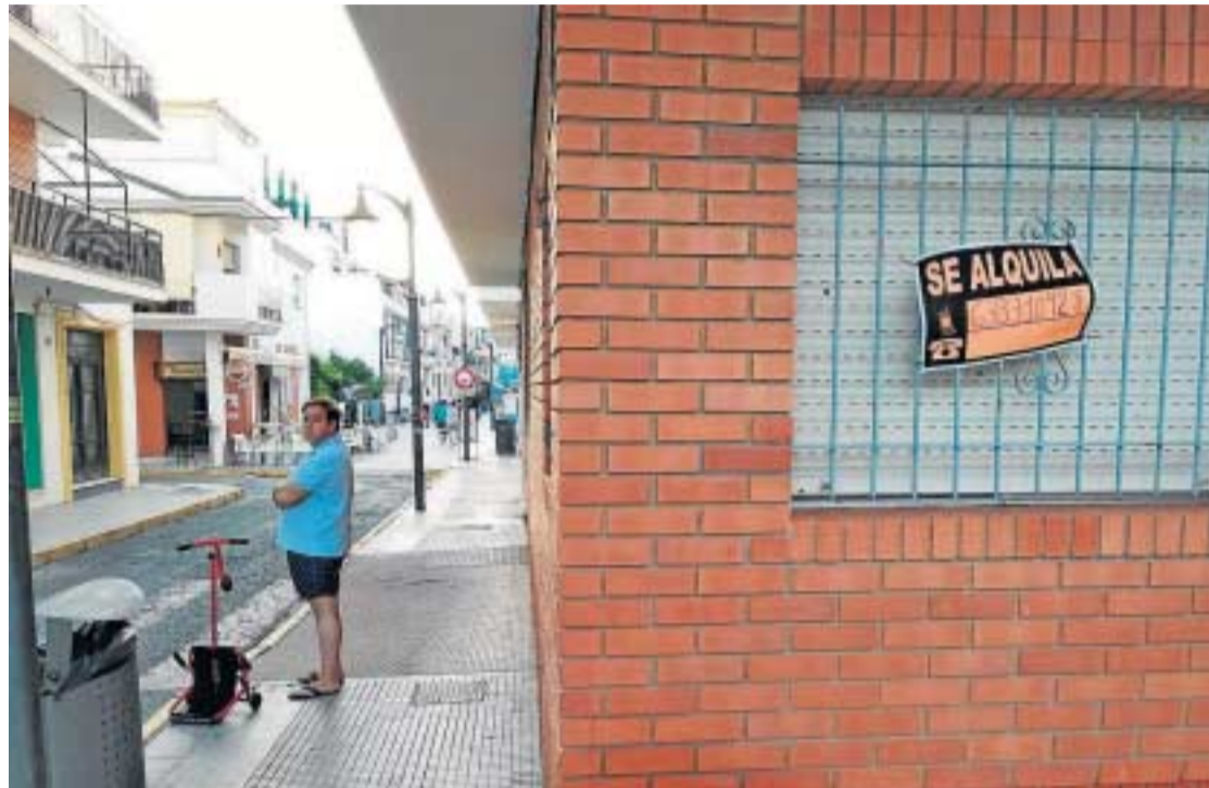
Vivienda en alquiler en una calle de Huelva.

Ya en febrero, cuando los socios de gobierno vivieron uno de sus mayores momentos de tensión, el secretario general de CCOO, Unai Sordo, defendió la necesidad de limitar el precio