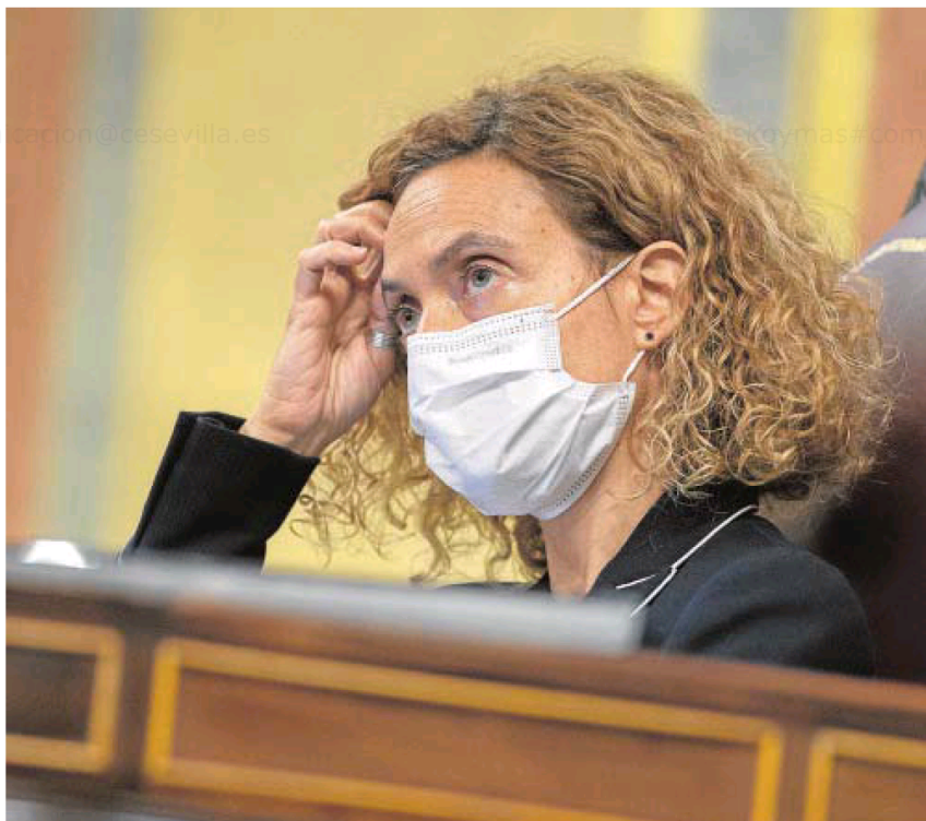
La presidenta del Congreso, Meritxell Batet, en una imagen de archivo

El Reglamento del Congreso prevé un plazo inicial de quince días para presentar enmiendas, que se reduce a la mitad en el caso de los textos urgentes como este. Los Presupuestos de 2021, el proyecto más importante del año, pasó tan solo 19 días en plazo de enmiendas y otros textos que también han interesado al Gobierno como el recorte de funciones del Poder Judicial estuvo once días. La ley del ingreso mínimo vital, en cambio, lleva ya once meses atrapada en esta etapa. El