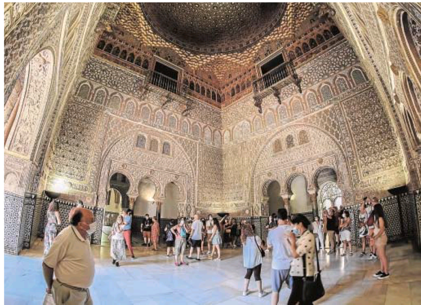
Afluencia de turistas el pasado fin de semana en el Real Alcázar de Sevilla

En esta nueva etapa del Alcázar tras el paréntesis provocado por la pandemia se parte con un potente reclamo que es el hallazgo del sarcófago que alberga los restos de una niña que vivió en la Edad Media. Aunque no se encuentra expuesto, la noticia ha sido muy popular, apuntando incluso a la posibilidad de que pudiera tratarse de la hija bastarda de Alfonso X. La difusión de este descubrimiento ha sido una magnífica promoción para volver a visitarlo.