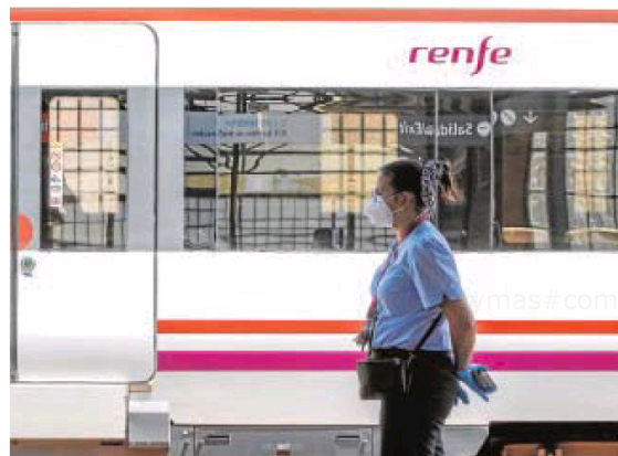
La variante permitirá una oferta de ocho trenes diarios

la nueva variante ferroviaria, finalizan los transbordos en autobús entre Osuna y Pedrera y Renfe pone sobre la mesa una oferta diaria de ocho trenes directos y diarios, cuatro por sentido, entre Málaga y Sevilla, con tiempos de dos horas y 45 minutos similares a la programación previa a octubre de 2018. Con esta recuperación, se restablece el 80% de las conexiones diarias por vía convencional entre ambas capitales respecto a la oferta existente antes de la pandemia.