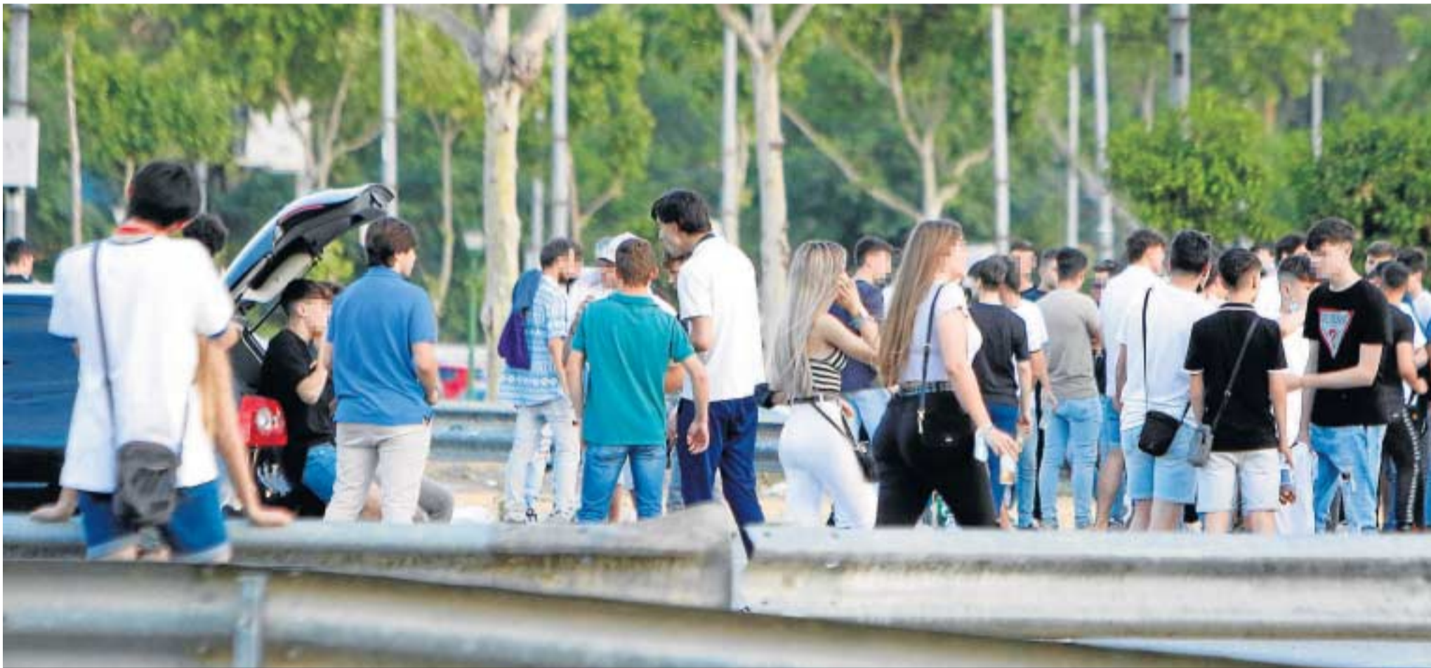
Una multitud de adolescentes realizan una 'botellona' en los terrenos en los que se monta la Feria de Abril.

● El Ayuntamiento ultima un ambicioso programa de ocio alternativo que arrancará los viernes y sábados después del verano en tres espacios simultáneos por toda la ciudad