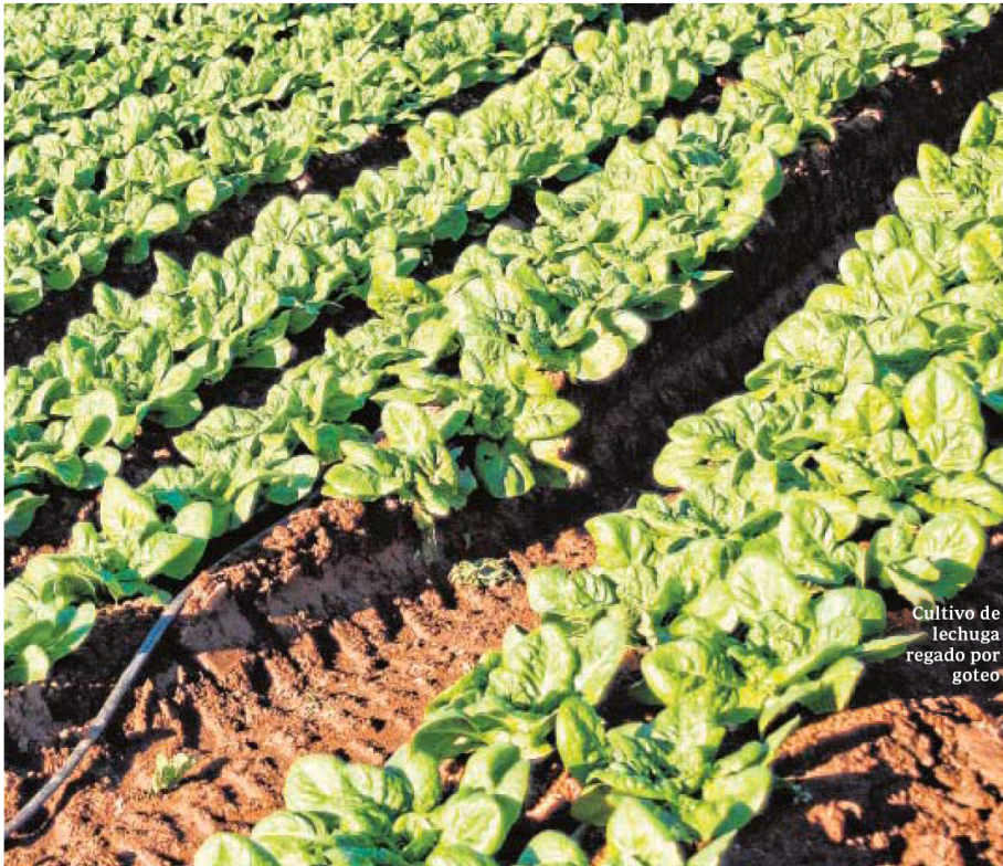
Cultivo de lechuga regado por goteo

da de 13,88 euros. Por tanto, si se pasa en un día diez veces en esos cuartos de hora, el importe por sobreexceso sólo de ese día sería de 138 euros».