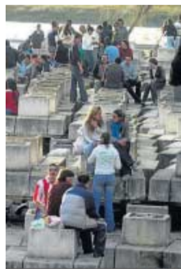
Jóvenes bebiendo en la bancada.

Las administraciones local y autonómica llevan años poniendo chinias en los zapatos de los jóvenes asiduos a esta moda (de Sevilla y muchas urbes del país) y aumentando los controles a los empresarios con negocios relacio-