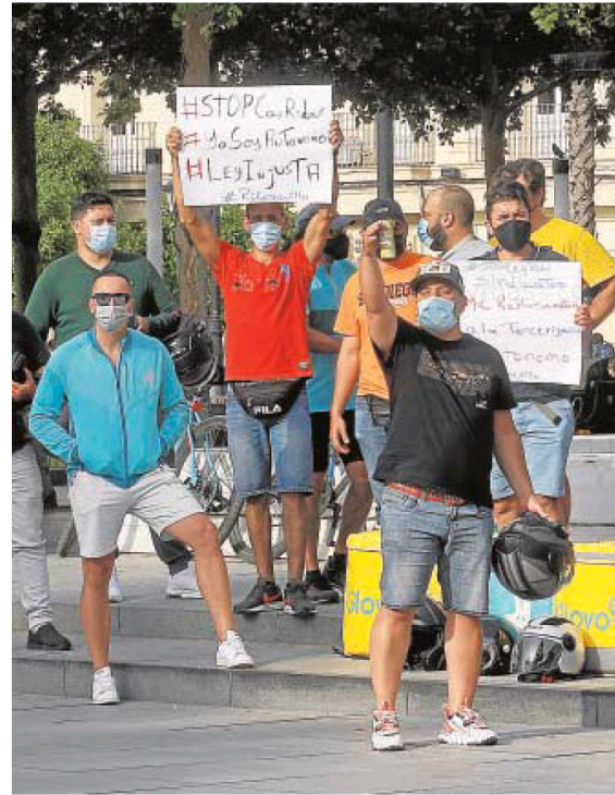
Protesta de repartidores en Sevilla contra la 'Ley Rider'