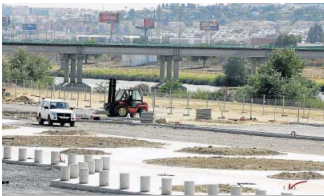
Vista de las obras para adecuar la bancada de la Expo en el fallido 'botellódromo', una imagen de 2009.

Las actividades de ocio alternativo a la botellona se desarrollarán de forma itinerante en al menos tres espacios simultá-