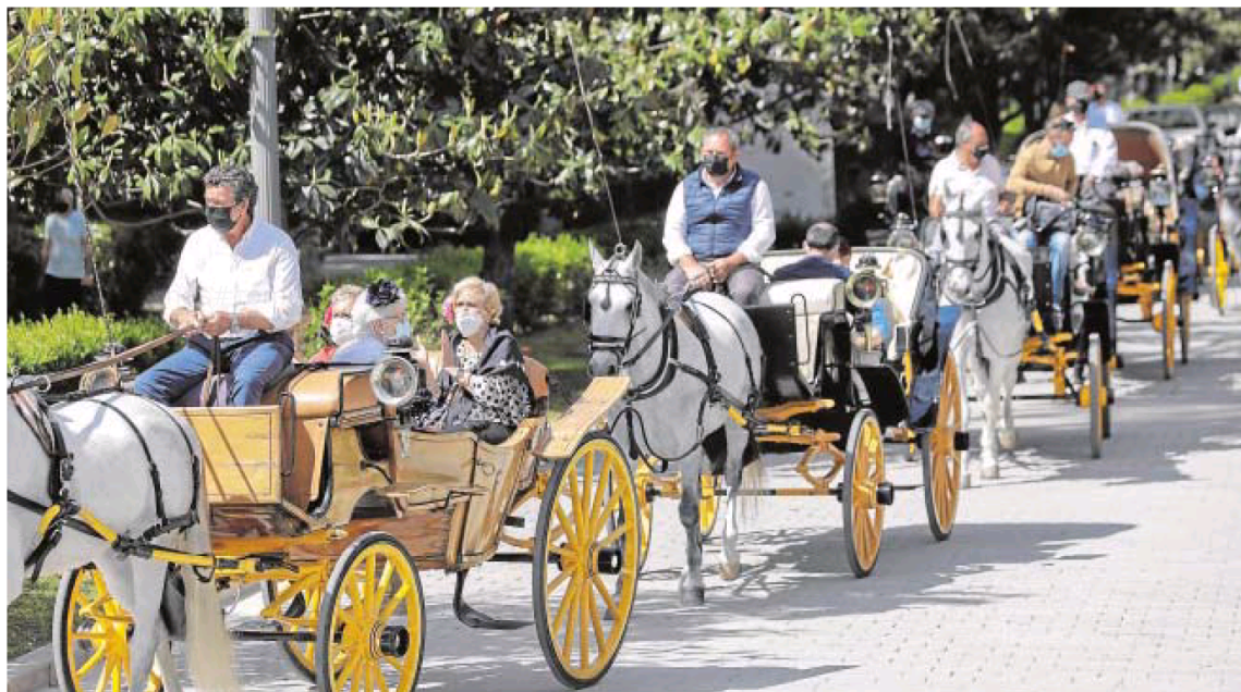
Varios coches de caballo por las calles de Sevilla en una imagen tomada recientemente