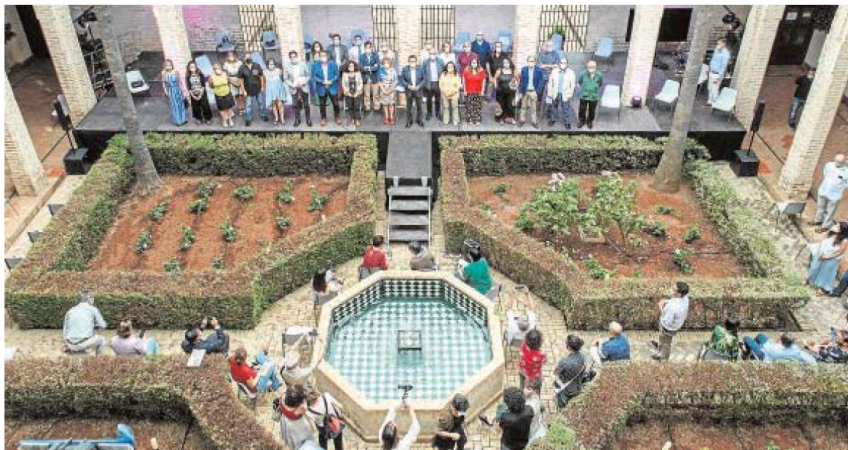
Presentación de la programación cultural del verano pasado en el Palacio de los Marqueses de la Algaba ABC