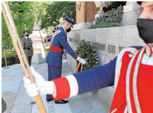
Don Felipe, en el acto del Día de las Fuerzas Armadas

El Gobierno se comprometió con la oposición a tramitar como proyecto de ley y por vía urgente el decreto que estableció esta ayuda para enmendar los defectos del decreto que estableció esta ayuda. El texto está bloqueado desde el 29 de junio de 2020.