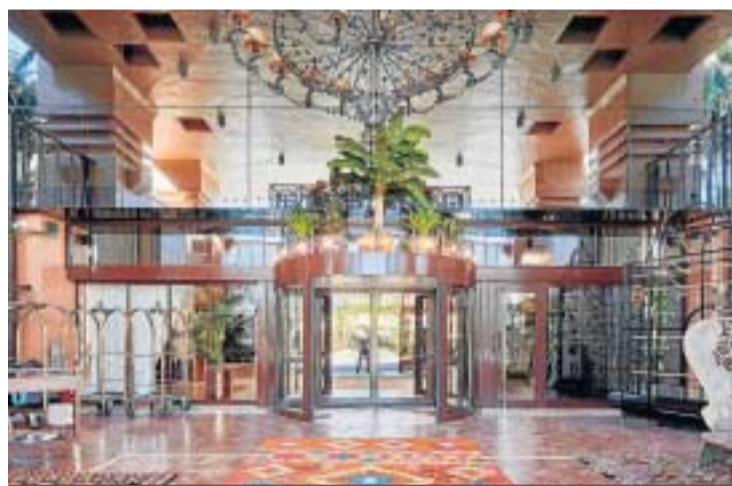
La entrada del hotel Gran Lujo Kempinski, ubicado en Estepona.

Por otro lado, apuntó que se están haciendo “ofertas dirigidas a los mercados con más posibilidad de recibir”, como es el “nacional”, aunque “necesitamos el británico, alemán o el francés”, y a la espera de entrar en el semáforo verde de Reino Unido para “trabajar con ofertas importantes y atractivas” para estos turistas. “La creatividad