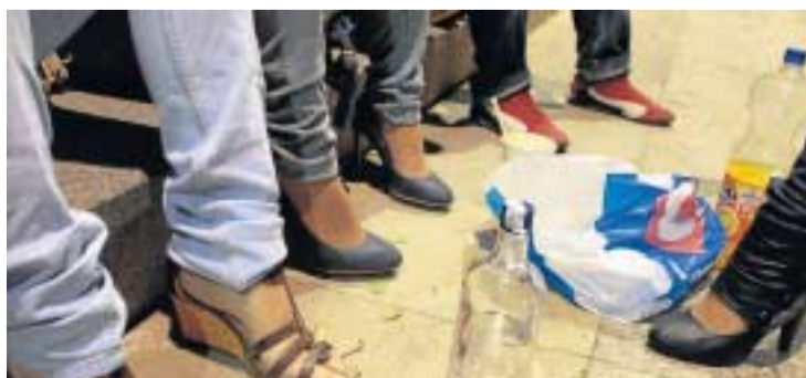
Botellas de alcohol y refresco, estampa clásica de una 'botellona'.

vas y formativas que se ejecutarán durante las tardes y noches de los fines de semana de forma itinerante por distintos espacios públicos de Sevilla que coincidirá con zonas cercanas usadas para la botellona . Las actividades diseñadas de acuerdo con los intereses de los jóvenes serán gratuitas.