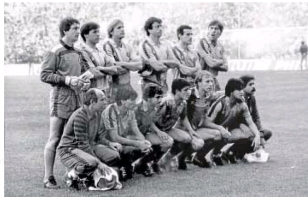
Once del Barcelona en la final de la Copa de Europa de 1986 en Sevilla.

cia alzar el título ante el Atlético en 1999, para después ser testigo de un Zaragoza campeón en el 2001 (tras vencer al Celta 3-1) y de las dos últimas finales de la Copa del Rey disputadas hasta la fecha, ambas en este 2021. Real Sociedad y Barcelona se proclamaron campeones del torneo ante el mismo rival, el Athletic, en dos citas sin público por las restricciones de la pandemia.