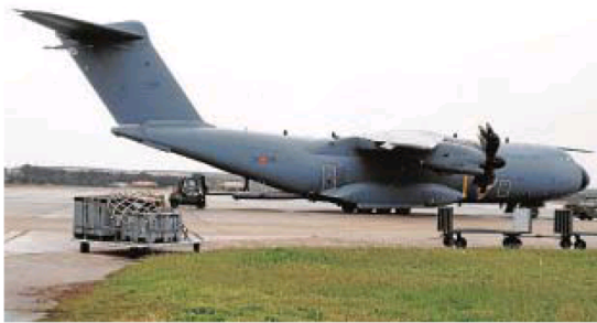
Avión militar A400, que Airbus ensambla en Sevilla