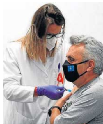
Un hombre vacunándose.