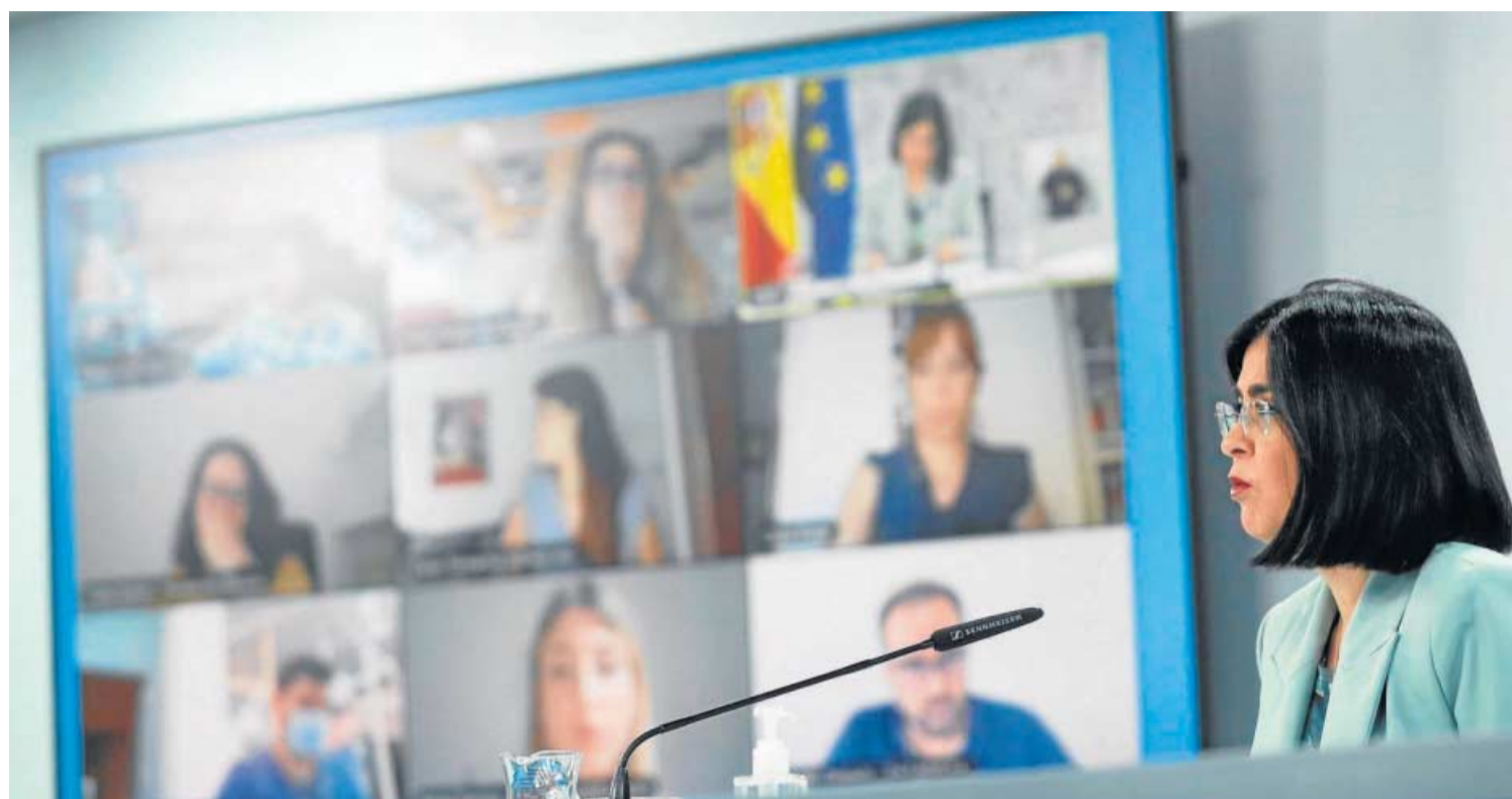
La ministra de Sanidad, Carolina Darias, ayer en rueda de prensa tras presidir por videoconferencia la reunión del Consejo Interterritorial de Salud.

LA BATALLA CONTRA EL CORONAVIRUS ▶ Acuerdo con Sanidad tras el desencuentro