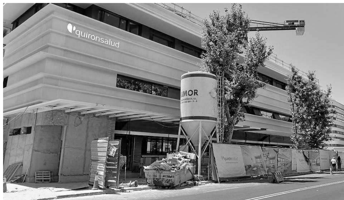
Un edificio en obras que tendrá uso sanitario a escasos metros del Hospital Virgen del Rocío.

La tramitación de esta modificación del plan urbanístico revisará estas determinaciones que favorecían el desarrollo de equipamientos privados, y establecerá un nuevo régimen que regule la compatibilidad de usos de forma que se mantengan las condiciones particulares de cada zona de ordenanza, y por tanto la edificabilidad, favoreciendo de esta manera el mantenimiento del ambiente e imagen urbana propios de cada barrio. Mientras esto se define, con un proceso que incluye la participación ciudadana, se van a suspender temporalmente du-