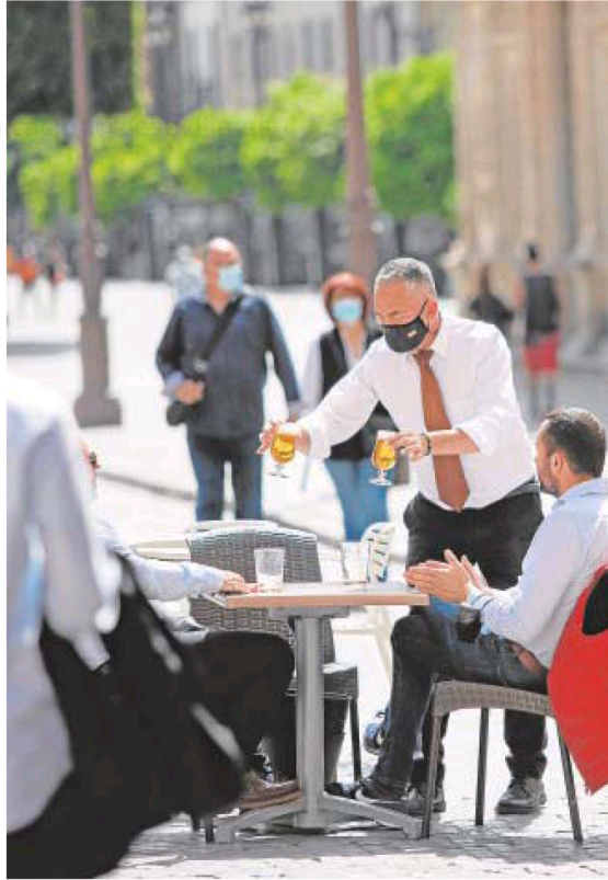
Bares, hoteles y transportes, los más afectados por la pandemia

En cuanto al empleo, prevé una recuperación del mismo, pero menor que el del PIB. En 2021 y 2022, BBVA Research calcula que se crearán unos 177.000 empleos en Andalucía, de modo que la comunidad acabará previsiblemente 2021 con una tasa de paro del 24%