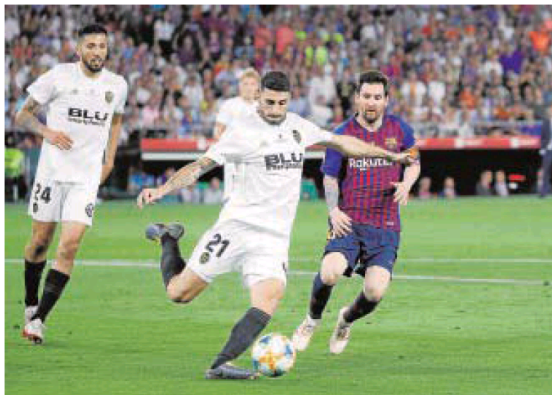
Piccini y Messi en un lance de la final de la Copa del Rey de 2019.

cita que vio proclamarse campeones del mundo a atletas de la talla de Maurice Green, Marion Jones, Haile Gebrselassie, Hicham El Guerrouj o Gabriela Szabo. Sobretudo se recordará por la medalla de oro y récord del mundo de Michael Johnson, así como por las victorias de Abel Antón en maratón o de Niurka Montalvo en salto de longitud. Aquella cita reunió una gran afluencia de público en las gradas del estadio y a mucha gente en las calles de Sevilla para observar a los 1.821 atletas que acudieron a la cita sevillana.