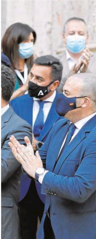
formación de Abascal // RAÚL DOBLADO