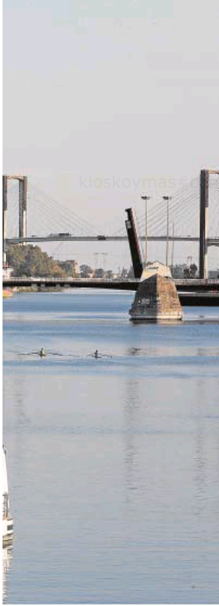
puesto rumbo a Cádiz

atraca dos veces más-, el 'Silver Shadow' y el 'Azamara Quest', que pasará dos noches en la ciudad entre el 10 y el 12 de noviembre si mantienen la reserva solicitada.