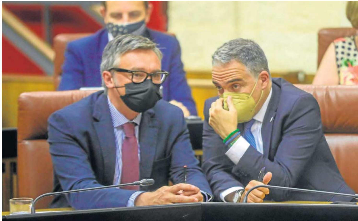
MARÍA JOSÉ LÓPEZ / EP

● El Ejecutivo saca adelante un decreto sobre dependencia y la ley contra el fraude con el apoyo de Vox al tiempo que negocia con la izquierda para evitar batacazos como el de la ley del suelo