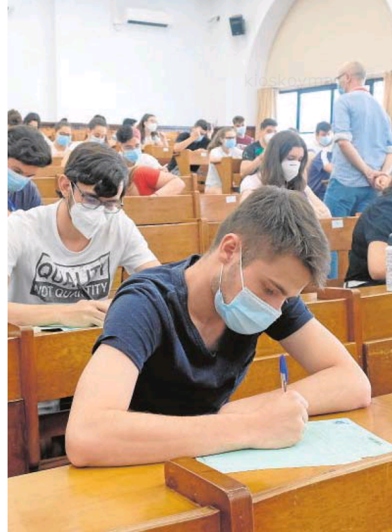
Estudiantes realizando la prueba de Selectividad de 2020

Por otro lado, fue muy crítico con la financiación. «Reitero mi más tajante disconformidad con el modelo de financiación aprobado por el Gobierno de la Junta y solicito respeto a las universidades públicas andaluzas», dijo insistiendo en que no se trata de un modelo de financiación sino de un modelo de reparto que no cubre las necesidades del sistema universitario. En este sentido, destacó que la Hispalense, en 2019, hubiera necesitado un 116% de la financiación básica operativa recibida por la Junta para cubrir sus gastos salariales y de funcionamiento. Lo cual, según sostuvo, queda lejos del 80% anunciado e implica que «no podrán cubrirse el total de los gastos de