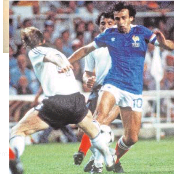
Platini conduce el balón en la semifinal del Mundial de 1982 en Sevilla.

do de Escocia supuso una invasión de la ciudad de la que aún guardan gratos recuerdos comerciantes y aficionados al fútbol en general. Aquel 21 de mayo de 2003 José Mourinho alzaba su primer entorchado europeo al vencer con el Oporto por 3-2 a cinco minutos del final de la prórroga gracias a un gol de Derlei, que decantó un duelo competido y vibrante. Esa ha sido la última gran cita a nivel europea que se ha disputado en Sevilla hasta el momento.