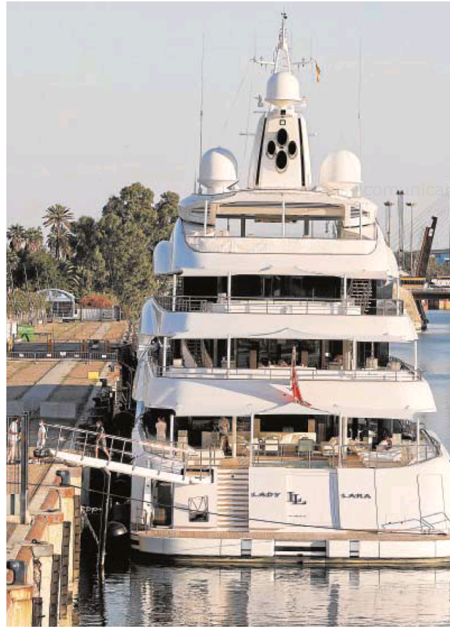
El yate 'Lady Lara', que pertenece al empresario israelí Alexander Machkevith, que ha

Si las navieras retoman los itinerarios originales en septiembre, el Puerto de Sevilla sólo podría registrar una única temporada de cruceros, cuando lo habitual es que haya dos. El mes de mayor actividad será octubre y las escalas concluirán a medidas de noviembre. A pesar de la actual situación de pandemia, las navieras continúan interesadas en los muelles de la ciudad y la Autoridad Portuaria sigue atendiendo consultas de disponibilidad para este año y para el que viene.