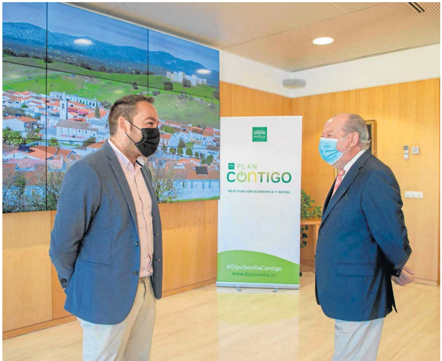
El presidente de la Diputación y el alcalde de El Real de la Jara.