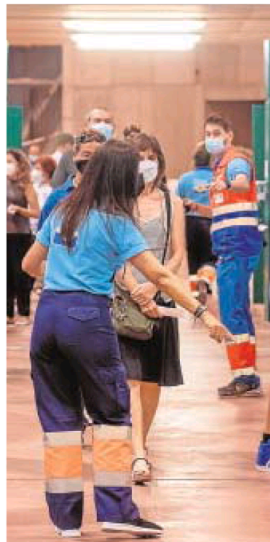
Vacunación en Sevilla

La Junta ha solicitado al TSJA el cierre perimetral de Cantillana por su alta tasa y permite a La Algaba abrir desde mañana