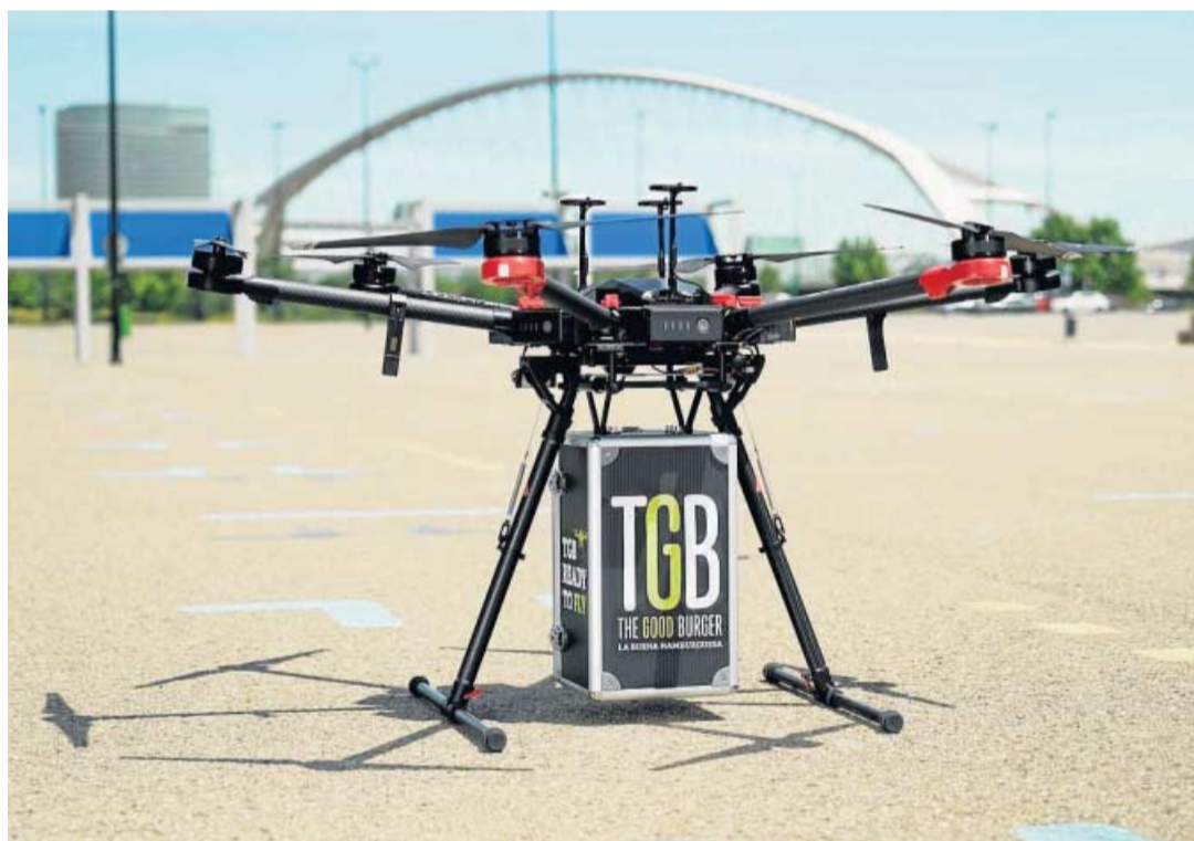
Ensayos en la base de Hera Dron Hub, en Zaragoza, con las hamburguesas de TGB.

Los productos más demandados por estos clientes han sido los TPVs y los referidos a la financiación (como la póliza multiproducto empresas, el leasing o la línea de crédito a corto plazo). Recientemente, el banco ha lanzado Santander One Empresas y ha puesto a disposición de sus clientes One Digital, la nueva plataforma digital.