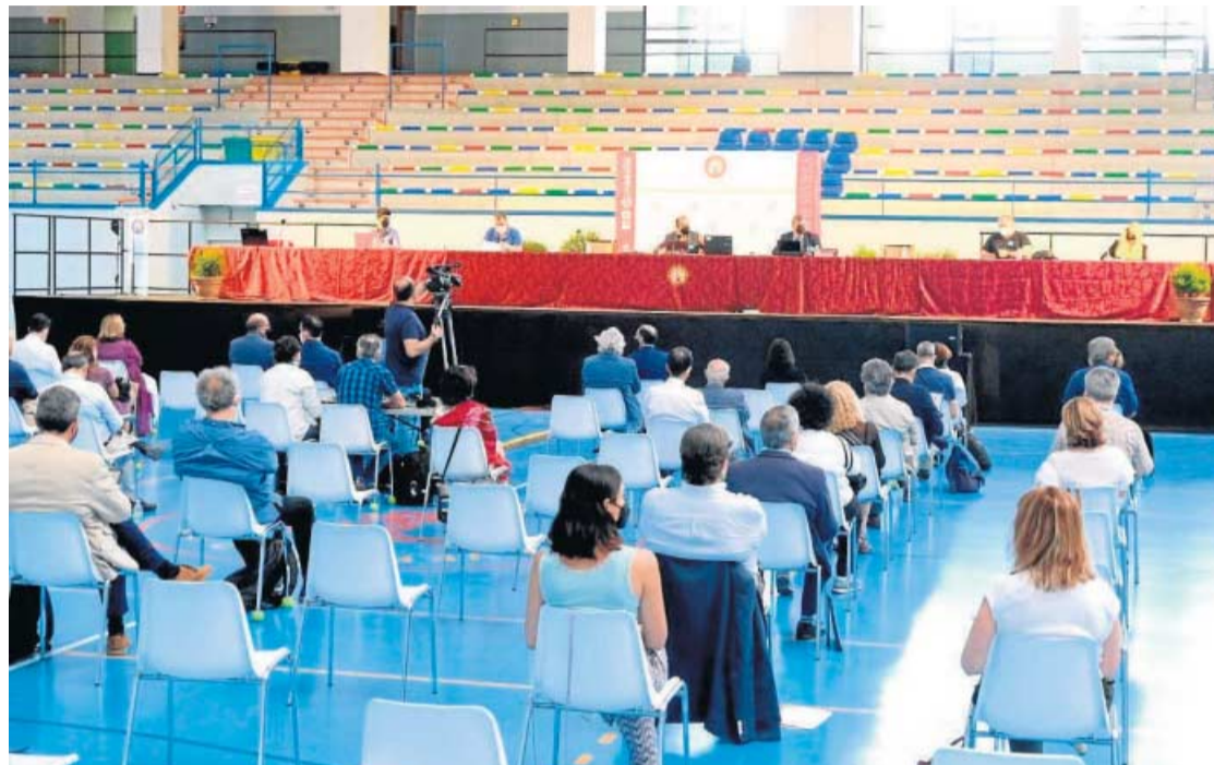
Claustro de la US, celebrado ayer en el Pabellón Deportivo de la Avenida Ramón y Cajal.

Pero los reproches no se quedaron ahí, sino que cuestionaron que el Ejecutivo autonómico sea transparente en la información sobre el proceso para la aprobación de la financiación. En este sentido, calificó de “falta de respeto y falsedad”