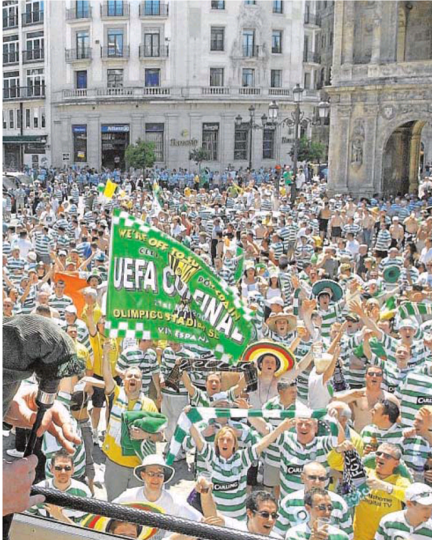
Los aficionados del Celtic antes de la final de 2003.