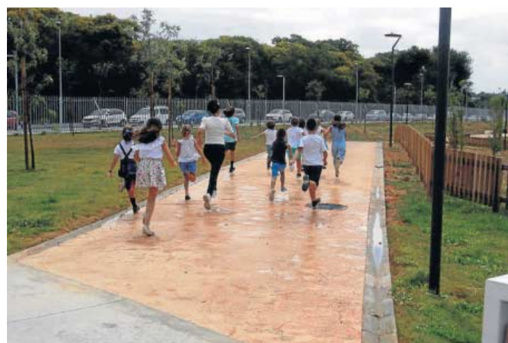
Niños corriendo en su interior tras la apertura.

● El Consistorio logra rematar una de las grandes apuestas del PGOU de 2003 y acabar con el histórico vacío del nuevo casco urbano ● La inversión ha sido de 5,2 millones de euros