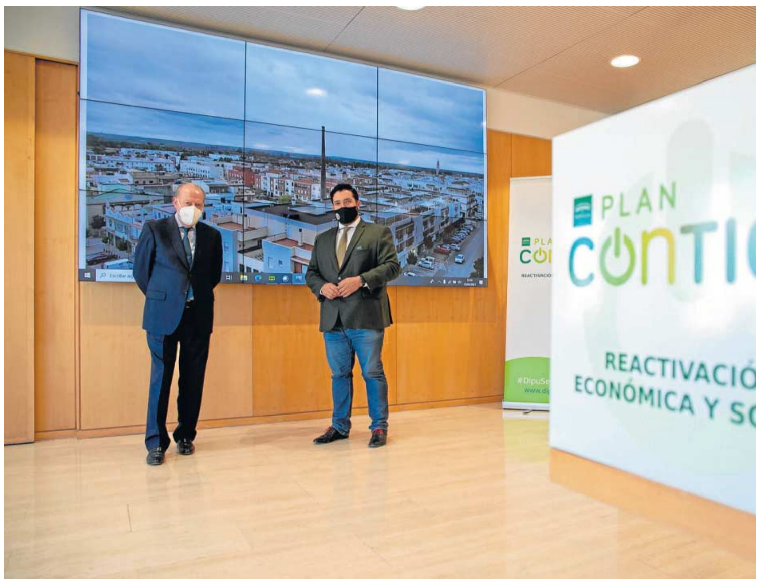
Reunión mantenida para hablar sobre los fondos provinciales en Lora del Río.

Según Enamorado, “ya lo hicimos con el anterior Plan Supera, con el que pusimos en valor una