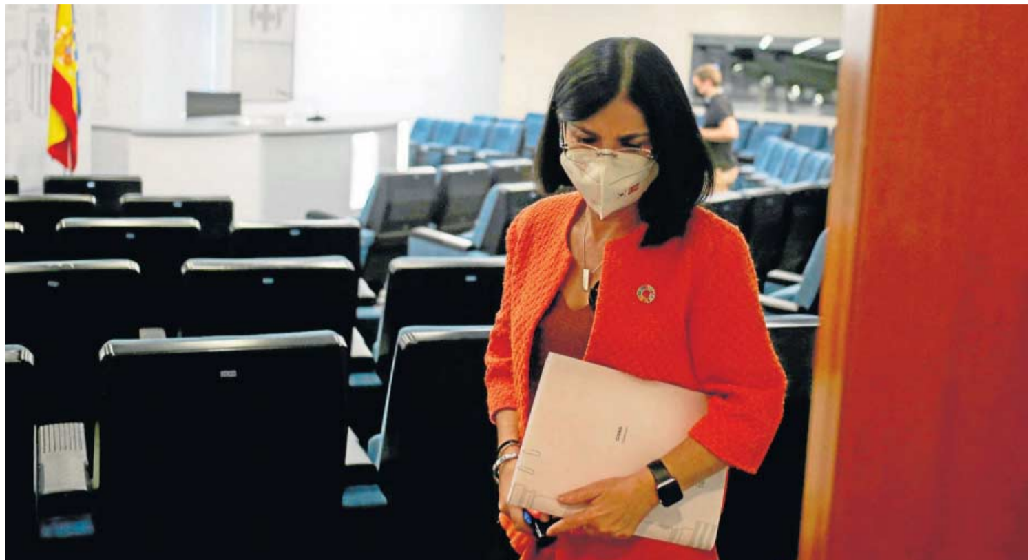
La ministra de Sanidad, Carolina Darias, a su salida de la rueda de prensa posterior a la reunión de ayer del Consejo Interterritorial de Salud.

LA BATALLA CONTRA EL CORONAVIRUS ▶ 3.832 nuevos contagios en las últimas 24 horas