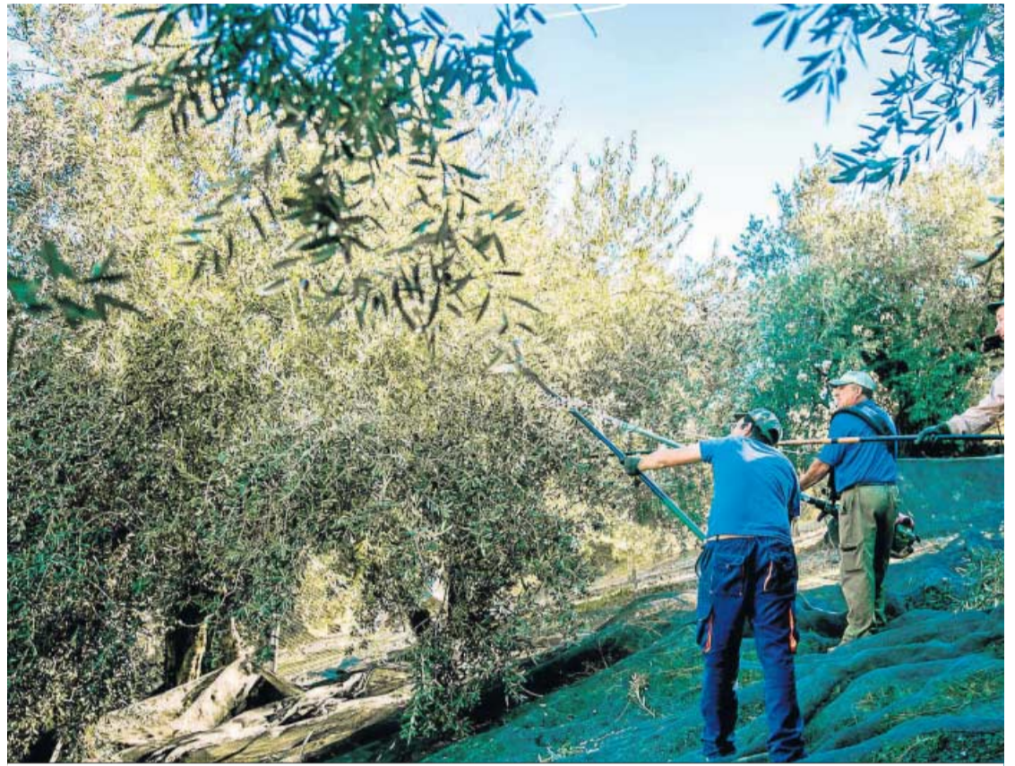
Recolección de la aceituna en Córdoba.

A partir de ese momento, la brecha entre ambos países se agrandó hasta que en 2019 España logró unas ventas récord de 146.000 toneladas frente a las