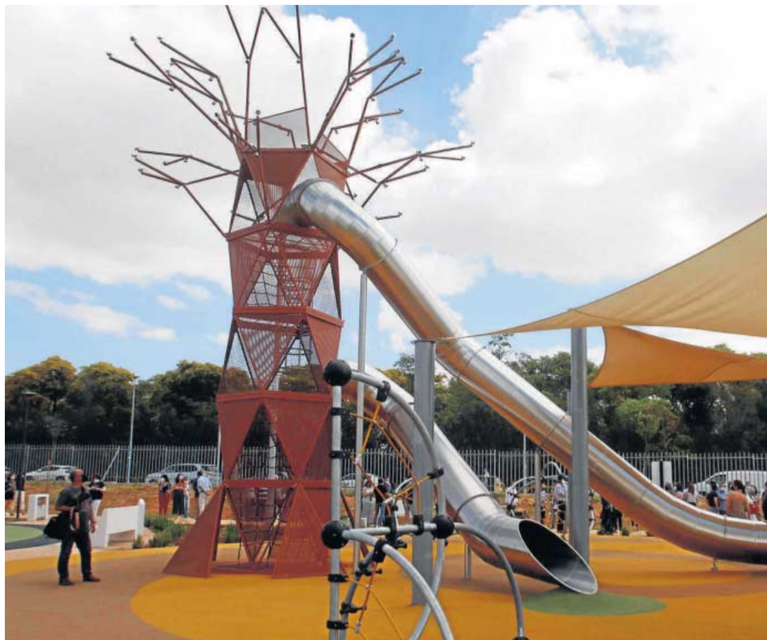
La zona de juegos en el nuevo Parque Central de Mairena del Aljarafe.