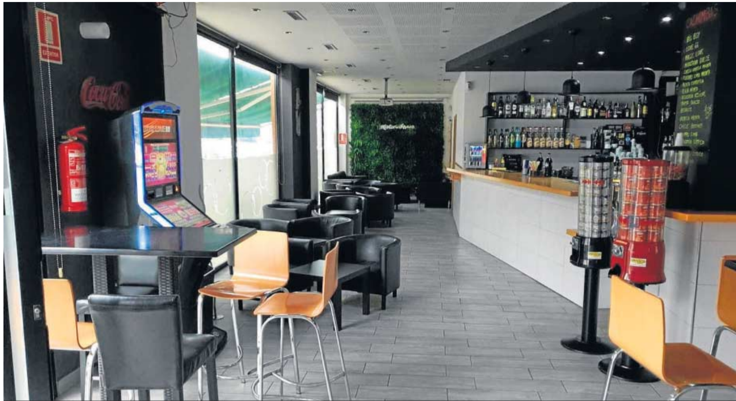
Un bar de copas sin clientela en las horas centrales del día cuando llegan las altas temperaturas.