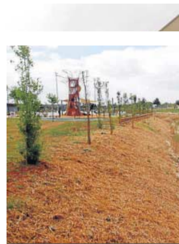
El cauce del arroyo Porzuna, en mitad del parque.

los colegios, le ayudaron a descubrir la placa conmemorativa.