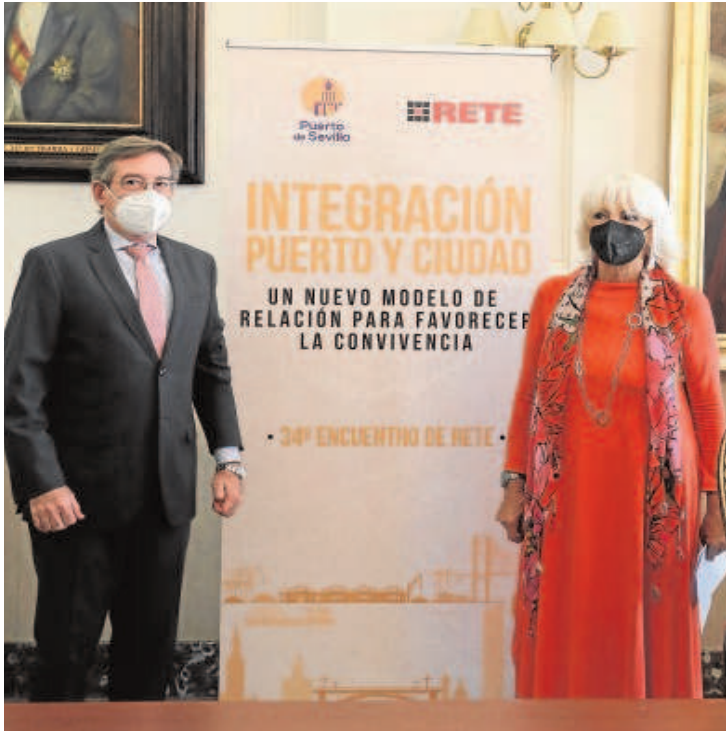
de RETE que se celebrará el 24 y el 25 de junio en Sevilla

desarrollo del proyecto, que es la antesala del futuro distrito urbano portuario. Rafael Carmona puntualizó que «esta parte queda fuera de los planes de integración puerto-ciudad, pero sí nos permite coser el muelle de Tablada al barrio con la nueva oferta de viviendas». A su parecer, la mejor manera de establecer esa transición hacia el casco urbano es con un núcleo de pisos que dé continuidad a los bloques de la calle Tarfia y Páez de Rivera.