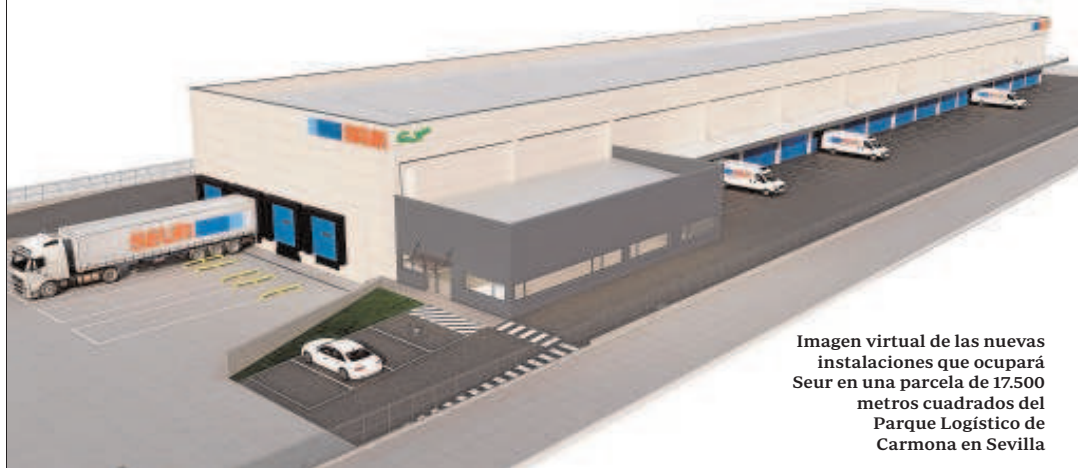
Imagen virtual de las nuevas instalaciones que ocupará Seur en una parcela de 17.500 metros cuadrados del Parque Logístico de Carmona en Sevilla

Este grupo empresarial de la familia Vila Company tiene presencia en el territorio nacional, con especial énfasis en la Comunidad Valenciana, Madrid y Andalucía. También realiza promociones en Marruecos acompañando a clientes que han necesitado crecer en África. Actualmente cuenta con más de 400.000 metros cuadrados promovidos, más de 100 clientes en activo, 250.000 m 2 bajo gestión actual y un valor del grupo de 200 millones de euros.