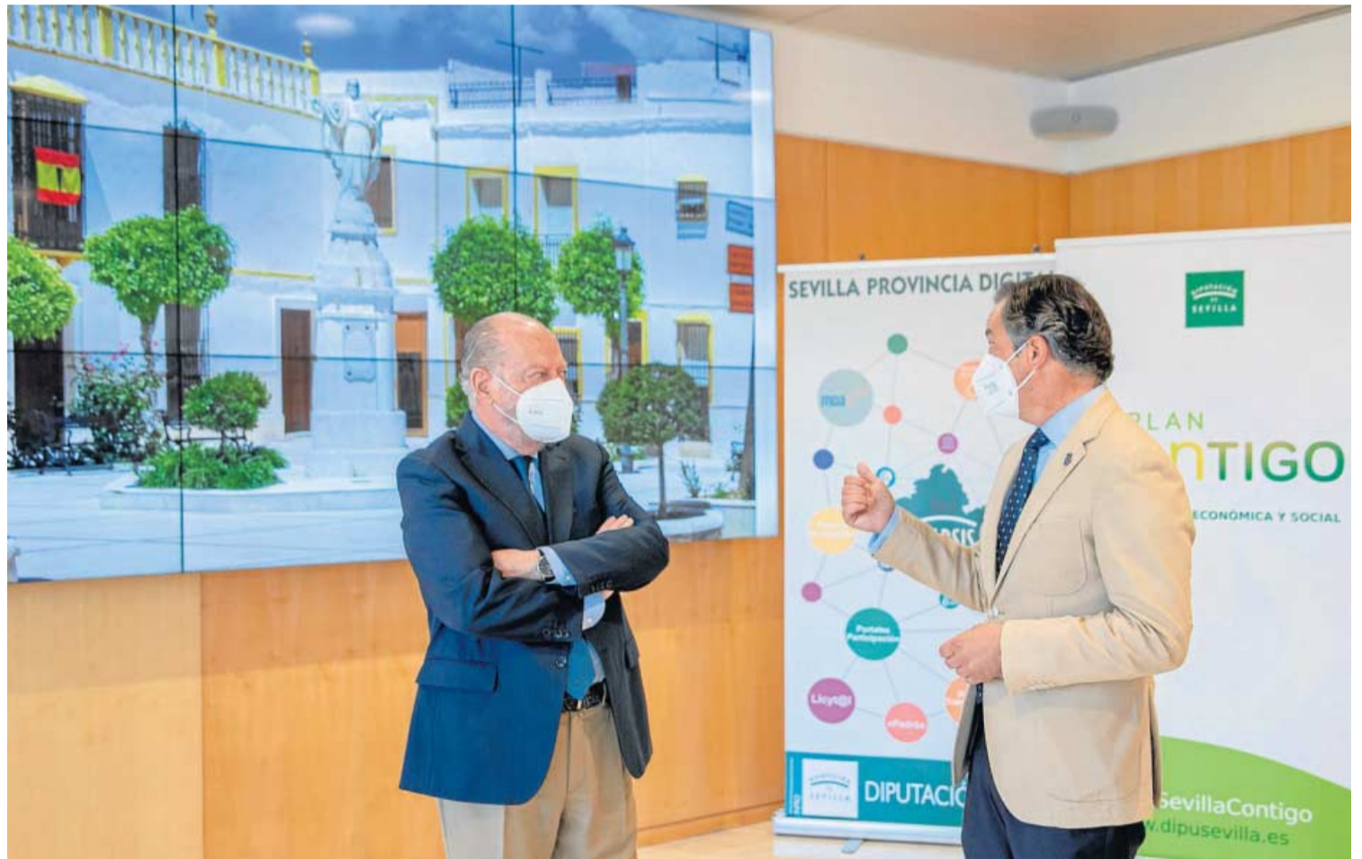
Reunión sobre los fondos provinciales en La Roda de Andalucía.

También “queremos adecuar la entrada del pueblo mediante un paseo a través de la calle Sevilla, lo que es la continuidad de ésta, porque una imagen vale más que mil palabras, y el pueblo a la entrada debe de estar bonito y adecentado para que los viajeros, que son muchos los que pasan todos los días por La Roda, se lleven una buena imagen de nuestro pueblo”. Así describió el alcalde los principales proyectos que el Ayuntamiento de La Roda de Andalucía pretende poner en marcha mediante las inversiones provinciales que, con el Plan Contigo ascienden a 1,09 millones de euros, aunque el presidente Villalobos le anunció que tras la liquidación del Presupuesto Provincial 2020, la cuantía para el Ayuntamiento se incrementa hasta más de 1,3 millones de euros.