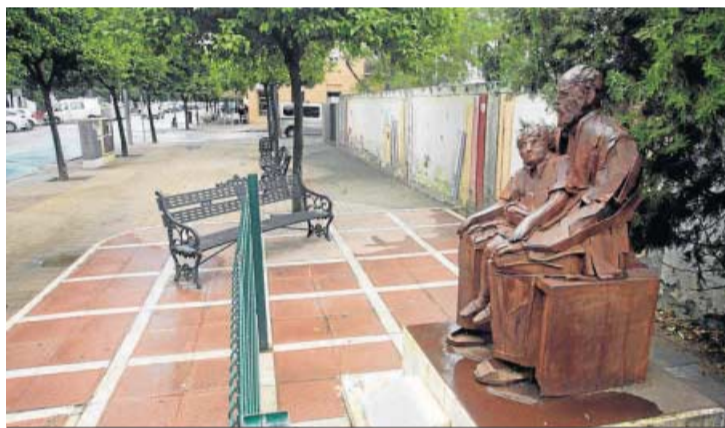
El monumento a los mayores en Almirante Topete.

vallado de un metro de altura de malla electrosoldada de doble torsión plastificada en poliéster.