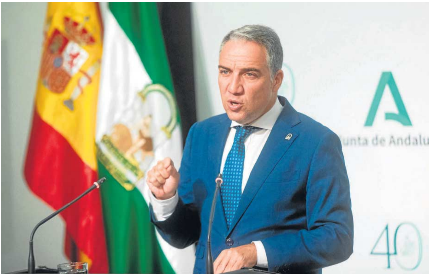
Elías Bendodo, portavoz del Gobierno andaluz, ayer en el Palacio de San Telmo.

● Bendodo augura una "lluvia de millones" hacia Cataluña mientras que calcula en 10.835 millones la deuda a Andalucía por el sistema de reparto de fondos vigente desde 2009