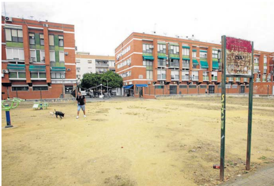
Aspecto actual de la Plaza Horacio Hermoso Araujo, en el Tiro de Línea.

El estado actual es deficiente. Como se recoge en la memoria, la solería perimetral presenta una gran cantidad de hundimientos y ondulaciones producidas por las raíces superficiales del arbolado existente. Dado que las dimensiones de la plaza permite aumentar el tamaño de los alcorques, uniéndolos entre sí, para así garantizar que el arbolado tenga suficiente espacio para no afectar a la solería perimetral, se ha hecho una nueva distribución de los mismos. Además se realizará la plantación de un naranjo en un alcorque que se encuentra vacío y aprovechando los parterres corridos se ejecutará una serie de tramos de acerado con una inclinación suficiente para permitir salvar los distintos desniveles existentes en la plaza. De este modo se resuelven los problemas de accesibilidad que existen actualmente. Estos parterres se delimitan perimetralmente con un