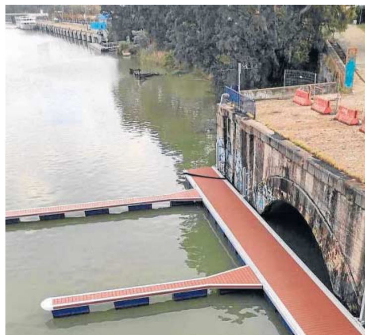
El pantalané instalado en el Muelle de Tablada.

El Puerto también ha dado luz verde a dos concesiones administrativas para promover el turismo fluvial y el transporte de pasajeros entre los municipios ribereños. Una es a favor del Ayuntamiento de Coria del Río para la ocupación de la lámina de agua con la ampliación de un pantalané en el Paseo Carlos de Mesa, destinado al atraque de embarcaciones de recreo, y para el embarque y desembarque de pasajeros. Otra para un pantalané y una rampa ya ejecutadas en la zona de La Barqueta, dentro del término municipal de La Puebla del Río.