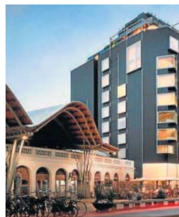
Hotel Barcelona Edition.

El modelo de negocio de la compañía no pasa por esperar a la revalorización de los inmuebles, sino que busca incrementar su valor mediante su rehabilitación y, en la mayoría de los casos, cambiando su uso. Y está especializado en desarrollar especialmente hoteles y alojamientos de lujo en zonas con-