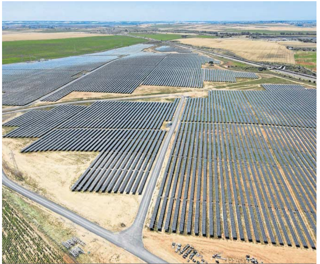
Planta fotovoltaica Huelva 2021, con 113.686 paneles solares y ya operativa.

Por otro lado, la directora de Google para España y Portugal, Fuencisla Clemares, aseguró que en su empresa están "encantados" de que las negociaciones para la reforma de la fiscalidad global avance y esperan que pueda llegarse a un acuerdo para el sistema "para hacerlo más transparente, homogéneo y eficaz entre países".