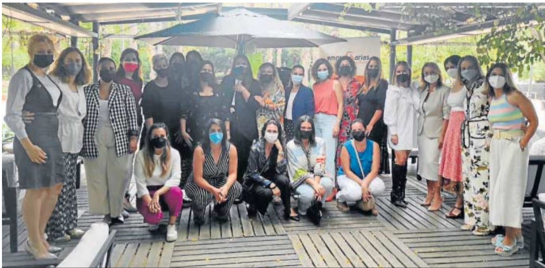
ASOCIACIÓN EMPRESARIAS SEVILLANAS

Foto de familia del primer 'networking' presencial de las Empresarias Sevillanas.