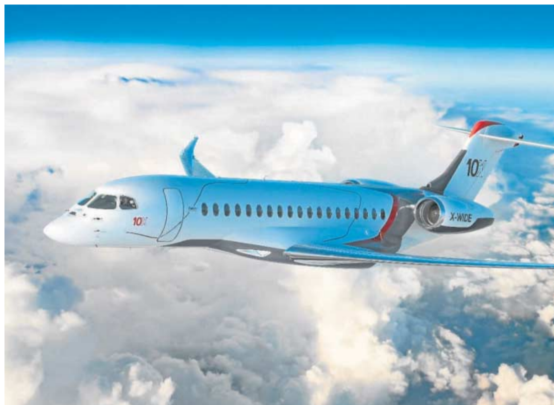
Falcon 10x de Dassault, en cuya fabricación participará la planta de Airbus en El Puerto.

● La producción arrancará en marzo de 2022 y en ella participarán las factorías de Tablada, El Puerto y en menor medida San Pablo