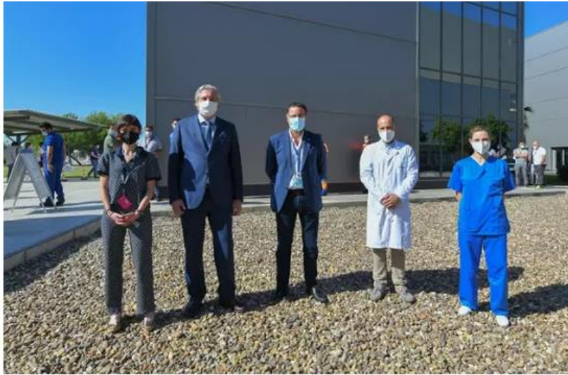
Visita a San Pablo con motivo de las vacunaciones - SERGIO FLORES SEVILLA, 22 Jun. (EUROPA PRESS) -

Un total de 180 trabajadores del Consorcio Aeronáutico Airbus han sido vacunados este martes contra el Covid-19 con la participación de profesionales del SAS y de los servicios médicos de la empresa, gracias al 'Plan Sumamos. Salud + Economía', según la Confederación de Empresarios de Sevilla (CES).