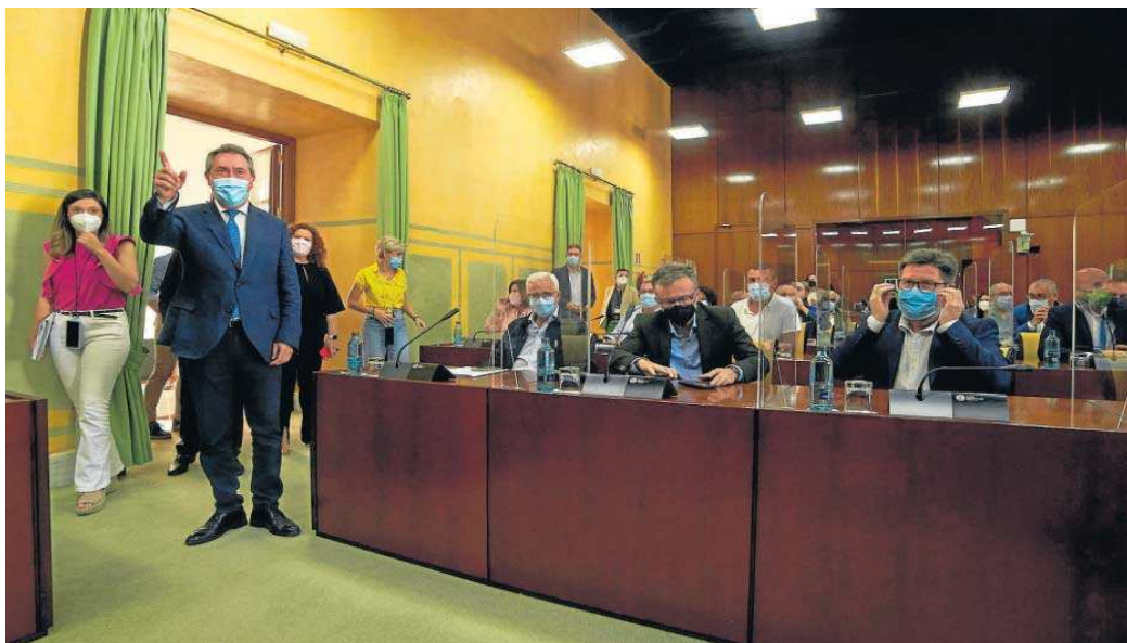
Espadas, a su llegada ayer a la reunión del grupo parlamentario socialista.