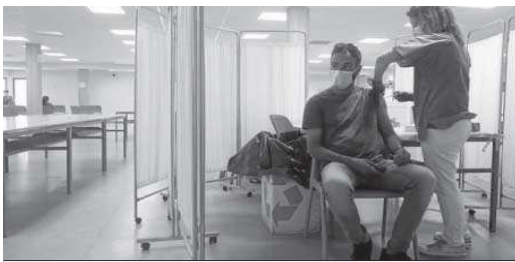
El proceso de vacunación tiene como uno de sus escenarios la Facultad de Derecho.

positiva que se une al avance de la campaña de vacunación. En Sevilla se han administrado 1.537.286 dosis (27.278 más en un día), haciendo que 981.434 habitantes ya hayan recibido una de ellas y 594.145 individuos la pauta completa (13.161 más). Esta cifra permite afirmar que aproximadamente uno de cada tres sevillanos (31,5%) ya está vacunado contra el Covid-19. Un porcentaje que aumenta si sólo se tienen en cuenta los mayores de 30 años, alcanzando el 37,7%.