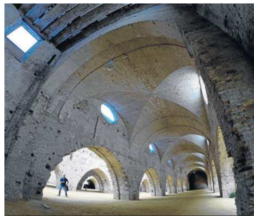
Las Atarazanas Reales de Sevilla.

Desde la Junta de Andalucía se afanan en recalcar que el año 2021 será el del inicio de las obras de las Atarazanas, aunque no concretan cuándo pueden arrancar.