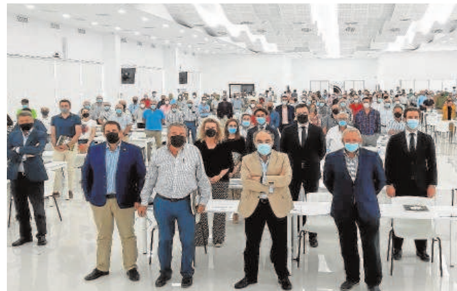
Dcoop celebró ayer su asamblea anual en su sede de Antequera

La cooperativa destaca que la pandemia no ha frenado su estrategia empresarial. Así, en 2020 comenzó a operar plenamente la planta sevillana de procesado de aceitunas de Dos Hermanas, que, junto a la de Monturque (Córdoba), atendieron la demanda de envasado de la sección de aceituna de mesa.