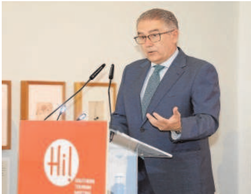
El secretario general de Turismo, Manuel Muñoz, clausuró el foro turístico

En estas instalaciones se han impartido más de 300 cursos en los que han participado unas 4.000 pymes de la región, también se ha dado apoyo a empresas europeas del sector «que han captado talento de nuestra tierra en este centro», dijo durante su intervención. El siguiente reto de su departamento será la elaboración del futuro marco estratégico en el que la tecnología tendrá un espacio relevante, avanzó el responsable regional. En este sentido, consideró que «sin innovación no hay futuro», especialmente en este momento en el que el destino afronta la etapa de recuperación.