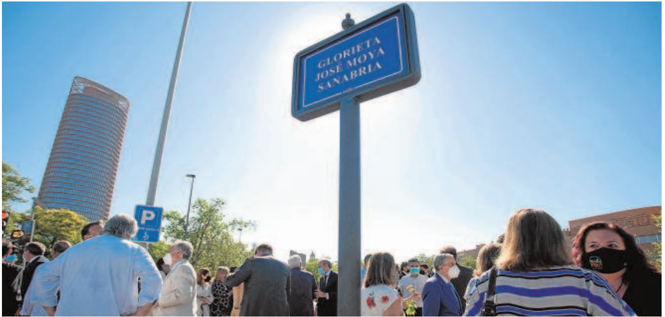
Panorámica de la nueva glorieta José Moya Sanabria, con la Torre Sevilla al fondo

Distribuido para CONFEDERACIÓN DE EMPRESARIOS DE SEVILLA * Este artículo no puede distribuirse sin el consentimiento expreso del dueño de los derechos de autor.