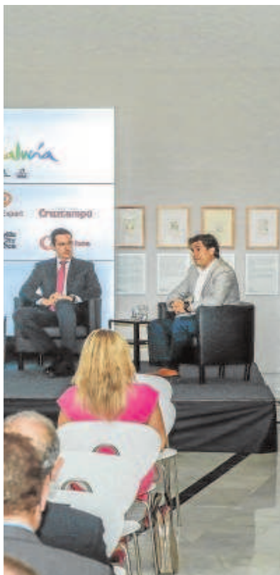
del Salto