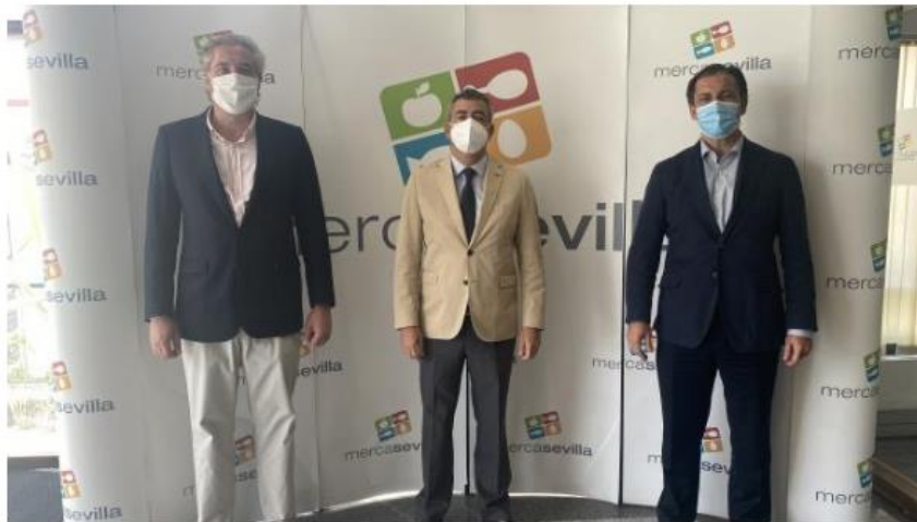
Mercasevilla vacuna a sus trabajadores gracias al 'Plan Sumamos' impulsado por la CES 20M

Esta iniciativa la lleva a cabo la patronal sevillana de la mano de las consejerías de Salud y Familias y Empleo, Formación y Trabajo Autónomo de la Junta de Andalucía y la Confederación de Empresarios de Andalucía (CEA), destaca la CES en una nota de prensa.