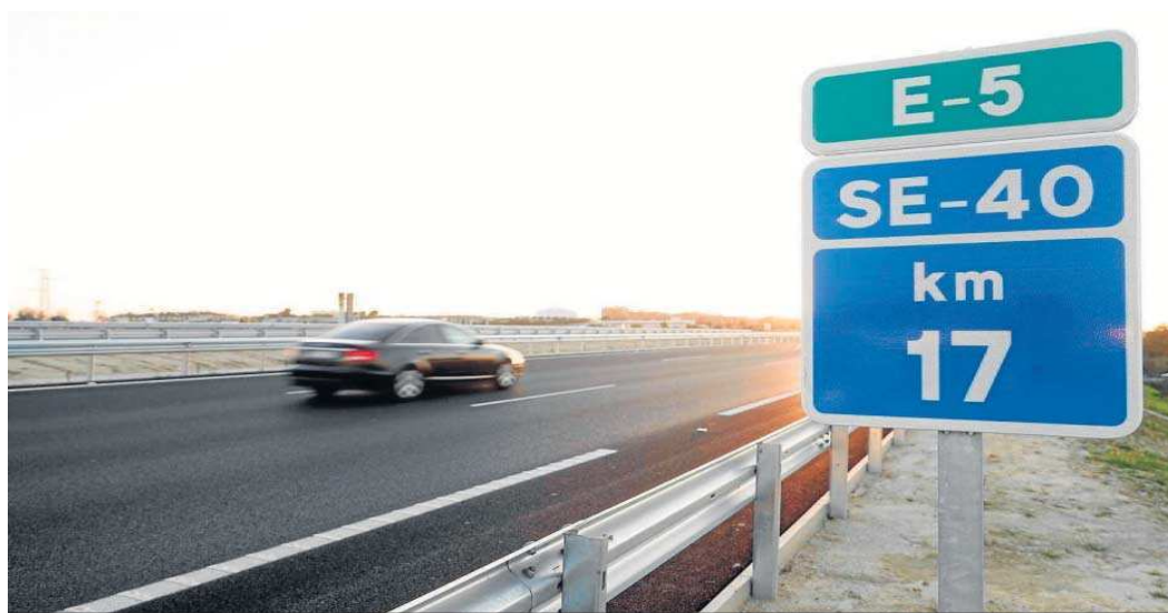
Uno de los tramos ya abiertos de la SE-40.

● El documento técnico debe definir cuál es la mejor manera para salvar el paso por el cauce vivo del río Guadalquivir