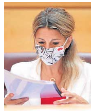
Yolanda Díaz, en el Congreso.

del mes de junio, adelantó que "los datos van a ser muy positivos", después de que en los últimos cinco meses "un millón de personas" se hayan incorporado al empleo. Díaz informó de que la intensificación de la labor inspectora ha permitido convertir 155.905 contratos temporales irregulares en indefinidos.