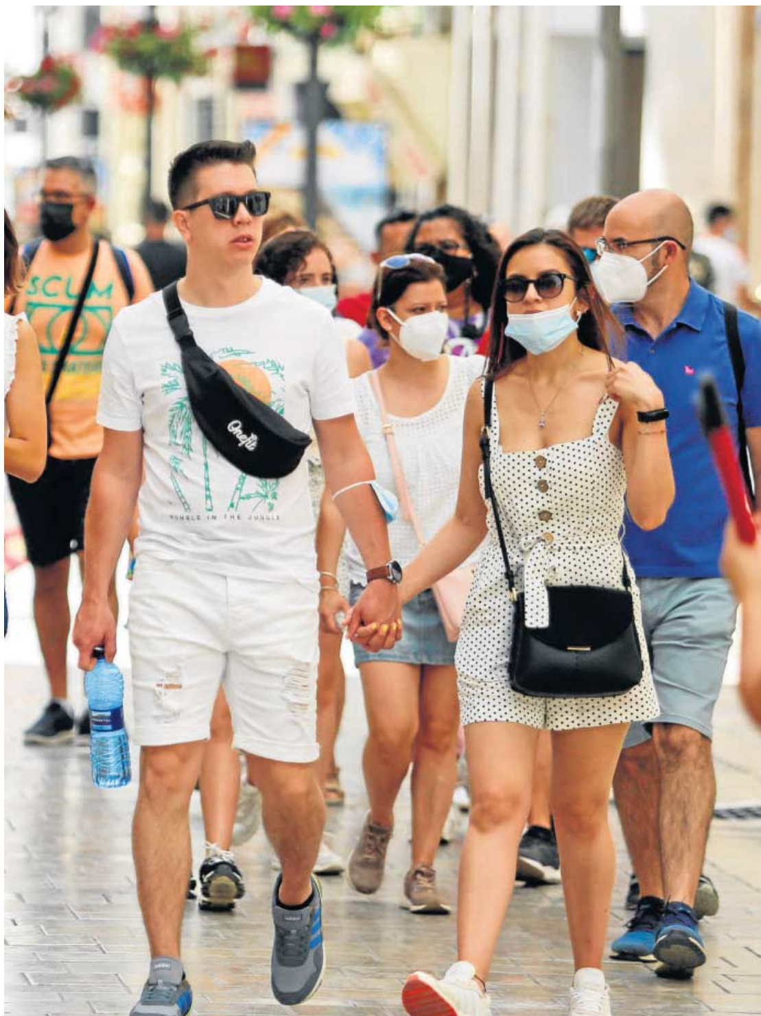
Personas paseando ayer por la calle Larios de Málaga.

por 100.000 habitantes desde hace 10 días y los ingresos caen de forma sostenida desde hace semanas, la Junta ha vuelto a retrasar el examen. El portavoz del Gobierno autonómico fijó hace unos días la cota que debe alcanzarse para que se levanten algunas restricciones y ayer el consejero de Salud, Jesús Aguirre, reiteró en un acto en Huelva la misma idea. "Había una serie de variables importantísimas como que la incidencia acumulada fuera menos de 150; el número de hospitalizados se situará por debajo de 500 en el conjunto de la comunidad y se vacunara a más de 700.000 personas a la semana". En este punto, recordó que en incidencia, a día de hoy, la región está aún en 164 casos por 100.000 habitantes y en lo que respecta a hospitalizados se está en 534, por lo que no se ha alcanzado la cifra deseada; únicamente se cumple el tercer parámetro ya que sí que se ha superado el número de 700.000 vacunados a la semana.