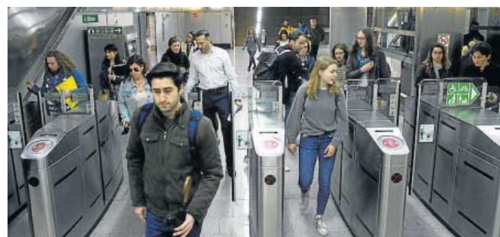
Viajeros saliendo de una estación de la línea 1 del Metro.

cremento del uso de la bicicleta para acceder al Metro (2,6% de usuarios) y por primera vez aparece el uso del patinete eléctrico con un 1,4% de los usuarios.