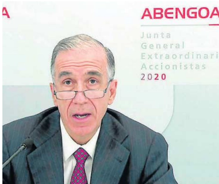
Gonzalo Urquijo, ex presidente de Abengoa, el día que fue destituido.

Dichas diligencias se trasladaron a la Fiscalía Provincial de Sevilla, dado que Abengoa tiene su domicilio social en la capital hispalense. “La denuncia versa sobre una serie de hechos que detalla a lo largo de su texto y que a grosso modo viene a poner de manifiesto una serie de acuerdos y decisiones