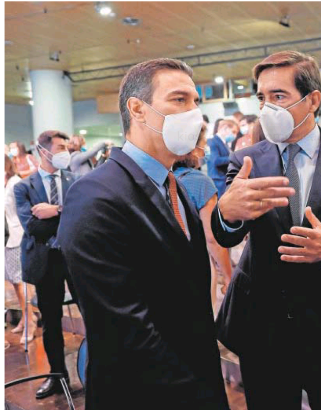
Pedro Sánchez, Carlos Torres (BBVA) y José Luis Escrivá

El espíritu de la reforma es alinear la edad ordinaria y la efectiva de jubilación con incentivos a la ampliación de la vida laboral de los españoles con el objetivo de aumentar la participación de los mayores en el mercado de trabajo. Los redactores de la norma esperan que con sus medidas en 2050 la edad real aumente en dos puntos, des-