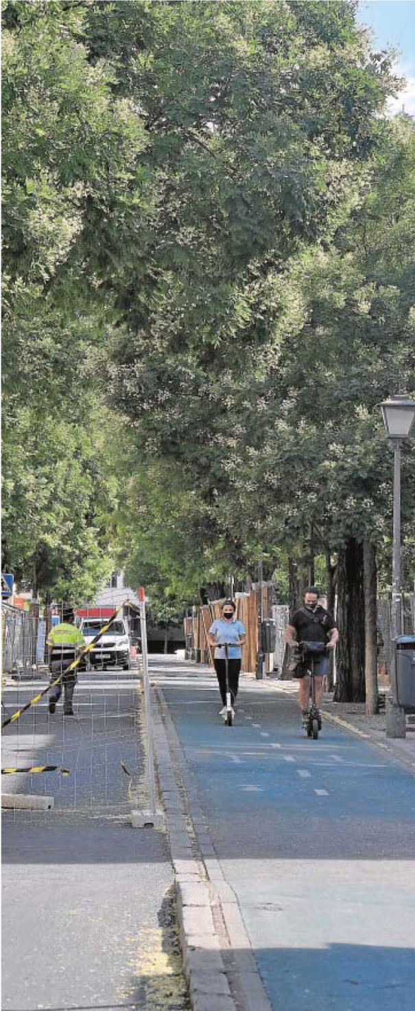
la Cruz Roja ya han comenzado en el distrito Macarena