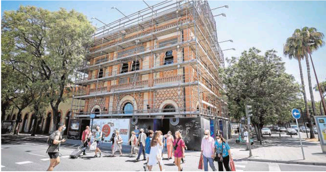
Ya están retirando los andamios de la fachada de Plaza de Armas tras su rehabilitación