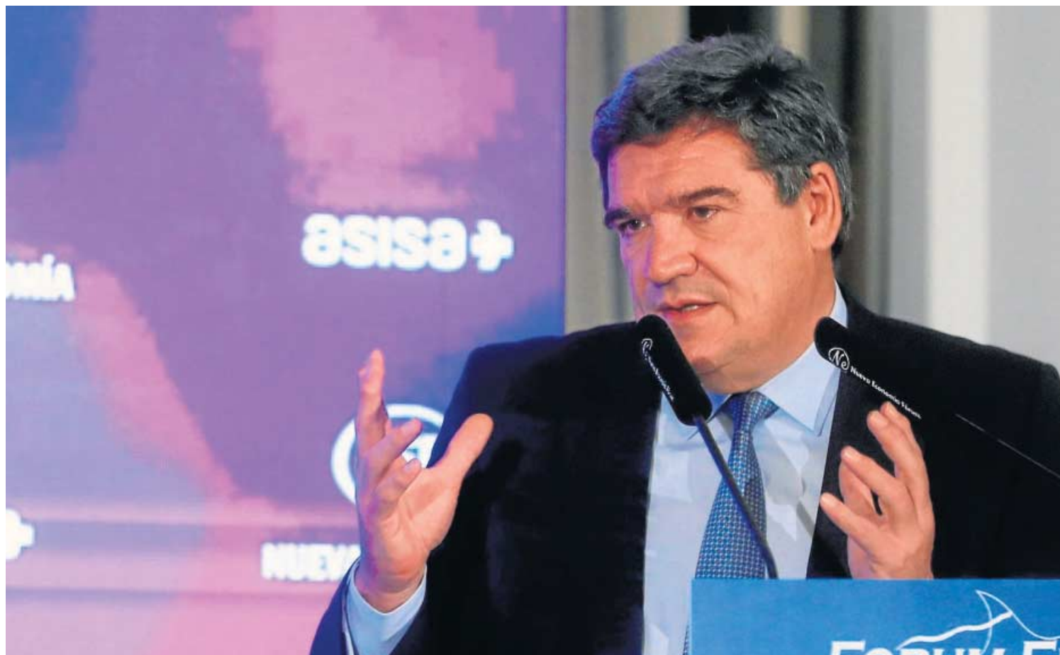
El ministro José Luis Escrivá, titular de Inclusión y Seguridad Social, en un acto público en Madrid, ayer.

En un comunicado conjunto, los sindicatos destacaron que la reforma supone la inclusión del compromiso del Estado como "garante" público del sistema de pensiones, incluyéndose en la Ley General de Seguridad Social una cláusula mediante la que anualmente se realizará una transferencia a través de los Presupuestos Generales del Estado por un 2% del PIB, alrede-