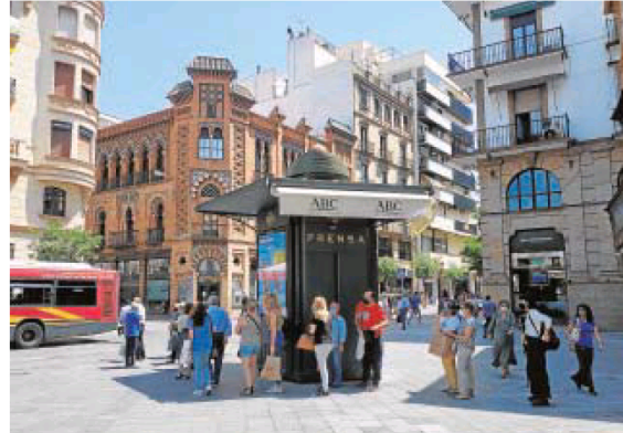
Ciudadanos esperan el autobús buscando la sombra en la Campana