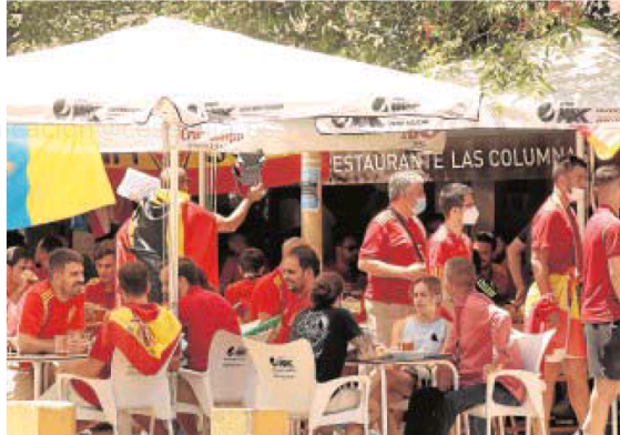
Aficionados españoles en la Alameda de Hércules

Junto con el impacto directo en los negocios de la ciudad, que el Ayuntamiento cuantificó en cincuenta millones en sus previsiones, está la potente promoción que ha supuesto con la difusión de imágenes de la ciudad en distintos horarios que se han podido ver en más de una veintena de países.