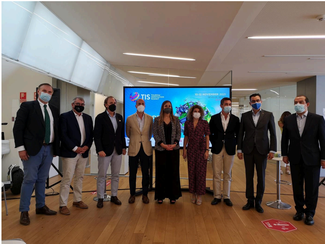
La reunión del consejo asesor del TIS.