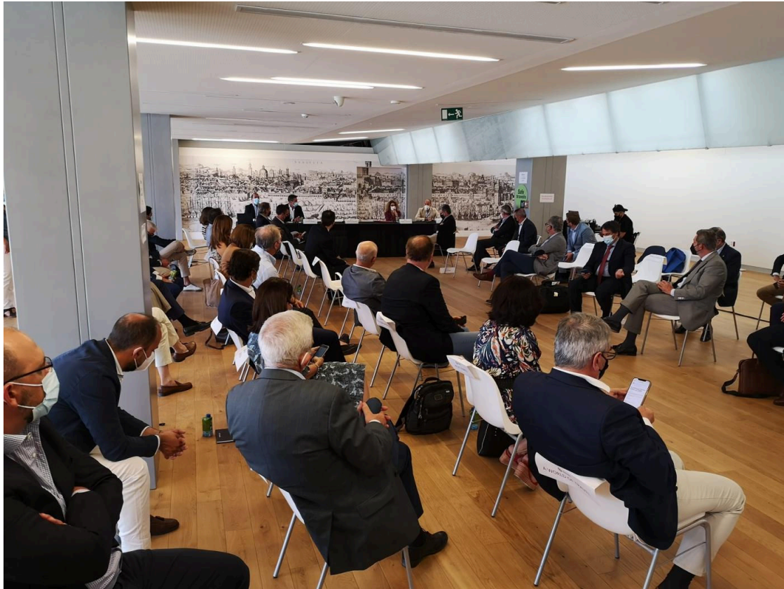
La reunión del consejo asesor del TIS.