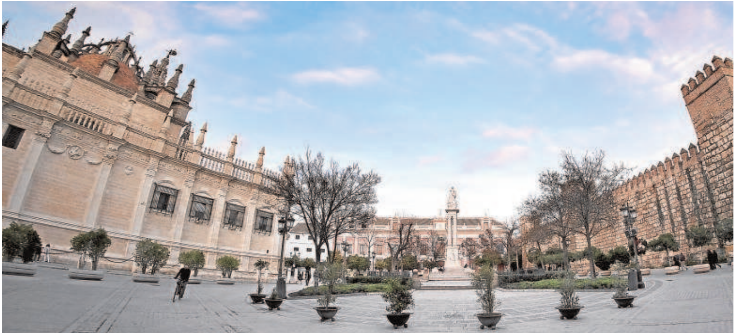
La Catedral y el Real Alcázar de Sevilla pasarían a depender de un patronato cuya mayoría de votos la ostentaría el Ministerio de Cultura, y no el propietario