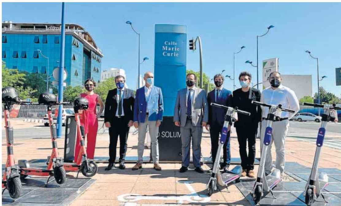
Presentación del lanzamiento del proyecto piloto de patinetes eléctricos en la Isla de la Cartuja.