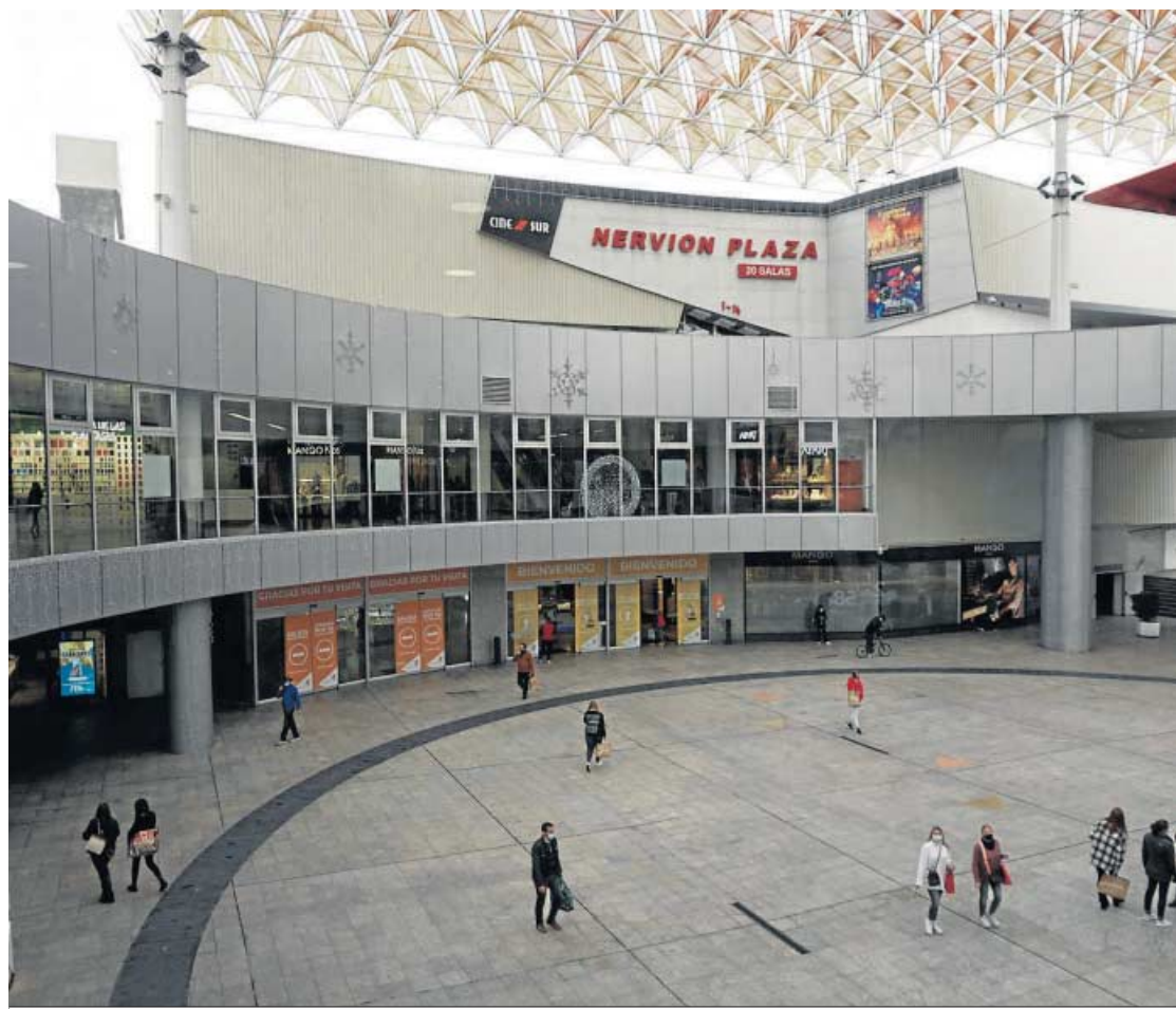
Aspecto de la entrada del cine de Nervión Plaza, antes del comienzo de las obras de reforma.

–Primero quiero matizar que, exceptuando algún sector de la población, no ha habido temor a ir al cine, lo que ha habido es falta de producto y unas restricciones asimétricas por comunidades que han roto el mercado único de los