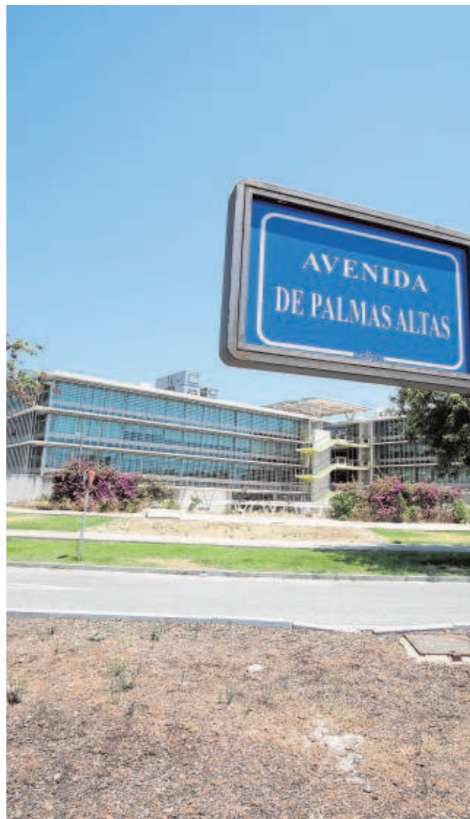
El futuro de Palmas Altas sigue en el aire // RAÚL DOBLADO

La decisión que adopte el consejo de administración de Campus Tecno-