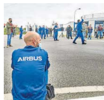
Concentración de Airbus.

avance en las negociaciones, las complican más si cabe”. Estas decisiones son el “no abono” de una parte de los beneficios, en concreto, el concepto ‘Premio Covid’ a los trabajadores de las ETT y al personal en situación de jubilación parcial. Sobre el ERTE que ayer finalizó, la representación de los operarios lamentó que la empresa vaya a “regalar” días libres a los trabajadores afectados por el ERTE, a la espera de que se pueda cerrar un acuerdo, sin que