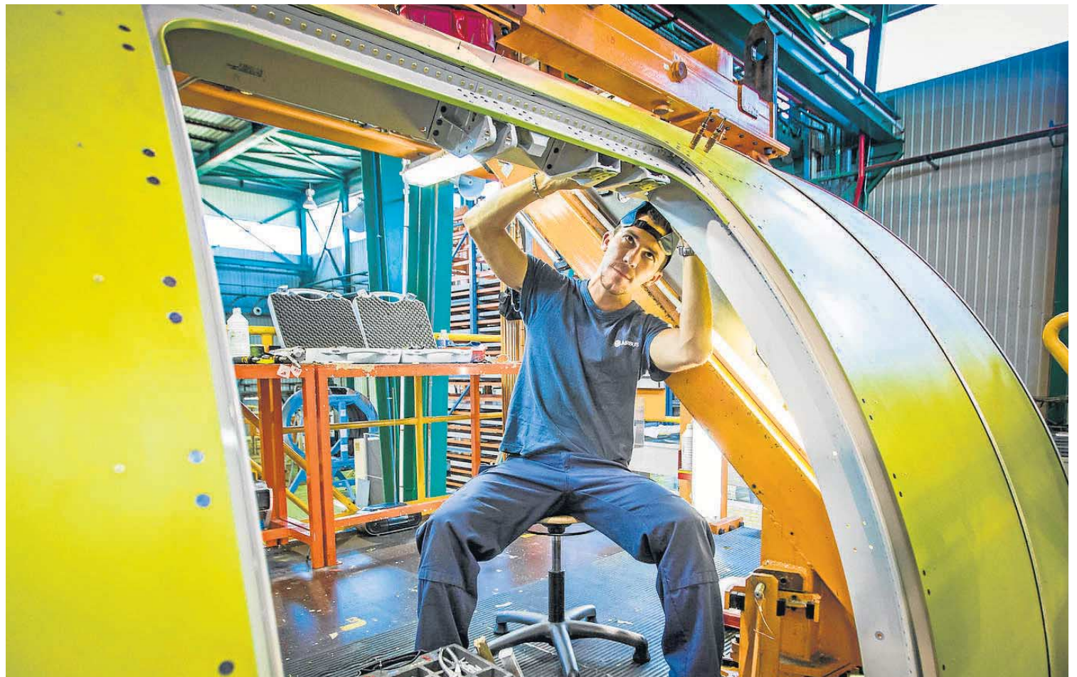
Un operario del CBC trabaja en una de las piezas para Boeing.

La empresa estadounidense anunció en diciembre de 2019 que suspendería la producción de su avión estrella a partir de enero de 2020, después de que varias administraciones, entre ellas la de Estados Unidos, le prohibiera volar a raíz de dos accidentes aéreos mortales de gran magnitud en octubre de 2018 y marzo de 2019, producidos por