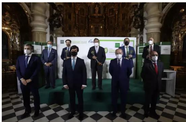
Imagen de archivo del Premio de Responsabilidad Social Empresarial

La Confederación de Empresarios de Sevilla (CES), en colaboración con la Diputación de Sevilla, a través de Prodetur, y Endesa convocan el Premio de Responsabilidad Social Empresarial para este año 2021. En un comunicado conjunto, la Diputación y la CES informan de que, con un plazo de presentación de solicitudes hasta el próximo 30 de septiembre, las candidaturas pueden presentarse en la página oficial del premio ' www.premio-rse.es ', en la que se hallan publicadas las bases de la convocatoria. Con la institución de este premio, que cumple en esta nueva convocatoria su novena edición, la CES, Prodetur y Endesa pretenden reconocer públicamente las mejores iniciativas y buenas prácticas en Responsabilidad Social y Sostenibilidad de las empresas sevillanas, en dos modalidades distintas: para las pymes y para grandes empresas.