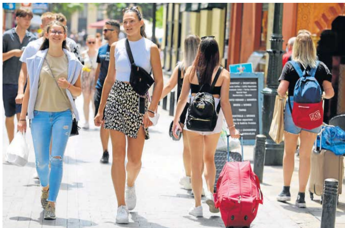
Un grupo de turistas, ayer en el centro de Málaga.