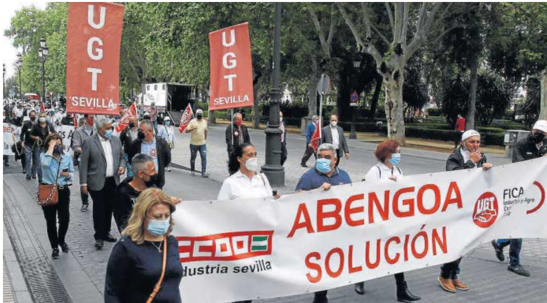
Manifestación de trabajadores de Abengoa en defensa de su empleo.

Esta versión ha frustrado las expectativas de la plantilla de cobrar