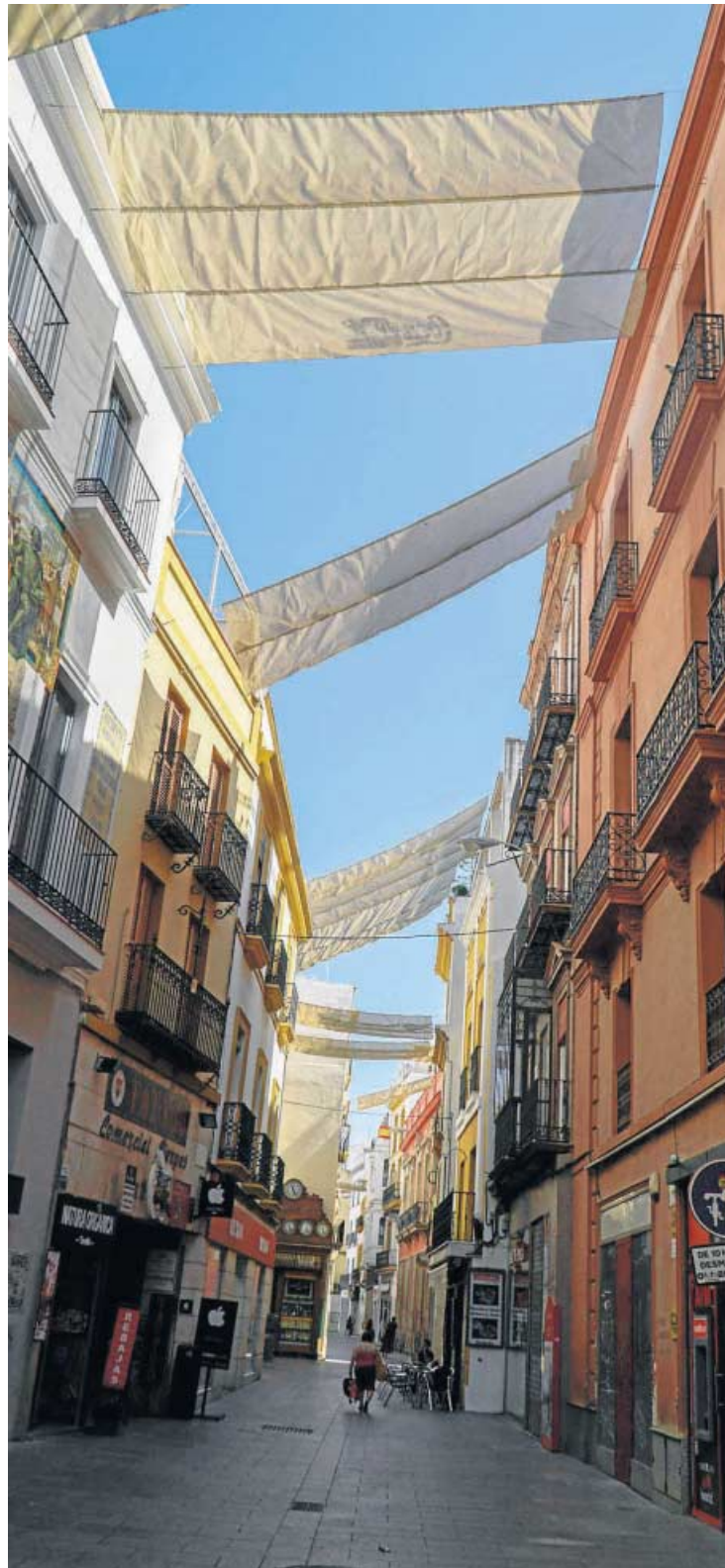
Los toldos colocados el año pasado en la calle Sierpes.

Pimentel explicó que la formalización del contrato entre el Ayuntamiento y la adjudicataria tuvo lugar el pasado día 31 de mayo y que en el pliego del mismo se incluyen unos plazos de ejecución que “nos hacen pensar que, salvo que la empresa haga un esfuerzo ímprobo para el adelanto de las fechas previstas, el inicio del montaje