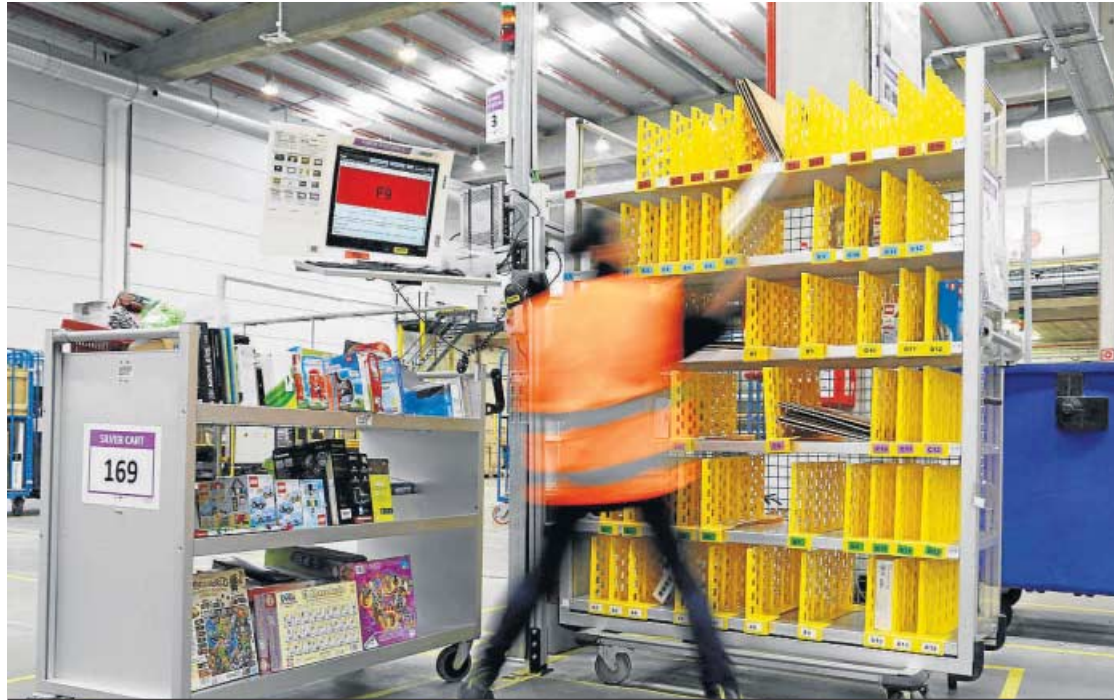
JOSÉ RAMÓN LADRA