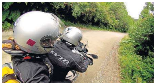
Las rutas pueden consultarse a través de la página web www.turismosevilla.org .

lómetro que recorremos en la vida y siente esa conexión especial con su moto, esa sensación de libertad que es la conexión que acompaña al compañerismo y solidaridad que hay entre este gremio, da igual la categoría o tipo de moto que lleves; siempre está ahí ese compañerismo y amistad que comparten miles de moteros que han hecho de las dos ruedas su estilo de vida. Moto y naturaleza van unidos. ¿La mo-