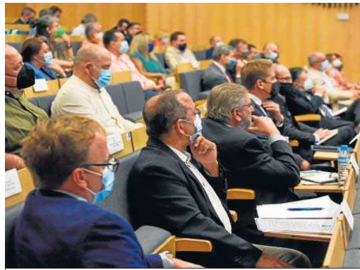
Un momento del encuentro en la Escuela Politécnica de Algeciras, ayer.

La Comisión Europea (CE) quiere que a partir de 2035 no se puedan vender coches contaminantes en la Unión Europea y apuesta por el motor eléctrico para sacar el CO2 de las carreteras, pero no descarta que llegada esa fecha también puedan circular vehículos de pasajeros impulsados por hidrógeno ver-