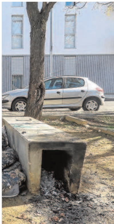
millones // R. DOBLADO