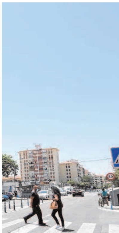
cimentación // ABC