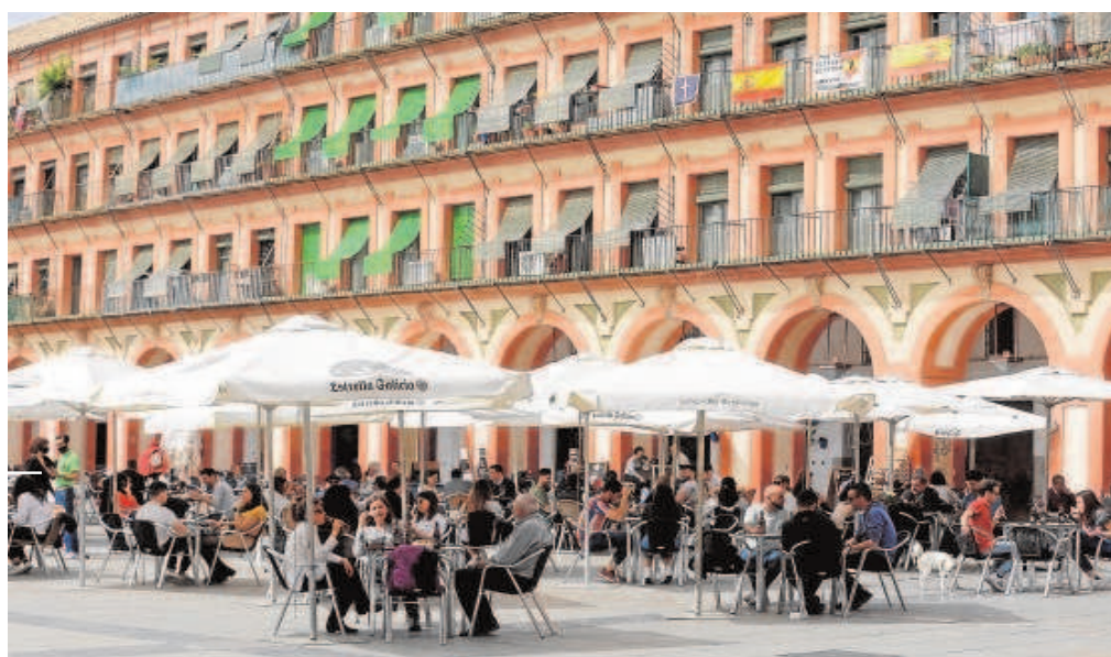
Veladores de los bares de una plaza de Córdoba con clientes consumiendo

En cuanto al empleo, el número de ocupados crecería en 2022 entre el 2,1% y el 2,7%, situándose la tasa de paro entre el 22,0%, en el escenario base, y el 22,6% en la peor situación.