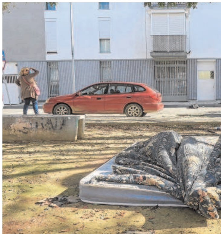
La barriada Nazaret, en Los Pajaritos, es la más degradada y en ella se invertirán 4,8

La consejera, por su parte, informó de que este programa «histórico» seguirá el modelo ya aplicado en la barriada de Santa Adela, en Granada, y que tiene otras dos en marcha en Jerez de la Frontera y en Chiclana. Ahora, esta tercera convocatoria va dirigida a las