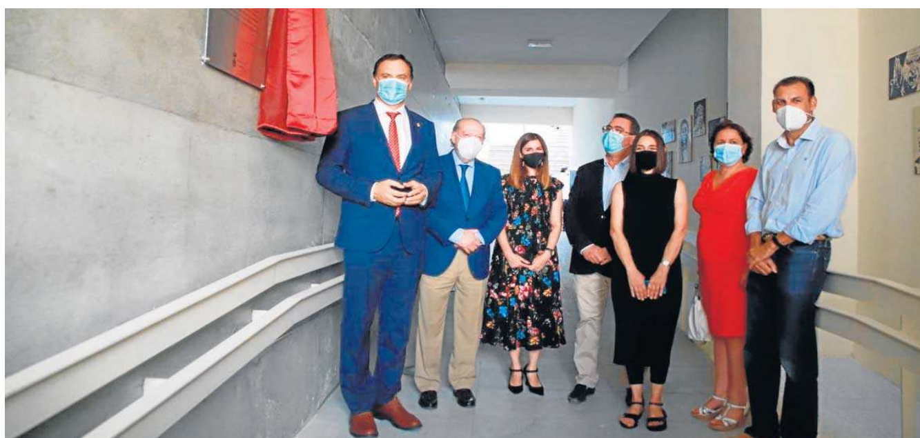
Inauguración del Centro del Flamenco de Lebrija.

La localidad sevillana de Lebrija cuenta con un nuevo recurso cultural, que amplía la oferta patrimonial de la ciudad. Se trata del Centro del Flamenco de Lebrija, que nace como un espacio destinado a la protección y divulgación del cante jondo, fuertemente arraigado en este municipio gracias a la destacada presencia de familias flamencas. Su objetivo: acercar al visitante el rico patrimonio inmaterial que representa el flamenco en esta tierra. Además, alberga una nueva y moderna Oficina de Turismo.