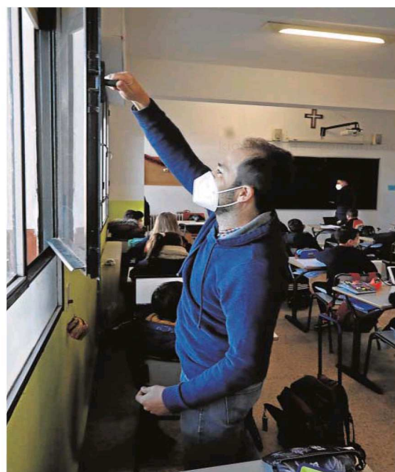
Un profesor da clase en el aula de un colegio concertado de Córdoba.

depende de la Junta de Andalucía. A éste no como autoridad sino como personal de especial protección. «Aviso a navegantes» Este profesional considera que la ley será «un aviso a navegantes» y relata, como su compañera de Primaria, otros casos en los que él o sus compañeros no se han sentido bien defendidos. Por ejemplo, cuando algún progenitor, después de un conflicto en un aula, decide denunciar al profesor. «En la mayoría de los casos, cuando llega el juicio, los padres ni se presentan, pero tampoco se toma ninguna medida contra ellos, después de lo mal que lo ha pasado el profesor». Espera, también, que con la nueva normativa sea más fácil atajar determinadas conductas de nuevo curso relacionadas con las redes sociales y los teléfonos móviles. «La moda es ahora la de los retos: hacer cualquier tontería en clase que otro graba y sube a la red. Y encontramos muchas dificultades para sancionarlos». Andalucía no será pionera en dictar una ley de este calibre. Madrid y Asturias ya la tienen. Pero si es la pri-