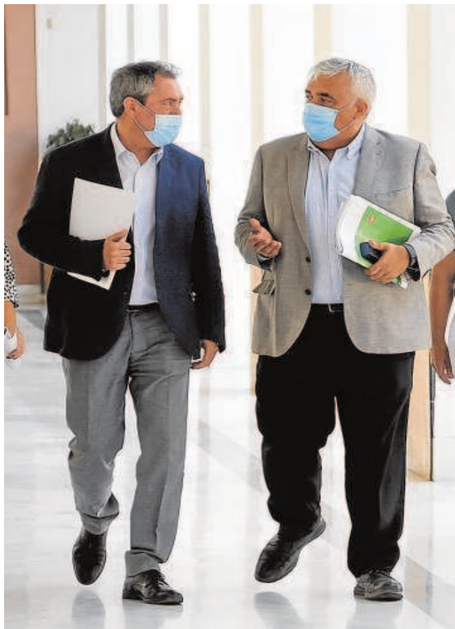
Juan Espadas y Ramírez de Arellano ayer en el Parlamento

Su modelo fiscal pasa por devolver a Andalucía a la situación fiscal que se encontraba en el año 2018, cuando gobernaba el PSOE, «con una reducción fiscal del Impuesto de Sucesiones para los herederos hasta un mi-