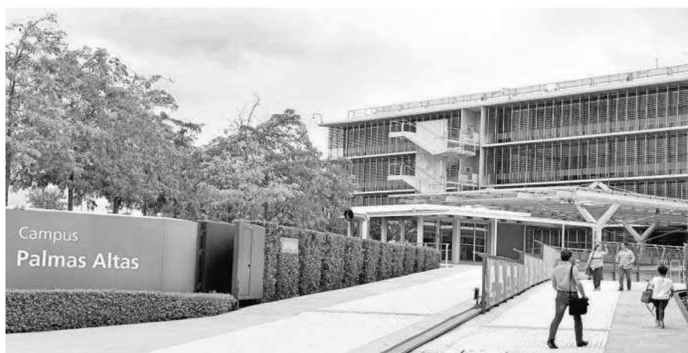
Sede social de Abengoa SA, en el Campus de Palmas Altas, en Sevilla.

El mensaje de EY a los directivos fue que la suspensión de prácticamente todas las funciones se va a aplicar al consejo de administra-