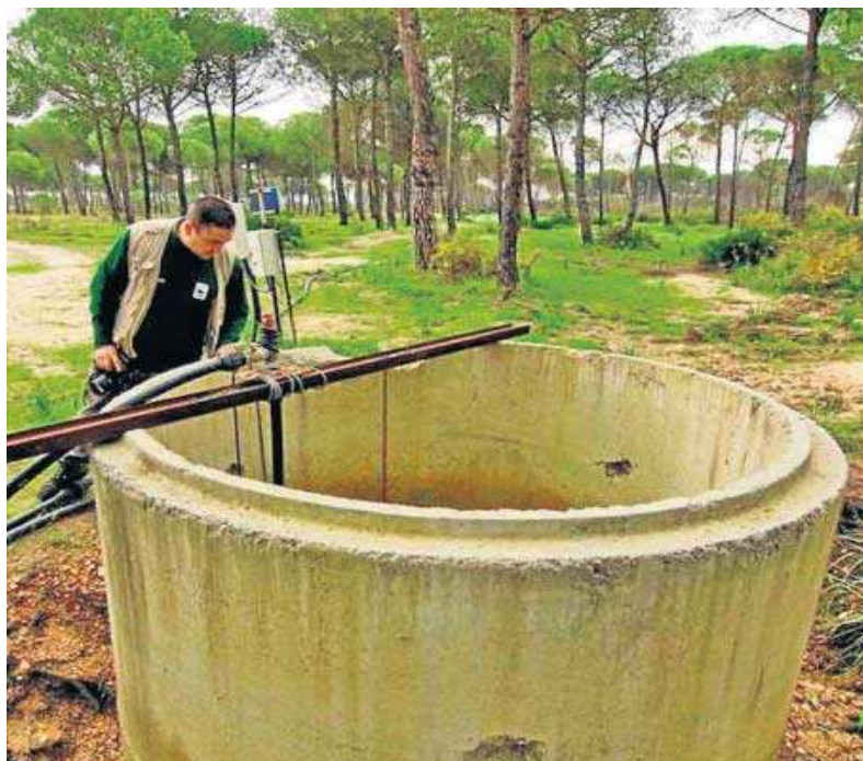
Pozo ilegal en Doñana.

ta de lugares en peligro”, concluye. La Unesco pide a España que presente el 1 de diciembre de 2022 un informe actualizado sobre el estado de conservación de Doñana y lo cumplido de las recomendaciones para su examen por el Comité del Patrimonio Mundial en su 46ª sesión en el año 2023.