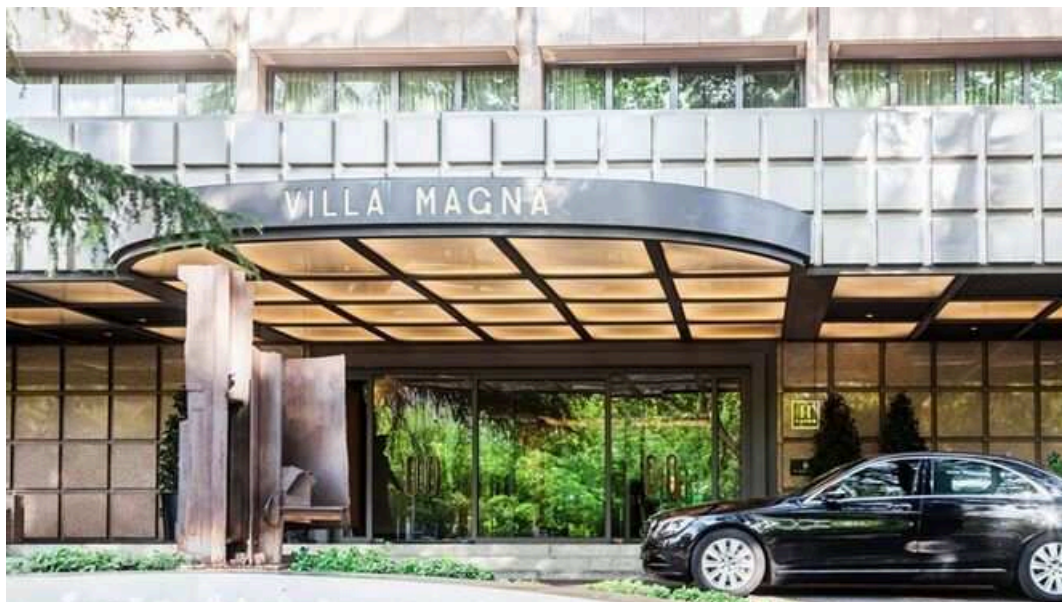
Entrada del hotel Villamagna de Madrid.

El grupo mexicano RLH Properties , dueño del Hotel Villa Magna de Madrid, ha reforzado su presencia en España con la adquisición del hotel de lujo Bless Collection de Madrid a Aina Hospitality y al grupo de inversores liderados por Grupo Didra y su plataforma ARD Investment and Development.