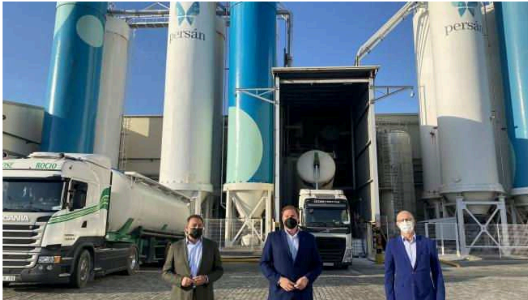
Persán vacuna a sus empleados contra el Covid-19 de la mano de la CES y el Plan 'Sumamos Salud + Economía' 20M EP

El proceso de inmunización se ha realizado gracias a CES con el apoyo del Plan 'Sumamos Salud + Economía' de la Fundación de Confederación Española de Organizaciones Empresariales (CEOE), junto a la labor de la Junta de Andalucía y la Confederación de Empresarios de Andalucía (CEA), según han explicado en un comunicado conjunto.