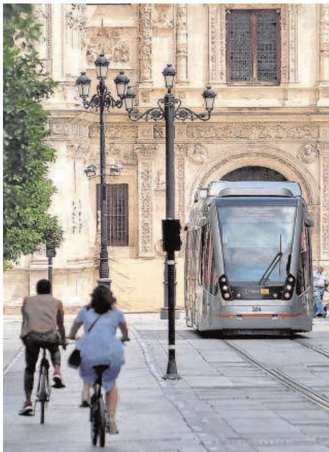
El tranvía se ampliará desde Ramón y Cajal hasta Nervión

Por último, la pasada Junta de Gobierno aprobó la licitación de la última de las contrataciones necesarias para la ejecución de la ampliación del Metrocentro como son las instalaciones. En total, un volumen de inversión de 3,4 millones de euros que ya se encuentra en tramitación. «La ampliación del Metrocentro es un proyecto dentro del Plan de Movilidad Urbana Sostenible y una gran inversión para la ciudad que cuenta con financiación europea. Ya tenemos todos los contratos aprobados con el objetivo de que en cuanto se culmine su tramitación puedan arrancar las obras», explicó el