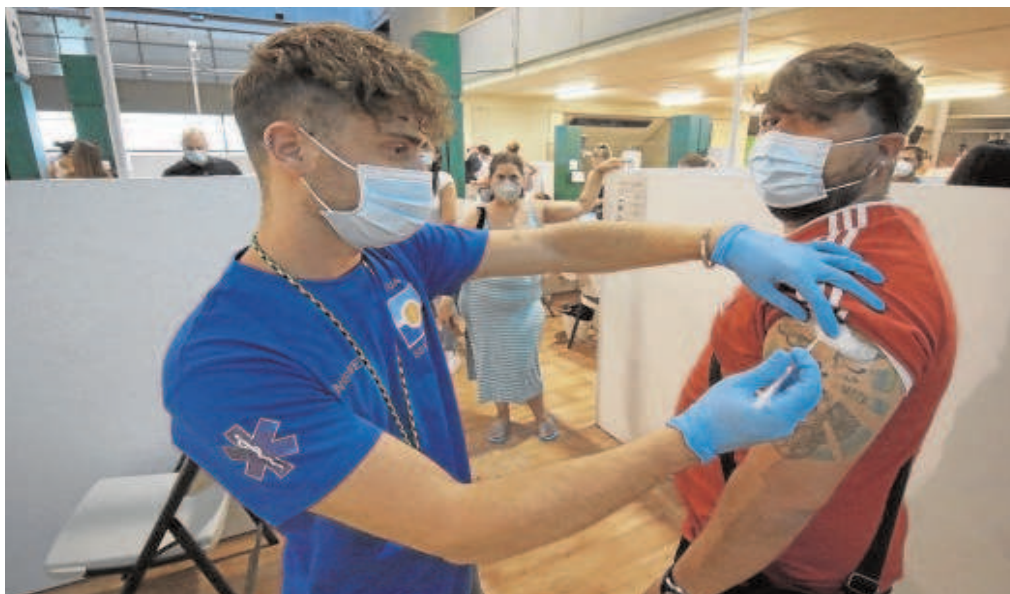
Un hombre se vacuna contra la Covid-19 en el estadio de La Cartuja de Sevilla

«Pero necesitamos instrumentos para tomar estas decisiones», insistió Moreno, para quien de nada sirve que la Junta pueda plantear una nueva medida para que luego un tribunal lo pueda «tumbar». Es lo que ha ocurrido, por ejemplo, con el cierre perimetral propuesto para la localidad jiennense de Peal del Becerro, iniciativa que se tomó al superar los mil casos por cada cien mil habitantes pero que el Tribunal Superior de Justicia de Andalucía (TSJA) tumbó esta semana.