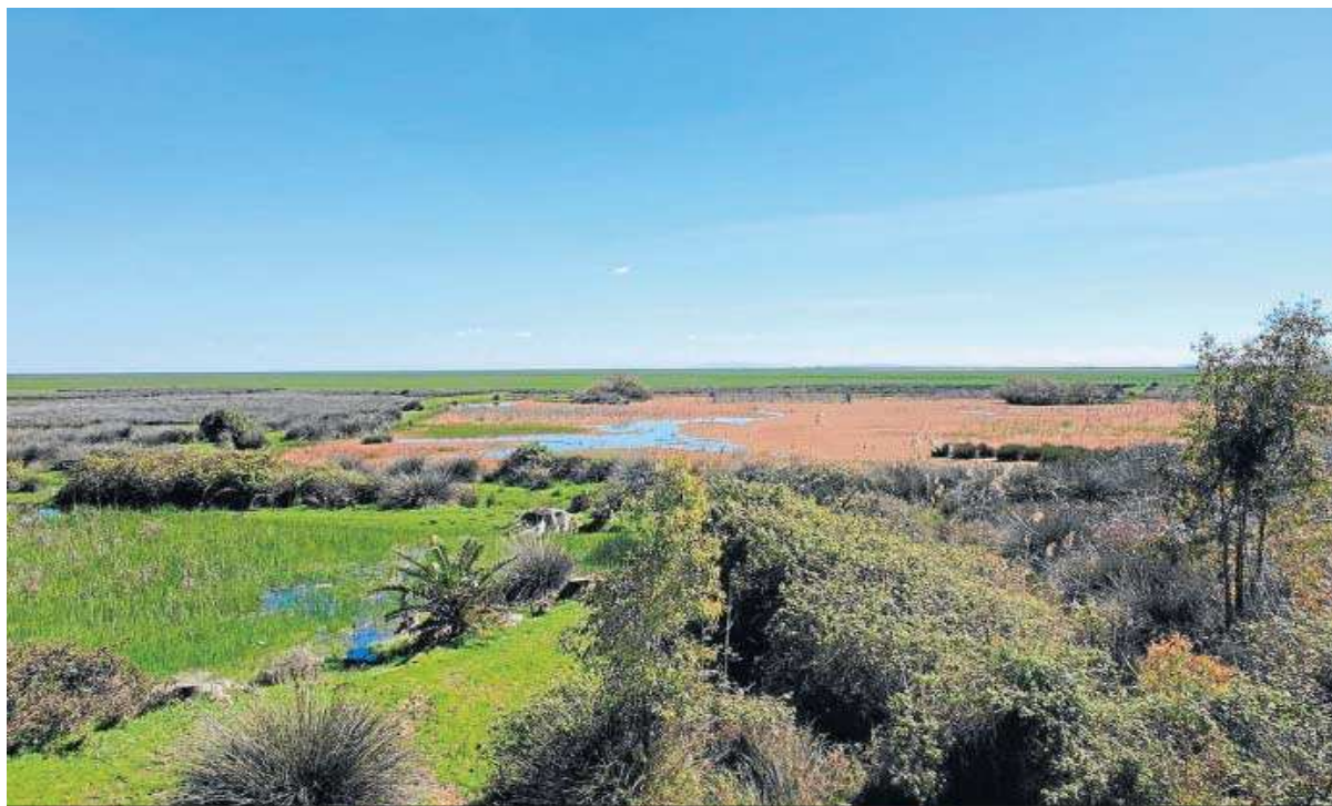
Laguna peridunar de Doñana prácticamente seca.

de Doñana supuso un hito en la conservación de los humedales en Europa en el siglo XX, estamos a tiempo de evitar su colapso en el XXI. Es más que urgente actuar para evitar que Doñana sea propuesta en 2023 en la lis-