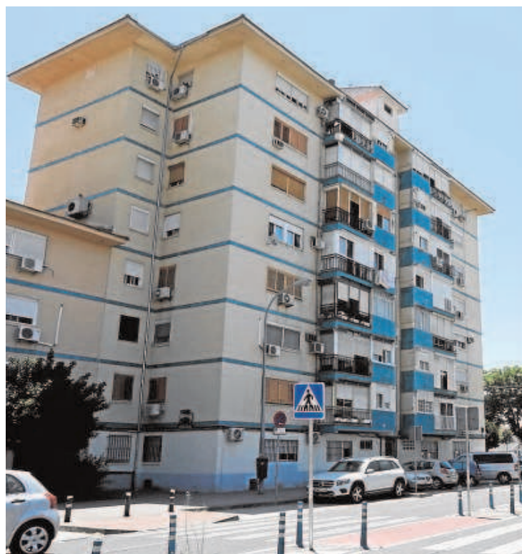
En Alcosa, la plaza Encina del Rey tiene unos bloques con serios problemas de