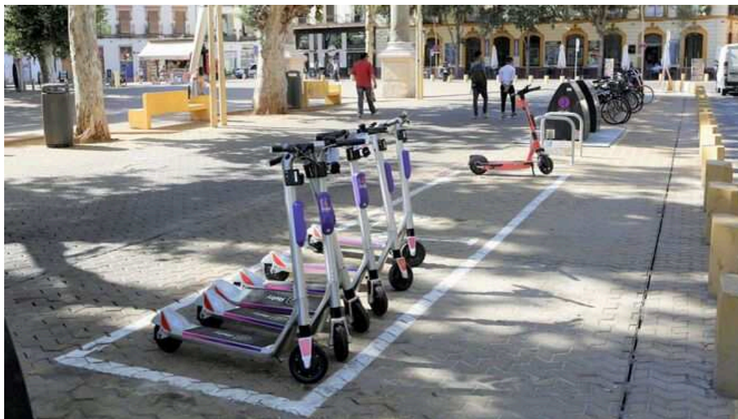
Patinetes de Reby en primera línea aparcados en la Alameda.

La empresa de movilidad compartida Reby ha certificado con un acta notarial, firmada el pasado 8 de julio de 2021, a la que ha tenido acceso Servimedia, que la potencia máxima de sus patinetes cumple con la ordenanza municipal de circulación de Sevilla, que establece una potencia máxima de 250w para circular por el carril bici.