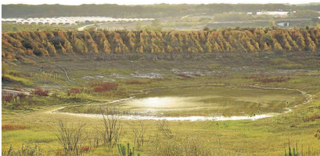
Balsa de riego de fresas clausurada en Doñana.

La Unesco también recomienda que se incrementen los recursos de los que dispone la