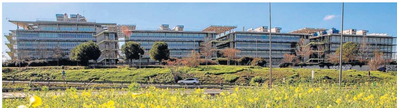
Campus de Palmas Altas, sede del grupo Abengoa en Sevilla.