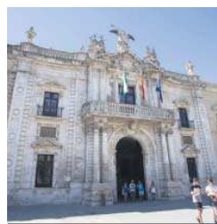
Fachada principal del Rectorado.

La Universidad de Sevilla (US) ha registrado entre su comunidad universitaria un total de 31 casos positivos en Covid-19 por prueba PCR en la semana del 12 al 18 de julio de 2021, lo que supone ocho menos que los registrados la pasada semana. En un comunicado, la Hispalense explica que estos datos conllevan que está contagiada un 0,40 por mil del total de la comunidad universitaria de la US, con un descenso de casos positivos respecto a la semana anterior, cuando se han alcanzado los 39 casos. De estos datos positivos, 27 corresponden a estudiantes, dos al Personal Docente e Investigador (PDI) y dos al Personal de Administración y Servicios (PAS). En la última semana también se han notificado 20 casos sospechosos que han