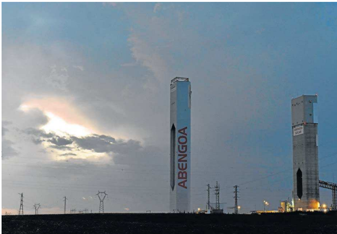
Planta termosolar construida por Abengoa en Sanlúcar la Mayor.

● 90.000 accionistas siguen atrapados sin poder vender sus títulos ● La crisis avanza ya hacia una deriva judicial