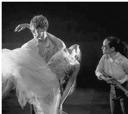
'No amanece en Génova', obra ganadora de Cinta en 2019.