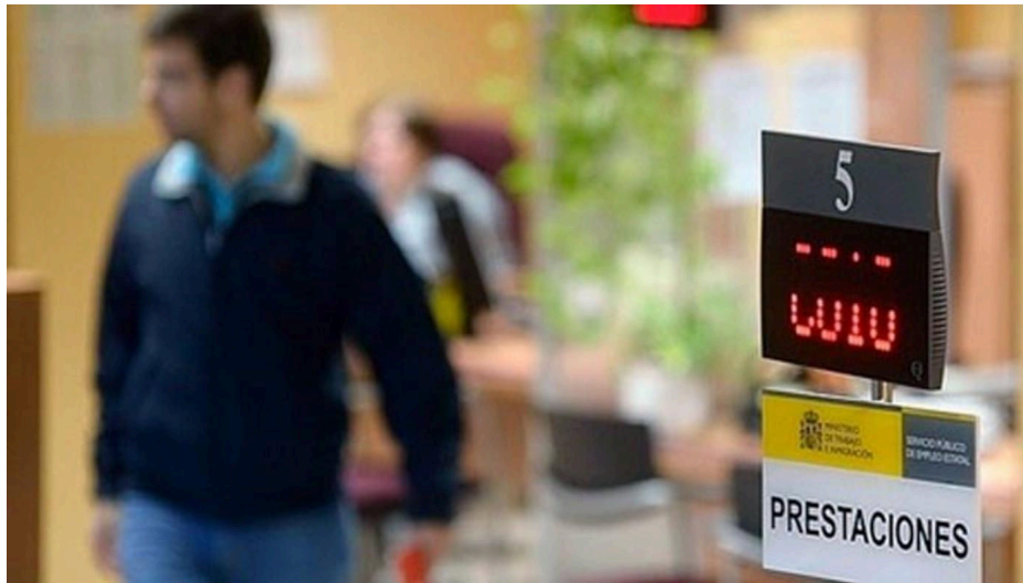
Un ciudadano sale de una oficina del Servicio Público Estatal de Empleo.

Andalucía ha registrado un total de 1.992.233 contratos temporales durante el primer semestre de 2021, un 13,7% más que el mismo periodo de 2020 cuando se registraron 1.751.799, según el informe publicado este lunes por Randstad, empresa de recursos humanos que ha realizado un estudio sobre cómo ha variado en el último año la contratación temporal a través del estudio de los datos del Servicio Público de Empleo Estatal (SEPE).