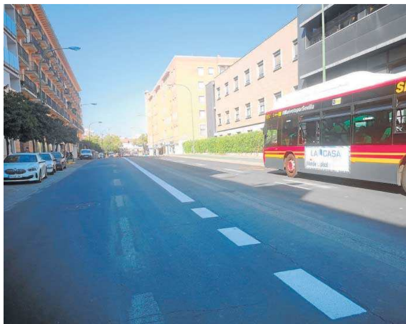
Un autobús circula por una Carretera de Carmona casi desierta de vehículos.

● Esta semana finaliza la implantación del doble sentido en la segunda ronda, entre las calles José Díaz y la avenida de Llanes