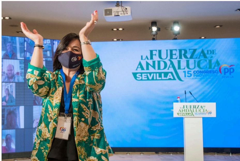
La presidenta del PP de Sevilla, Virginia Pérez.