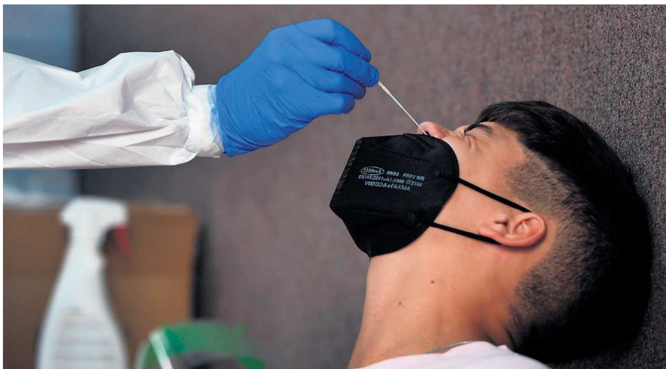
Las pruebas PCR, o reacción en cadena de la Polimerasa, continúa siendo el método más eficaz para detectar nuevos positivos entre la población.

● Hay 113 personas hospitalizadas por la pandemia, de las que 37 están en la UCI ● La campaña de vacunación sigue avanzando y roza el millón de sevillanos inmunizados