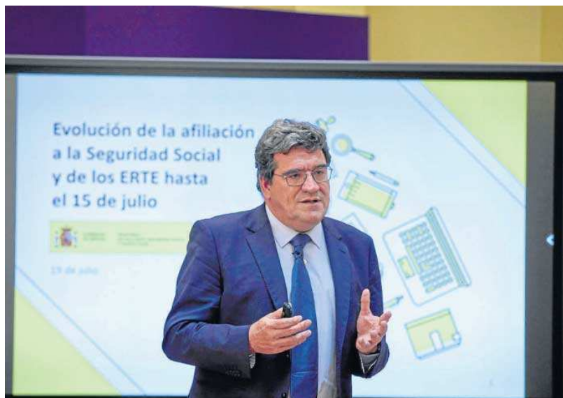
El ministro José Luis Escrivá, ayer, durante la rueda de prensa para avanzar los datos de afiliación.

"Hay un buen número de sectores que tienen niveles de empleo significativos previos a la pandemia", aseguró el ministro, quien destacó que se da tanto en las actividades antes más afecta-