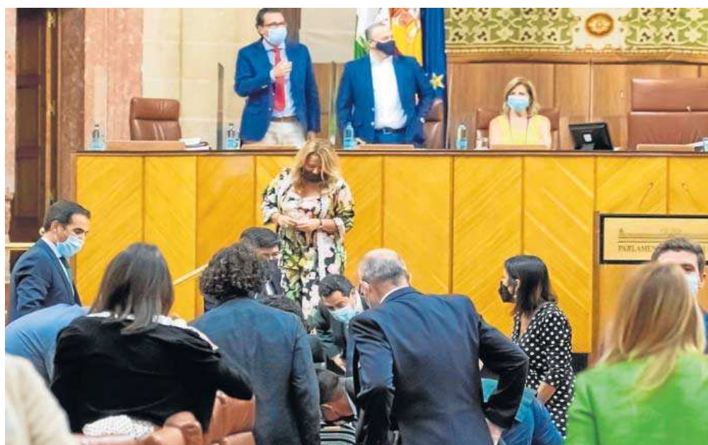
Los parlamentarios buscando ayer a la rata que se coló en el plenario durante la sesión.