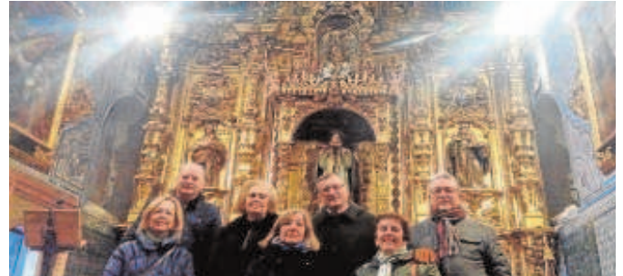
Imagen de la ruta en otras ediciones

El convento se funda en 1473 con la bula fundacional del Papa Sixto IV a Ana de Santillán y Guzmán, dama que