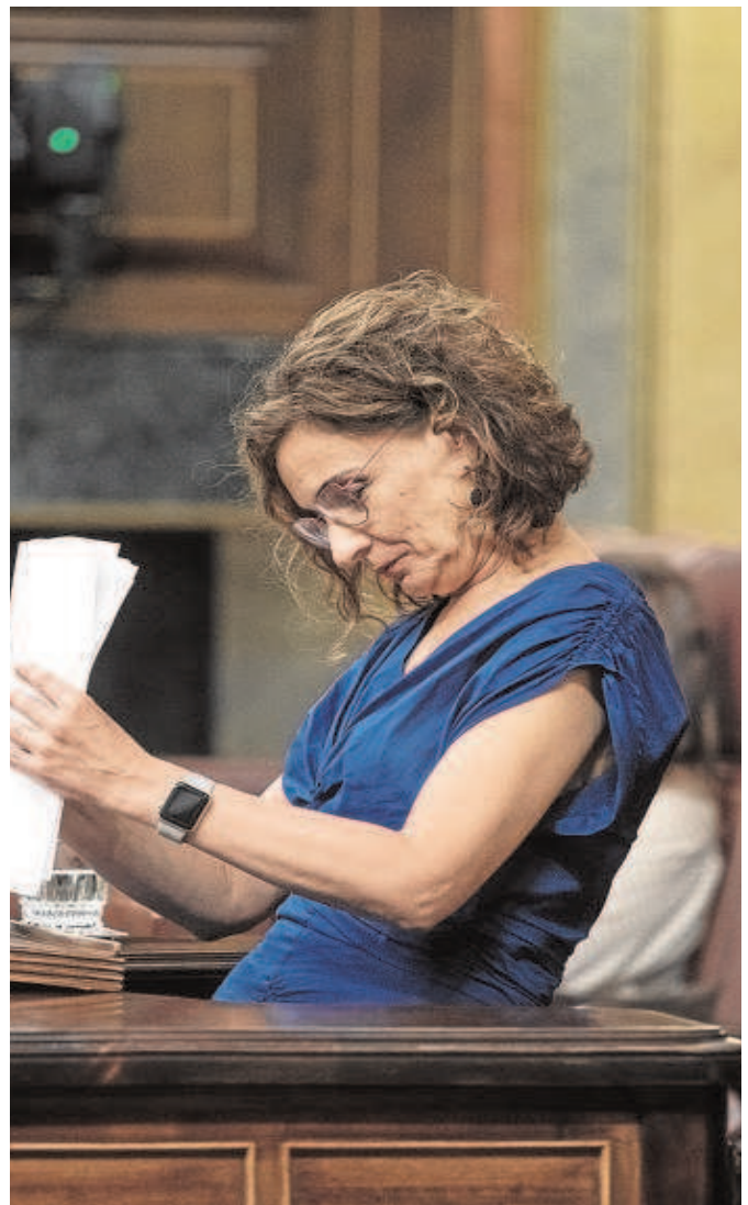
La ministra Montero, ayer en el Congreso

Como ya informó este diario, el Covid ha aumentado la contratación de sanitarios y de personal de servicios sociales y estos nuevos empleos se han realizado, en su gran mayoría, por tiempo limitado, lo que ha provocado que la brecha existente entre empleos temporales e indefinidos se haya marcado más en el sector público, donde la tasa está