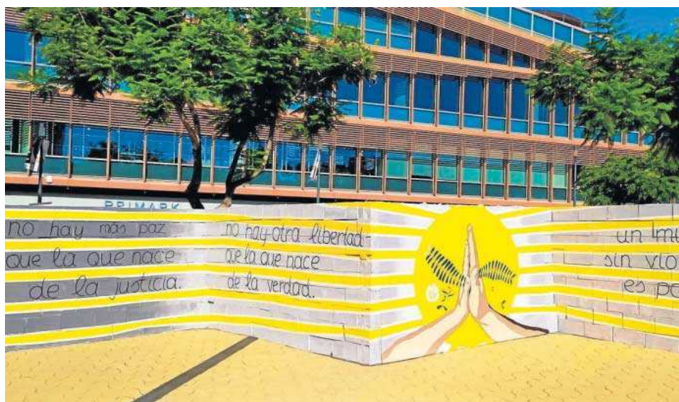
Una de las partes de 'El Muro del Recuerdo', ubicado en la plaza del centro comercial.

● Una pared zigzagueante de unos 13 metros evoca los principios de la dignidad y justicia de las víctimas del terrorismo