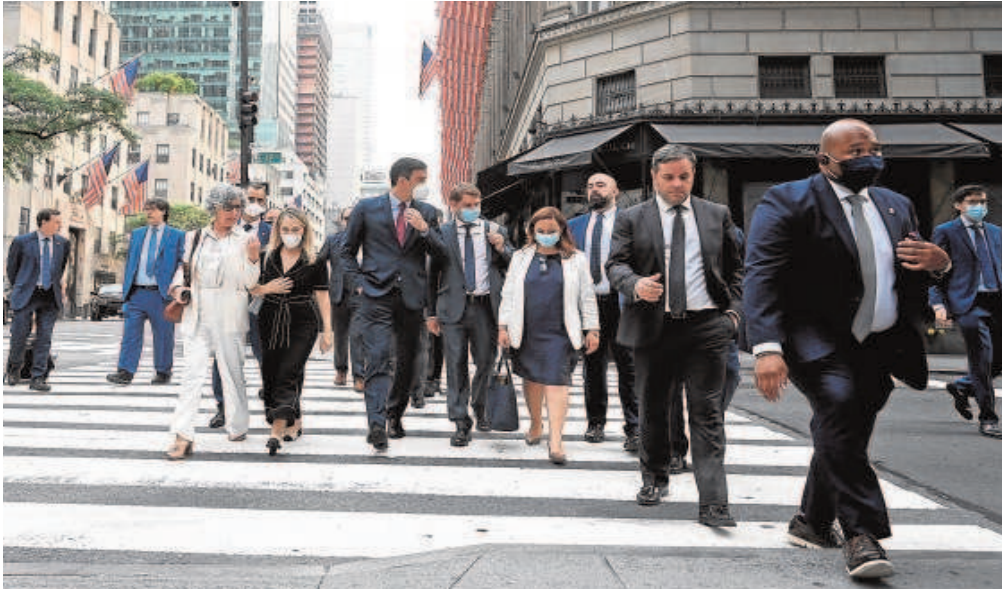
Pedro Sánchez, junto a una decena de asesores y agentes de seguridad, ayer en las calles de Nueva York