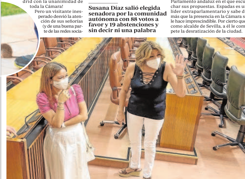
Susana Díaz, junto a Verónica Pérez, en la que fue su jornada de despedida del Parlamento andaluz

Por cierto que el nuevo líder del PSOE también aprovechó para aparecer por la Cámara andaluza aunque sin coincidir con su antecesora. La excusa: una reunión con un grupo de jóvenes (de Juventudes Socialistas, de la Once, scouts, salesianos y del Consejo Andaluz de la Juventud) para plantear un grupo de trabajo en el Parlamento andaluz en el que escuchar sus propuestas. Espadas es un líder extraparlamentario y sabe de más que la presencia en la Cámara se le hace imprescindible. Por cierto que, como alcalde de Sevilla, a él le compete la desratización de la ciudad.