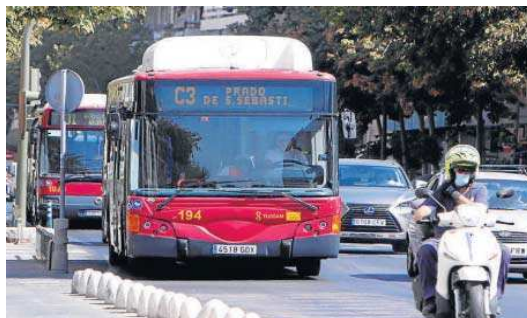
Uno de los vehículos de Tussam circulando por Sevilla.

La contratación activada ahora está destinada a incorporar vehículos híbridos de gas natural y sistema eléctrico, un modelo que