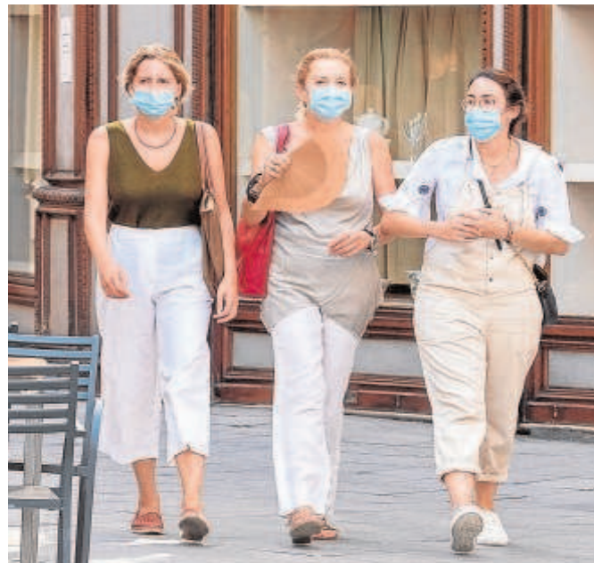
Tres mujeres pasean Sevilla protegidas con mascarillas

Es verdad que Sevilla se movió muy mal en la cuarta ola y que, además, no fue capaz de erradicarla del todo, pero bajó los datos de forma significativa y se ha mostrado estable durante el último mes, lo que le ha servido para darle la vuelta a la situación de forma radical en comparación al resto de España. De hecho, a día de hoy la provincia tiene una tasa de incidencia de 149,1