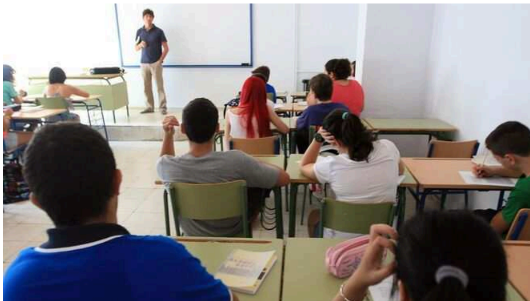
Un profesor imparte clase en el aula de un instituto.

El caso del alumno de Sevilla al que le han aprobado ocho asignaturas de golpe tras la alegación presentada por la madre ha vuelto a poner de actualidad el trámite mediante el cual las familias pueden conseguir darle la vuelta al expediente académico de un menor. Se trata de un procedimiento, amparado por la ley, que ha generado bastante polémica los últimos años y que pretende, en todo momento, que queden garantizados los derechos de los estudiantes, pero también los del profesorado.