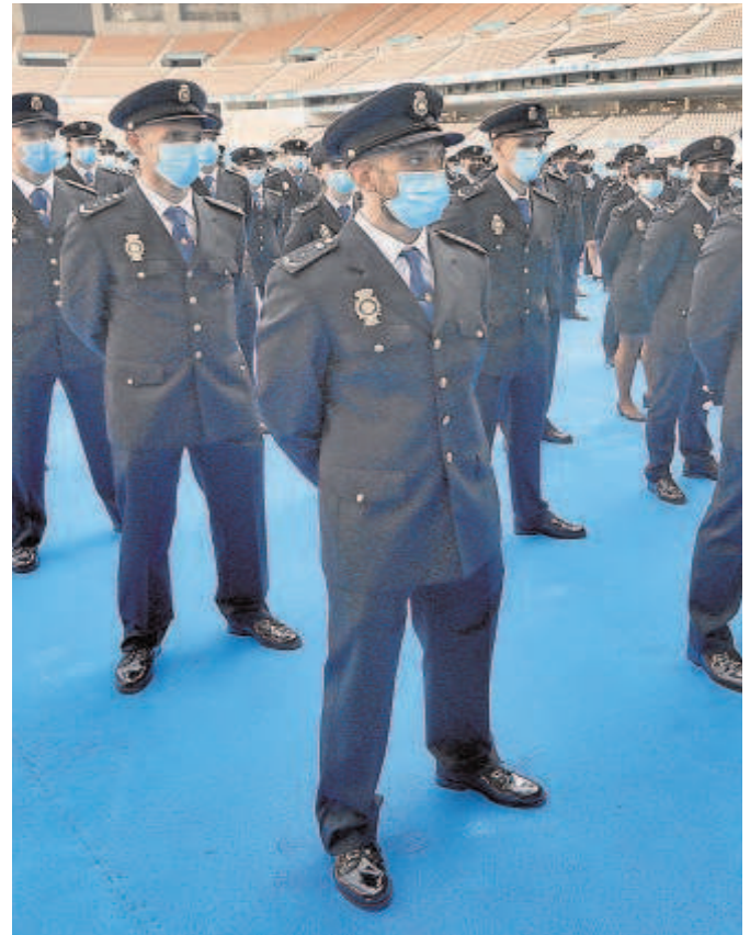
Agentes que juraron el lunes su cargo en el estadio de la Cartuja // J. M. SERRANO

El delegado del Gobierno ha anunciado que junto al alcalde de Sevilla van a mantener una reunión con el ministro de Interior, Fernando Grande-