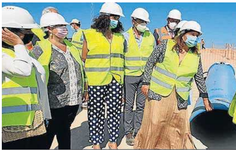
Carmen Crespo coloca la primera piedra de las obras de mejora de abastecimiento de la Sierra Sur.

“Estamos apostando por el medio ambiente, por la política hidráulica y por generar empleo de calidad que permita impulsar la reactivación económica de Andalucía también a través de las infraestructuras del agua”, afirmó