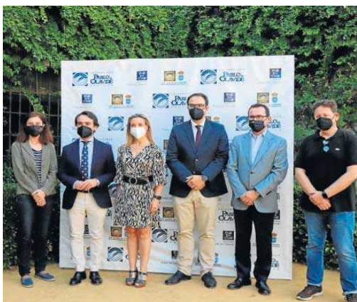
Foto de familia, ayer en los cursos de verano de la UPO.