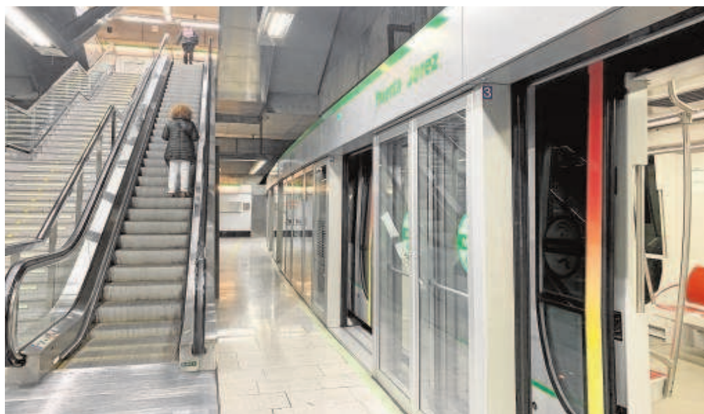
Línea 1 del Metro de Sevilla, que sufrió en el primer estado de alarma la pérdida de 5 millones de viajeros

Además, Metro de Sevilla ha anunciado el inicio en 2021 de acciones para mitigar el perjuicio que le ha provocado la decisión de la Agencia de Obra Pública de prorrogar la concesión a junio de 2040, en lugar de diciembre de ese año.