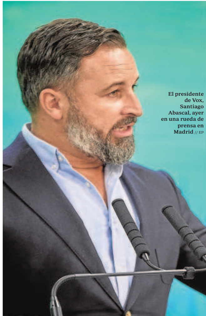
El presidente de Vox, Santiago Abascal, ayer en una rueda de prensa en Madrid

propiciaron el cambio político en Andalucía (PP, Cs y Vox), tras 37 años de poder socialista, han ido en aumento y barruntan un otoño de tensión creciente. La inmigración se ha convertido en un pretexto recurrente. El pasado mayo, Vox amenazó con dejar sin apoyos a Moreno si la Junta acogía a menores no acompañados alojados en Ceuta. Para dejar claro que esta vez sí iba en serio, bloqueó, junto con Adelante Andalucía y el PSOE, la tramitación parlamentaria de la Ley de Impulso para la Sostenibilidad del Territorio. La ruptura duró poco. En julio retomó el diálogo con la Junta y acabó apoyando la iniciativa legislativa.