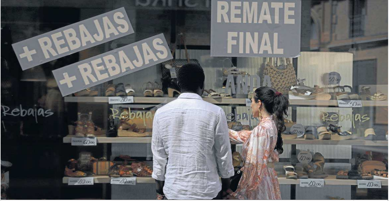
Una pareja ante un escaparate de una zapatería del centro de Sevilla que tiene sus productos en remate final.

Distribuido para CONFEDERACIÓN N DE EMPRESARIOS DE SEVILLA * Este artículo no puede distribuirse sin el consentimiento expreso del dueño de los derechos de autor.