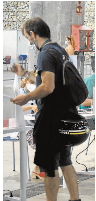
EL Servicio Andaluz de Salud puso en marcha

«Las optimistas previsiones turísticas para estos meses refuerzan la petición de eliminación de medidas de limitación de actividad en un contexto de clara remisión de la pandemia», señalaba ayer la federación en un comunicado.