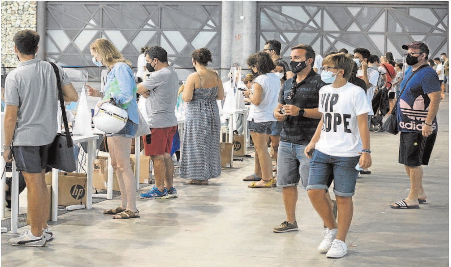
ayer jornadas de vacunación masiva sin cita para avanzar en el último tramo de la inmunidad de grupo contra el Covid // FRANCIS SILVA