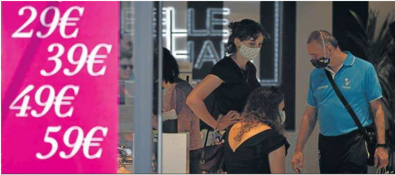
Interior de un comercio de la calle Rioja, donde varios clientes aprovechan los últimos días de rebajas.

No obstante, sí coincide en que “en las últimas semanas se nota más alegría en el consumo”. Del descenso del 40% de la facturación con respecto a antes de la pandemia, según él, se ha pasado a un 20% aproximadamente. Un panorama esperanzador que se une al “miedo del sector” por retroceder por la aparición de una cepa nueva del virus. El representante de los comerciantes del centro de Sevilla aprovecha este balance veraniego para explicar que el mal momento por el que pasa la zona en el plano comercial “no só-