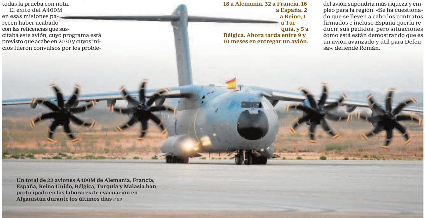
Un total de 22 aviones A400M de Alemania, Francia, España, Reino Unido, Bélgica, Turquía y Malasia han participado en las labores de evacuación en Afganistán durante los últimos días