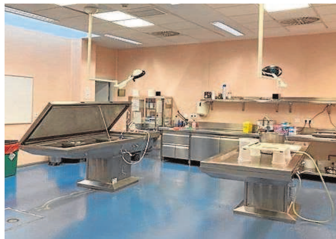
Sobre estas líneas, la sede del Instituto de Medicina Legal en el tanatorio de San Jerónimo

Tráfico, como la pérdida de puntos del carné y el endurecimiento legislativo, redujeron la siniestralidad.