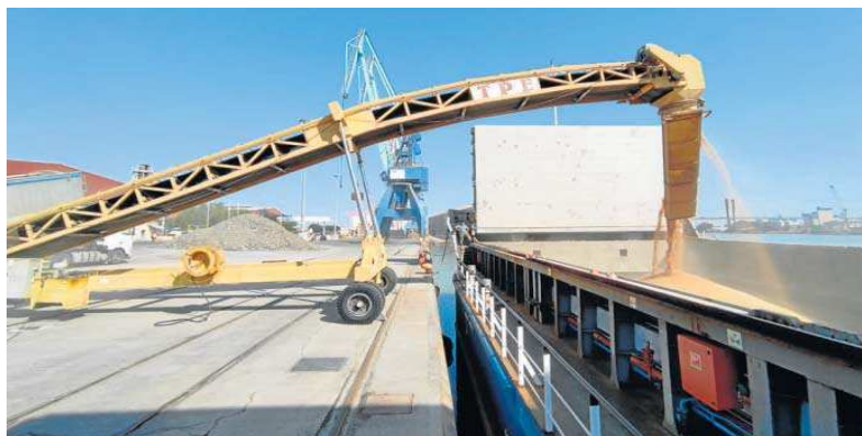
Operación de estiba de trigo ecológico en las instalaciones de Sevitrade, en el Puerto de Sevilla.

Las últimas estadísticas de Puertos del Estado, correspondientes al mes de julio, arrojan un buen dato para el tráfico de mercancías en los muelles de Sevilla, con una subida del 0,26%. En total, el movimiento acumulado en siete meses ha sido de 2.312.899 toneladas que confirman una estabilización después de un año bastante positivo y que se alejan de la caída registrada en una docena de puertos. La tendencia de recuperación refleja la fortaleza del Puerto de Sevilla, aunque aún no se llega a los niveles anteriores a la pandemia. En 2019 el Puerto movió cerca de 4,4 millones de toneladas, con un negocio de 19,9