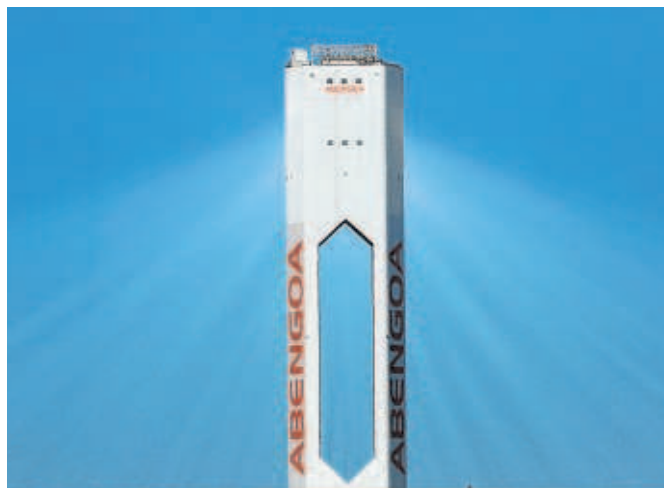
Abengoa perdió 487,6 millones de euros en 2019

Por otra parte, este viernes finaliza el plazo para pagar 169 millones a bonistas titulares de la deuda New Money2 (NM2), aunque la compañía ha pedido una extensión del 'waiver'.