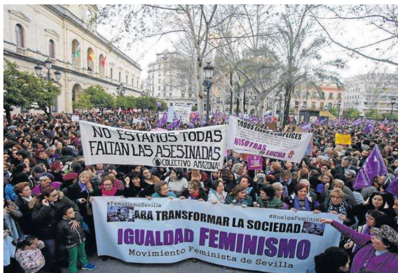
Una imagen de la histórica movilización por el Día Internacional de la Mujer de 2018.