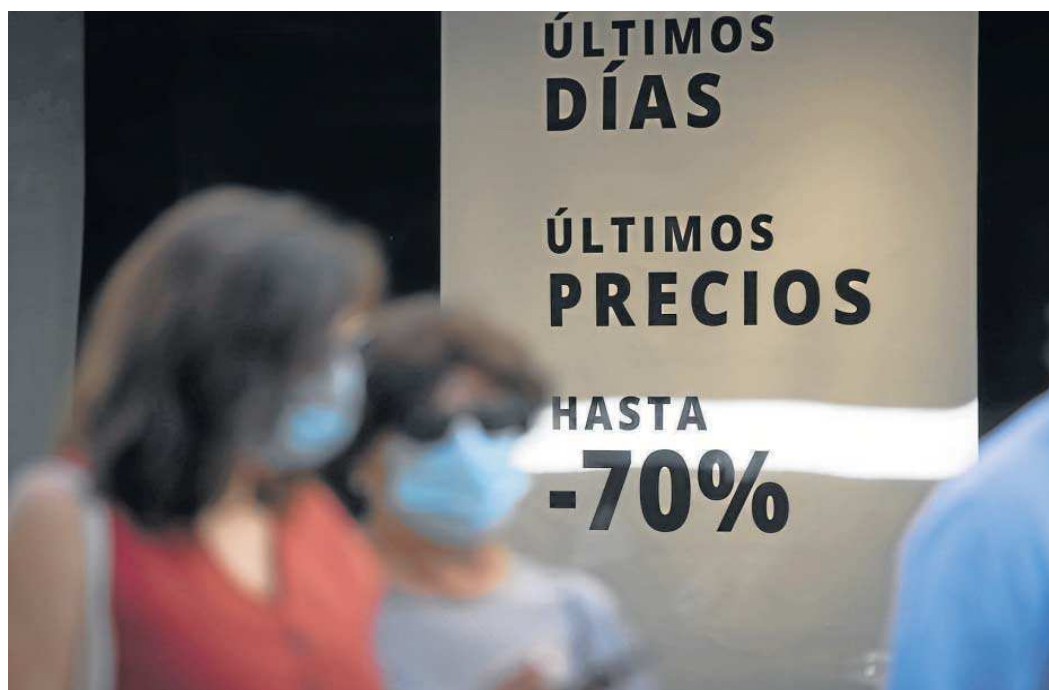
Los rótulos de muchas tiendas anuncian el final del periodo de rebajas veraniegas, intentando así atraer a los paseantes de las calles comerciales.