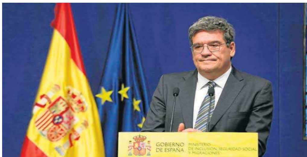
José Luis Escrivá, ministro del que dependen las competencias de Seguridad Social.