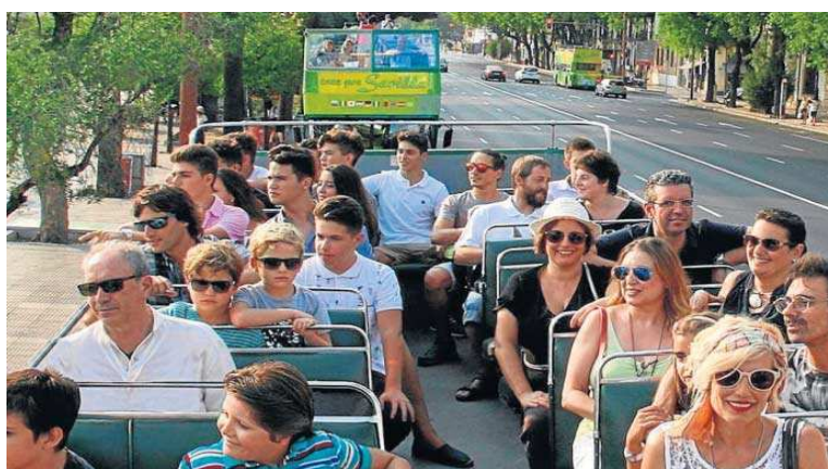
Uno de los autobuses turísticos de Sevilla.

Esto mismo sucedió el domingo 15 de agosto en la Alameda: uno de los autobuses turísticos (de City Sightseeing) no podía salir de la Alameda porque se encontró con la calle Trajano cortada, según el Ayuntamiento, por "un corte puntual por un accidente". Al no saber ni la duración ni la gravedad de ese corte de Trajano, el conductor decidió desviarse por Correduría-Feria, como siempre vienen haciendo estos autobuses, por ser la ruta alternativa que co-