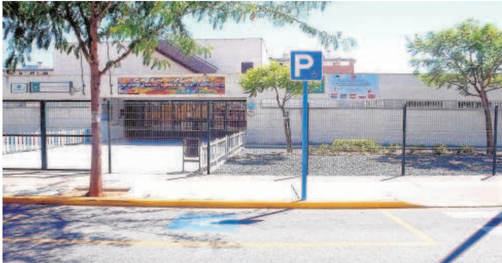
Entrada principal al colegio Giner de los Ríos de Mairena del Aljarafe

Escolares de Mairena del Aljarafe se beneficiarán este curso del aumento de la superficie peatonal y carriles bici en detrimento del tráfico motorizado