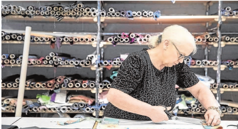
Pequeña empresa dedicada al textil en Alemania

Cinco años después de aprobar la remuneración mínima, en Alemania se constata que las microempresas fueron las grandes perjudicadas, que cedieron terreno a las más grandes