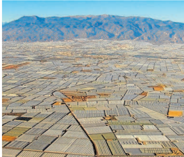
Almería acaparó en el primer semestre de 2021 el 48% de las exportaciones de frutas y hortalizas en Andalucía