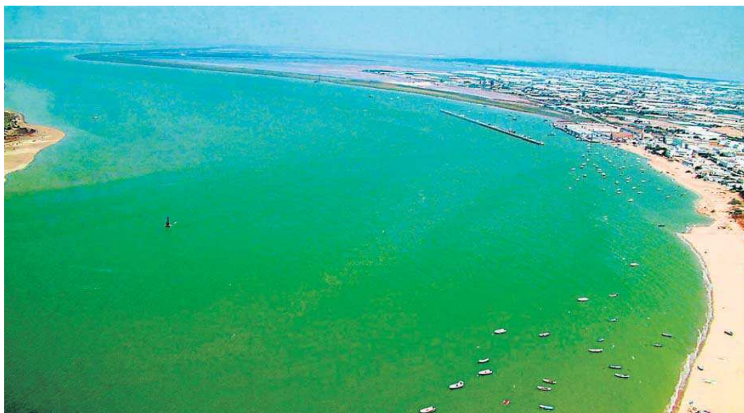
Una vista panorámica de la desembocadura del río Guadalquivir, en Sanlúcar. M.G.