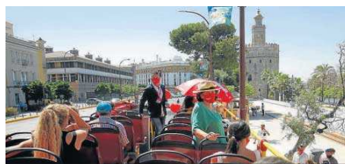
Turistas en otra de las empresas de autobuses turísticos.

Desde el Ayuntamiento se señala a la responsabilidad del conductor por no esperar a que el "corte puntual" por accidente en Trajano se despejara. "El conductor, al llegar a Trajano procedente de la Alameda, decidió no esperar a que se quedara expedita la vía y se adentró por calles estrechas del