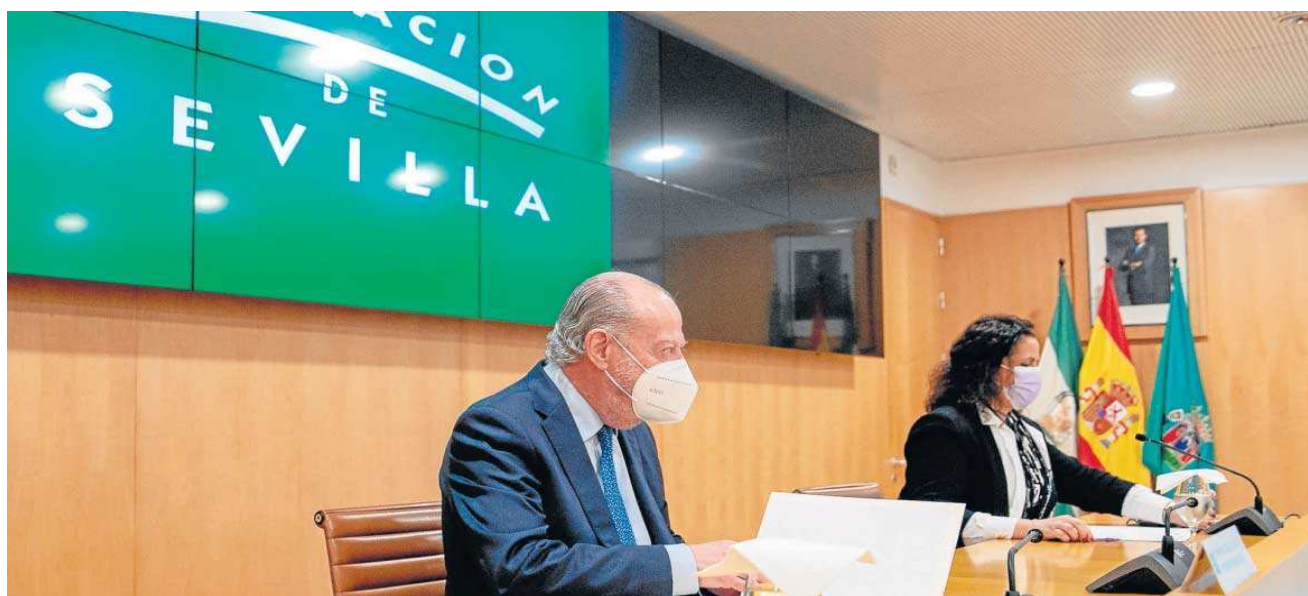
El presidente de la Diputación, Fernando Rodríguez Villalobos, y la diputada del Área de Cohesión Social e Igualdad, Rocío Sutil, en un acto público reciente.

Promoción. Elaboración, desarrollo e implementación de planes de igualdad de empresas y planes municipales de igualdad destinados a Ayuntamientos menores de 20.000 habitantes