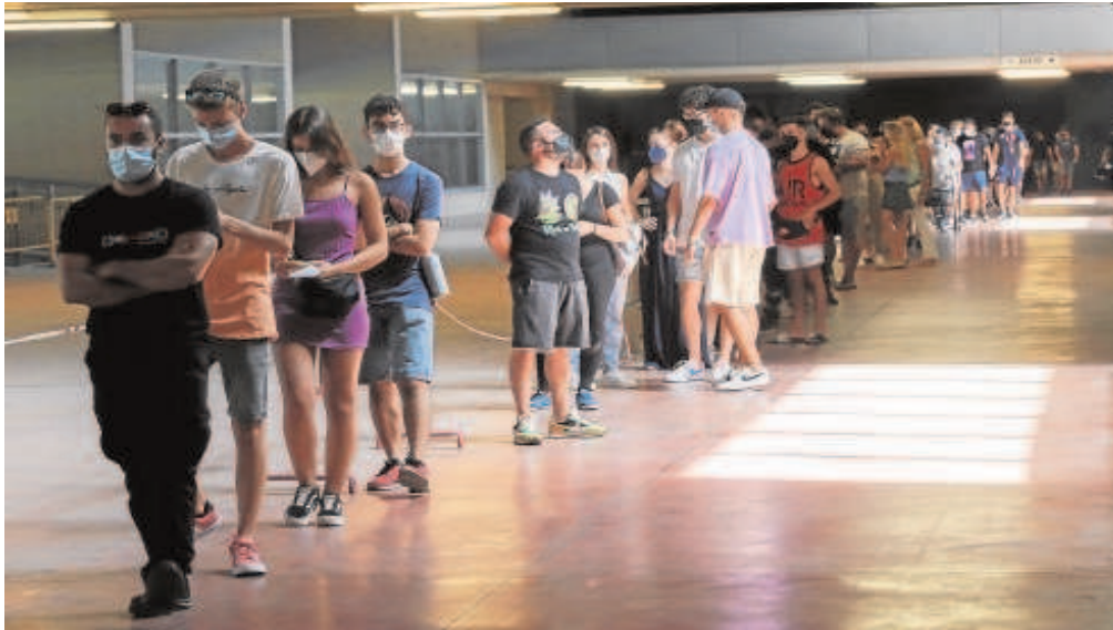
Grupo de jóvenes aguardan su turno para ser vacunados en el estadio de la Cartuja