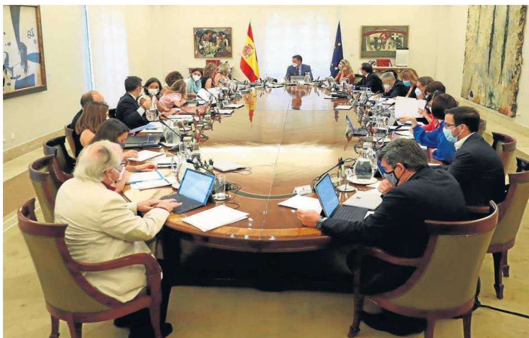
Celebración del primer Consejo de Ministros tras las vacaciones de verano.

● Impulsa la primera pata de la norma, que ahora se tramitará en el Congreso ● La revalorización conforme al IPC y los incentivos para retrasar la edad de jubilación, los aspectos más destacados