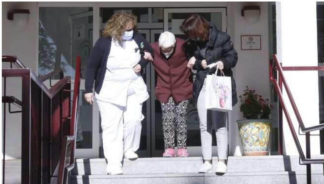
Una mujer es acompañada por una empleada y un familiar a las puertas de una residencia de mayores.

Bautizada como la ola joven porque ha afectado sobre todo a los menores de 30 años, la quinta embestida del virus también ha hecho revivir la pesadilla del coronavirus en las residencias de mayores . Pese a que la vacunación las había convertido en auténticos oasis libres del Covid-19, el virus ha vuelto a entrar en los centros geriátricos sevillanos dejando hasta la fecha 250 positivos en menos de un mes . Un inquietante aumento de casos que, aunque resulta imposible pensar que el drama se parezca al de olas anteriores, se han duplicado en sólo una semana y llega, además, acompañado de las más devastadoras consecuencias con 15 fallecidos en dos de los 14 brotes activos en centros sociosanitarios de la provincia.