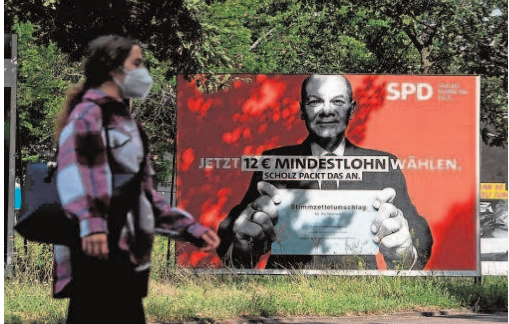
Un cartel electoral del SPD para los comicios del próximo 26 de septiembre

Según Forsa, el 22% que obtiene la CDU es el peor valor que el instituto, fundado en 1984, ha calculado jamás para el partido. El 60% de los encuestados, además, ya no creen en un posible cambio de tendencia a su favor antes del 26 de septiembre. La línea de caída, desde luego, es poco esperanzadora. Hace un año, el 8 de agosto de 2020, dos días antes de que el SPD nominara a Olaf Scholz como candidato a canciller, la CDU obtenía el 38% en la encuesta de Forsa y los socialdemócratas apenas el 14%. Hoy, con Merkel fuera de la competición, es Scholz, el vicecanciller de la gran coalición y ministro de Finanzas, el que gana en el