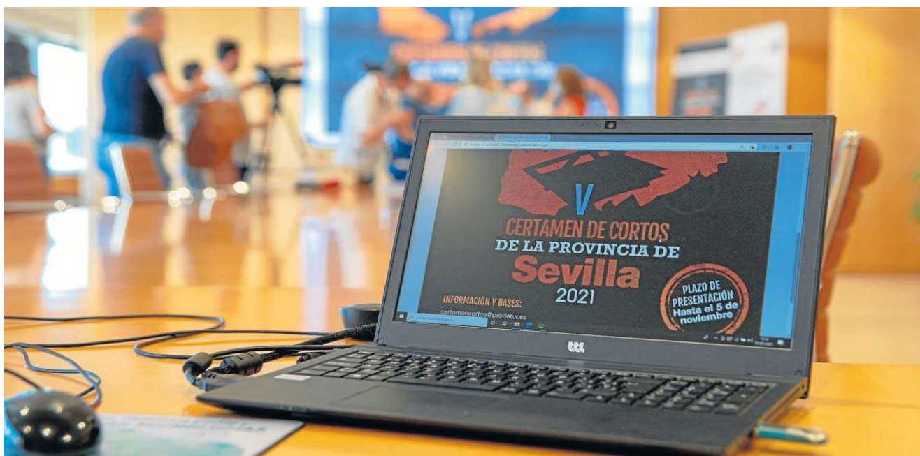
El proyecto se enmarca en el convenio de colaboración de la Diputación de Sevilla con la Consejería de Turismo de la Junta de Andalucía.

Fuente de riqueza. El plazo de presentación de los trabajos de la convocatoria presente, que contempla tres premios, permanecerá abierto hasta el 5 de noviembre