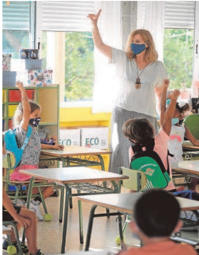
Una profesora imparte clase con mascarilla