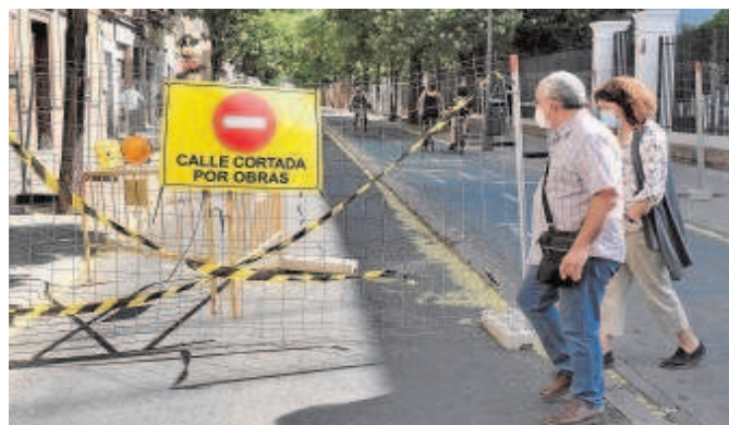
Las obras en la Cruz Roja han variado todo el tráfico de la Macarena

La reordenación del Distrito Macarena, programada en el Plan de Movilidad Urbana Sostenible que aprobó el pasado mes de junio el Pleno, tenía como objetivos generar un nuevo itinerario peatonal al Casco histórico a través de la eliminación del tráfico en la avenida de la Cruz Roja; ampliar espacios peatonales y ciclistas y reducir el tráfico que circula por la Ronda histórica, y favorecer el uso del trans-