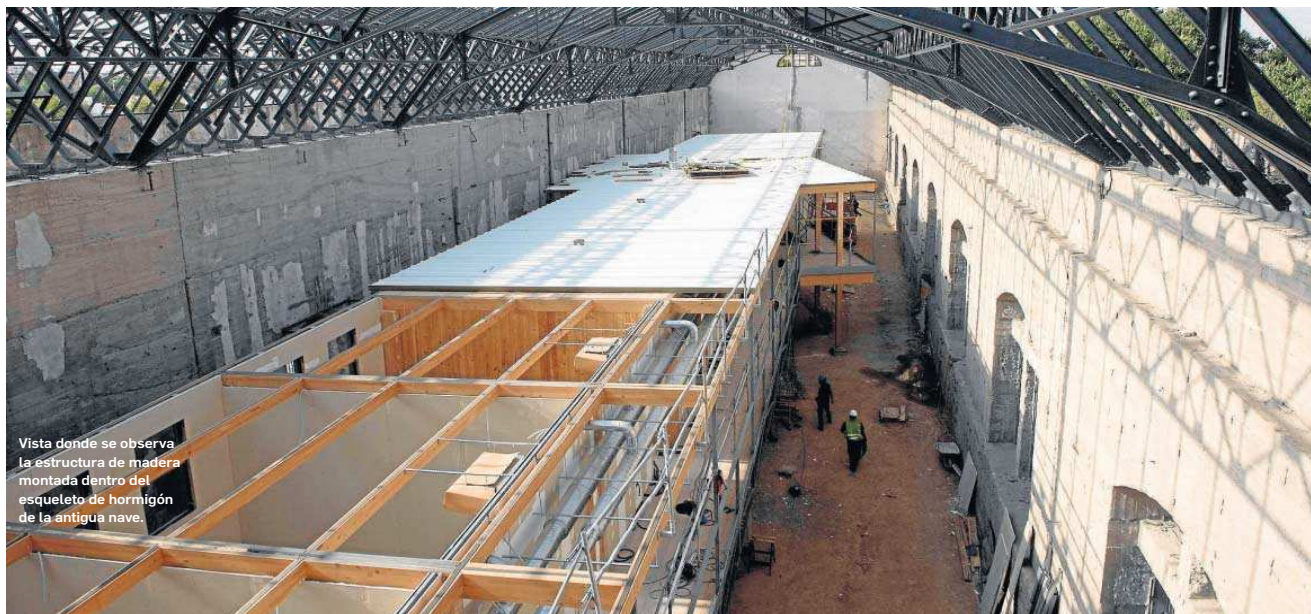
Vista donde se observa la estructura de madera montada dentro del esqueleto de hormigón de la antigua nave.