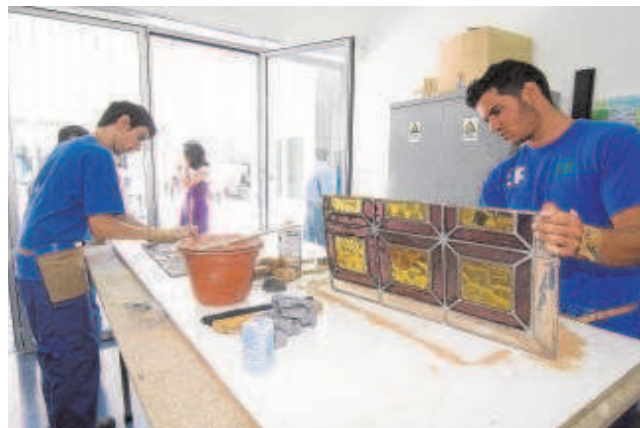
Alumnos de una escuela taller para la recuperación del patrimonio

El Gobierno emplaza a las comunidades autónomas a justificar el adecuado cumplimiento de los hitos y objetivos previstos en un plazo máximo de tres meses a partir de la fecha límite prevista. En todo caso, antes del 31 de marzo de 2023 deberá remitir un informe de justificación sobre cómo ha utilizado los fondos.