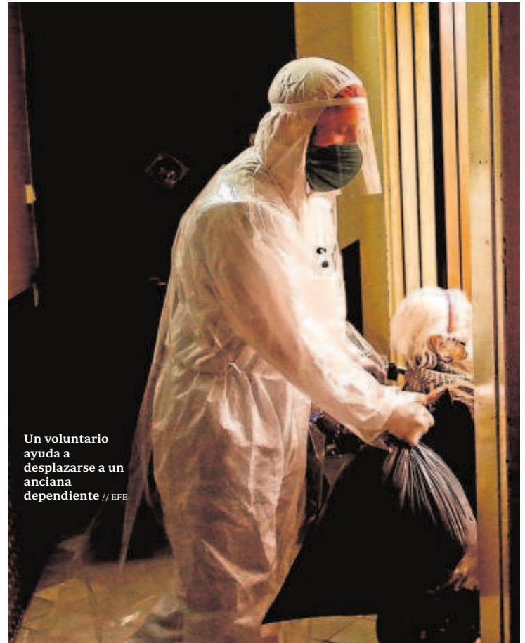
Un voluntario ayuda a desplazarse a un anciano dependiente

Una vez que la delegación comprueba que la solicitud de ayuda es correcta y resuelve el grado de dependencia, vuelven a entrar en juego los ayuntamientos. Éstos visitan en el domicilio