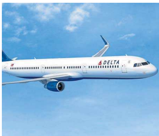
Modelo A321neo de Delta Airlines.

ría entrar en servicio a comienzos del año próximo. Muchos de esos aparatos, que servirán para renovar la flota de la aerolínea, serán fabricados en la planta que Airbus tiene en Estados Unidos en la ciudad de Mobile, en el estado de Alabama.