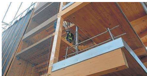
Plano donde se observa la estructura de madera.