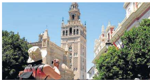
Una turista fotografía la Giralda en una tarde calurosa de verano. JUAN CARLOS MUÑOZ

El balance demuestra que el motor turístico se ha reactivado y, con él, la economía y empleo