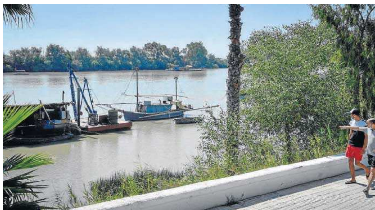
Dos personas pasean junto al río Guadalquivir en Coria del Río.

Tras la reunión para evaluar la situación del nuevo brote, Salud señaló que "esta actuación es imprescindible" en los focos de cría de las larvas y mosquitos adultos para reducir el número de insectos y la posibilidad de transmisión de la enfermedad. También subrayó "la necesidad" de reforzar los mensajes a la población para que se "autoproteja" contra los mosquitos, sobre todo en las horas de mayor actividad de los del género Culex, al amanecer y al atardecer.