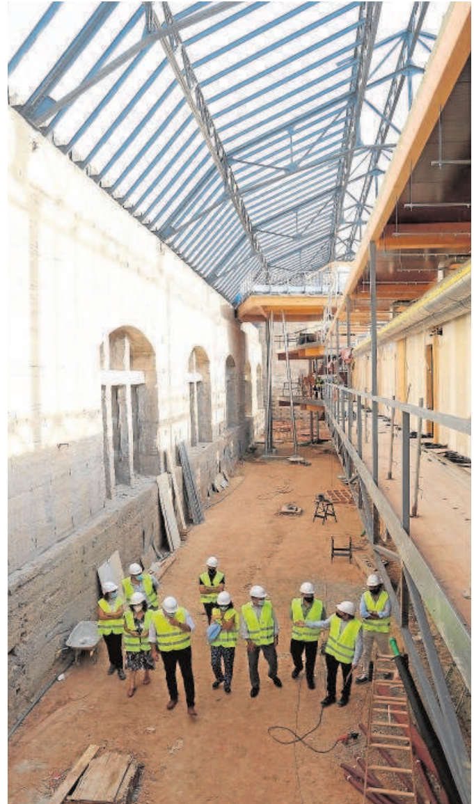
El alcalde y los responsables municipales, en la visita de ayer

En paralelo, se trabaja en la búsqueda de financiación complementaria que permita avanzar más en la recuperación del complejo desarrollando en su interior más proyectos. Eso sí, estará pendiente una cuestión esencial, la de la implantación de empresas en este espacio, que es lo que dará sentido al mismo. Sin ello, el proyecto carecerá de sentido y, sobre todo, de rentabilidad.