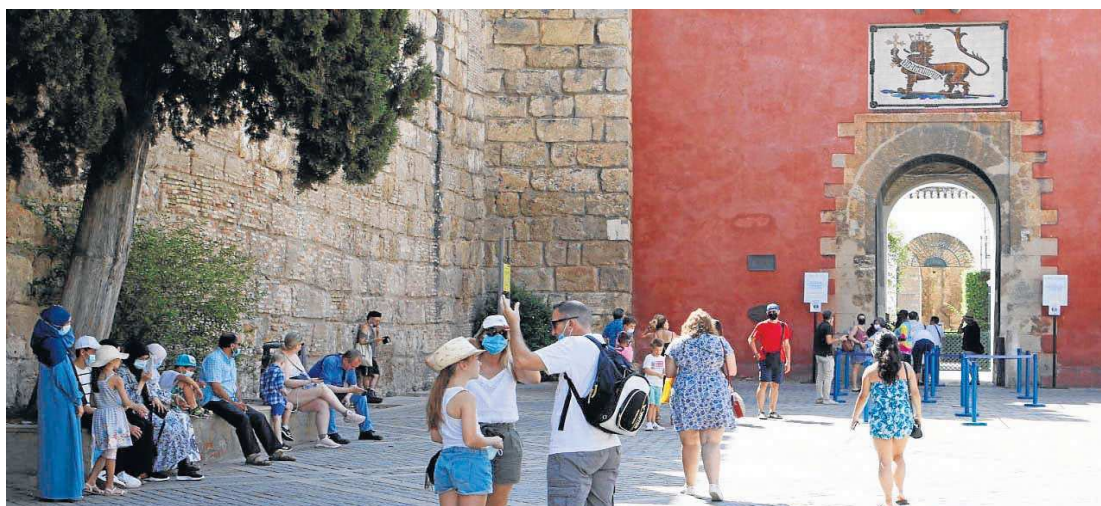
Cola de turistas accediendo al Alcázar de Sevilla, uno de los principales monumentos y más concurridos este verano. JOSÉ ÁNGEL GARCÍA