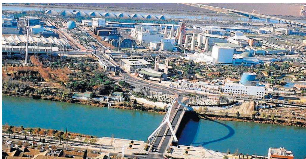
Una vista de la isla de la Cartuja con su Parque Científico y Tecnológico.

El PP municipal denuncia el retraso de cerca de dos años para iniciar el aparcamiento