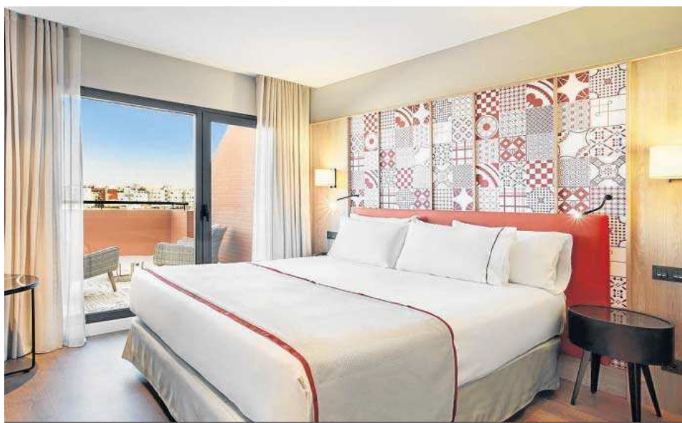
Habitación del hotel Eurostars Guadalquivir.