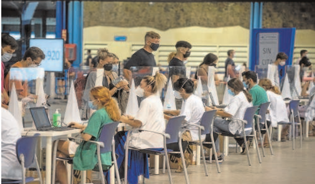
Sanitarios y vecinos en el centro de vacunación masiva en Málaga