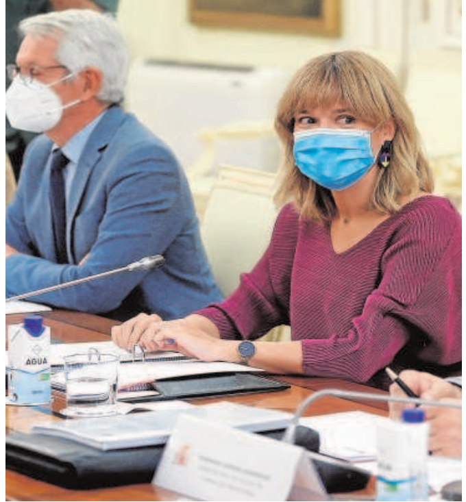
La titular de Educación, Pilar Alegría, ayer en la reunión sectorial