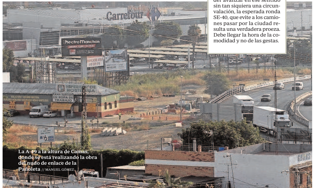
La A-49 a la altura de Camas, donde se está realizando la obra del nudo de enlace de la Pañoleta

semboca pasada la glorieta de entrada a la Zona de Actividades Logísticas (ZAL) del Puerto, donde se bifurca para habilitar accesos a estas instalaciones y para ir hacia Los Remedios u otras direcciones. Este vial tiene dos carriles de circulación y dos kilómetros de longitud. Conectado directamente con este primer desvío, se ha habilitado un segundo desvío que enlaza la carretera de la esclusa con la SE-40 a través de los puentes de la esclusa, que se han reforzado un para este fin. Dispone de cuatro carriles y 1,3 kilómetros.