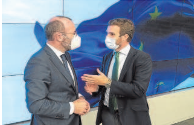
Manfred Weber y Pablo Casado, ayer en la sede del PP

El primer argumento de Casado es que la pandemia ha sido global, pero la mala política económica previa de este Gobierno, con un excesivo endeudamiento, subida del déficit y despilfarro electoralista, unida a una mala