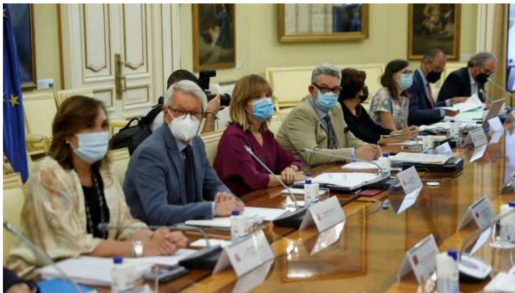
La ministra de Educación Pilar Alegría preside la reunión con las comunidades.

Pese al buen ritmo de vacunación, el tercer curso escolar en pandemia comenzará con unas medidas similares al anterior -mascarilla, ventilación y distancia- , según se ha acordado en la Sectorial de Educación, en la que la ministra Pilar Alegría ha pedido "no bajar la guardia".