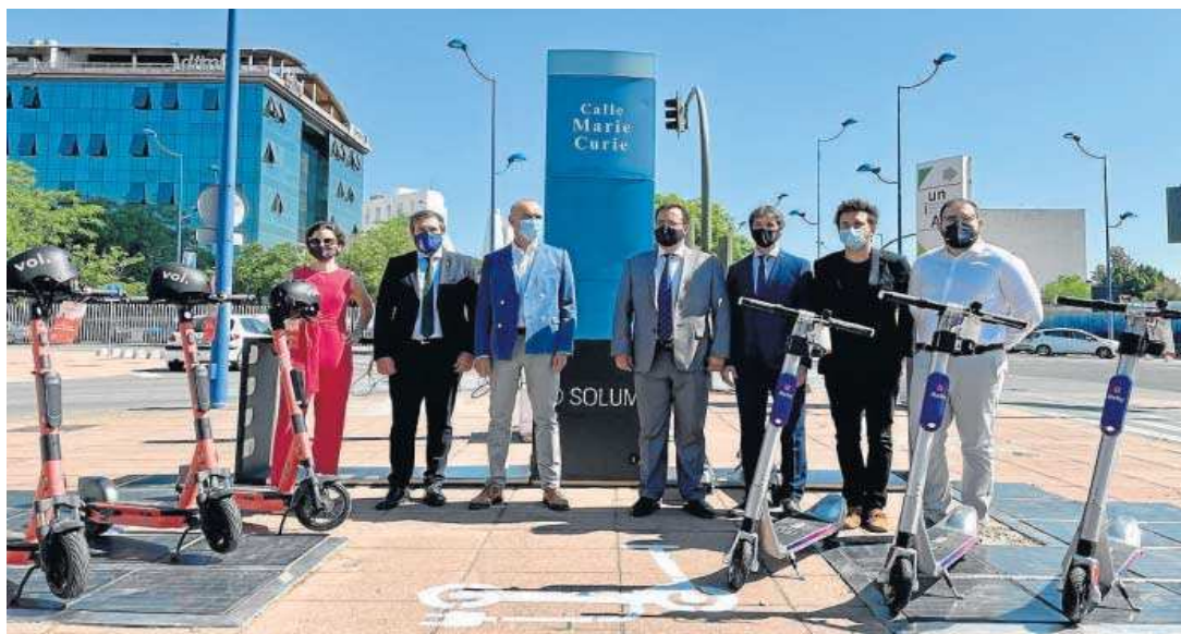
El punto de estacionamiento y recarga de patinetes eléctricos instalado por Solum en el PCT Cartuja. D.S.

ubicaciones, el número de plazas del futuro estacionamiento, el emplazamiento de las placas fotovoltaicas del mismo y los plazos barajados, sin obtener respuestas por parte del gobierno local”, lamentó.