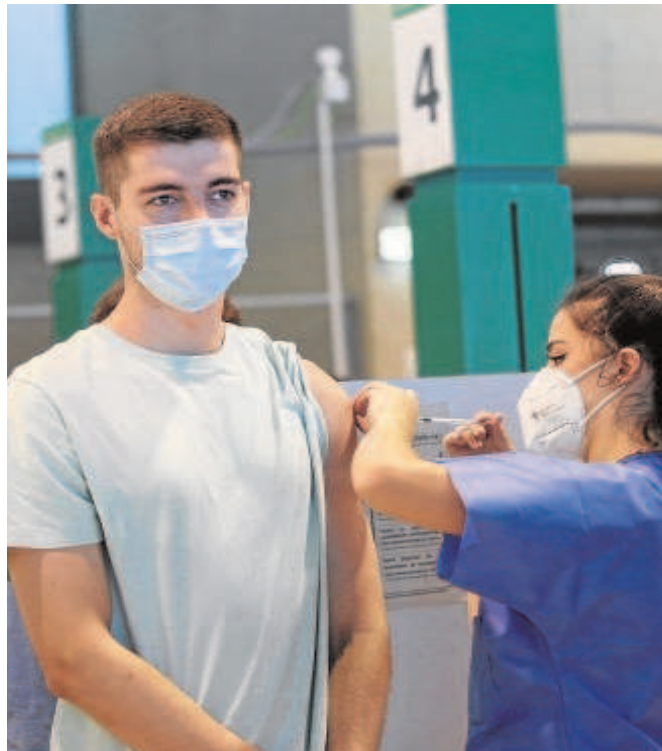
Un joven sevillano se vacuna contra el Covid en el estadio de la Cartuja

Pero si se analizan los datos de los jóvenes de 12 a 19 años que ya han conseguido la pauta completa, la provincia de Sevilla sigue estando también en las últimas posiciones. En concreto, en séptimo lugar con menos porcentaje, un 13,1%, merced a los 23.380 jóvenes que han recibido ya las dos dosis en el caso de las vacunas de los laboratorios de Pfizer, AstraZeneca o Moderna, o una sola para los inoculados con Janssen, que fueron los de grupos de riesgo con dependencia.