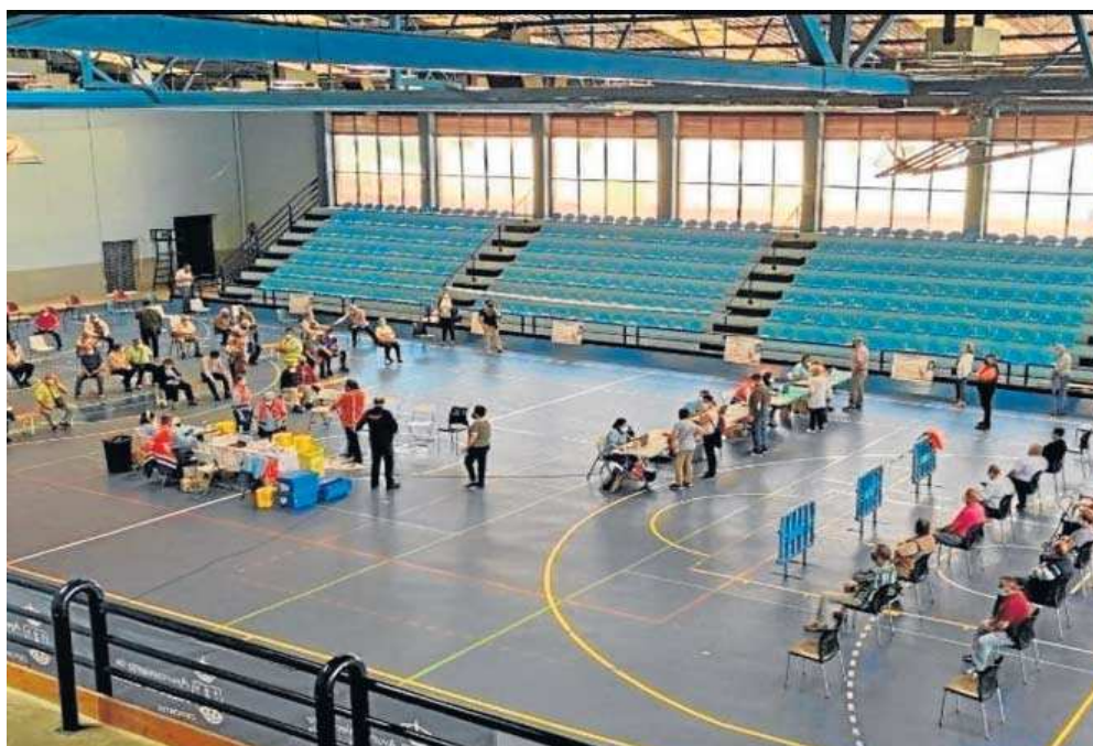
Varias personas en un punto de vacunación instalado en el pabellón deportivo de una localidad. M. G.