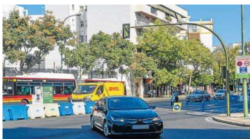
Un coche se salta los conos de la ronda y gira a Carretera de Carmona.

Desde que los cambios entraron en funcionamiento en julio se han realizado trabajos complementarios de regulación semafórica, reordenación de reservas y mobiliario urbano, etc. A día de hoy sólo faltan las actuaciones de recrecido de aceras en las dársenas anexas al carril bus, que se harán en septiembre.