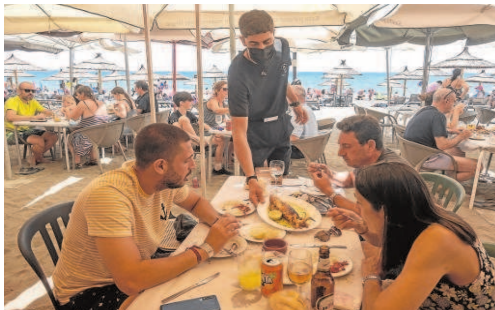
La hostelería es uno de los sectores que más tira del empleo en verano

Sevilla y Málaga se mantienen como las principales locomotoras del mercado de trabajo andaluz por volumen de empleo y acaparan más el 44% de todos los cotizantes de la comunidad, con casi 1,4 millones entre ambas provincias. En el caso de Sevilla, también los autónomos son los protagonistas de la recuperación económica tras la crisis de la pandemia y suman ya 115.505 altas, unas 6.000 más que hace dos años.