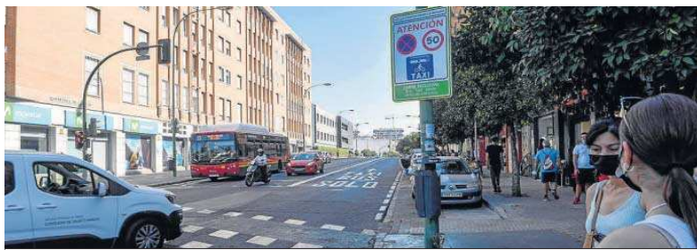
Otro coche se salta la prohibición de giro a Carretera de Carmona e invade el carril exclusivo para bus, taxi y moto.