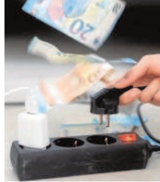
A pesar del verano, hubo ahorro // ABC

duce en un alza de cerca de 50.000 millones en los últimos doce meses. Desde febrero de 2020, el mes anterior a que estallaran los contagios de Covid-19, los españoles aumentaron sus depósitos en 90.900 millones de euros. Los cifras provisionales que publicó ayer el Banco de España muestran que, a pesar de la llegada de la temporada de verano y de las vacaciones, los españoles ahorraron un 0,12% más que en el pasado junio. De este modo, se