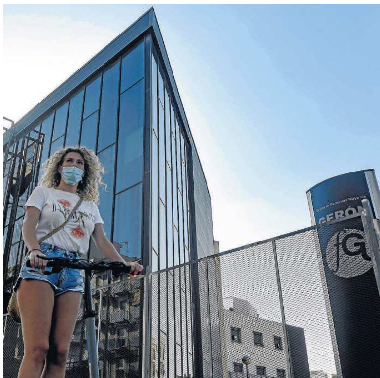
Parte de la fachada principal de la residencia de mayores Gerón en la capital, donde se ha declarado un brote.

Los peor parados siguen siendo los centros de Vitalia en Écija y Guadaíra, en Alcalá de Guadaíra, donde fueron comunicadas las primeras muertes. En el primero de ellos la cifra de fallecidos asciende a 14 tras las dos nuevas víctimas comunicadas el miércoles. Los positivos, por su