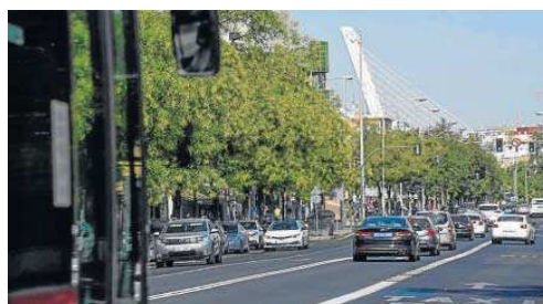
Doble sentido de circulación en la segunda ronda de la Macarena.