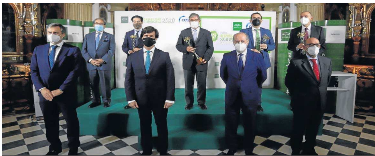
Foto de familia de los ganadores del galardón del año pasado.

Empresas. La Diputación de Sevilla, a través de Prodetur, la CES y Endesa convocan el galardón anual cuyo plazo de presentación de candidaturas cumple el 30 de septiembre