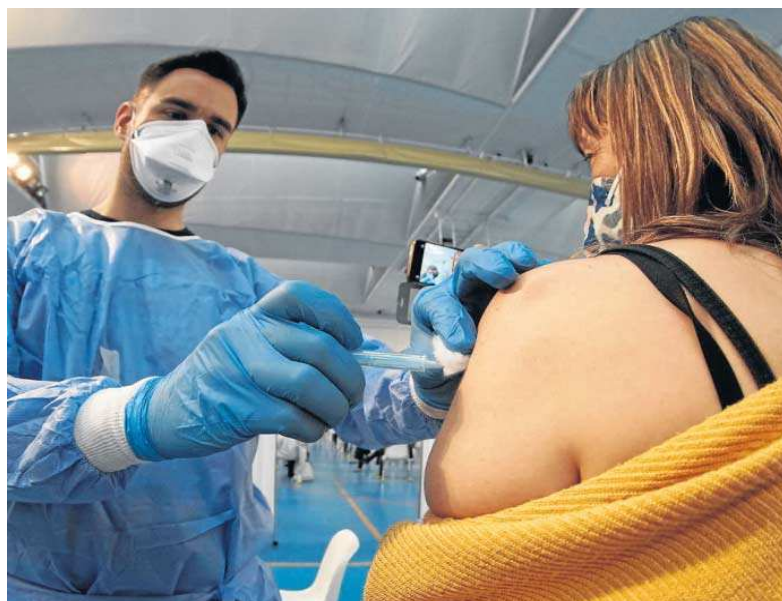
Un enfermero administra una vacuna a una mujer en un centro de vacunación en Sevilla.

Los datos de la pandemia ofrecidos por el consejero señalan que en Andalucía había ayer 1.145 ingresados con Covid-19, 76 menos que el día anterior, lo que evidencia que “una tendencia clara descendiente en esta quinta ola”.