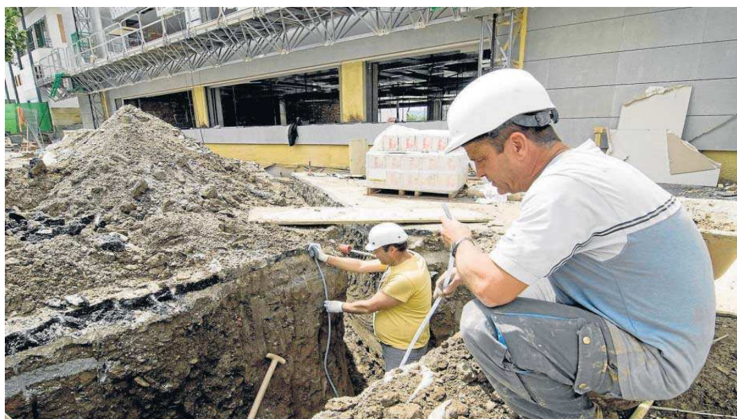
Trabajadores del sector de la construcción, el único en el que sí se garantiza el poder adquisitivo.

Por sectores, la mayor subida media es para la construcción, del 2,39%, y la menor es para la agricultura, del 1,12%, mientras que la de la industria se queda en el 1,37% y la de los servicios en el 1,51%. Además, de los 2.246 convenios vigentes, solo 406, el 18%, tienen cláusula de garantía salarial, que permite que el sueldo sea revisado al alza cada año en función de diferentes criterios –habitualmente la evolución de la inflación– para que no pierda poder adquisitivo. Respecto a trabajadores afectados, esas