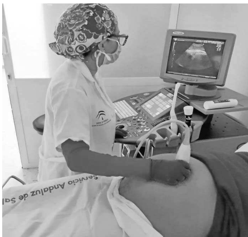
Una sanitaria le hace una ecografía a una mujer embarazada en un hospital malagueño.

A medida que la población adulta logra la protección de la vacuna frente al Covid-19, el virus busca