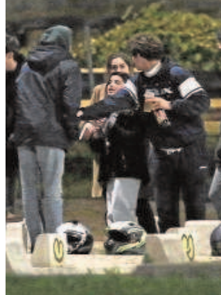
Imagen de un botellón

En cuanto al botellón, aseguró que es «evidente que Sevilla ha sufrido en estos meses un peligroso auge de este fenómeno», como muestran las 12.000 multas interpuestas por la Policía Local por beber en la calle. «Tenemos un problema con el botellón y el gobier-