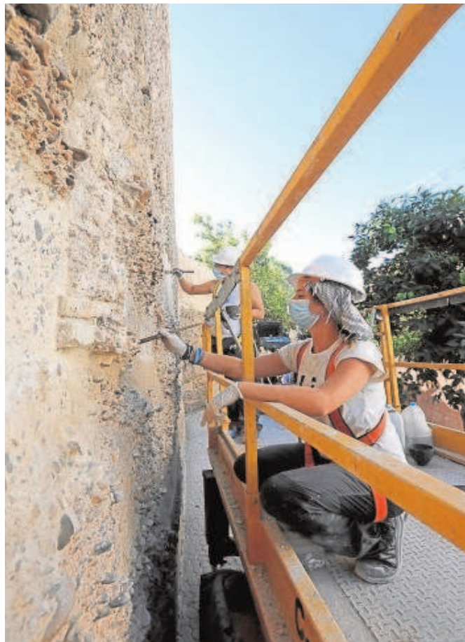
Una trabajadora, ayer en la Muralla de la Macarena

La muralla intramuros se ha dividido en tres cajones de obras verticales en función de criterios históricos (abajo, la restauración de 1985; a mitad del lienzo, la muralla original del siglo XII, y a partir de ahí un recrecido de época almohade), en los que se