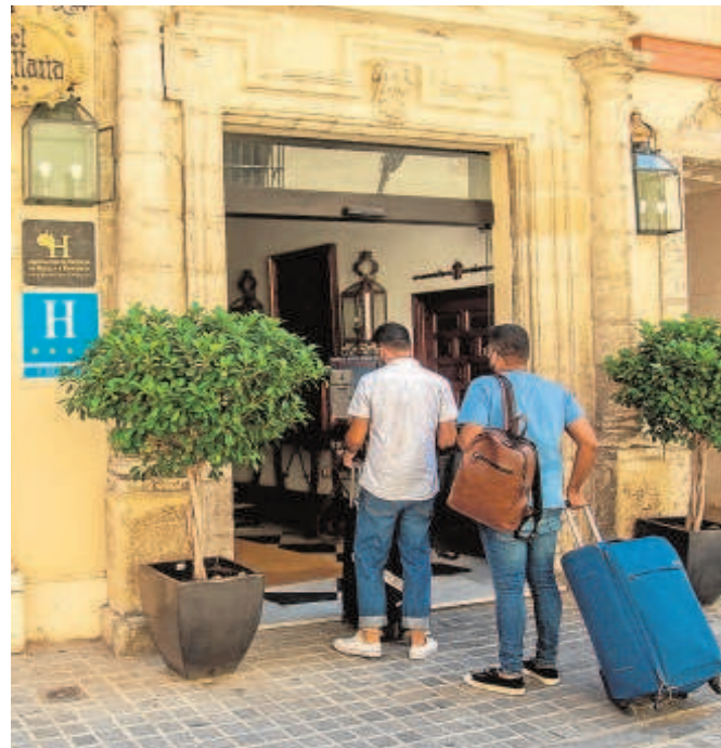
Dos turistas llegando a un céntrico hotel sevillano

El presidente del CES evaluó también la situación del sector turístico