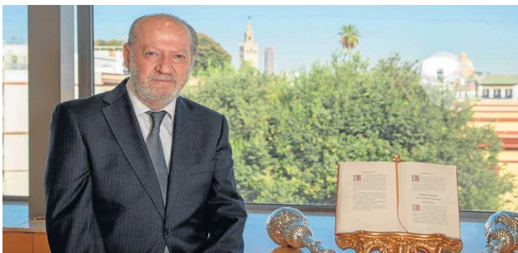
El presidente de la Diputación de Sevilla, Fernando Rodríguez Villalobos.

El objetivo está cumplido: las inversiones que se llevan a cabo