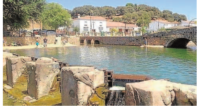
Playa de San Nicolás del Puerto.

playa de la provincia: la de San Nicolás del Puerto. Se trata de una de las mejores opciones para disfrutar de un buen baño con el que paliar las altas temperaturas de estos días agosteros de calor sofocante. Se encuentra localizada en pleno casco urbano y es artificial a medias, porque la infraestructura se construye alrededor del cauce del río Galindón. La Diputación de Sevilla promovió hace un tiempo la mejora de la accesibilidad en la playa artificial de San Nicolás del Puerto. Además en la zona se encuentran chiringuitos para restauración para disfrutar de una experiencia veraniega plena. De otro lado, hay un campo de arena donde se juega al voley y al fútbol playa como comple-