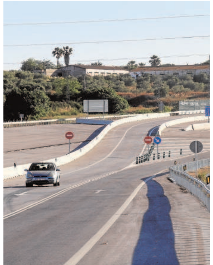
Obras de la SE-40 en zonas donde no se ha avanzado con más tramos

«Actualmente —señaló—, el tráfico de ida o vuelta a Huelva a través de la A-49 tiene que bajar obligatoriamente a la SE-30 para acceder a la Autovía de la Plata (A-66), a la A-4 hacia Madrid o a la A-92 hacia Málaga. Esto supone una aportación diaria de más de 20.000 vehículos a la SE-30 y una congestión del tráfico absolutamente innecesaria cuando además tenemos ya construidos importantes tramos de la SE-40. Se trata, por tanto, de que la SE-40 empiece a tener sentido y se desbloqueen tramos