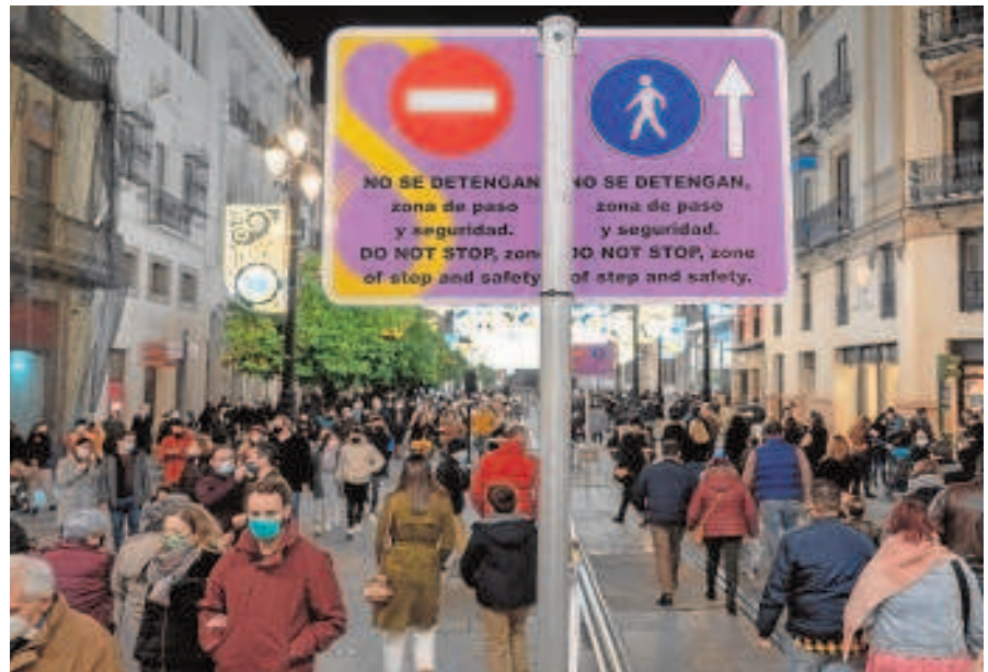
Tránsito regulado por la Avenida la pasada Navidad

De celebrarse si la situación epidemiológica lo permite, la Feria del año próximo volverá a desarrollarse íntegramente en mayo, ya que arrancará el domingo 1 de mayo y concluirá el sábado 7 de mayo. Esto significa que incluirá dos días festivos, el del primero de mayo (Día del Trabajador), que se traslada al lunes 2 de mayo por tratarse de domingo a efectos laborales, y el miércoles 3 de mayo, festivo local un año más. Esto y el hecho de que podría ser la primera Feria después de dos años suspendida hace prever una afluencia masiva al real.