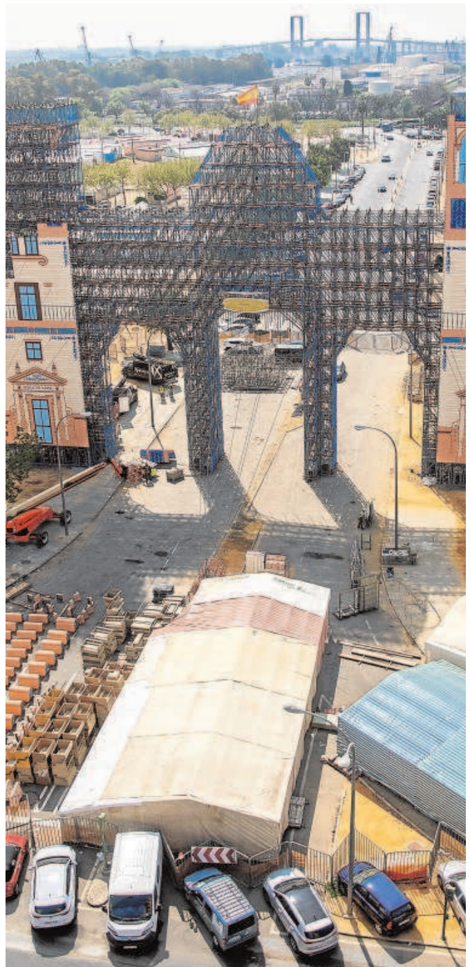
Portada que se tuvo que desmontar en 2020 al estallar la pandemia

López y su nuevo equipo han conseguido dar un importante impulso a la sección y ya se está trabajando en grandes proyectos pendientes vinculados