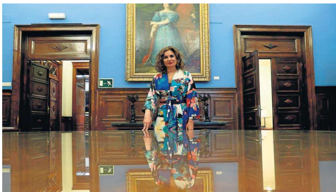
La ministra de Hacienda y Función Pública, María Jesús Montero, durante una entrevista con Efe en el Congreso de los Diputados.

En esta negociación presupuestaria –que ya ha comenzado con su socio de Gobierno, Unidas Podemos, y continuará con una ronda de contactos previa a la presentación del proyecto para garantizar que supera la fase de vetos– la ministra aspira a ampliar los apo-