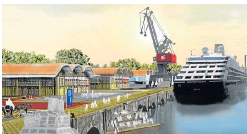
Reproducción virtual del Muelle de Tablada con el cambio de uso previsto.

La exposición del presidente del Puerto de Sevilla, Rafael Carmena, confirma los augurios pesimistas expresados hace ya tres años por la Asociación Parque Vivo del Guadaira con motivo de la aprobación del documento Delimitación de Espacios y Usos Portuarios: los desarrollos buscados por la Autoridad Portuaria frente a la ciudad son comerciales y patrimoniales, de ningún modo responden al in-