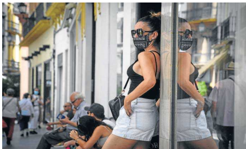
Una joven con mascarilla, ayer a las puertas de un comercio del centro. JUAN CARLOS VÁZQUEZ

Al cierre de esta edición había 223 personas hospitalizadas –14 menos que en la jornada del pasado miércoles–, de las cuales 39