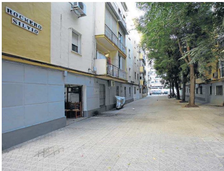
Uno de los tramos de la calle Rockero Silvio, en el barrio de Los Remedios.

Para el arbolado, se plantea mantener los ejemplares de la especie melia azedarach existentes, a excepción de tres unidades que el servicio de Parques y Jardines en un estudio pormenorizado realizado de los árboles, ha considerado conveniente eliminar por los riesgos que representan. Como propone este estudio de arbolado, para la renovación paulatina del arbolado al completo de estas calles, se crea una segunda