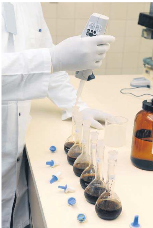
La mayor parte de los investigadores son de universidades andaluzas.

De los 40 investigadores elegidos, siete de ellos tienen “una di-