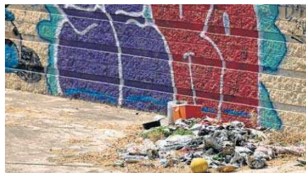
Basura junto a la caseta ocupada.