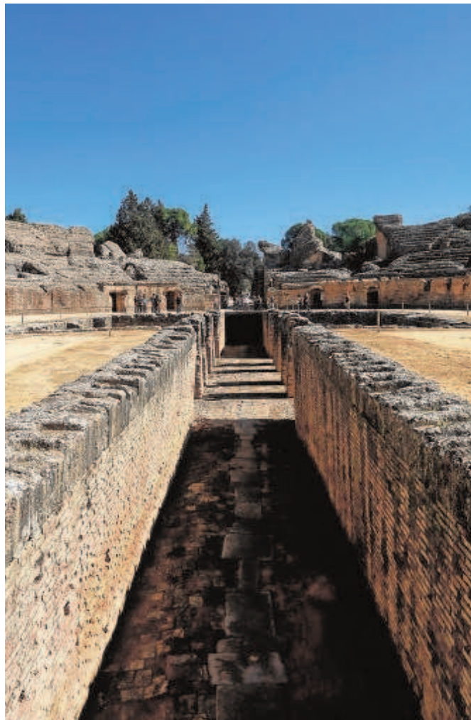
Itálica volverá a ser escenario cinematográfico // VANESSA GÓMEZ

Del mismo modo, este enclave caracterizado especialmente por su espectacular anfiteatro, que según el arqueólogo y doctor en Historia del Arte Alejandro Jiménez habría sido «el mayor construido nunca» por Roma fuera de la Península Itálica y «posiblemente el mayor» proyectado en su momento a excepción del famoso Coliseo o Anfiteatro Flavio, ha sido escenario del rodaje de escenas para el cortometraje 'Amanecer', de Samuel McFadden; y de imá-