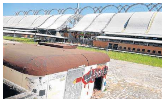
Un transformador de Endesa con parte de la pared tirada y abierta.

Los destrozos de la zona del canal opuesta al pabellón del Futuro contrastan con el arreglo de la otra orilla que da justoamente al Pabellón del Futuro que acoge el archivo andaluz citado. Los daños de la parte más