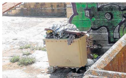
Ropa tirada en un contenedor junto a la caseta ocupada.

en un lugar público con una titularidad muy clara: la Junta de Andalucía. Es grave que la Junta, la administración responsable, no haya hecho nada para solucionarlo aun cuando en 2020 la dirección de Patrimonio de la consejería de Hacienda encargó a la agencia AVRA (dependiente