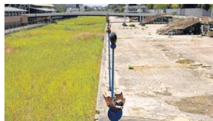
Las farolas de esta parte del canal llevan años destruidas.