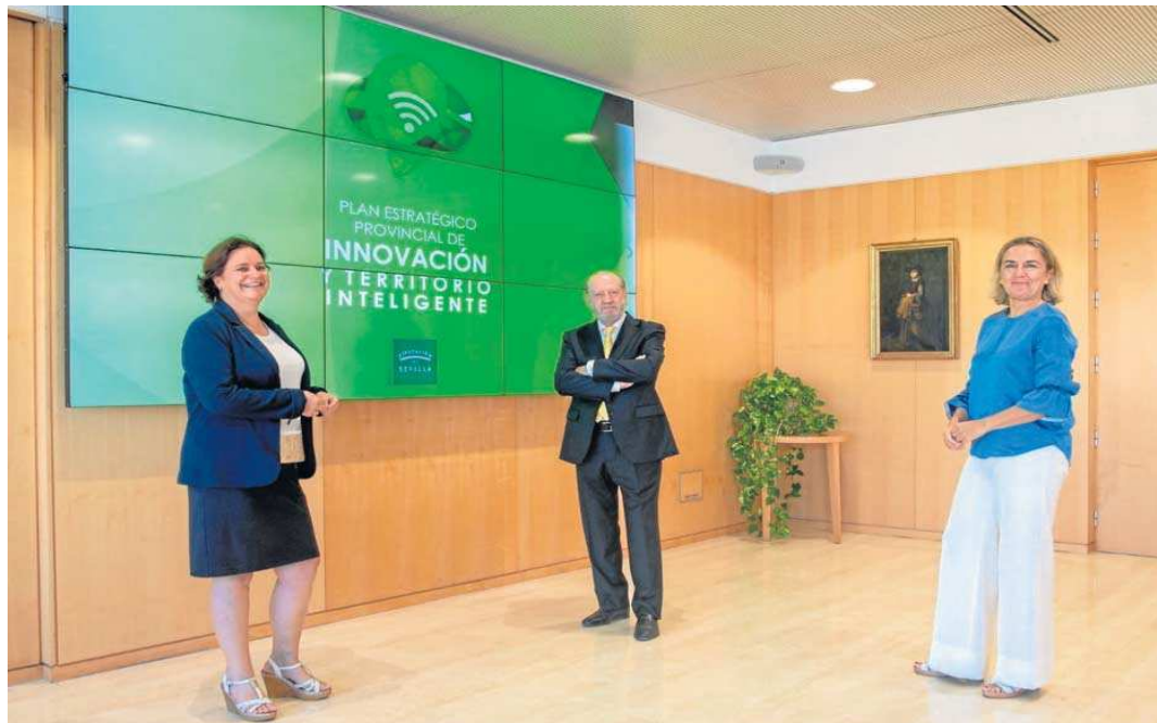
El presidente de la Diputación de Sevilla, Fernando Rodríguez Villalobos (en el centro), en una foto de archivo de la presentación del Plan Estratégico de Innovación.

Se trata de la puesta en marcha en el Conjunto Monumental de San Luis de los Franceses, joya del barroco sevillano y propiedad de la Diputación de Sevilla, de un proyecto piloto de plataforma inteligente de control del patrimonio histórico, que permite monitorizar deter-