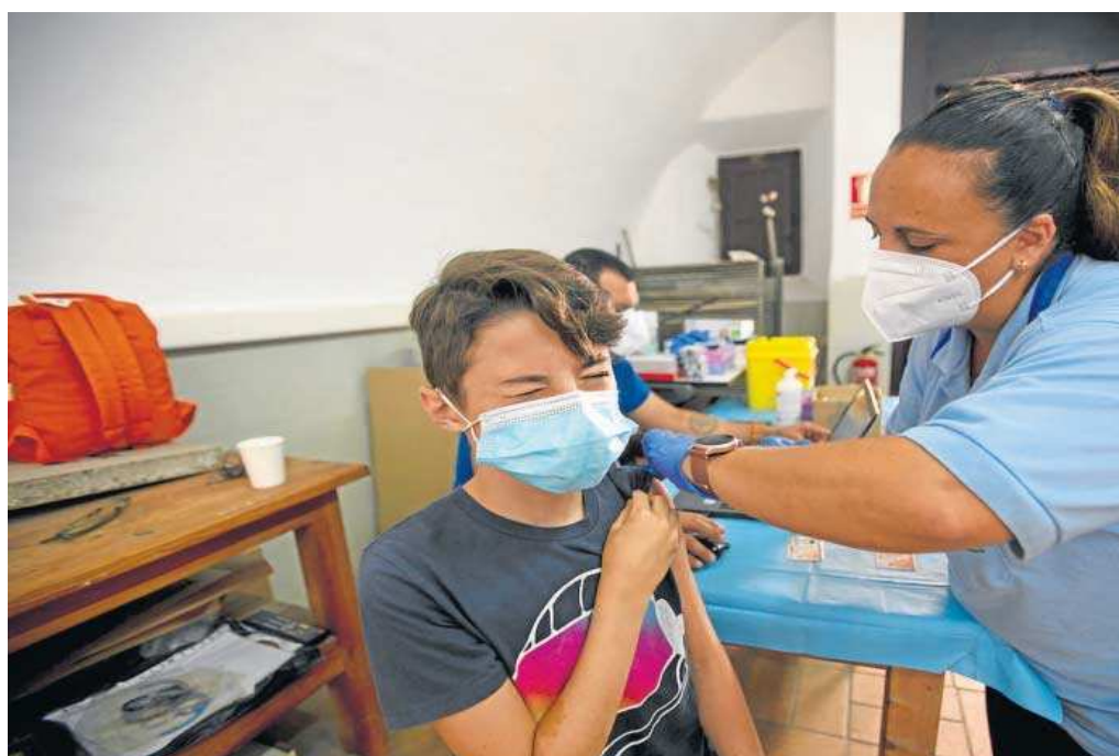
Un niño de 12 años recibe la vacuna en un centro de vacunación de Cádiz.