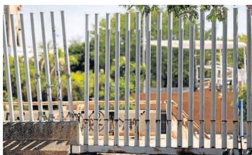
Una de las tres aberturas por donde se cuelan al canal.