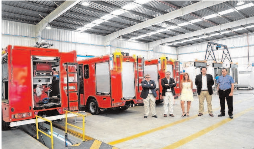
Directivos de Surtruck en las instalaciones del polígono empresarial Los Espartaes, en La Rinconada (Sevilla)