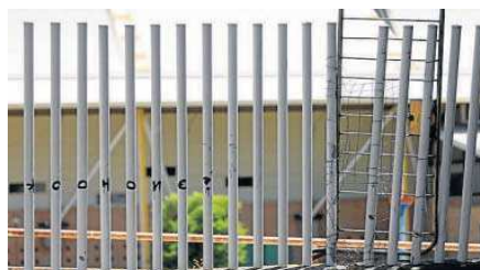
Una valla metálica de tráfico colgada en un hueco del vallado.