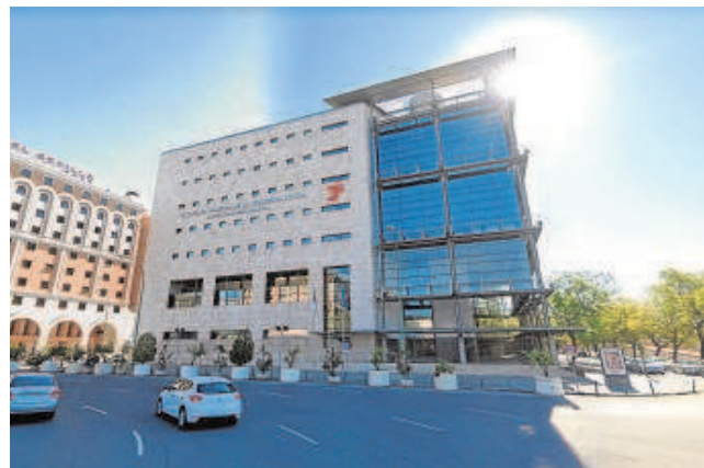
Sede de la Seguridad Social en Sevilla

Esto es, la empresa no solo dio de baja al trabajador en Seguridad Social, sino que en el finiquito dio por finalizada la relación laboral, hubo voluntad de extinción de la relación laboral, que conlleva apreciar la existencia de un despido, que debe ser calificado como improcedente por defecto de forma. La declaración de incapacidad permanente total del trabajador hace inviable la posibilidad de readmitir al trabajador, por lo que el único término admisible de condena a la empresa es la de indemnizar en los términos legales al trabajador despedido. En este caso, en 153.316 euros.