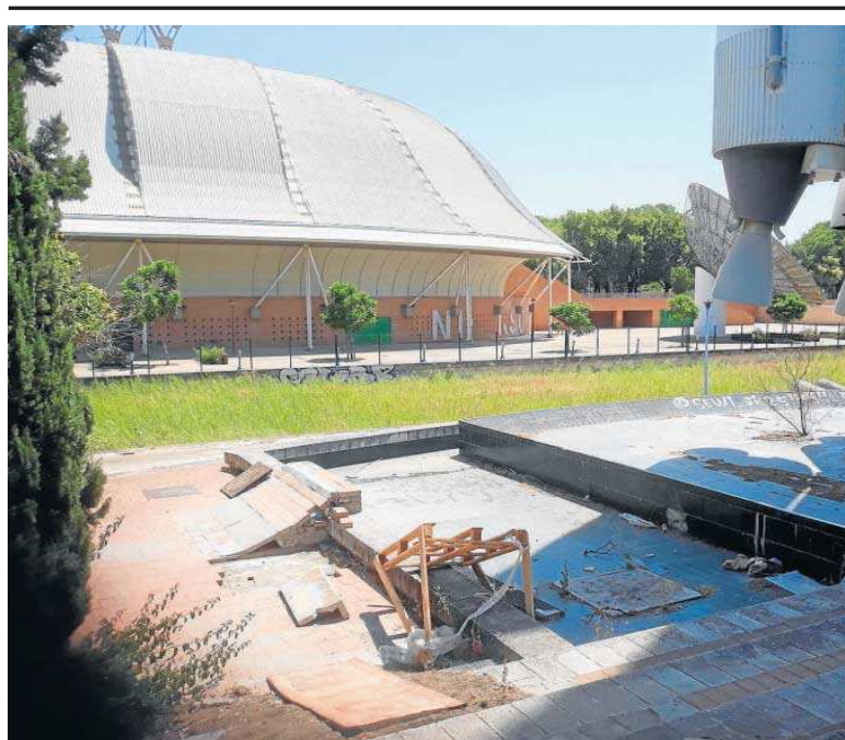
Las losetas de la zona de la lanzadera Ariane 4 han servido para construir esta pista de skate casera.