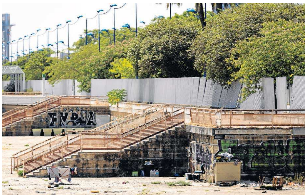
Dos tendereros con ropa, basura y enseres, botellas de agua y la valla forzada por varios puntos junto a la caseta ocupada del canal de la Cartuja.