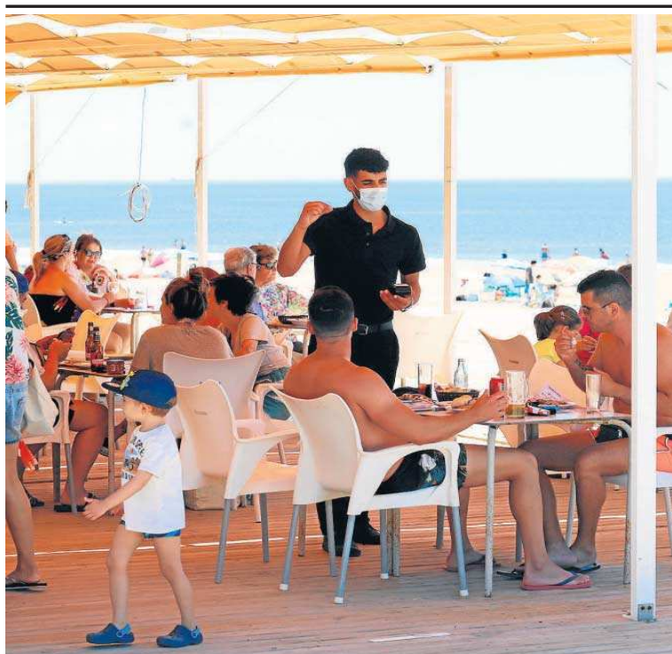
Un chiringuito en la playa de La Bota, perteneciente a Punta Umbría.

El principal problema es, hoy por hoy, la falta de vacunas. Pero Andalucía recibirá en agosto 2,2 millones de dosis de Pfizer y Moderna, las vacunas de ARN mensajero que son el principal pilar del proceso. Esta cantidad es suficiente para avanzar, superar ese 70% de población inmunizada y acercarse a esas metas. Pero en sep-