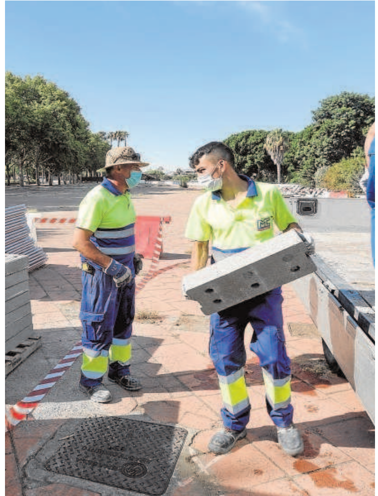
Operarios colocan el vallado para delimitar la zona de obras en el paseo de la calle

La reurbanización va a suponer más árboles y jardines, equipamiento infantil y mejorar el degradado pavimento