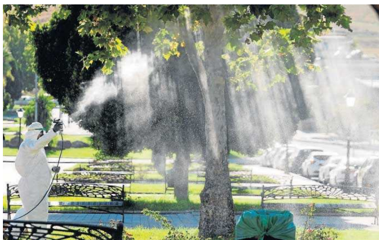
Un operario fumiga unos jardines en La Puebla del Río, el verano de 2020.

Por parte de los técnicos de Salud se inició en la necesidad de completar los planes municipales de ambas localidades, tal y como han hecho el resto de municipios afectados, abarcando no sólo el núcleo urbano principal, sino también otros