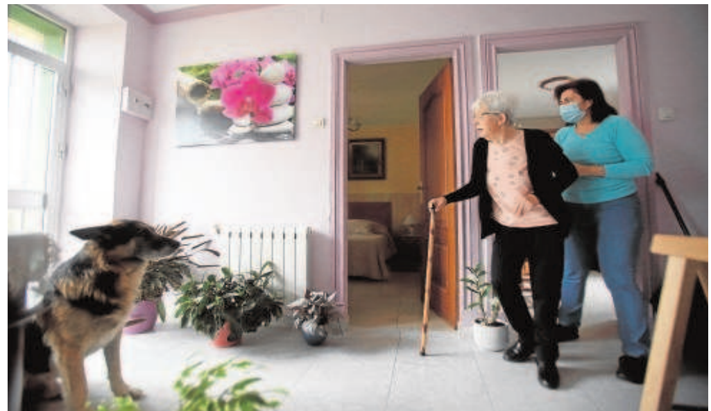
El número de personas dependientes crece de forma paralela al de la esperanza de vida

Andalucía representa el 20,5% del total de personas beneficiarias a nivel nacional, lo que significa que 1 de cada 5 personas en España son atendidas en esta comunidad autónoma. Además, la comunidad andaluza se sitúa por encima del promedio nacional en cuanto al número de personas beneficiarias con prestación sobre el total poblacional de cada comunidad, con 2,81 puntos respecto al 2,44 de la media del país. Las prestaciones con las que cuentan las personas en situación de dependencia también han experimentado un incremento, con 15.244 más que a inicios del año, 2.040 de ellas en Sevilla. A cierre de junio, Andalucía alcanza las 325.668 prestaciones, con una ratio de 1,37 prestaciones por persona beneficiaria.