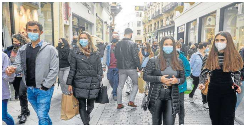
Imagen de archivo de gente en la calle durante las fiestas navideñas.