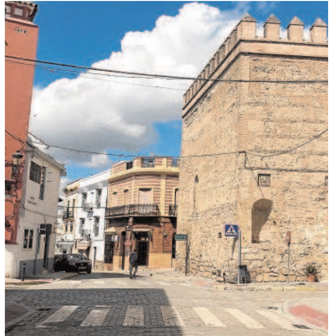
Una calle de Marchena durante el primer confinamiento

Sevilla (1.062 y 92). Además, hay otros cuatro pueblos que superan el millar de casos pero se salvan de esta medida al tener una población inferior a los cinco mil habitantes, como Cañada Rosal (con una tasa de 1.233 y 41 casos activos), Alanís de la Sierra (1.055 y 18), La Puebla de los Infantes (1.006 y 30) y Villanueva del Río y Minas, con una