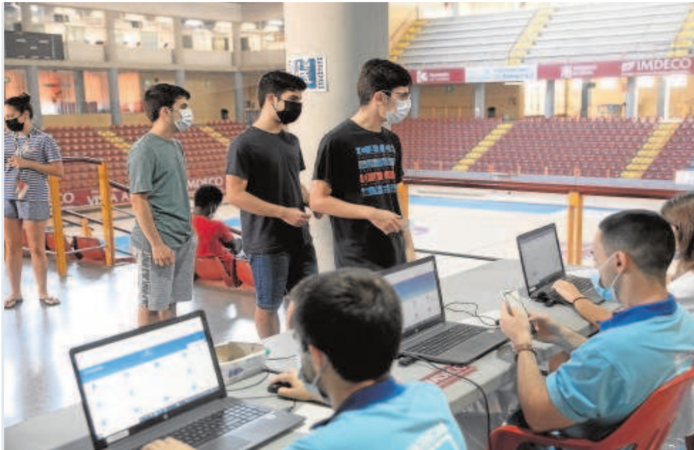
Jóvenes acuden a su centro de vacunación para recibir la primera dosis