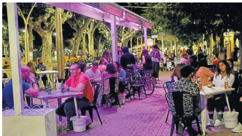
Clientes de un bar de copas disfrutan de la terraza en una noche de verano.

En este punto, el teniente de alcalde respaldó a los hosteleros sevillanos en sus críticas por esta última medida propuesta por el