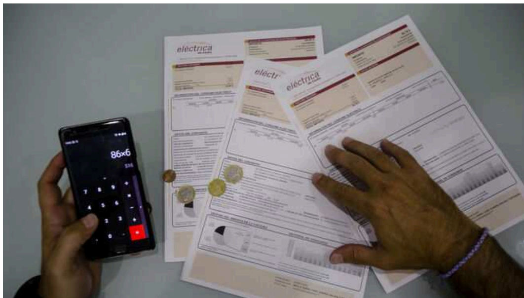
Un usuario calcula cuánto tendrá que pagar de luz comparando facturas.

La organización de consumidores Facua ha denunciado ante la Comisión Nacional de los Mercados y la Competencia ( CNMC ) a las comercializadoras de referencia de los grupos Endesa, Iberdrola y Naturgy por supuestas irregularidades en la información que facilitan en sus nuevas facturas de la luz .