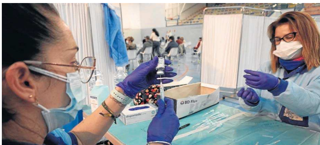
Una enfermera rellena un vial con la vacuna contra el Covid-19.