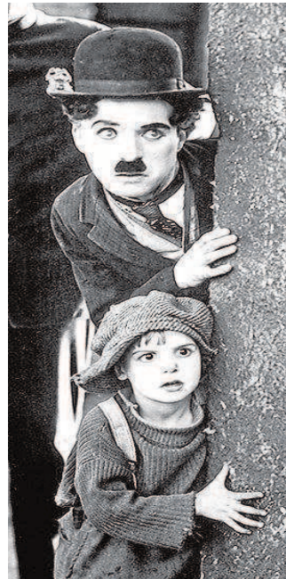
Fotograma de 'El Chico'

«El público sevillano continúa siendo fiel a la magia del Cine de Verano, como se infiere de las cifras de espectadores que presentamos en este final de temporada», explicó el diputado provincial de Cultura y Ciudadanía, Alejan-