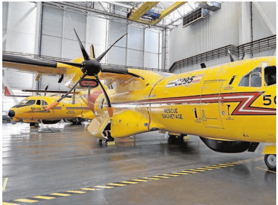
Imagen de dos C295 en la planta de San Pablo, donde se realiza la mayor parte de la fabricación de esta aeronave

El último gran pedido que había sellado Airbus fue en 2017, cuando se culminó la venta de 16 unidades para