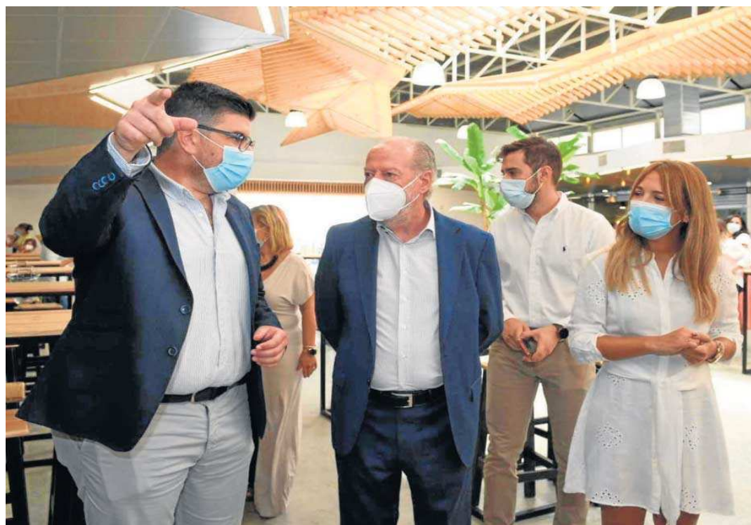
El alcalde y el presidente de la Diputación recorren las nuevas instalaciones de la plaza de abastos.

Visita: El presidente de la Institución Provincial asistió al acto inaugural