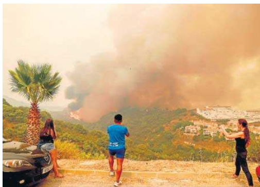
Vecinos de la zona hacen fotos del incendio.

Pese a "estar evacuados todavía", aseguró que ella y su familia estaban "bien", aunque la noche la vivieron "inquietos, porque arriba hay 300 viviendas que desalojaron y nosotros somos un grupo de chalés que está debajo con 33 viviendas y el fuego lo tenemos a menos de 100 metros", relató. Sobre el regreso a su hogar, la mujer indicó que, de momento, "no se puede entrar todavía en la zona, están trabajando los bomberos y están los helicópteros", por lo que señaló que "no sabemos más nada, está cerrado". Así, el planteamiento de la familia fue pasar el día "cogiendo un hotel porque hay que ducharse y asearse y volver a ver si todo está bien".