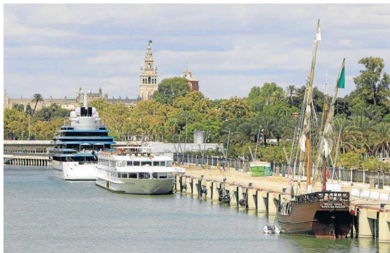
La carabela 'Vera Cruz', en el Muelle de las Delicias junto al megayate y otra embarcación de recreo. JOSÉ ÁNGEL GARCÍA

En esta ocasión, la llegada de esta réplica forma parte del proyecto transfronterizo Magallanes: Em-