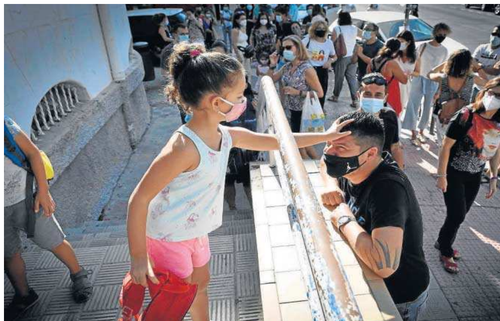
Una niña se despide de su padre antes de entrar en el colegio.