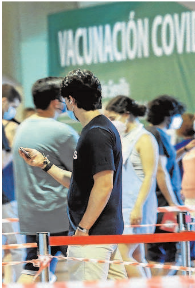
Varias personas hacen cola para vacunarse en el estadio de la Cartuja

En la actualidad hay hospitalizadas 166 personas en la provincia (tres menos que el día anterior), de las cuales 37 lo hacen en la UCI