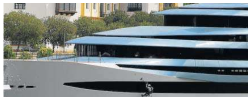
Un operario realiza labores de limpieza en el megayate 'Kaos'.

rismo, pues está previsto el atraque del Hebridean Sky en el mes de diciembre, que tradicionalmente era un mes sin llegadas de estas embarcaciones de recreo en el calendario. Este crucero tiene previsto amarrar en Las Delicias el 29 de noviembre y el 19 de octubre. Hay varios que están sin confirmar a la espera de tramitar autorizaciones sanitarias.