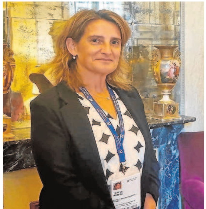
Teresa Ribera, vicepresidenta y ministra de Transición Ecológica

Detrás de estos costes que rompen techos día tras día se encuentra, sobre todo, el encarecimiento del gas por los problemas de suministro y el aumento de la demanda en los países asiáticos. Ayer, el precio del gas se situaba en 57,98 euros el MWh, según los datos publicados por Mibgas. También repercuten los derechos de emisión de dióxido de carbono, es decir, la tasa que se desembolsa por emitir CO 2 a la atmósfera dentro del programa europeo de transición energética. El encarecimiento de la electrici-