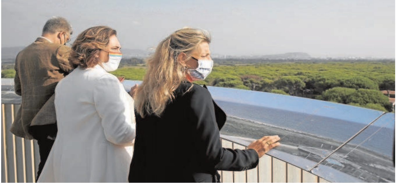
Yolanda Díaz y Ada Colau visitaron ayer el espacio protegido de la laguna de la Ricarda, en El Prat de Llobregat (Barcelona)