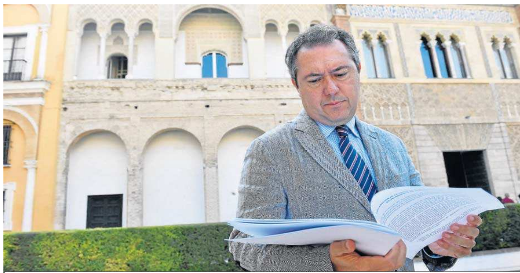
El alcalde de Sevilla, Juan Espadas, en el Patio de la Montería del Real Alcázar.