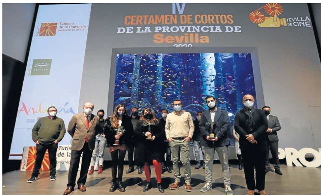
Foto de familia de los ganadores del año pasado junto al presidente de la Diputación de Sevilla, Fernando Rodríguez Villalobos.