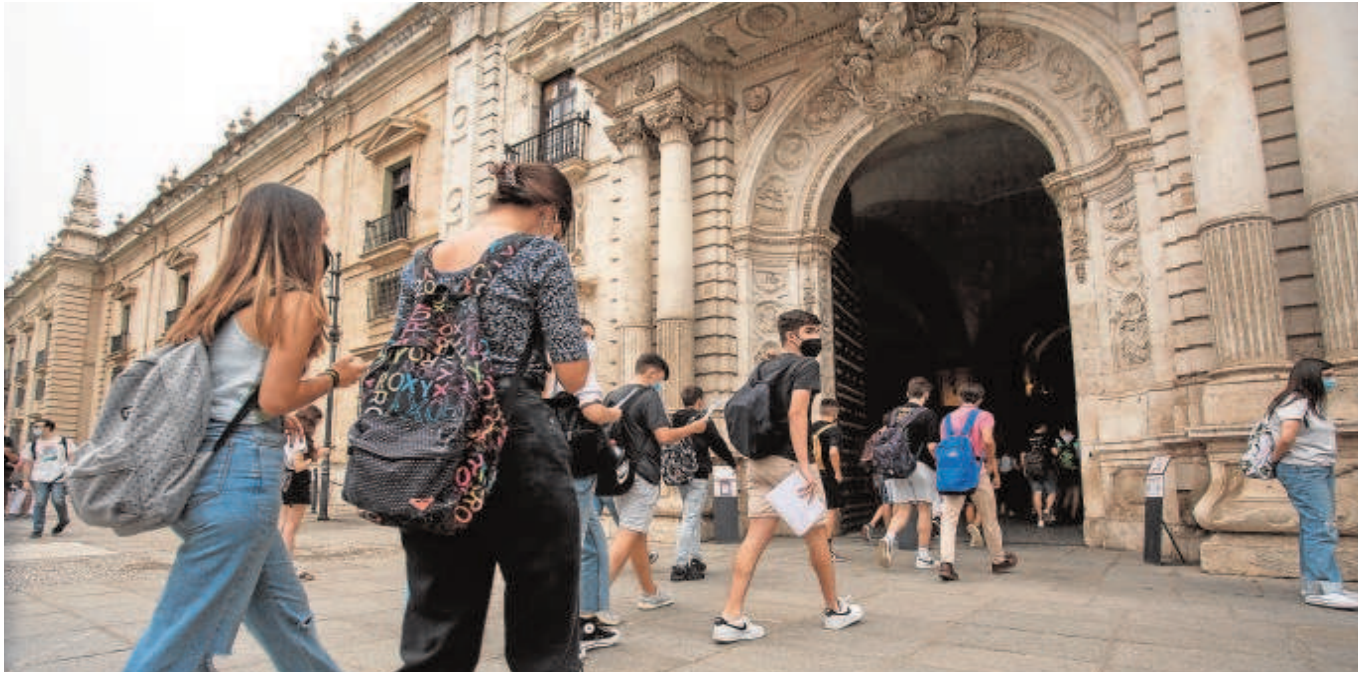
Estudiantes entrando en la Universidad de Sevilla el pasado mes de junio