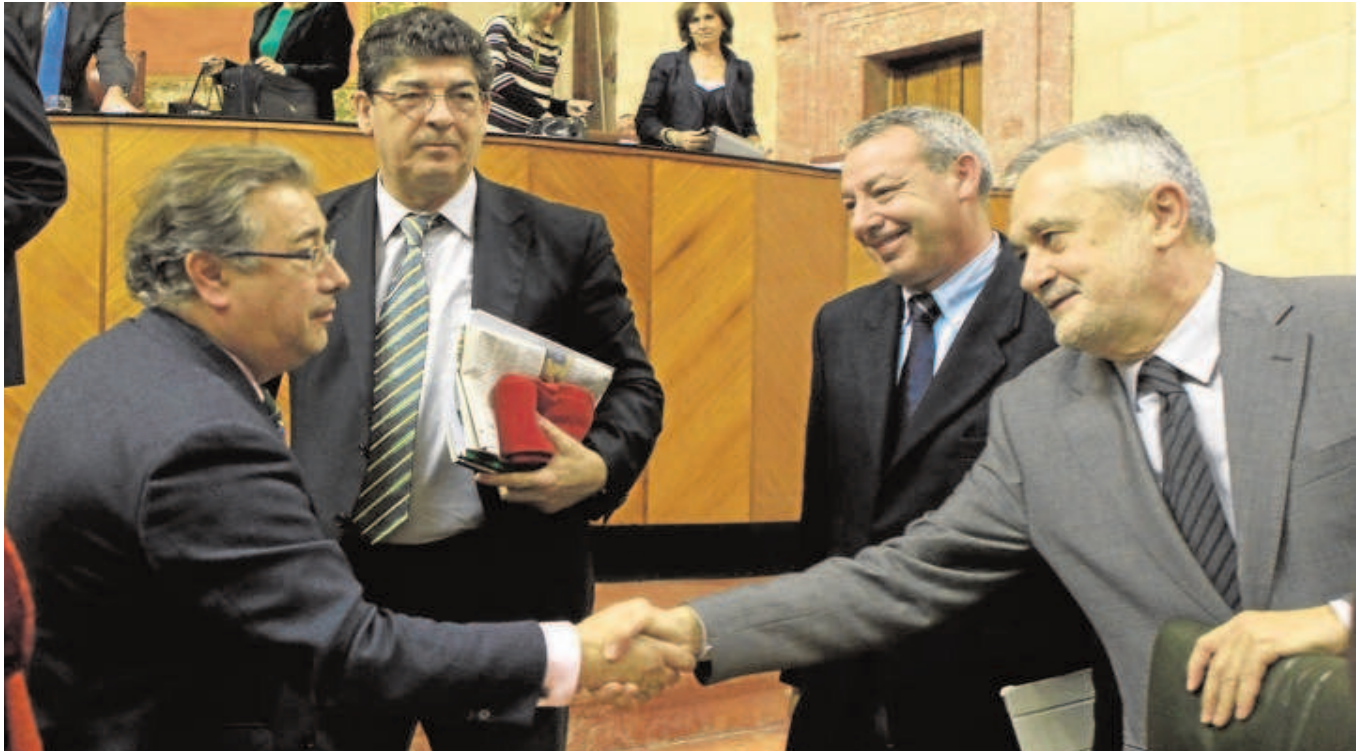
El expresidente del PP-A Juan Ignacio Zoido (i) saluda a José Antonio Griñán (d), tras aprobar las cuentas de la Junta de 2013, en presencia de Diego Valderas