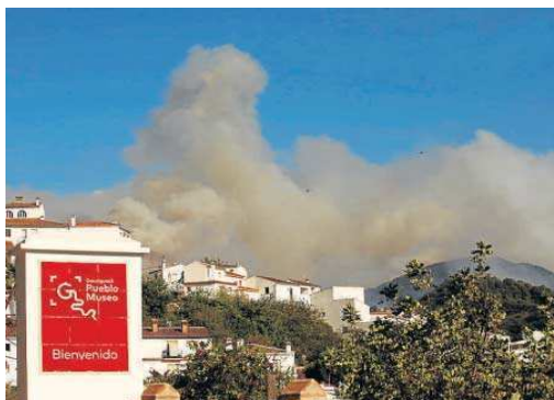
El humo revela el fuego próximo al municipio de Genalguacil.