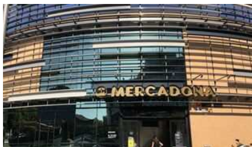
Entrada de la tienda de Mercadona en Plaza de Armas de la capital hispalense.

Además, difundirá en colaboración con la campaña #EActíVate un vídeo sobre las principales ventajas del supermercado de proximidad en materia de movilidad.