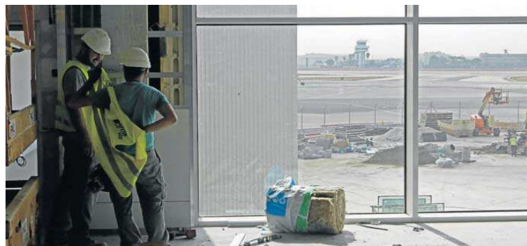
Trabajos en la zona sur y al fondo, la torre de control.