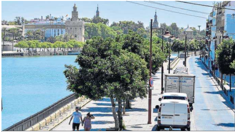
Vista de la calle Betis desde la plaza del Altozano.

Distribuido para CONFEDERACIÓN DE EMPRESARIOS DE SEVILLA * Este artículo no puede distribuirse sin el consentimiento expreso del dueño de los derechos de autor.