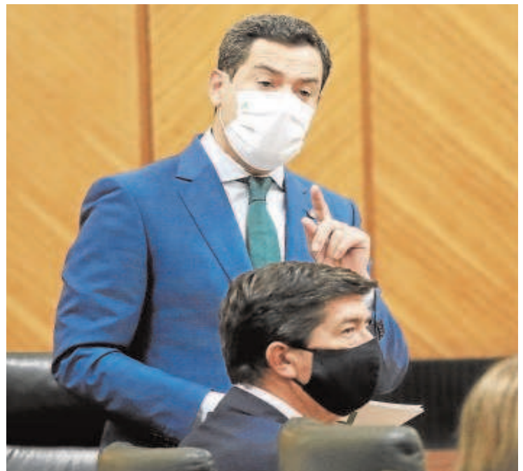
El presidente de la Junta, Juanma Moreno, ayer en el Parlamento andaluz

Sin embargo, el consejero ha explicado que la Junta tratará de reducir el impacto económico de esta medida. «Es una situación de difícil ajuste en