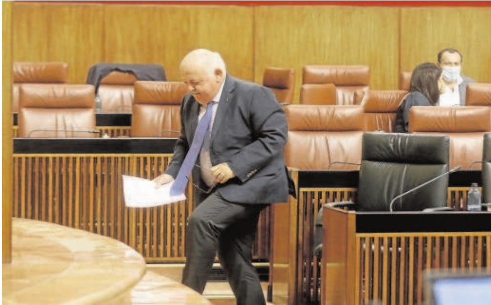
El consejero de Salud y Familias, Jesús Aguirre, el pasado miércoles en el Parlamento andaluz