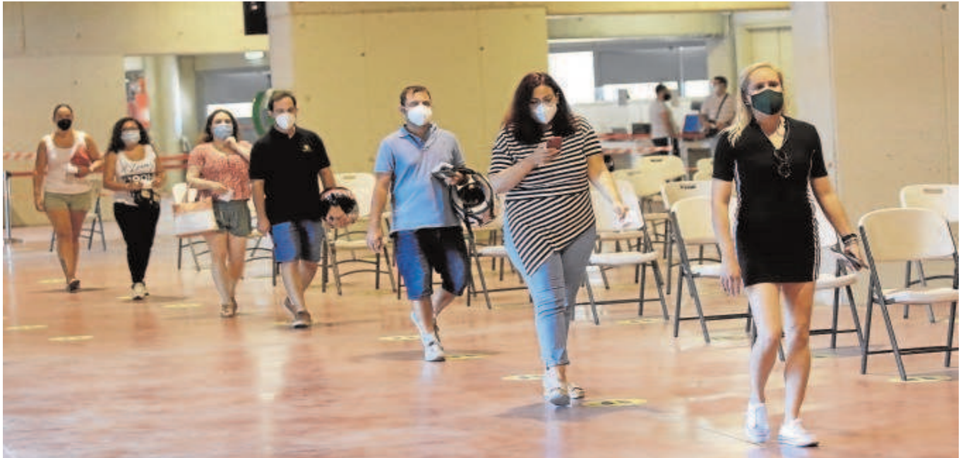
Un grupo de personas aguardan su turno para ser vacunadas en el estadio de la Cartuja de Sevilla