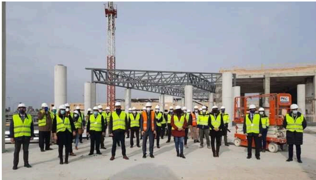
Representantes del sector turístico en el Aeropuerto de Sevilla durante una visita a las obras.

Una de las claves de los logros del Aeropuerto de Sevilla antes de la pandemia, cuando superó el récord de 7,5 millones de viajeros, fue la alianza entre las instituciones y las empresas. El comité de Conectividad Aérea de Sevilla se reveló como un instrumento institucional de cooperación eficaz y fue remodelado y ajustado en 2020 para afrontar la nueva etapa.