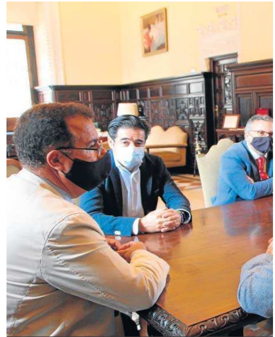
Reunión entre el Ayuntamiento y los hosteleros ayer en la Casa Consistorial.

Ponen como ejemplo el "éxito" de la intervención en Mateos Gago