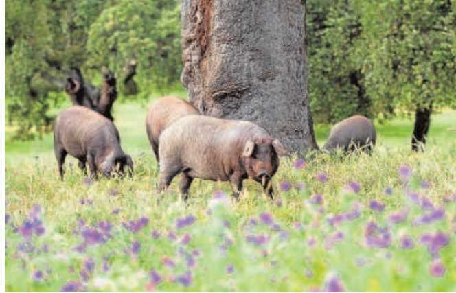
Cerdos de Sánchez Romero Carvajal en una dehesa