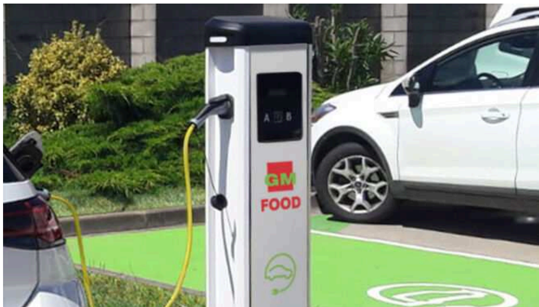
Aparcamiento con recarga para vehículo eléctrico.

El formato del supermercado de proximidad permite múltiples formas de practicar la movilidad sostenible y se sitúa como uno de los formatos comerciales que mejor contribuye a la reducción de emisiones en la movilidad por motivo de compra.