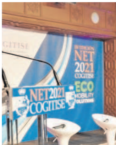
ada de movilidad de ayer

ros. Eso hace el servicio más atractivo y, por tanto, crecerá su demanda», señaló. Muñoz-Atanet recalcó que estas facilidades en el pago, junto con una mejor información sobre los tiempos de llegada, harán crecer el número de usuarios, permitiendo que el ciudadano opte más por el transporte público en detrimento del privado.