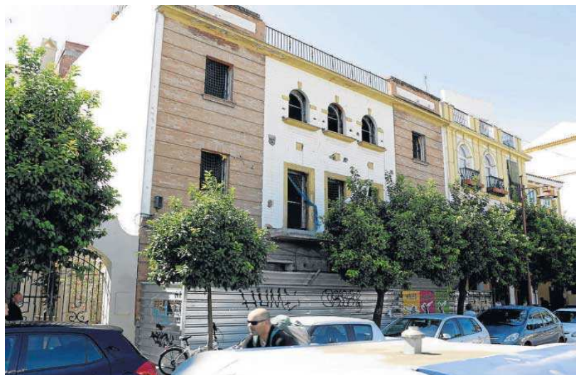
Obras en la parte del edificio de la calle Betis, donde estaba la entrada principal a la discoteca.

tramo de paseo fluvial que existe actualmente en Triana y donde ya se ejecutó el Muelle Camaronero. La intención ahora es prolongarlo hacia el norte, con los suelos públicos que se sitúan por delante de la antigua Comisaría de Policía, hasta llegar al Puente de Triana y conectar con el Paseo de la O. También se posibilita dar continuidad al paseo de ribera por el sur hasta llegar a las instalaciones del Club de Labradores y en el frente de la antigua Fábrica de Tabacos de Altadis. Esta recuperación del río cambiaría bastante la estética de la zona.