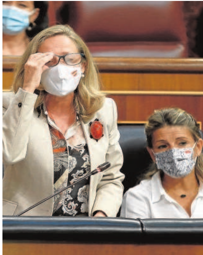
Nadia Calviño y Yolanda Díaz en el Congreso

El movimiento llega además en un momento en que en el diálogo social se percibe un declive en la influencia de Calviño en el seno del Ejecutivo, según coinciden varias fuentes de las negociaciones consultadas por este diario. En el entorno del Gobierno, de hecho, se asegura que la relación de la vicepresidenta primera con el presidente Pedro Sánchez se ha desgastado en los últimos meses: «Calviño antes era una persona cercana al presidente y, además, necesaria para su