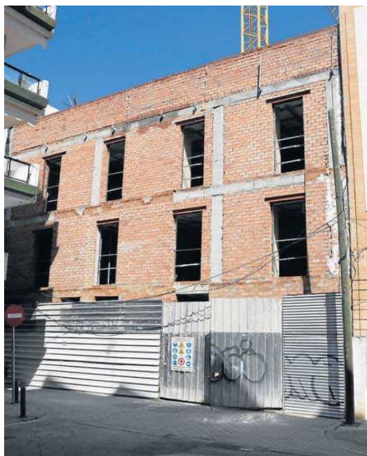
Fachada del inmueble que mira a la calle Fortaleza.

Los planes han cambiado para uno de los lugares de moda de la noche sevillana durante la primera década del siglo que tuvo numerosas quejas y denuncias debido a la concentración de personas junto a la discoteca. La imagen de calle Betis cambiará también en los próximos meses con la recuperación de la parcela de la antigua comisaría de la Policía Nacional, lo que permitirá dar continuidad al