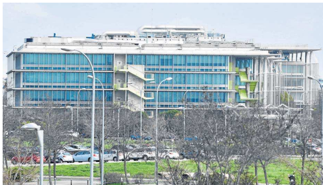
Sede de Abengoa en Sevilla, en el Campus de Palmas Altas.

“Los accionistas instantes del complemento deberán justificar, ante el Registro Mercantil de Sevilla, el carácter actual de su condición de accionistas de la Sociedad, en el plazo de los cinco (5) días siguientes a la publicación del presente complemento. En el supuesto de que no quede acreditada la representación alegada quedará sin efecto el complemento solicitado, por lo que el orden del día sería exclusivamente el publicado con fecha 30 de