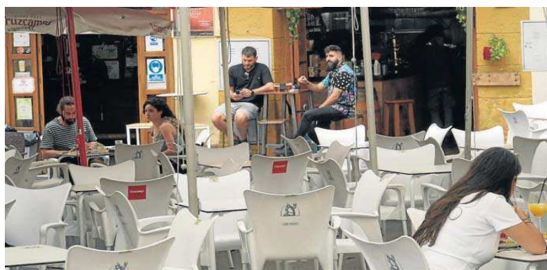
La terraza de un bar en la capital durante el pasado mes de junio.

En este sentido, el también vicepresidente de la Federación de Empresarios de Hostelería de Andalucía clama por la llegada de la normalidad al sector como la "única vía" para "salvar negocios y crear empleo". Por ello, aplaude la nueva medida adoptada por el Comité Regional de Alertas de Salud Pú-