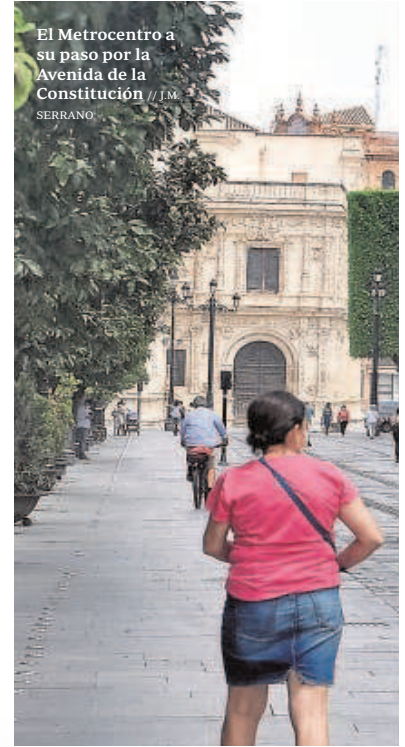
El Metrocentro a su paso por la Avenida de la Constitución // I.M. SERRANO

Todas las alternativas de transporte público cubren el trazado de la línea 2 que resulta mucho más rápida y eficaz