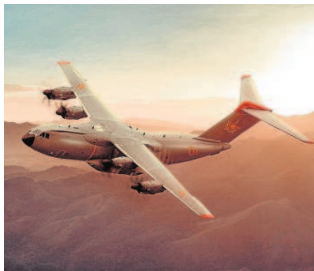
El A400M es un avión turbohélice y cuatrimotor

Con la capacidad de adaptarse en el conjunto de equipos del país, desempeñando misiones militares, civiles y humanitarias, «el A400M permitirá a Kazajistán responder con rapidez a cualquier crisis desplegando capacidades decisivas a larga distancia y facilitando un acceso eficaz a zonas remotas», destaca Airbus.