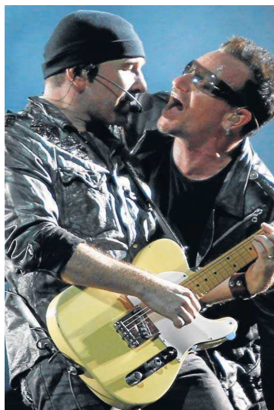
Concierto de U2 en la Cartuja, que busca cómo retomar estas citas.

Rocío Jurado sólo hay previstos este mes dos espectáculos: el primero será el 11 de septiembre, un concierto de Morat y Omar Montes; y el segundo, otro del rapero puertorriqueño Myke Towers, anunciado para el 16 de septiembre. El concierto que La Polla Records tenía previsto dar junto a Reincidentes y Gérmenes en septiembre en el auditorio al aire libre se ha trasladado al día 11 en el Centro Andaluz de Arte Contemporáneo (CAAC), al haber vendido pocas entradas. De momento, si no hay cambios, también hay prevista una cita con Estopa para mayo de 2022. El desacuerdo entre el gestor de esta instalación y el Ayuntamiento, pues se trata de una conce-