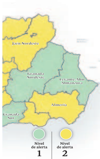
Hay cuatro niveles de alerta. Estos niveles, del 1 al 4, se determinan en función de varios factores, principalmente el número de contagios y la ocupación hospitalaria

31 menos que el martes y 811 menos que los que registró el miércoles de la semana pasada.