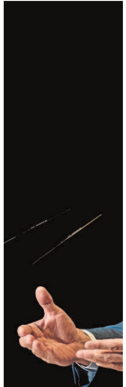
El presidente abrió el curso político ayer en la Casa de América

Por otro lado, con el precio de la luz marcando hoy un nuevo récord histórico (más de 140 euros el megavatio hora), Sánchez se comprometió a «actuar» hasta «solucionar el alza del precio de la luz». Eso sí, no avanzó ninguna medida concreta ni atisbó solución alguna. Igual que la vicepresidenta Teresa Ribera, el jefe del Consejo de Ministros se abrió a constituir una comisión parlamentaria para el estudio del sector energético. «Vamos a escuchar las diferentes propuestas de los gru-