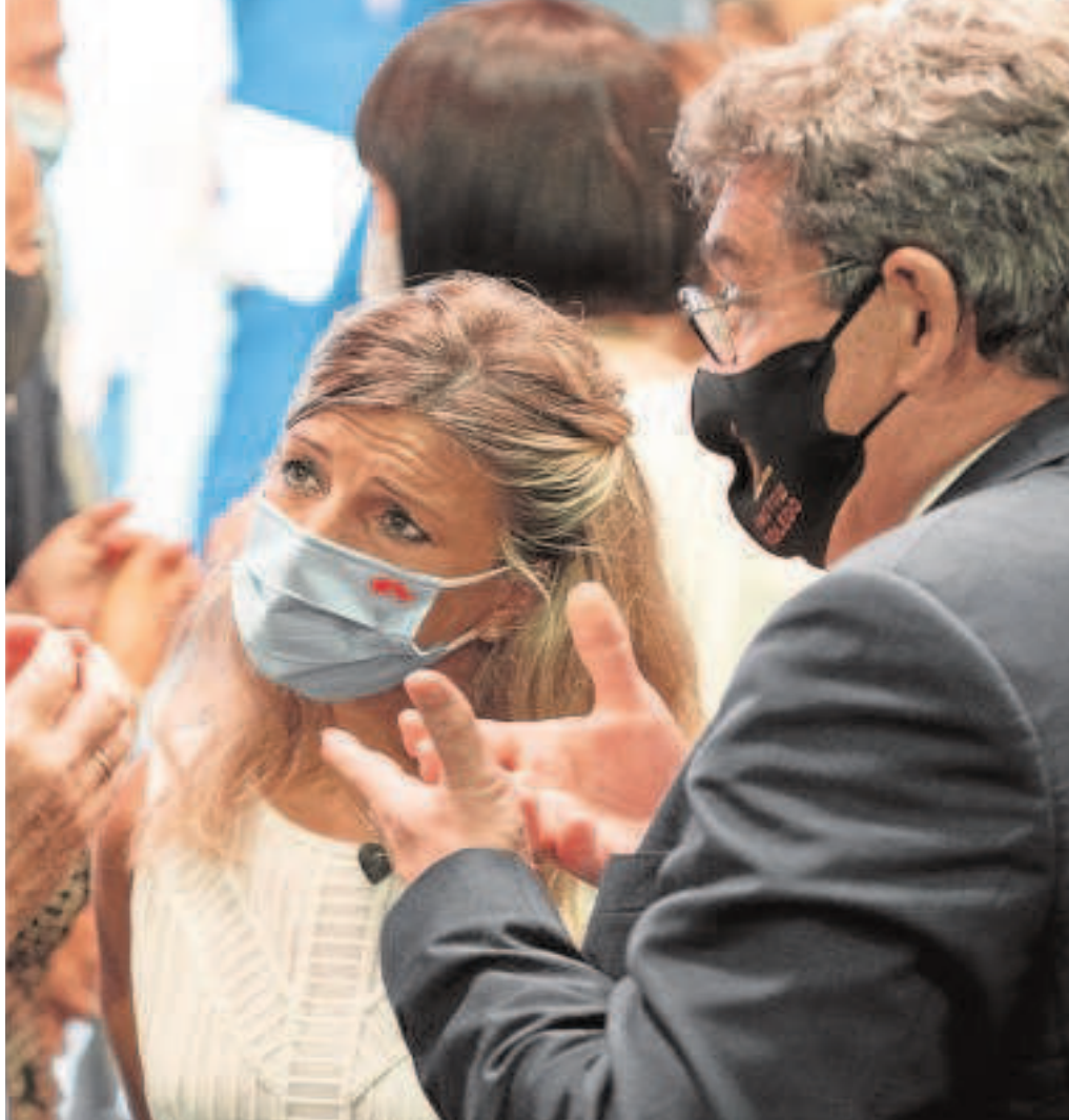
La ministra de Trabajo, Yolanda Díaz (centro), junto al de Inclusión

mensaje sobre la necesidad de actuar con prudencia y de esperar a la consolidación de la recuperación económica y del empleo. Sin embargo, Díaz ha conseguido imponer finalmente su argumento de que la recuperación económica debe llegar a todos y ser «justa». Una idea que Sánchez ha acabado haciendo suya y que ahora defienden desde el Ejecutivo, en base a la evolución del empleo, a la subida de precios y al encarecimiento de la electricidad.