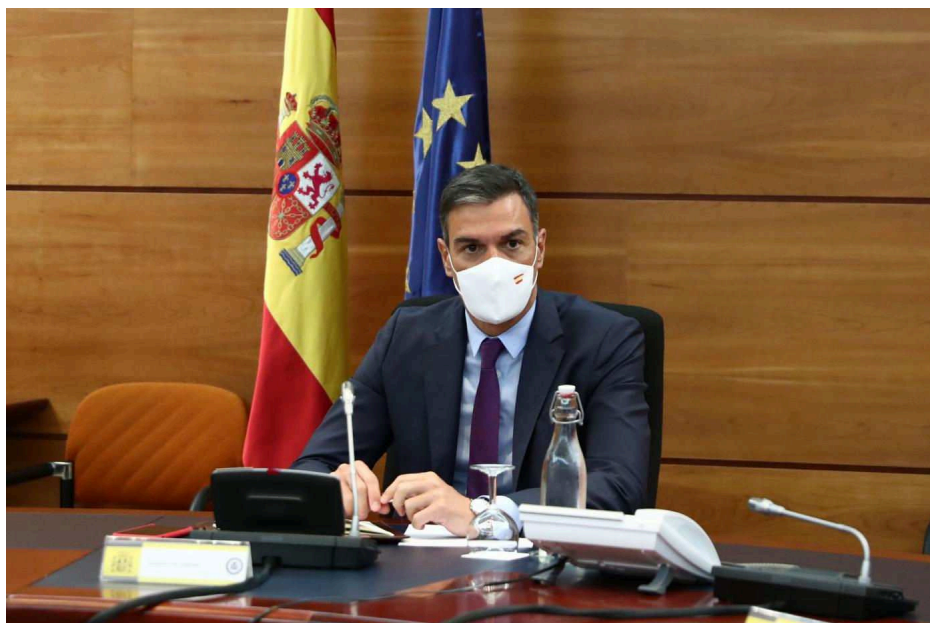
El presidente del Gobierno, Pedro Sánchez

El presidente del Gobierno y secretario general del PSOE, Pedro Sánchez, ha presentado este miércoles su precandidatura para seguir liderando el partido, en el día en que se ha abierto formalmente el proceso para renovar la dirección y los postulados socialistas en el 40 Congreso Federal de Valencia del 15, 16 y 17 de octubre.