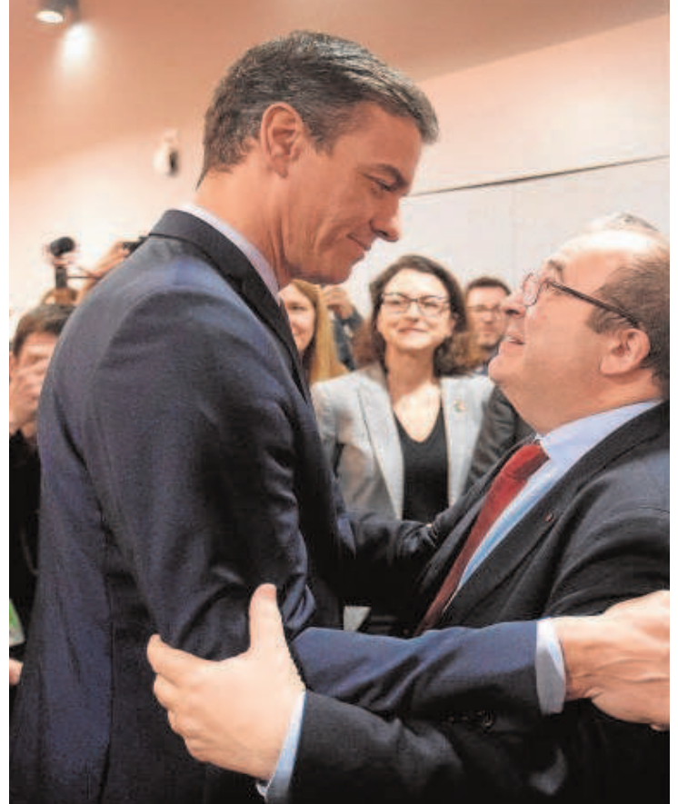
Sánchez junto al ministro de Cultura, Miquel Iceta