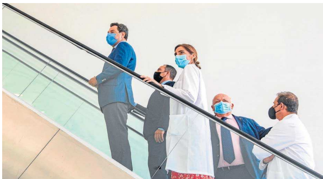
Juanma Moreno, ayer en el hospital de Vejer.

● Los Presupuestos de 2022, la ley del Suelo y la de reducción de impuestos cedidos son las prioridades de un calendario que necesita el respaldo de Vox para ser aprobado este año