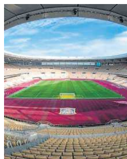
Estadio de la Cartuja.

De entrada es un buen calenda- rio que permitirá avanzar en la