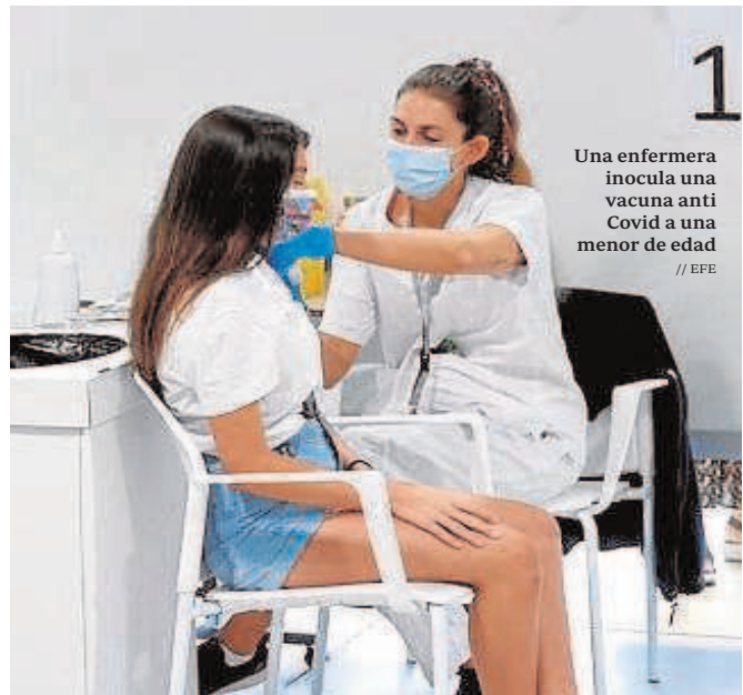
Una enfermera inyecta una vacuna anti Covid a una menor de edad

Los equipos coordinadores de los 129 centros de vacunación, que hasta el 5 de septiembre vacunarán sin cita previa, trabajan ya para peinar los municipios en los que se hayan detectado más personas sin vacunar e intentar sumar la mayor población posible vacunada. «Iremos puerta a puerta si es necesario a convencer de la necesidad de alcanzar la mayor inmunidad colectiva posible», expresaba días atrás Aguirre, que espera alcanzar en sep-