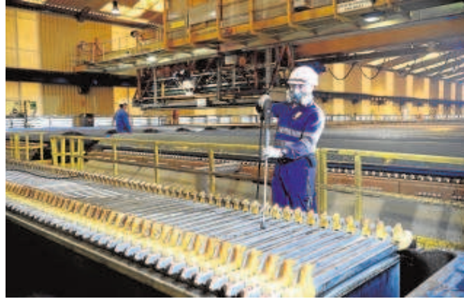
Cobre Las Cruces incrementó en 2020 la producción de cátodos de cobre