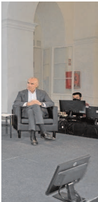
congregó al sector turístico