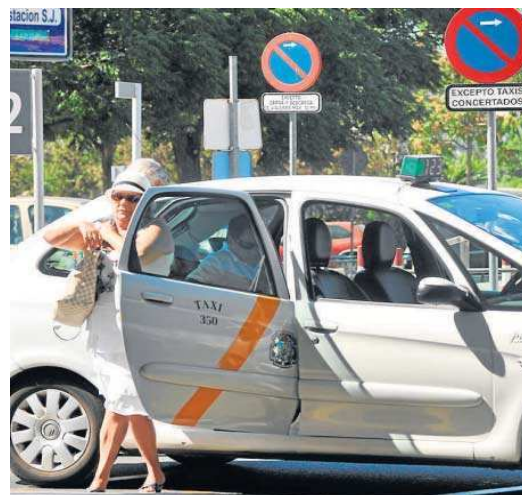
Una clienta baja de un taxi.