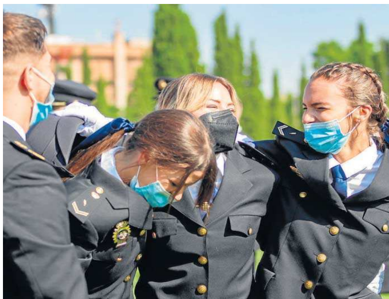
Nuevos policías nacionales, en una jura reciente.