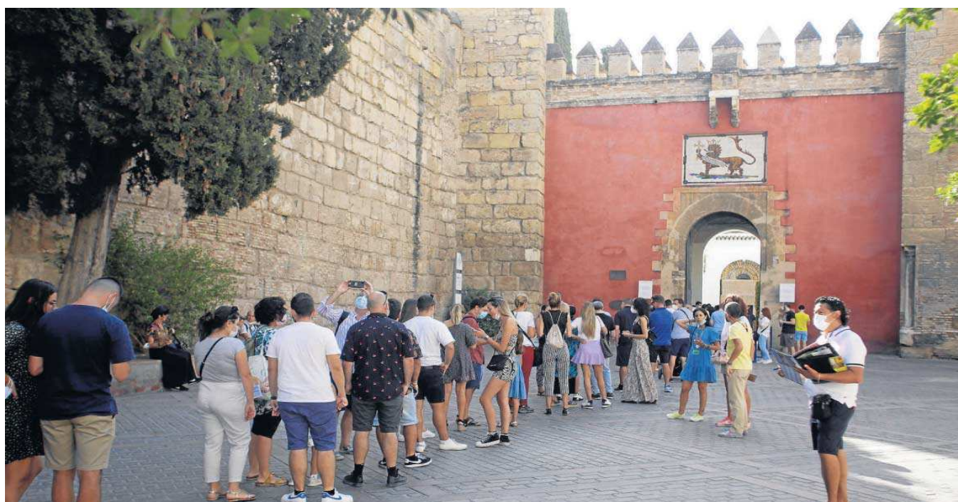
Cola de turistas para acceder al Real Alcázar, el segundo monumento más visitado de la ciudad.

● Los partidos lamentan que es una oportunidad perdida para profesionalizar su gestión y la intención del alcalde es politizar su control ● El gobierno dice que busca un amplio consenso