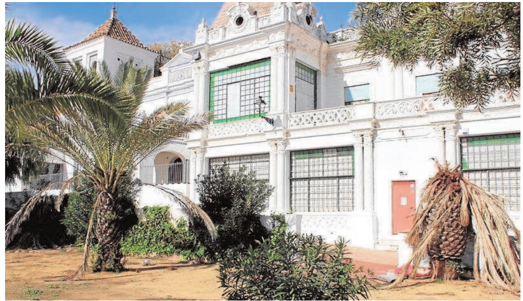
Aspecto de abandono que presenta la Casa Ybarra en Alcalá de Guadaíra, ahora de titularidad municipal

No es la primera vez que el Ayuntamiento planea esta recuperación con fondos procedentes de las administraciones. En noviembre de 2018 se supo que la intención era la de emplear los fondos Edusi de la Diputación de Sevilla para recuperar estos inmuebles y dejarlos preparados para la llegada de los inversores, que hasta el momento no se ha producido, de ahí que se insista en ello en esta ocasión con la convocatoria de los Next Generation.