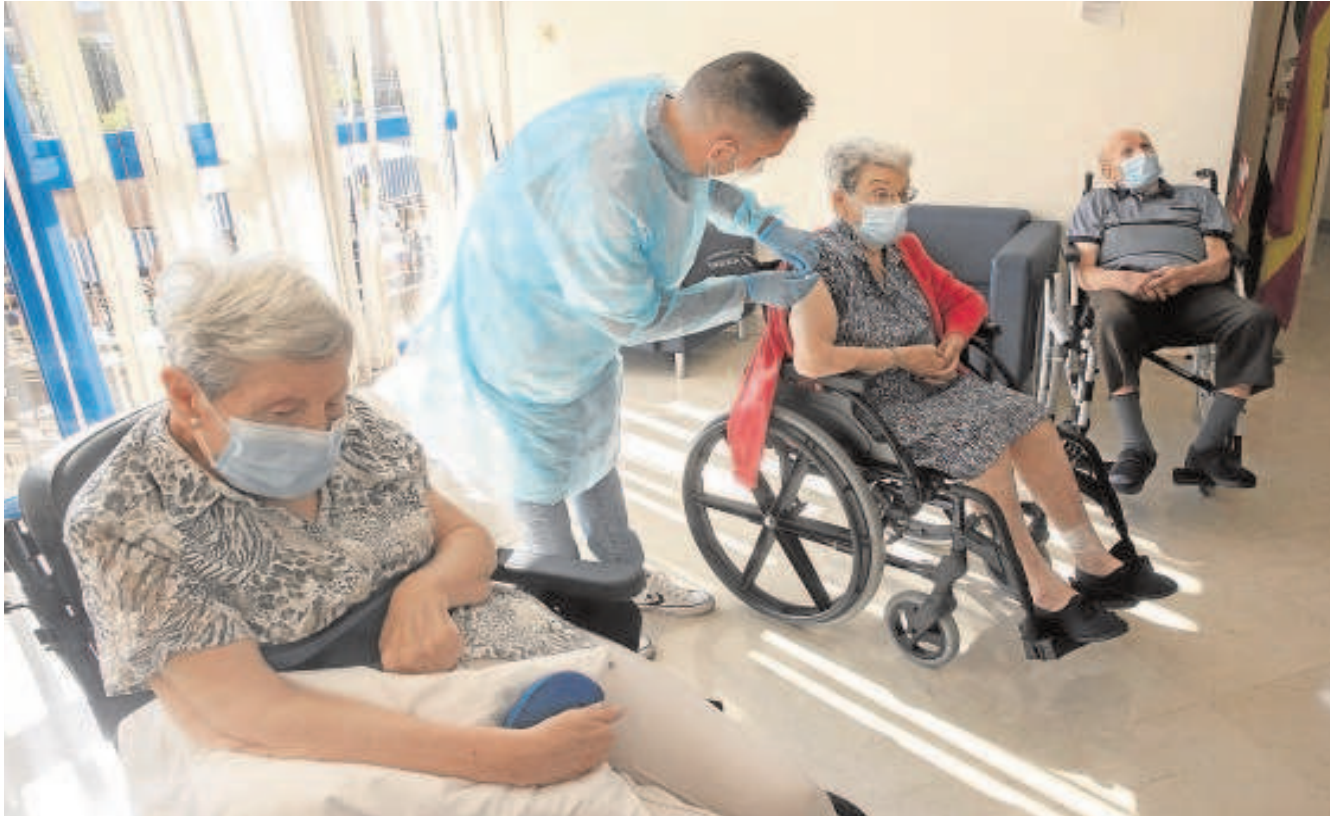
Vacunación con la tercera dosis en un centro de mayores de Córdoba