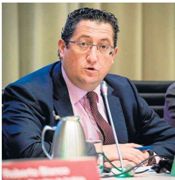
Óscar Arce, director general de Economía y Estadística del Banco de España.

El director general de Economía y Estadística del Banco de España, Óscar Arce, señaló en un encuentro con medios de comunicación que, de cumplirse estas previsiones, tanto el PIB como la tasa de paro recuperarían los niveles previos a la pandemia del Covid-19 a