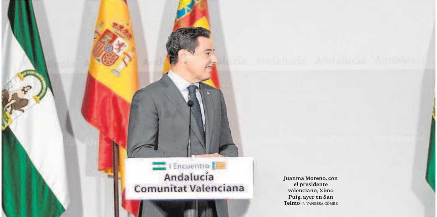
Juanma Moreno, con el presidente valenciano, Ximo Puig, ayer en San Telmo