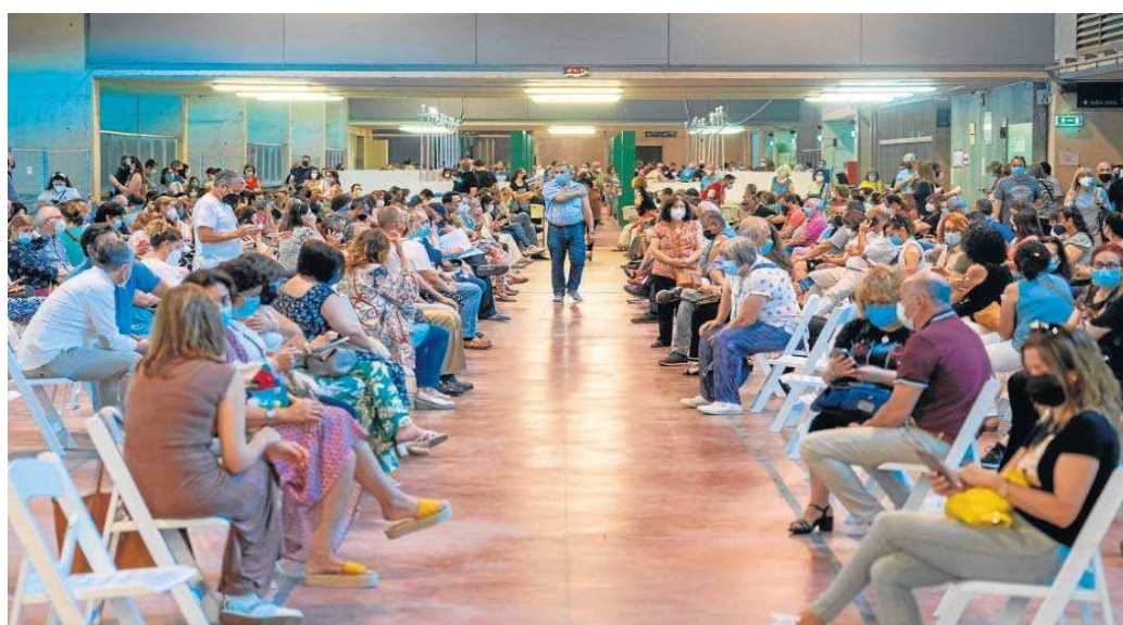
Numerosas personas esperan tras ser vacunadas en el 'vacunódromo' del Estadio de la Cartuja.

En el extremo opuesto se sitúa El Palmar de Troya, una localidad del sur de la provincia con poco más de 2.300 habitantes y donde apenas el 50,7% de su población está inmunizada. Un porcentaje expresivamente bajo, más si se compara