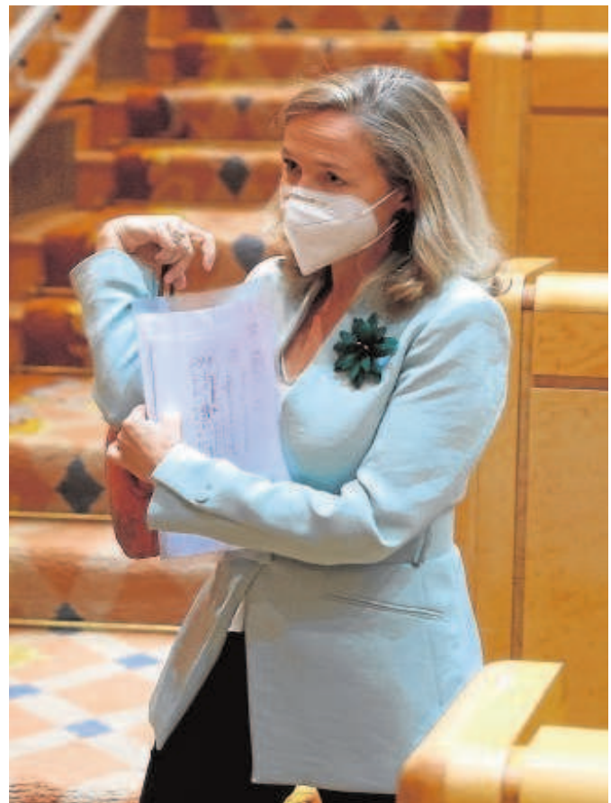
Nadia Calviño, vicepresidenta económica

Nadia Calviño, vicepresidenta económica, señaló ayer que la presentación de los Presupuestos Generales del Estado (PGE) se llevará a cabo «en una semana o dos» y se mostró optimista en lo que a los apoyos parlamentarios se refiere. «Creo que todos los grupos son conscientes de que ahora es más importante que nunca» contar con unos PGE, dijo Calviño. En concreto, el Consejo de Ministros aprobará las cuentas públicas en su reunión del 28 de septiembre o en la del 5 de octubre, tal y como avanzó también el jefe del Ejecutivo, Pedro Sánchez.