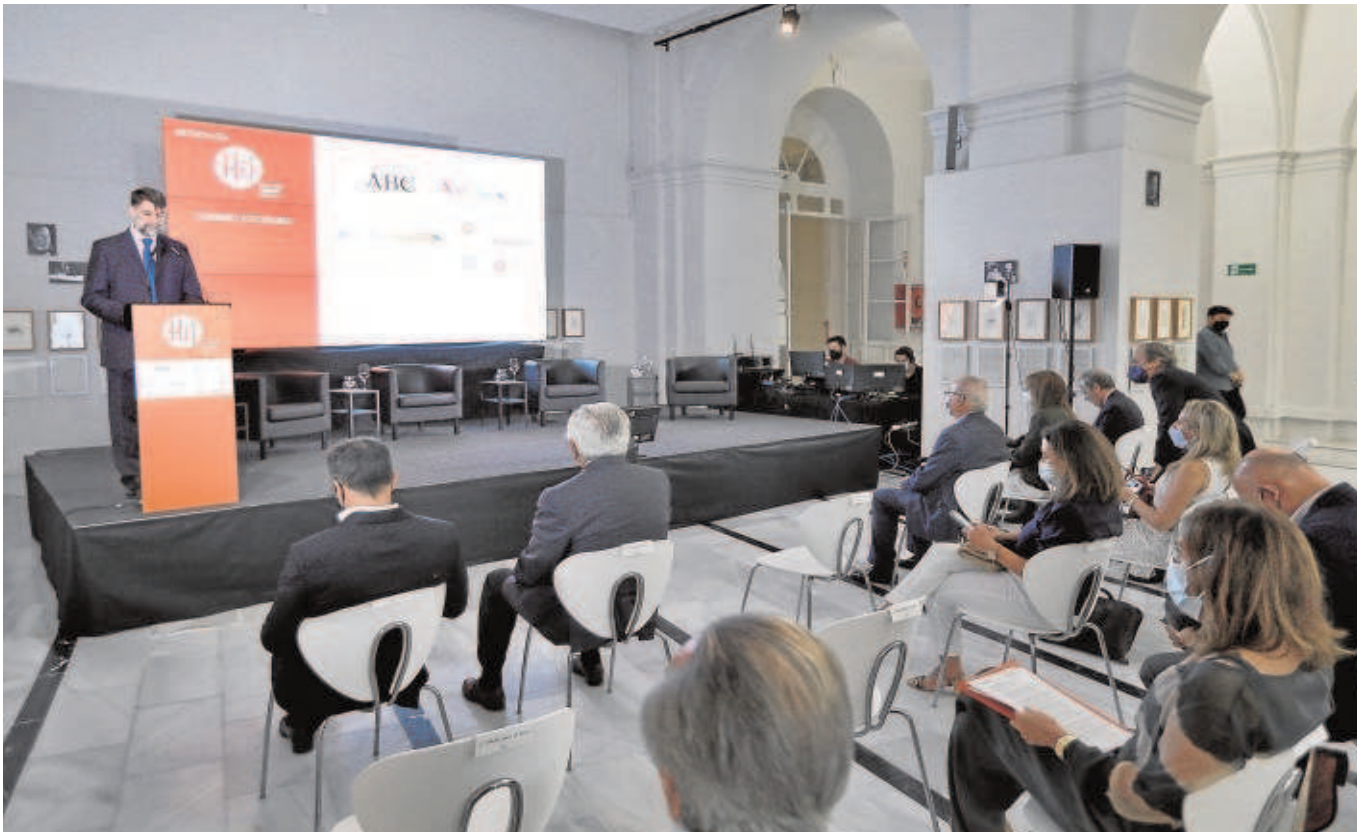
El evento, que cumple cuatro años, reunió a profesionales y gestores públicos del sector turístico en la Galería de ABC