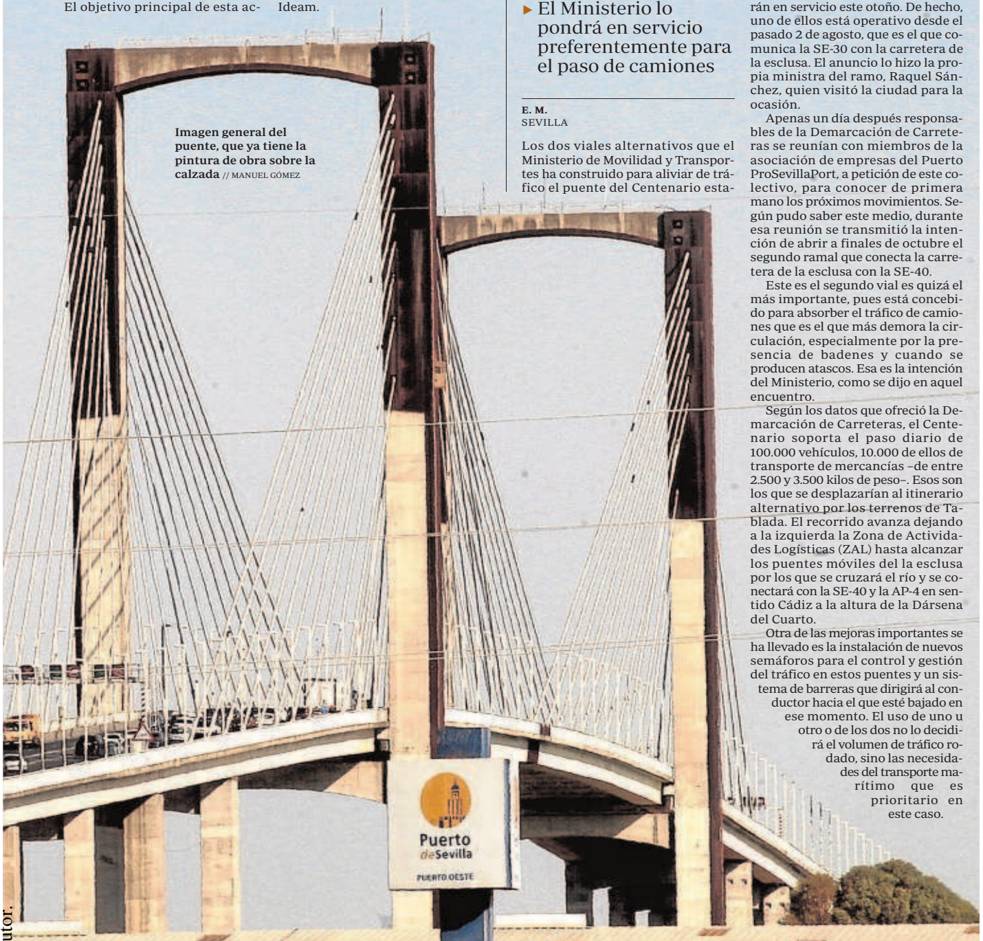
Imagen general del puente, que ya tiene la pintura de obra sobre la calzada // MANUEL GÓMEZ

Otra de las mejoras importantes se ha llevado es la instalación de nuevos semáforos para el control y gestión del tráfico en estos puentes y un sistema de barreras que dirigirá al conductor hacia el que esté bajado en ese momento. El uso de uno u otro o de los dos no lo decidirá el volumen de tráfico rodado, sino las necesidades del transporte marítimo que es prioritario en este caso.