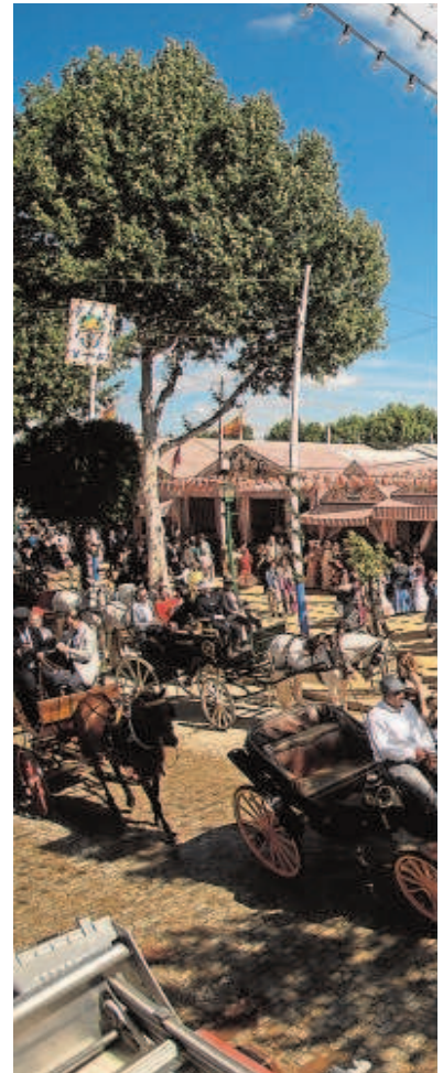
Ambiente en las calles de la Feria de Abril

El diseño de la Feria estará totalmente vinculado a la seguridad y a la idea básica de crear un recinto cerrado con controles de acceso