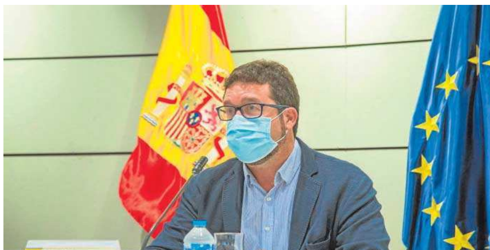
Joaquín Pérez, secretario de Estado de Empleo, en un acto en el Ministerio de Trabajo.

"El Gobierno está muy tranquilo diciendo que hay que subirlo, pero al Estado le cuesta cero subir el salario mínimo", aseguró