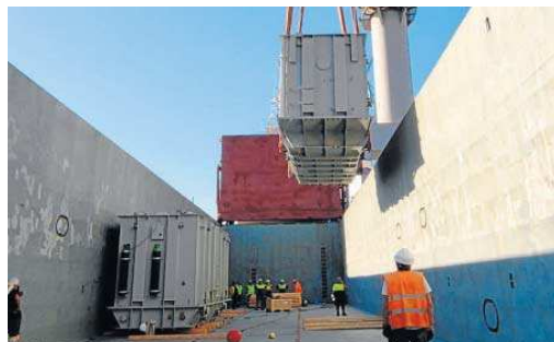
La operativa vista desde el buque 'Grand Light'.

El operador Sevitrade sigue ganando peso logístico en el Puerto y estima crecer más de un 20% este año. 2020, en plena pandemia, fue su año histórico al convertirse en la empresa que más barcos consignó y más toneladas movió en el Puerto. En concreto, gestionó 1.143.734 toneladas, operando 260 buques en tres líneas estratégicas de negocio: graneles, siderúrgicos y cargas de proyecto. La empresa, que se estableció en el Puerto en 1989 y que fue la primera en instalarse en la Zona Franca, está ampliando actualmente su capacidad con nuevos almacenes y depósitos.