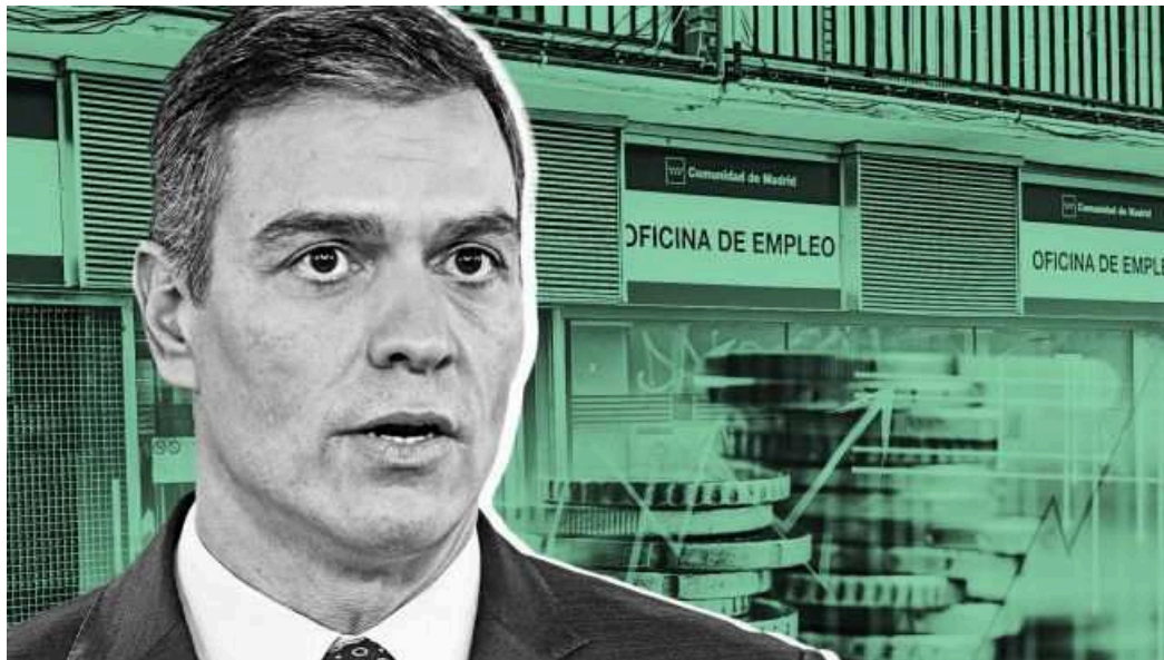
El presidente del Gobierno, Pedro Sánchez, y la negociación de la prórroga de los ERTE

La Confederación de Empresarios de Sevilla (CES) ha recordado este jueves al Gobierno de Pedro Sánchez el daño que podría provocar una nueva subida del Salario Mínimo Interprofesional (SMI) al 95% del tejido productivo . Por ello, se han mostrado «preocupados» por esta propuesta, y han conminado al Ejecutivo a limitarse a extender los expedientes de regulación temporal de empleo (ERTE) y las prestaciones por cese de actividad.