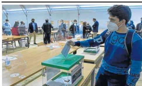
Las últimas elecciones a rector de la UPO, celebradas en 2020.

Tras la polémica Lomloe (la ley Celaá), llega el turno de la LOSU, las siglas que corresponden a la reforma de la enseñanza universitaria que promueve el Gobierno de Pedro Sánchez. El anteproyecto lo presentó el ministro del ramo el mismo día en que miles de españoles volvían al trabajo y ya ha creado debate. Por ahora, ni la US ni la UPO se han pronunciado al respecto, aunque sus rectores seguramente realizarán alguna declaración sobre este asunto antes del 20 de septiembre, cuan-