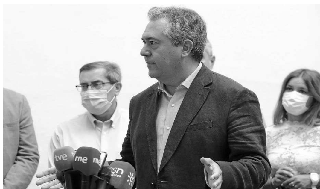
El secretario general del PSOE-A, Juan Espadas, ayer, con los secretarios provinciales del partido en Andalucía.