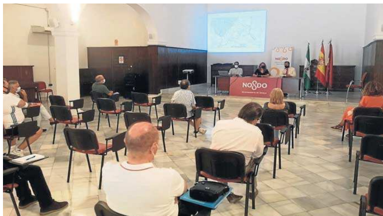
Una imagen de uno de los encuentros mantenidos con distintas entidades.

Estas nuevas reuniones celebradas en ambos distritos se suman a las que ya se mantuvieron antes del inicio de los trabajos de reordenación del tráfico en esta zona de Macarena y se enmarcan en la campaña informativa puesta en marcha desde finales de agosto para ampliar el conocimiento de