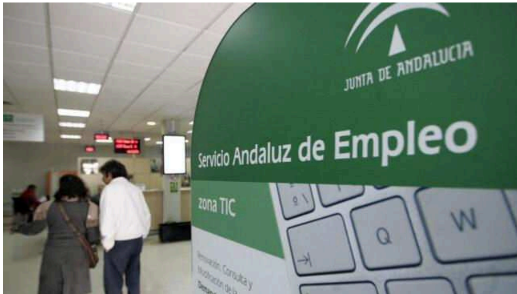
Oficina del SAE.