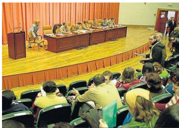
Uno de los primeros claustros celebrados en la Pablo de Olavide. D. S.

la LOSU se implantara deberán ser modificados para adaptarse a la reforma. De igual forma, también adquiere un papel especial en las elecciones a rector, a cuyo cese puede verse obligado en caso de prosperar una moción de censura dentro de este órgano de decisión.