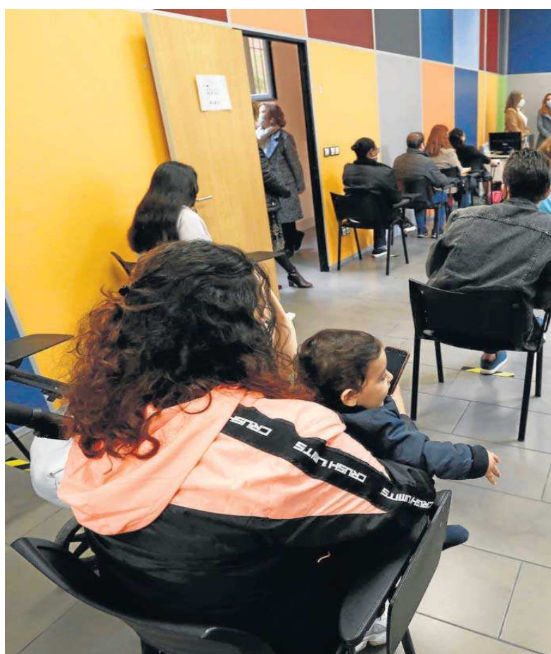
Una mujer con su hijo en el programa de empleo de este año con la Fundación Persán.

● El Ayuntamiento refuerza el programa de empleo Integra con 3,6 millones de euros y un alcance de 6.000 personas