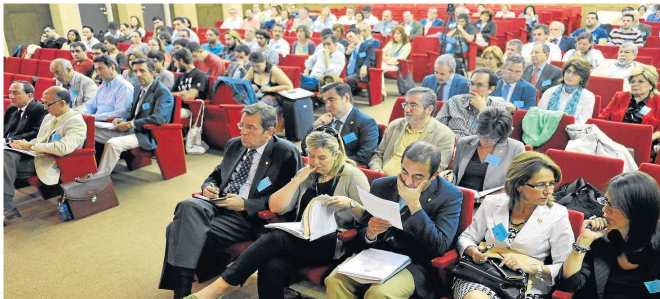
Imagen de archivo de un claustro celebrado en la Universidad de Sevilla.