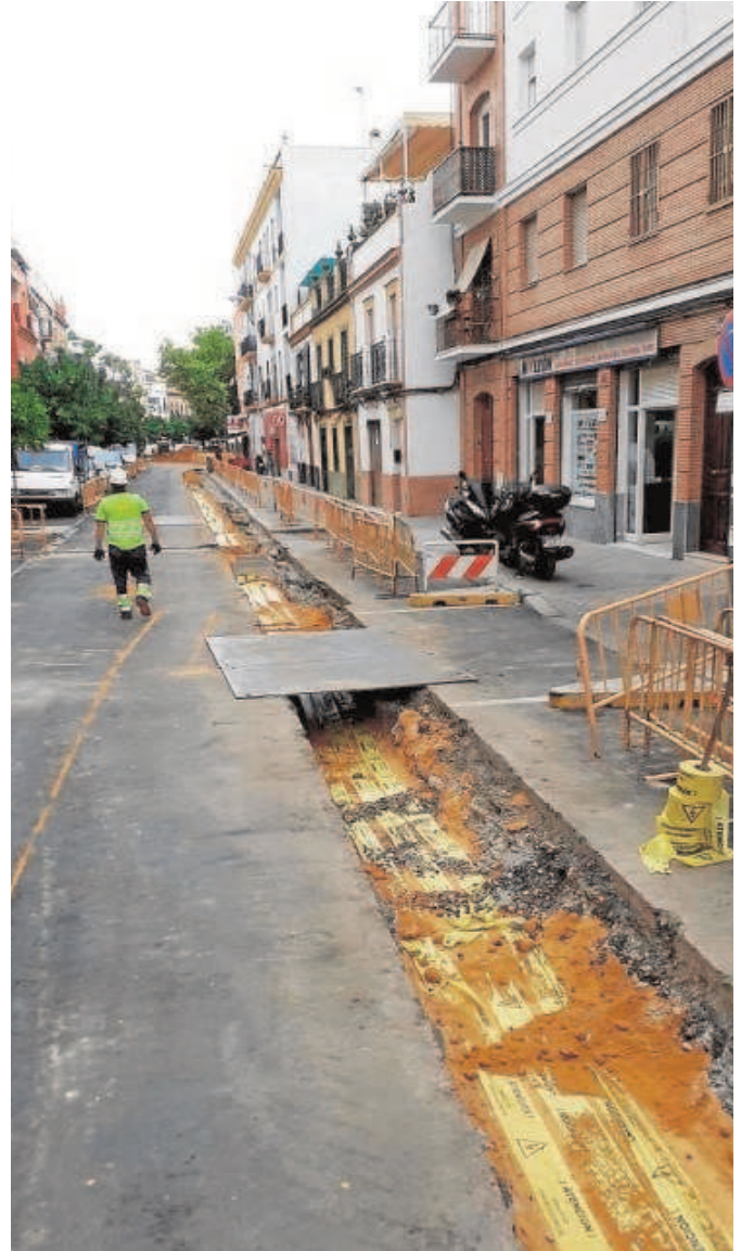
Cableado en el calle Castilla

Esta misma situación de cortes se sufrió el fin de semana pasada en entorno de la calle Arjona y Plaza de Armas, como trasladaron a este periódico algunos vecinos afectados. La causa estuvo en los trabajos que se están llevando a cabo en la zona.