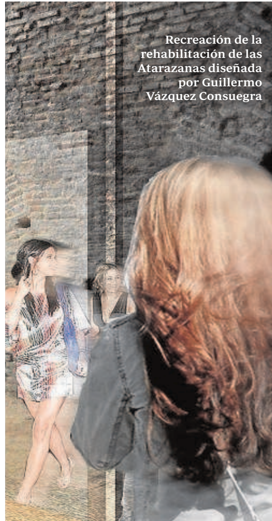
Recreación de la rehabilitación de las Atarazanas diseñada por Guillermo Vázquez Consuegra

cepción original, con espacios diáfanos de gran altura. Además, esto permitirá conocer la cota a la que estaba la orilla del Guadalquivir hace ocho siglos, ya que los astilleros se construyeron a ras del agua para poder botar los barcos con facilidad. Las fuentes consultadas confirman a este periódico que ya está hecha toda la investigación arqueológica y el plazo de intervención incluye la posibilidad de que se puedan hallar restos que paralicen la obra durante algunas semanas. Además, ya se ha firmado también el acuerdo de financiación entre La Caixa, Cajasol y la Consejería de Cultura, de manera que tanto la propietaria como las entidades concesionarias sufragarán la rehabilitación de forma alícuota. El presupuesto total ron-