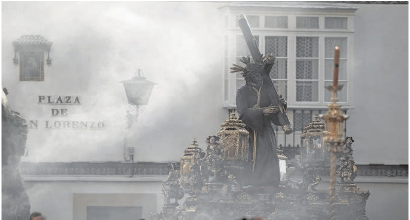
Procesión extraordinaria del Gran Poder en noviembre de 2016 con motivo del Año de la Misericordia