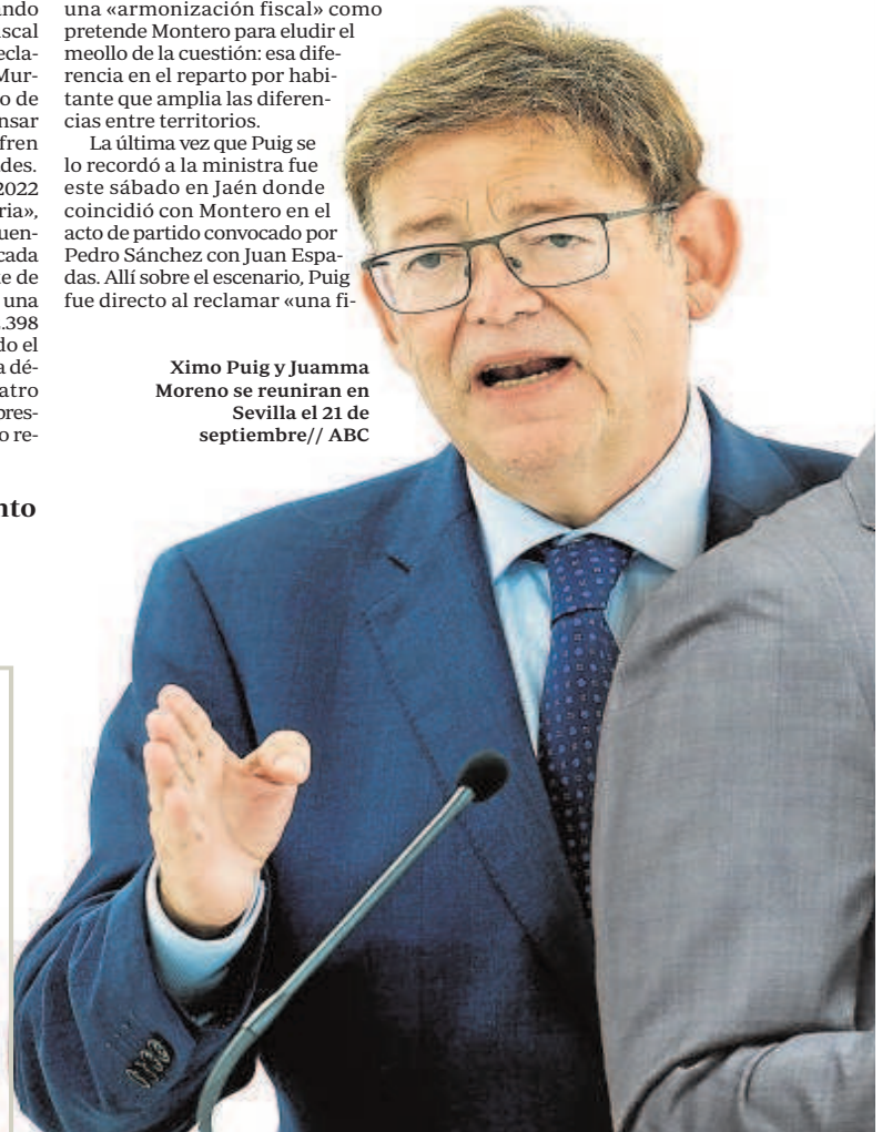
Ximo Puig y Juanma Moreno se reunieron en Sevilla el 21 de septiembre

Prueba de la buena relación que mantienen los presidentes andaluz y valenciano es la llamada que Puig hizo a Moreno para informarle de que participaría en el mitin de Jaén. En el PSOE no podrán reprocharle que oculta sus intenciones por acelerar la reforma de un sistema pactado por Zapatero con ERC en 2009 y que fue aprobado en el Con-