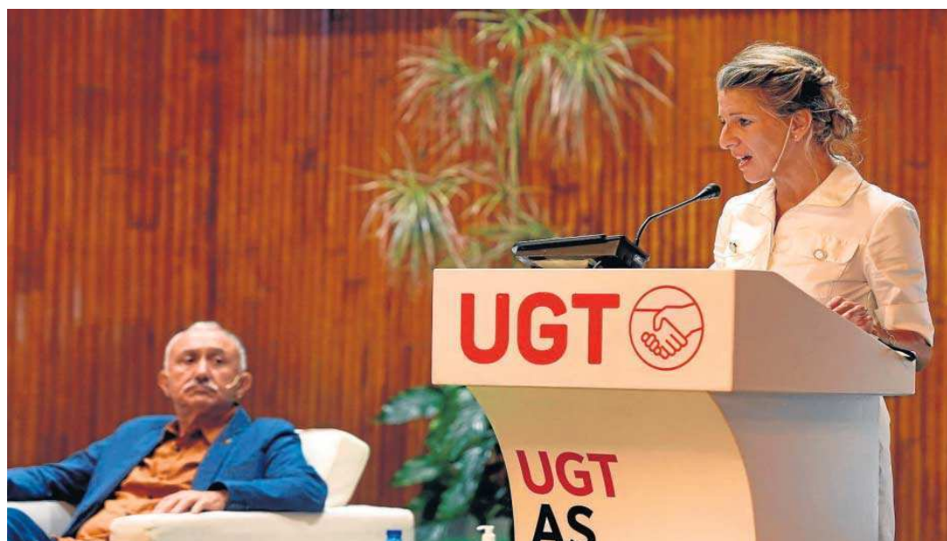
La ministra de Trabajo, Yolanda Díaz, interviene ante el secretario general de UGT, Pepe Álvarez, durante la apertura de la Escuela de Verano del sindicato.

Entre los sindicatos ha habido diferencia de pareceres a la salida de la reunión, ya que mien-