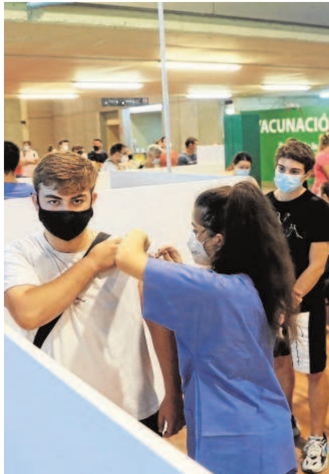
Un joven se vacuna mientras otro aguarda su turno

Hay diez pueblos con 'tasa cero', por llevar más de catorce días seguidos sin registrar un solo positivo entre sus vecinos