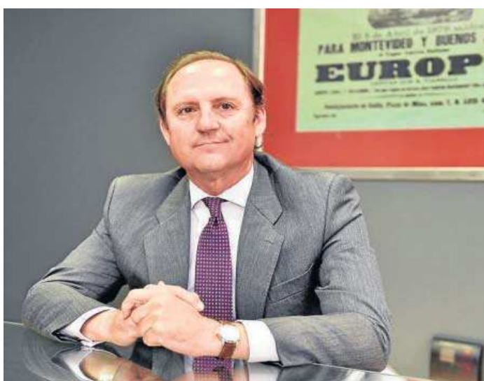
Javier Molina, CEO de Befesa.

Befesa retornó a Bolsa en noviembre de 2017 y cotiza desde ese momento en Fráncfort. Casi un año después, en septiembre de 2018, entró en el SDAX. Su inclusión ahora en el índice MDAX se produce gracias al fuerte incremento de su capitalización bursátil a lo largo de los últimos tres años, en pleno proceso de expansión de su modelo de negocio, basado en proporcionar servicios medioambientales sostenibles, el cumplimiento constante de los objetivos e hitos estratégicos, así como el positivo impacto de la adquisición del proveedor líder del mercado estadounidense de ser-