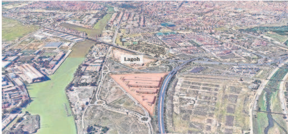
Recreación del espacio que ocupará este centro junto al Puerto de Sevilla