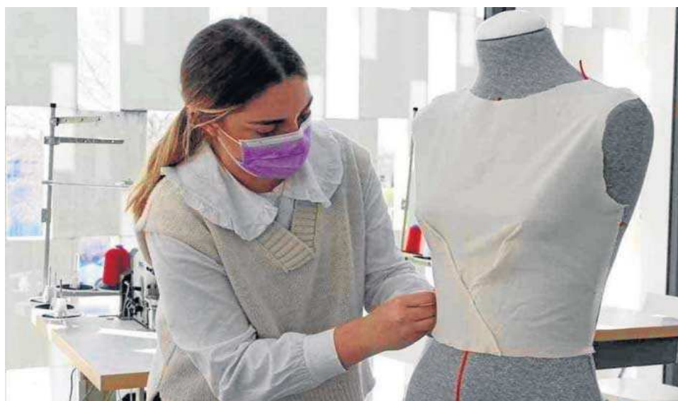
Alumna de la Escuela Superior de Moda de Sevilla.