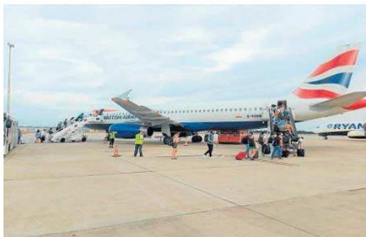
Un avión de la British Airways en Sevilla.

La aerolínea irlandesa opera vuelos, además, con Edimburgo y