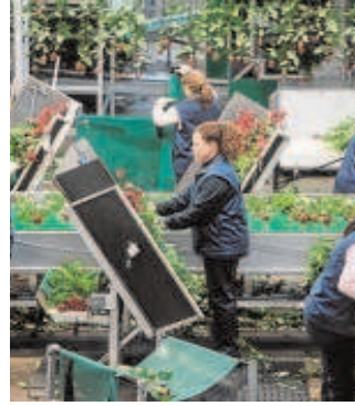
Planta de la extinta Aleia Roses

«La recuperación del número de empresas se está produciendo de for-