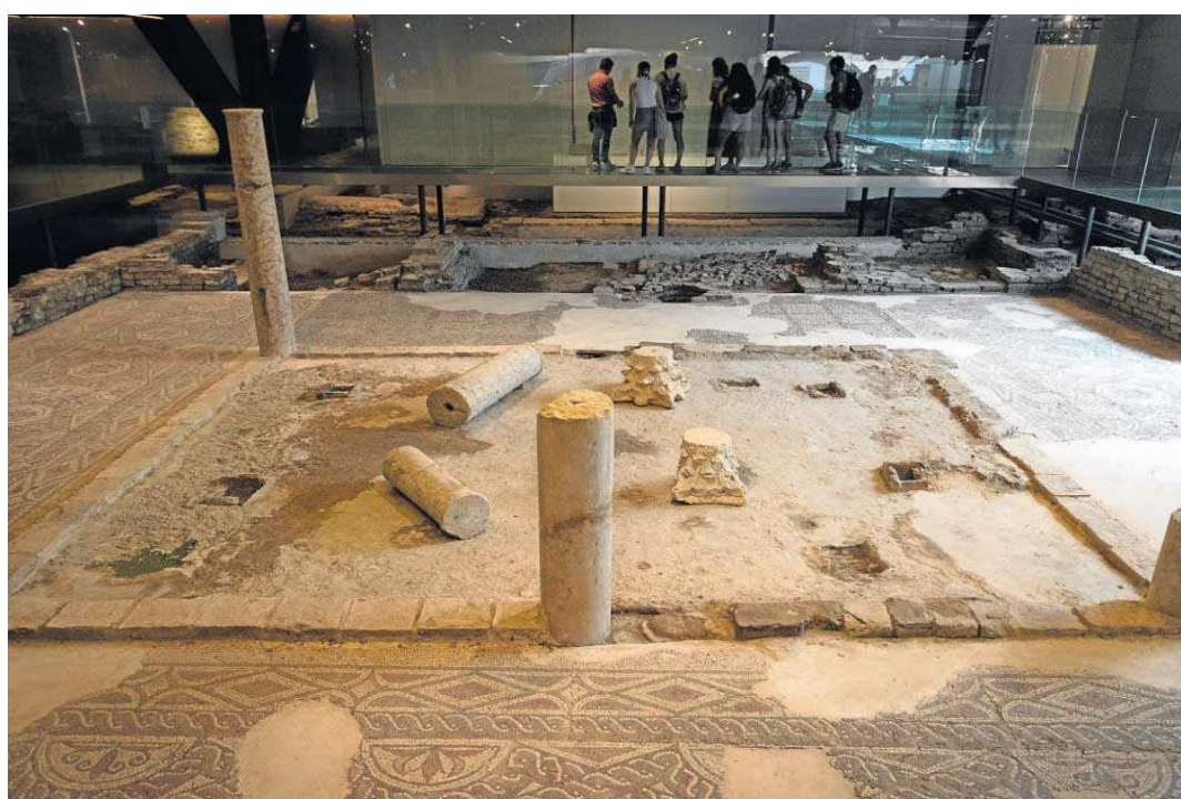
Restos romanos del Antiquarium, espacio situado bajo las setas de la Encarnación. ANTONIO PIZARRO

● El Ayuntamiento ya trabaja en una primera fase para mejorar la musealización de este espacio que conserva importantes restos romanos ● La actuación será sufragada al 50% por Consistorio y Junta