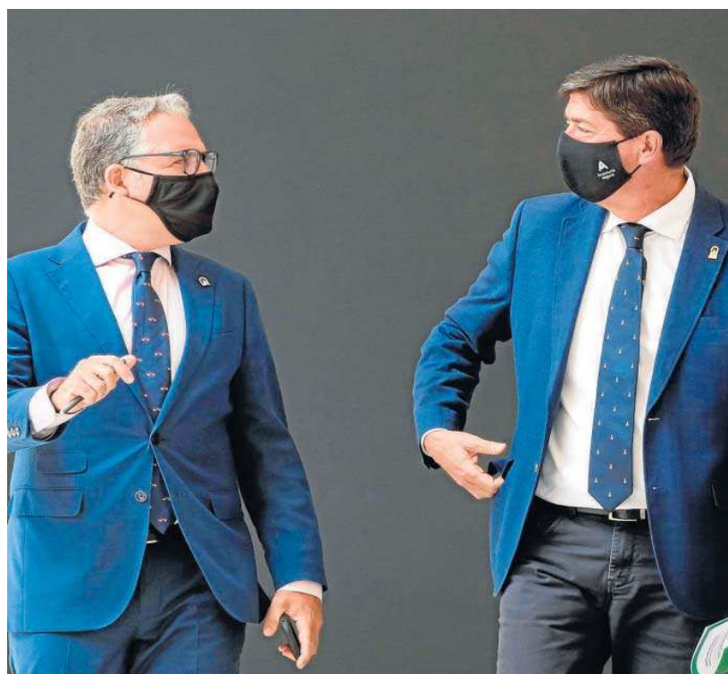
El portavoz del Gobierno, Elías Bendodo, y el vicepresidente de la Junta, Juan Marín, ayer en San Telmo.

El portavoz del Gobierno, Elías Bendodo, insistió en la idea de que el objetivo sigue siendo que