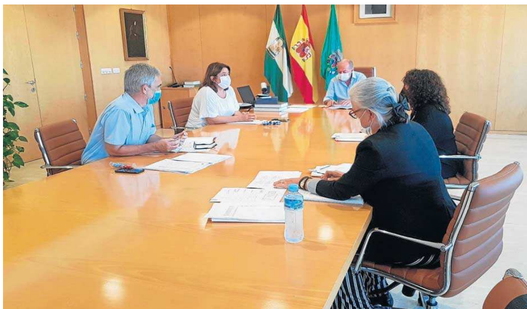
Reunión del presidente de la Diputación y su equipo para el seguimiento del Plan Contigo en los programas relativos al Área de Servicios Públicos Supramunicipales.

“Desde la Diputación, hemos sido parte muy activa en la llegada de los algo más de 50 millones de euros procedentes fondos europeos para cuatro proyectos de abastecimiento en Sierra Sur, que