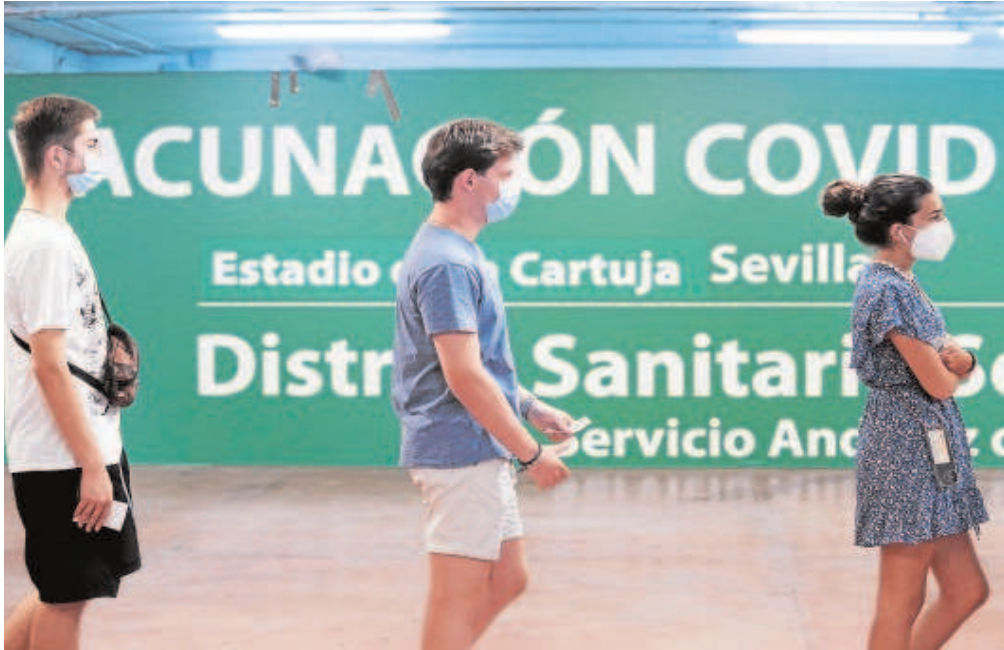
Tres jóvenes aguardan su turno para vacunarse en el estadio de la Cartuja de Sevilla