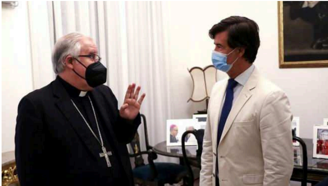
El presidente de la CES se reúne con el arzobispo de Sevilla