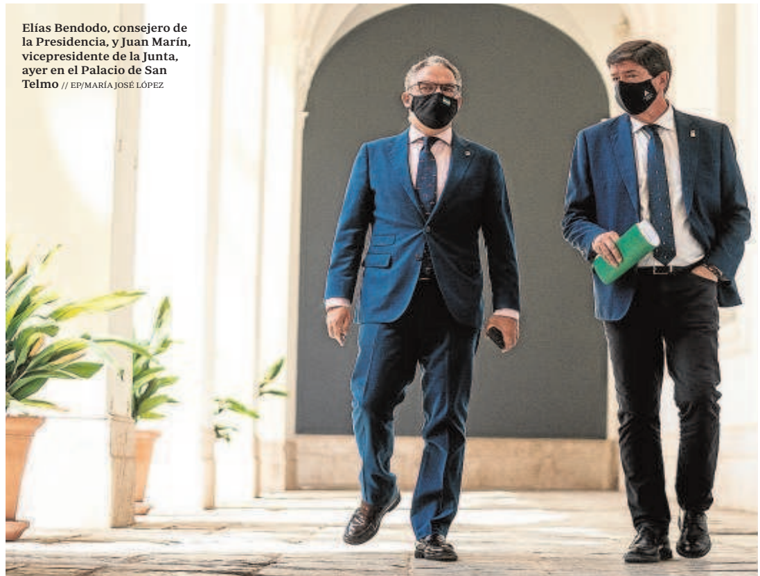
Elías Bendodo, consejero de la Presidencia, y Juan Marín, vicepresidente de la Junta, ayer en el Palacio de San Telmo

El Gobierno andaluz facilitará el aplazamiento y fraccionamiento del pago de la deuda que los ayuntamientos tienen con la Junta de Andalucía con el objetivo de que no excluirlos del acceso a los fondos de Next Generation de la Unión Europea, que serán una palanca para la recuperación económica. Esta medida, que se hace posible mediante un decreto ley, no beneficiará sólo a las entidades locales. El vicepresidente de la Junta, Juan Marín (Ciudadanos), anunció ayer que se va a modificar la Ley General de la Hacienda Pública, para que, además de las corporaciones, las empresas o personas físicas con deudas aplazadas o fraccionadas vigentes puedan recibir subvenciones, ya que lo que se pretende es precisamente que no se vean perjudicadas cuando han regularizado su situación o se ha suspendido la deuda, aún en periodo ejecutivo. De este modo, la Junta de Andalucía permitirá a entidades públicas y privadas aplazar o fraccionar reintegros que deban hacer a la Junta por mandato judicial o resolución administrativa firme.