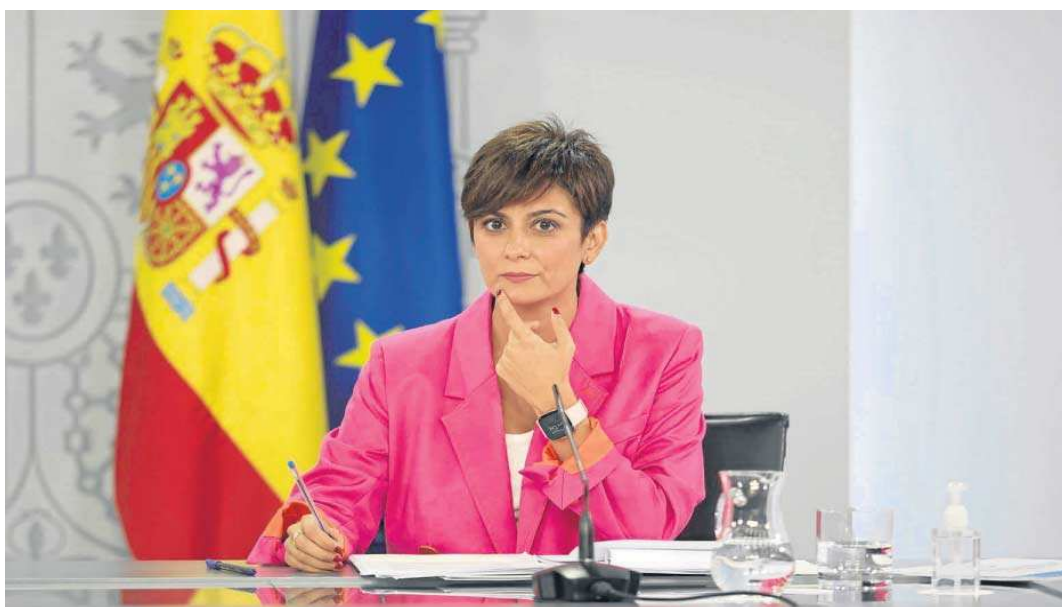
La ministra portavoz, Isabel Rodríguez, comparece tras la reunión del Consejo de Ministros, ayer.

Con estos precios, la organización de consumidores Facua denunció que, de mantenerse los precios durante todo septiembre los precios