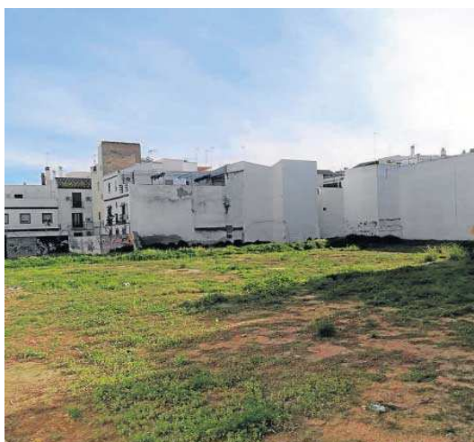
El solar municipal sin uso entre los barrios de San Luis y Feria.

El colectivo expone en su escrito que esta petición también la planteó en el Pleno Municipal del 26 de abril de 2021, y ahora cuenta con el apoyo de las entidades y colectivos del barrio. La