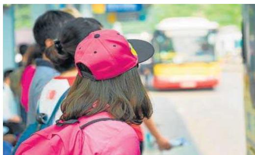
Escolares esperando un transporte.

El gremio denuncia que los vehículos destinados a rutas escolares públicas no han recibido ninguna ayuda para la limpieza Covid en el curso pasado, cuando ya el Tarja (el Tribunal Administrativo de Recursos Contractuales) advertía de la necesidad de incluir una partida para estas situaciones. La media de coste de limpieza por autobús supone unos 20 euros/día y "ahora en el concurso puente (que se ha licitado) valoran una cantidad de 0,80 cénti-