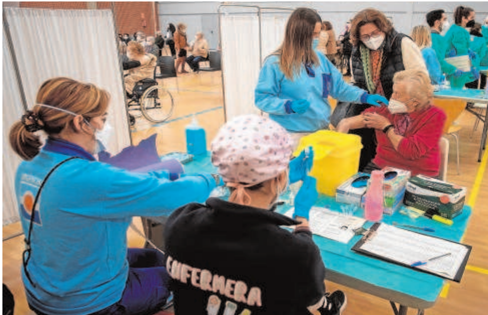
Enfermeras en un punto de vacunación masiva de Sevilla

Distribuido para CONFEDERACIÓN DE EMPRESARIOS DE SEVILLA * Este artículo no puede distribuirse sin el consentimiento expreso del dueño de los derechos de autor.