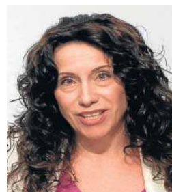
La consejera de Igualdad, Rocío Ruiz.

“Los afiliados deben elegir quien liderará la candidatura y por tanto las primarias deben estar fuera de cuestión y realizarse ya”, afirmaron en otro mensaje. Desde este perfil aseguran que son un equipo que “busca presionar para la convocatoria de primarias y animar a la creación de dicha candidatura”, pero que no actúan “de forma oficial”.