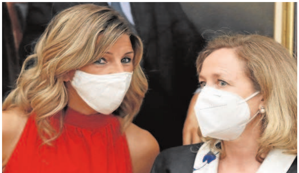
Los roces entre las vicepresidentas son un secreto a voces en el Gobierno

El tira y afloja entre ambas ya no sorprende. Sus desavenencias han sido sonoras en asuntos como la reforma laboral, entre una vicepresidenta que quiere mantener la esencia de la reforma laboral, en línea con los empresarios, y una ministra de Trabajo que pretende derogarla. Discrepancias que también han sido sonoras en los ERTE o las ayudas directas a las empresas. Y hasta ahora también había un abismo entre ambas sobre la oportunidad de subir o no el SMI. Calviño, al igual que el presidente, ha sostenido durante meses que no era oportuno subir el indicador frente a la presión de la gallega.