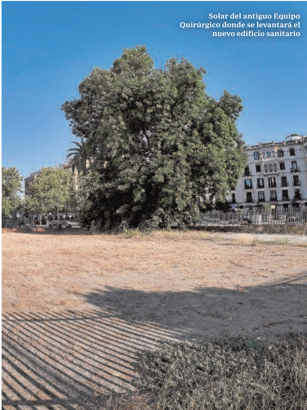
Solar del antiguo Equipo Quirúrgico donde se levantará el nuevo edificio sanitario