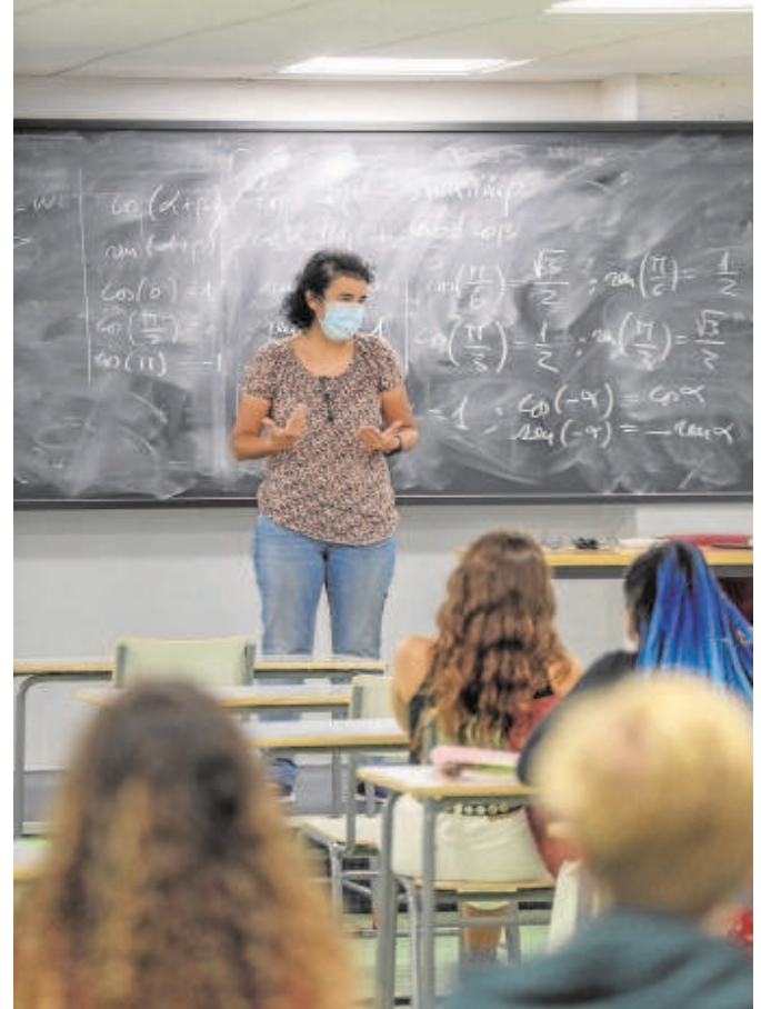
Sobre estas líneas, una clase universitaria

minen o disminuyan las restricciones impuestas a las Universidades.