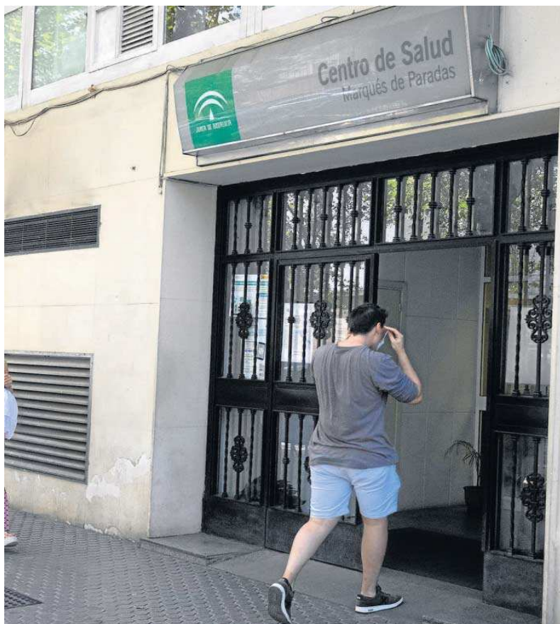
Un joven se coloca la mascarilla para acceder al centro de salud Marqués de Paradas, en el centro de Sevilla.

Ojeda advierte de que son los propios trabajadores de los centros de salud los que están pagando los platos rotos por la situación que se está viviendo, con las eternas esperas para conseguir cita o los retrasos en las consultas. Precisamente, hay profesionales de la Atención Primaria sevillana que han renunciado a una plaza en propiedad en la sanidad pública y hay varios, incluso,