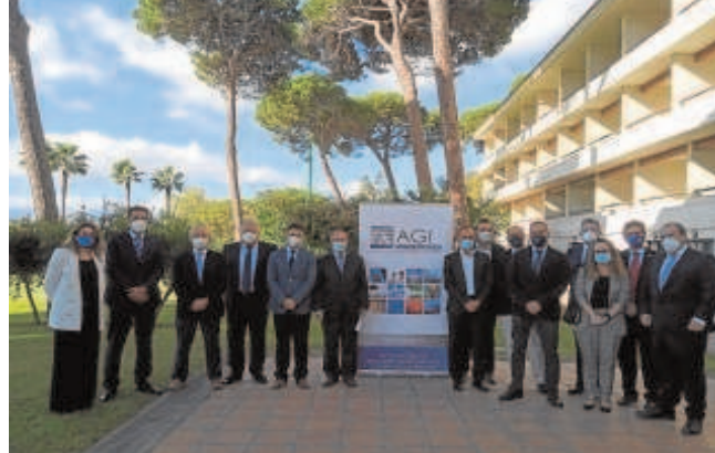
Asistentes a la presentación de la Memoria 2020 de la AGI en Los Barrios