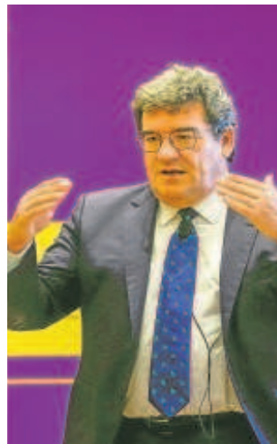
José Luis Escrivá

Para siempre desapercibida la actualización que a mediados de mes hace el ministro Escrivá de la evolución del empleo. La evolución de la afiliación con el detalle con el que se conoce sumada