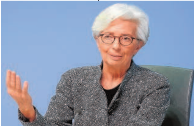
La presidenta del BCE, Christine Lagarde