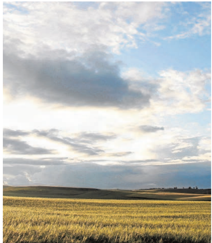
La campiña de Sevilla resultará perjudicada con la propuesta actual del Ministerio

El año 2023 servirá como experiencia para evaluar el funcionamiento de los ecoesquemas y calibrar su aplicación para 2024