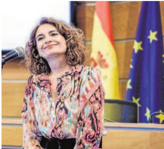
María Jesús Montero, ministra de Hacienda y Función Pública

En el proyecto de Presupuestos de 2022, el Ejecutivo ya ha tenido que dar marcha atrás en sus estimaciones a la vista de los datos. Calcula que para el año que viene por este impuesto se recaudarán apenas 225 millones de euros, cuando en 2019 se pensaba en que sería cinco veces más, y en 2021 que sería más de tres veces superior a esto.