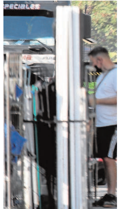
Rodaje en la Plaza de América hace unos días

Las condiciones que presenta Sevilla para los rodajes de toda índole o la celebración de grandes eventos, como se viene comprobando en los últimos años, son difíciles de mejorar. Escenarios, clima, conexiones, servicios... Ese filón hay que aprovecharlo y el Ayuntamiento se ha percatado de la necesidad de afinar, de optimizar, de ponerlo aún más fácil a un sector que tantos beneficios genera a la ciudad. No se hable más. Luces, cámaras... Acción.