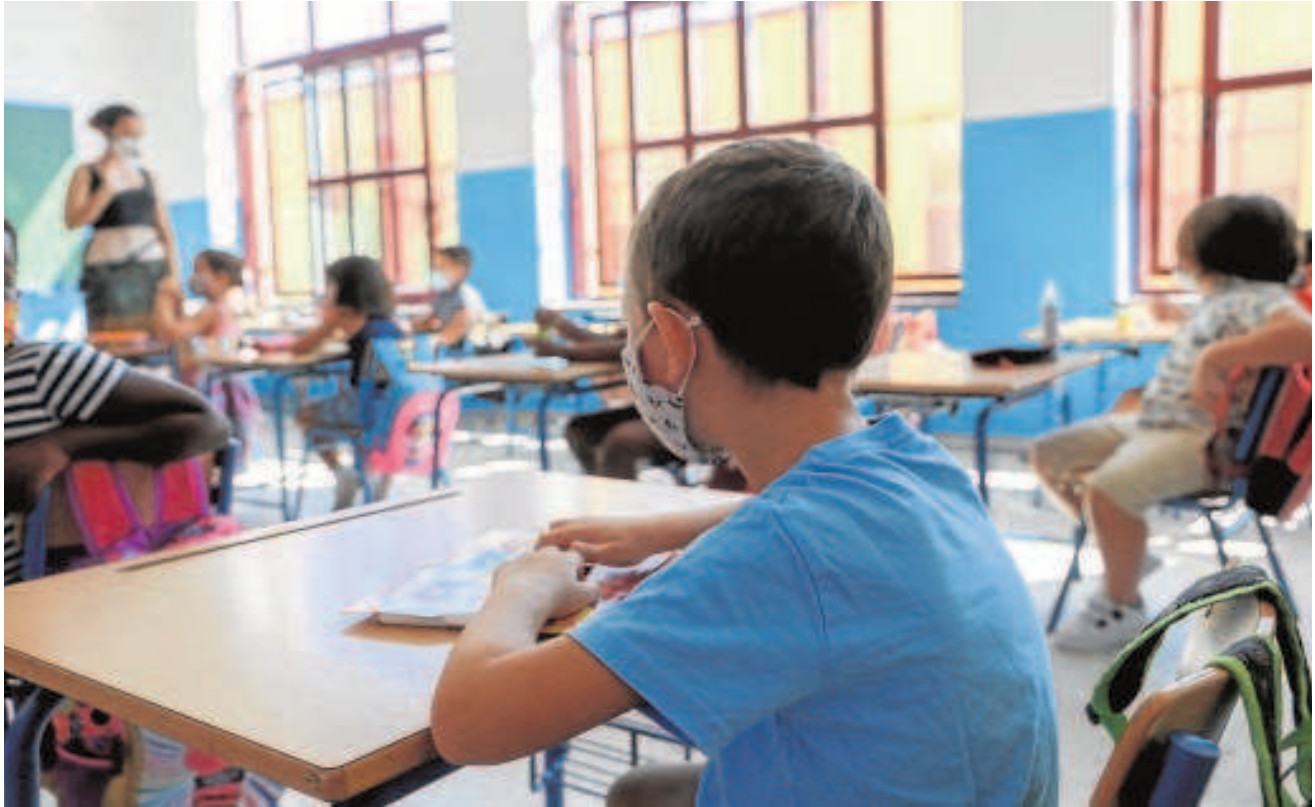
Alumnos con mascarilla durante una clase en un colegio de Sevilla