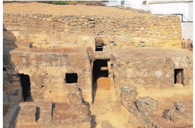
La Tumba del Elefante de la necrópolis de Carmona