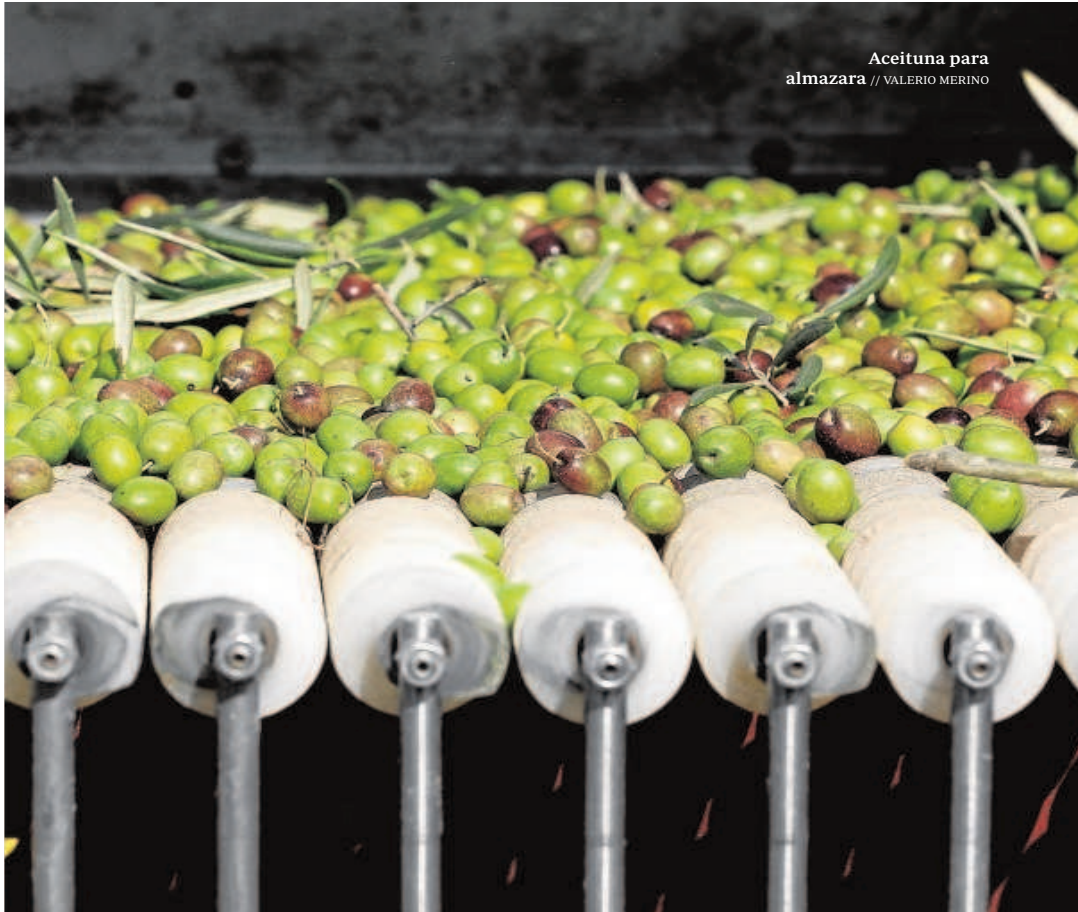
Aceituna para almazara