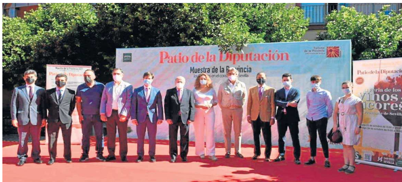
Presentación de la XI Feria de Vinos y Licores de la Provincia de Sevilla.

Muestra. Se celebra la XI Feria de Vinos y Licores de la Provincia de Sevilla