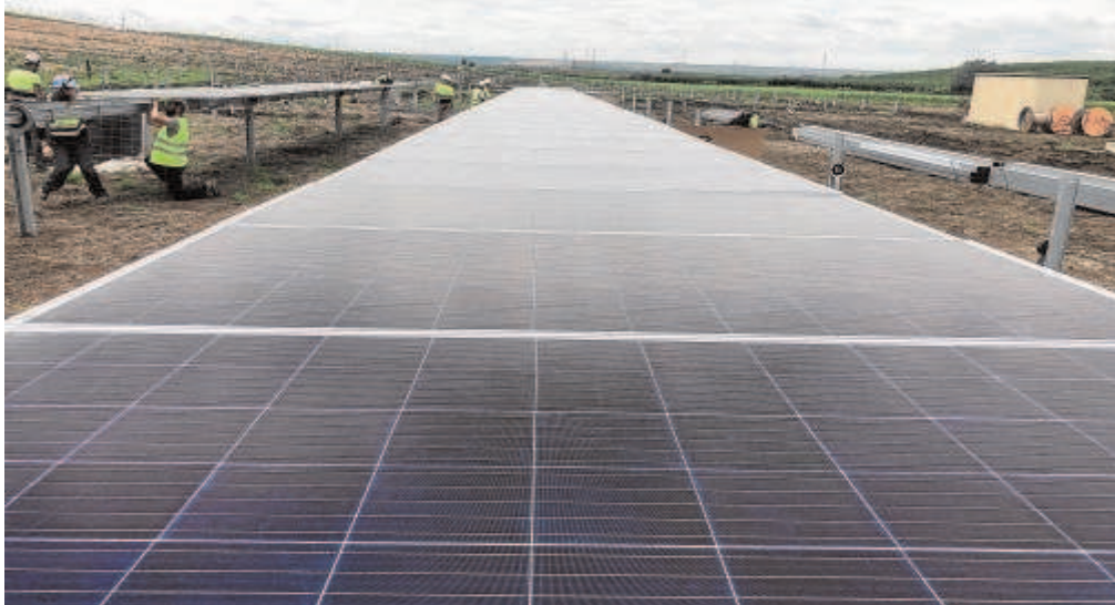
Instalación de placas en la Comunidad de Regantes del Bembézar // ABC