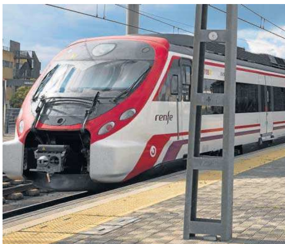
Un tren de Cercanías en Sevilla.

“Disponer de una conexión directa desde Portugal y Extremadura a Sevilla y Los Rosales (y viceversa) supone abrir un inmenso mundo de posibilidades y de combinaciones sin precedentes”, afir-