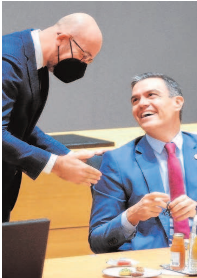
Pedro Sánchez ríe y conversa con Charles Michel, ayer en Bruselas

Esto produce un desajuste evidente cuando Trabajo promociona su «diálogo social» con los sindicatos desde hace meses y Díaz y su equipo insisten en que la negociación está «muy avanzada» y encaminada a materializarse antes de acabar el año. Algo que también dijo el presidente en alguna ocasión. Pero precisamente para que este tipo de declaraciones discordan-