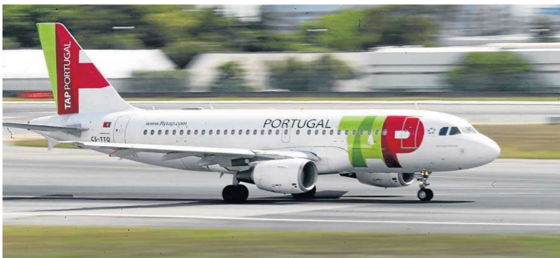
Un avión de la compañía portuguesa TAP.