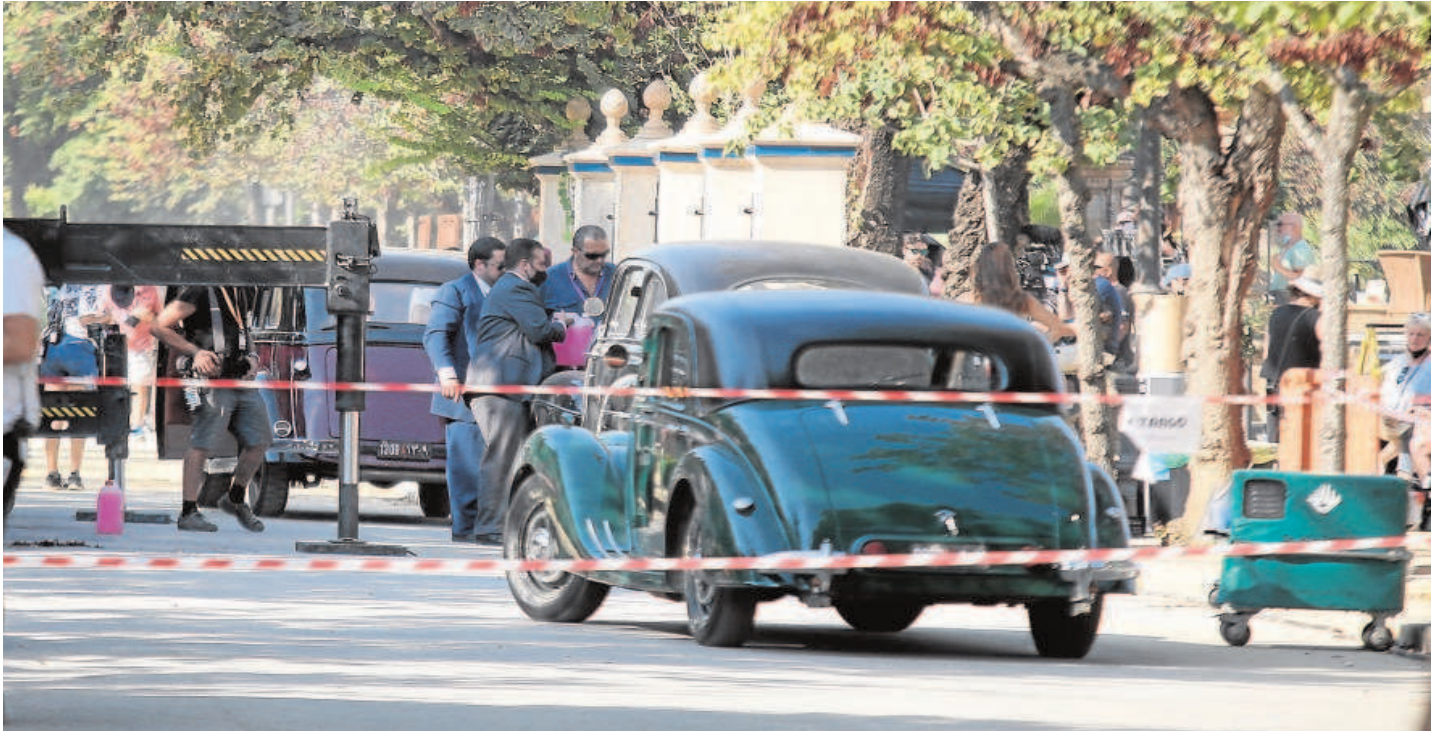
de la exitosa serie de Netflix The Crown

tacto a la promotoras con la industria local y sus profesionales a través de un directorio de empresas de Sevilla.