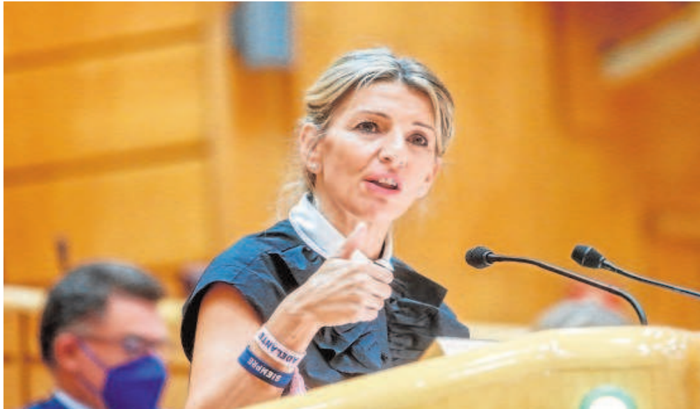
La vicepresidenta segunda y ministra de Trabajo y Economía Social, Yolanda Díaz, en el Senado