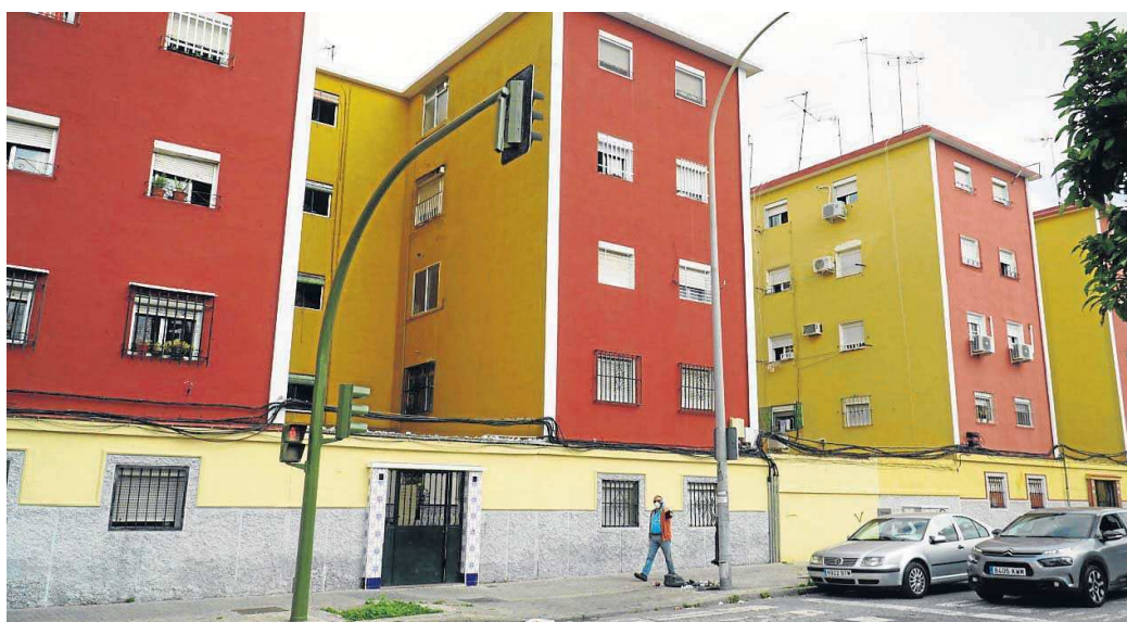
Bloques de pisos en Los Pajaritos.