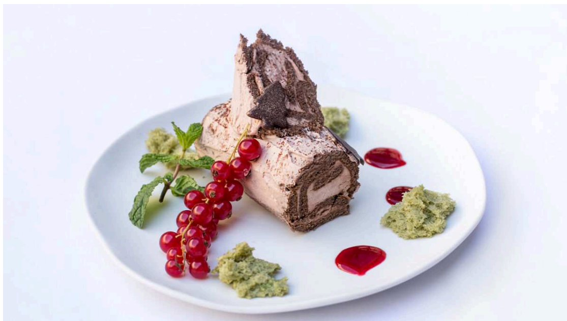
Dulce navideño del menú de Navidad del Hotel Alfonso XIII.