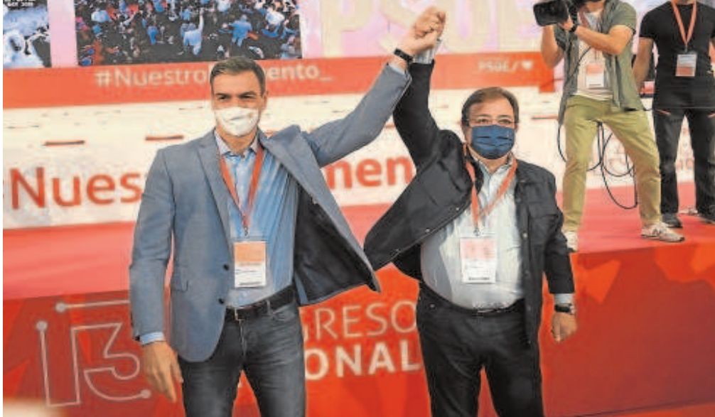
Pedro Sánchez y Guillermo Fernández-Vara, ayer en la clausura del congreso de los socialistas extremeños