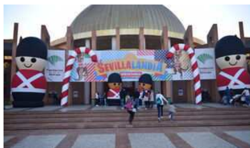
Sevillalandia vuelve a Fibes esta Navidad 2021.