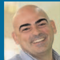
Sam Brocal Media Interactiva

«El acceso a rondas de financiación importantes es uno de los mayores escollos para emprender en la región»