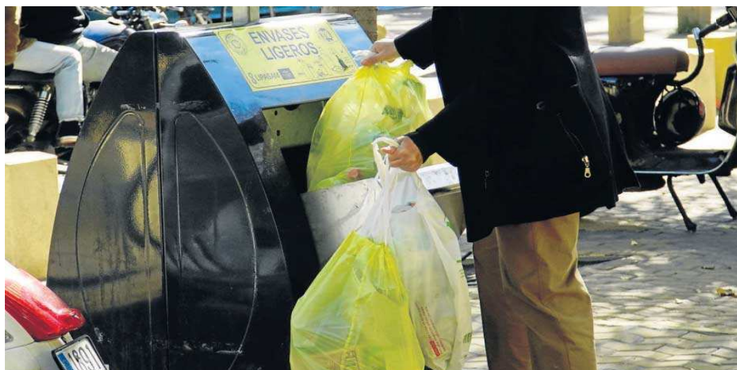
Un vecino de Sevilla con bolsas de basura que se dirige hacia los contenedores.

contra de lo que se esperaba con la nueva ley –necesaria para adaptar una directiva europea de 2018, cuyo plazo terminó en 2020 y que se ha abordado ahora con prisas, vía decreto ley– la redacción no ha incluido que esas entidades financien el reciclaje de la totalidad de esos "envases ligeros", que pueden suponer el 70% del volumen del cubo de la basura, y que lo hagan de forma inmediata, sino que seguirá sólo con los que van a contenedores específicos y se ampliarán a partir de 2026 y con una serie de matices y objetivos que harán que, como mucho, se alcance el 50%.