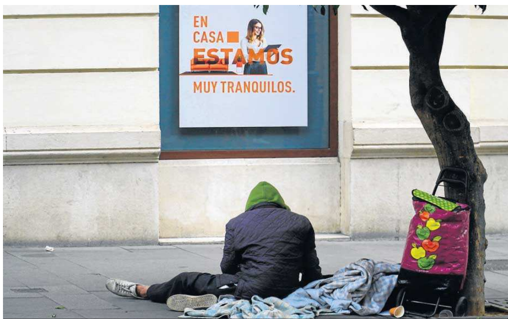
Una persona sin hogar, en una plaza de Sevilla.