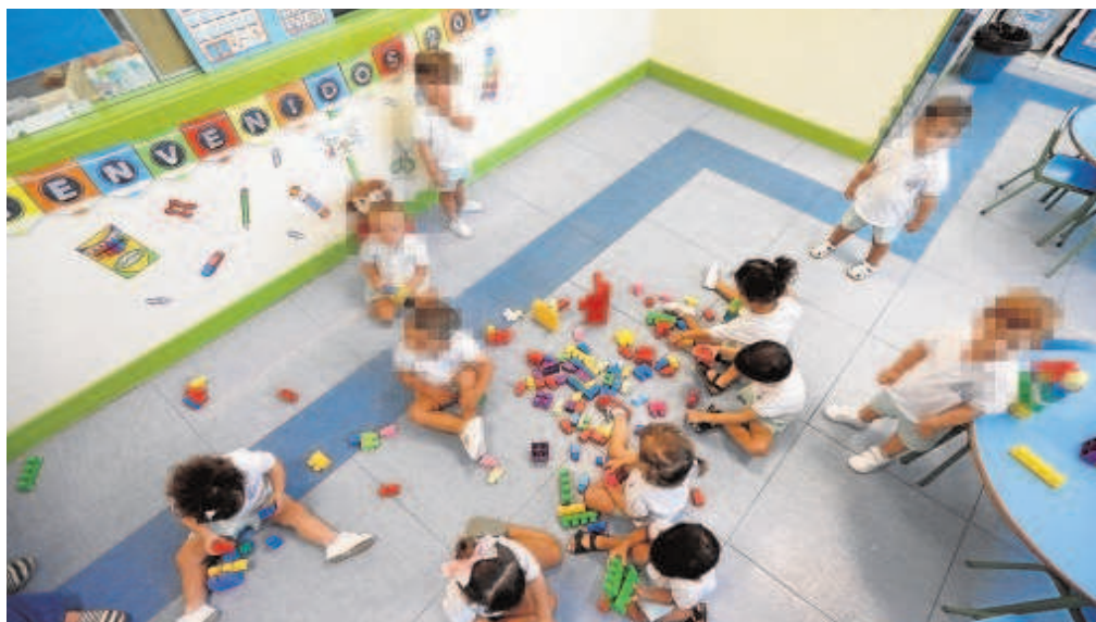
La ONG señala que con la pandemia ha caído la escolarización un 17% en toda España

A pesar de los esfuerzos de la Junta de Andalucía, las familias llegan a asumir de media el 28% de los costes totales del servicio. La media en la Unión Europea está en el 25%. A esto se le suman también los costes ocultos —compra de material, libros, etcétera—, que tienen que sufragar íntegramente las familias, lo que puede desincentivar las matriculaciones.