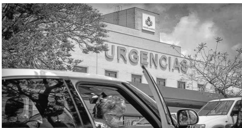
El hospital de San Juan de Dios de Bormujos.