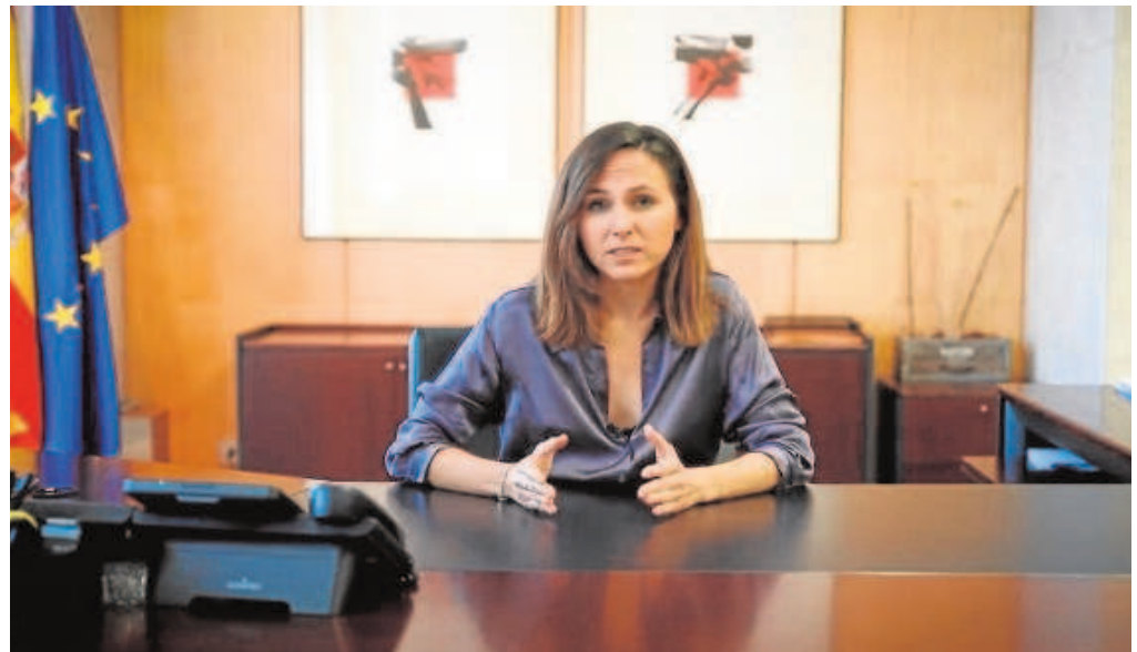
La ministra de Derechos Sociales colgó un vídeo en redes sociales para reivindicar su papel en la ley de Vivienda

'El TC anula la plusvalía municipal y Hacienda cambiará la ley'. [Pág. 46]