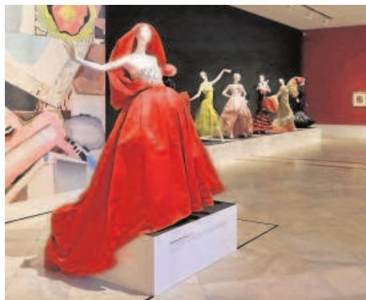
Vestido de Stéphane Rolland y pintura de Luis Gordillo

Los guiños a Sevilla continúan con otros nombres como el de Luis Gordillo, artista que ha reinterpretado especialmente para esta exposición su