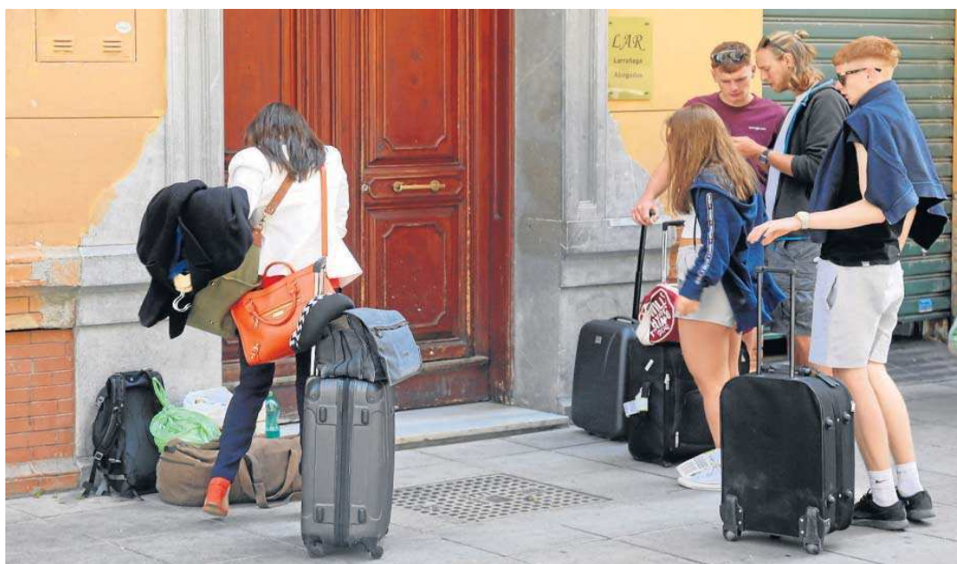
Un grupo de turistas espera en la puerta de una vivienda turística de Málaga.

El decreto ley de 2018 cita el factor de la casa para turistas en el alza del precio del alquiler