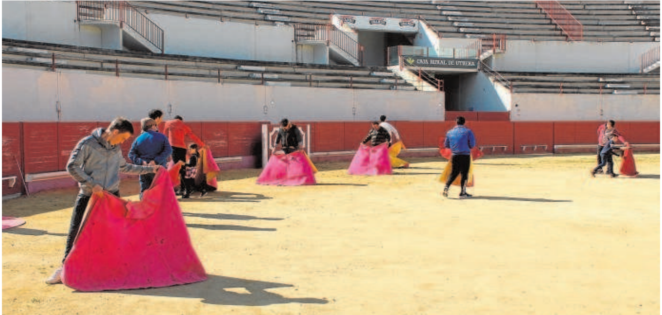
Una de las clases sobre el coso taurino utrerano de la Mulata, donde jóvenes promesas se inician en el mundo del toro

La asociación 'Curro Guillén', impulsora de esta iniciativa, ha tenido que ampliar el plazo de matriculación ante la gran cantidad de peticiones de jóvenes promesas