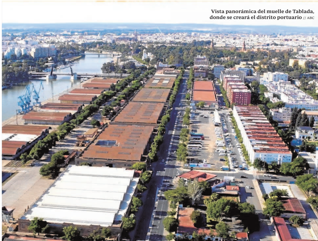
Vista panorámica del muelle de Tablada, donde se creará el distrito portuario