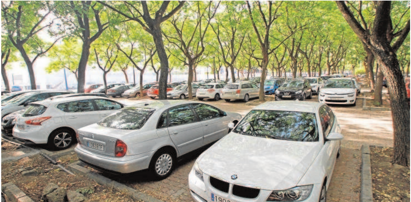
Uno de los aparcamientos del parque tecnológico que suele estar repleto de coches cada día