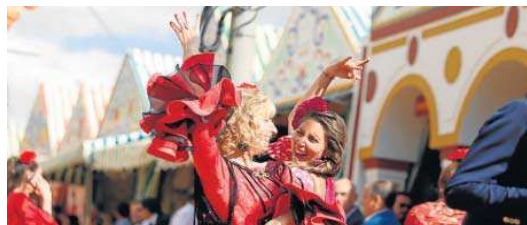
Dos mujeres bailan por sevillanas en el real de la Feria. D. S.