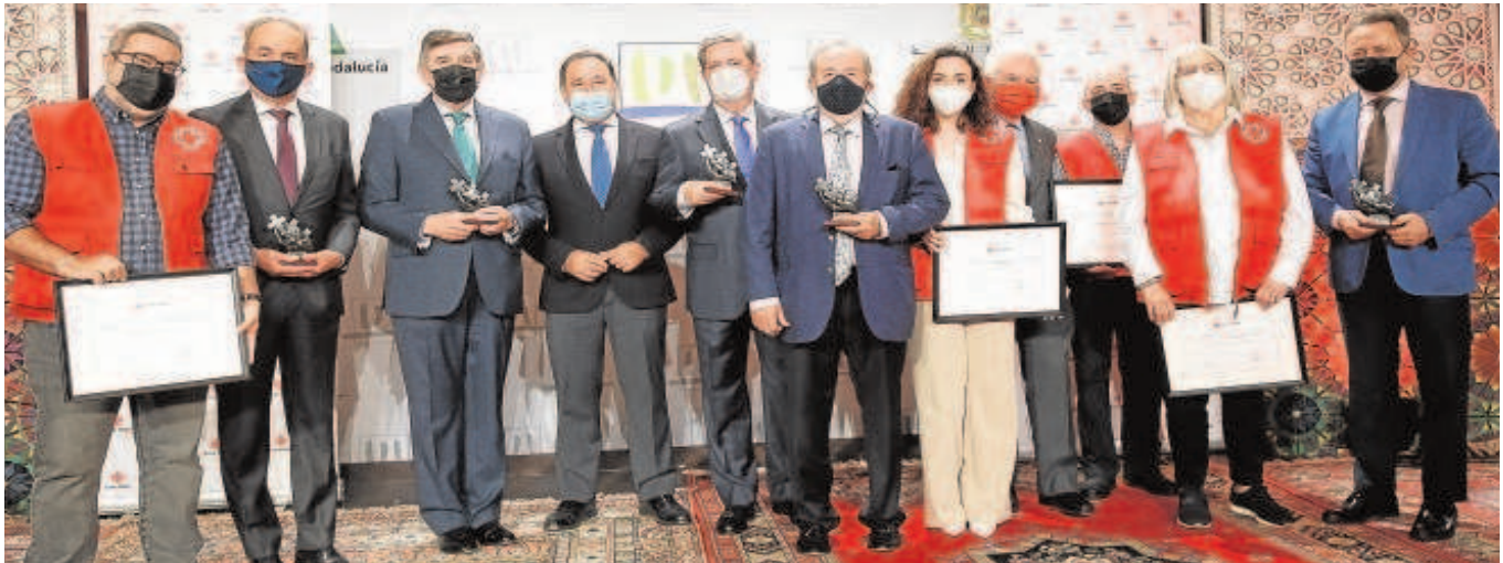
Representantes de las instituciones premiadas y voluntarios recogieron los reconocimientos