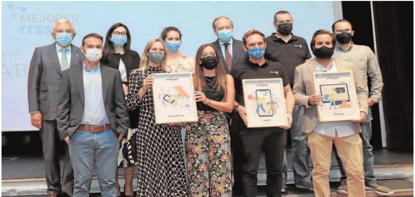
Los galardonados posan con los organizadores y los patrocinadores tras el acto de entrega de los premio Environet