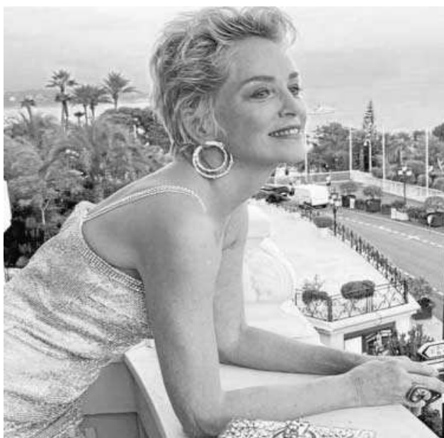
Sharon Stone posa en las redes en la tarde monegasca.

Los Elle Style Awards 2021 que se entregan esta noche en la gala sevillana contarán también con los