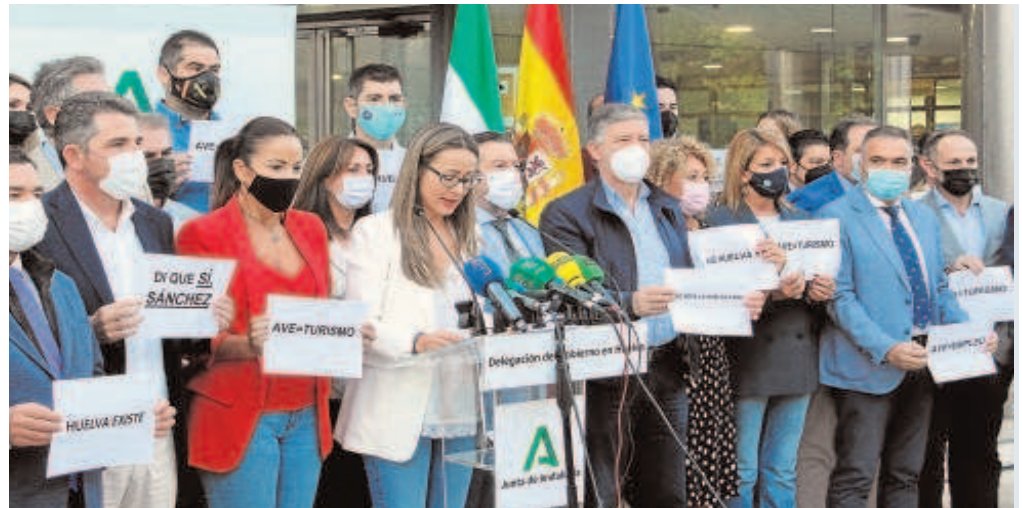
Cargos institucionales y políticos del PP y Cs en la concentración ante la sede de la Junta en Huelva

A comienzos de verano, se dio un paso, con una alianza entre Huelva y Sevilla a través de sus respectivas Cámaras de Comercio, federaciones de empresarios y ayuntamiento de ambas capitales.