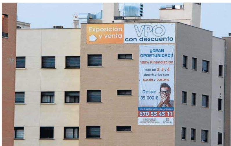
Una promoción de viviendas en venta en Mairena del Aljarafe.