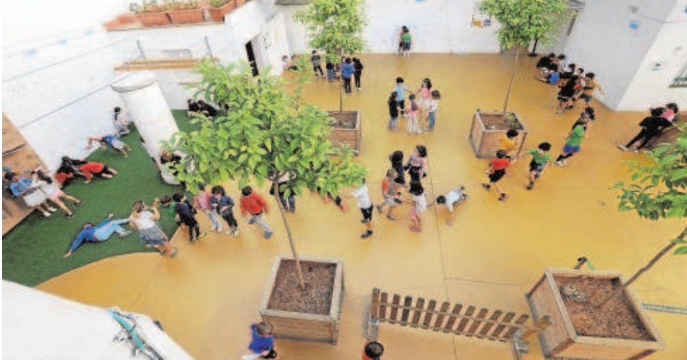
Sobre estas líneas, escolares en el patio de un colegio