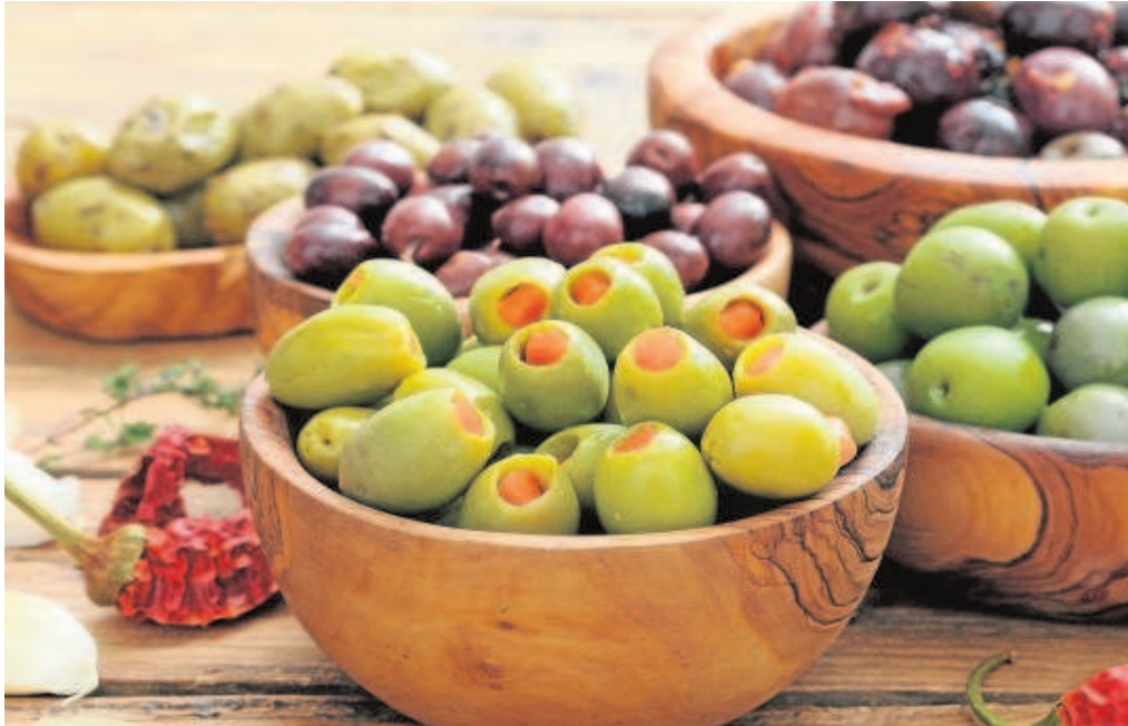
Aceitunas Guadalquivir (Agolives) es uno de los principales exportadores de aceituna de mesa