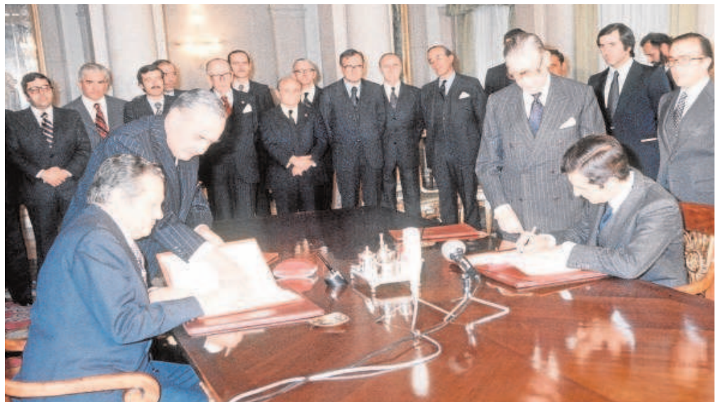
EL TRATADO DE SUÁREZ-SOARES EN 1977 Ambos países habían salido de sendas dictaduras, por ello aquel primer Tratado de Amistad y Cooperación suscrito por Adolfo Suárez y Mario Soares fue calificado de

Cada ministro mantendrá una reunión con su contraparte lusa como previa al plenario en el Palacio de los Duques de San Carlos. Los acuerdos se firmarán en el Conventual de San Francisco.