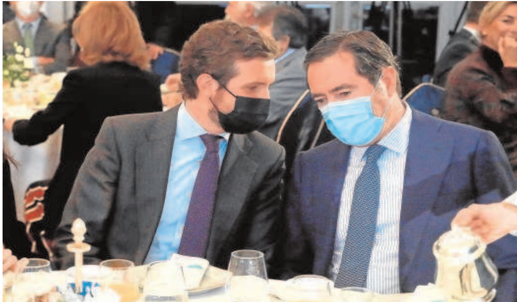
Pablo Casado y Antonio Garamendi, en un desayuno informativo ayer en Madrid