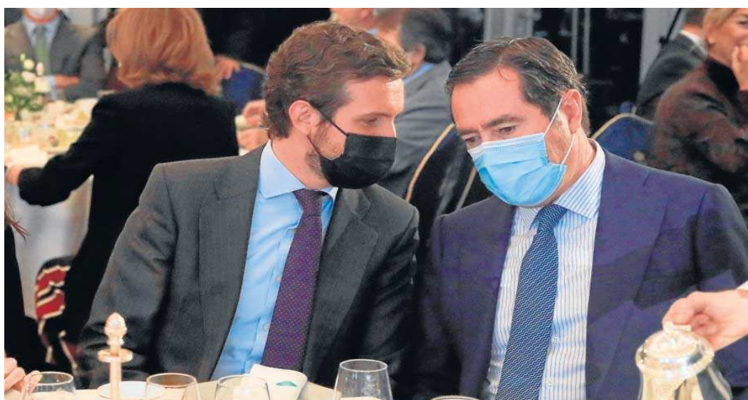
El líder del PP, Pablo Casado, conversando con el presidente de la CEOE, Antonio Garamendi, ayer en un desayuno informativo en Madrid.