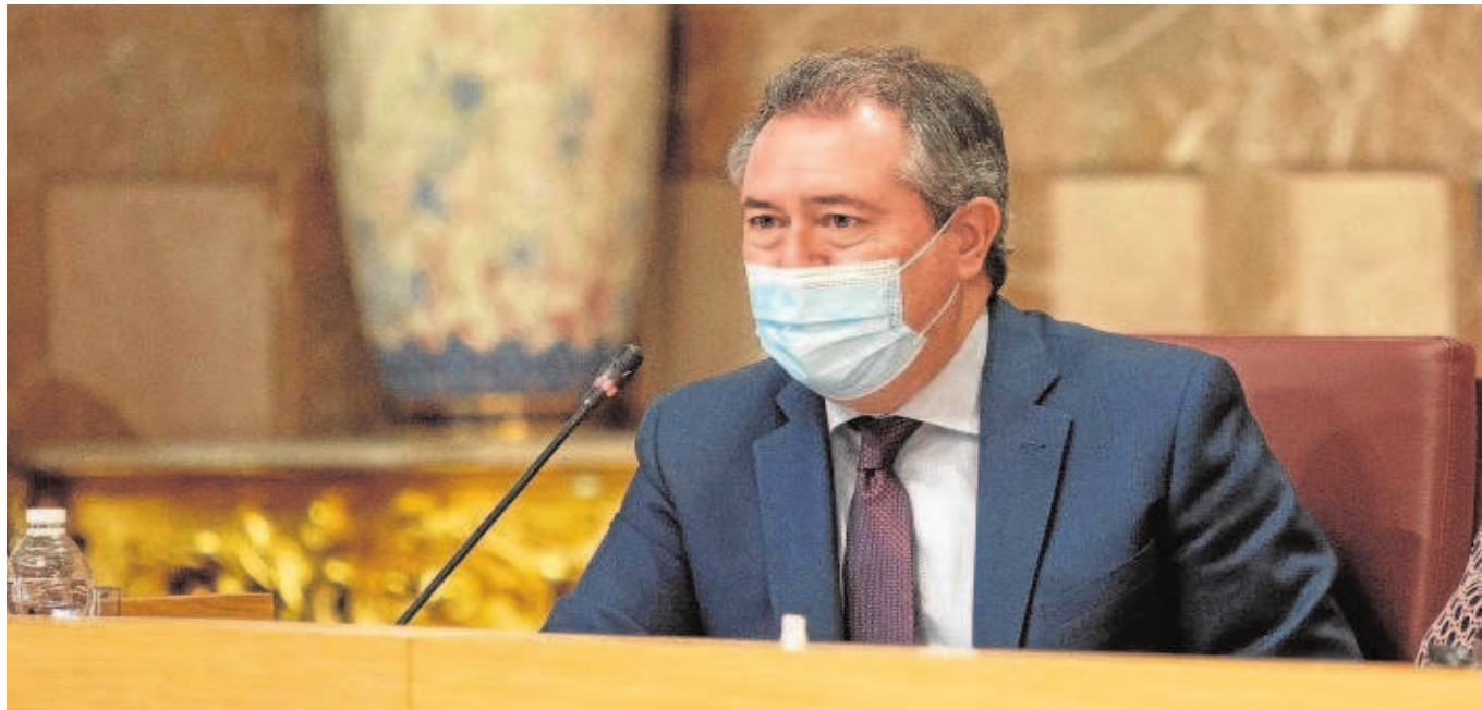
El alcalde de Sevilla, Juan Espadas, en el pleno sobre presupuestos