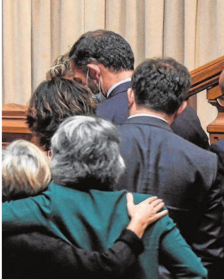
El 'premier' Costa abandona el Parlamento tras el voto

cia se convirtió en una barrera infranqueable. Ni el Bloco de Esquerda (similar a Unidas Podemos) ni los comunistas quisieron evitar el descalabro de sus excompañeros, los mismos a los que apoyaban entre 2015 y 2019.