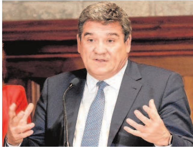
José Luis Escrivá, ministro de Seguridad Social