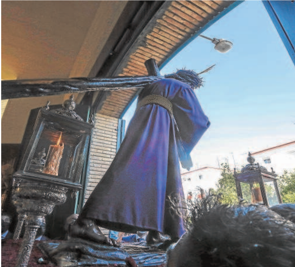
El Gran Poder en la parroquia de la Blanca Paloma de Los Pajaritos