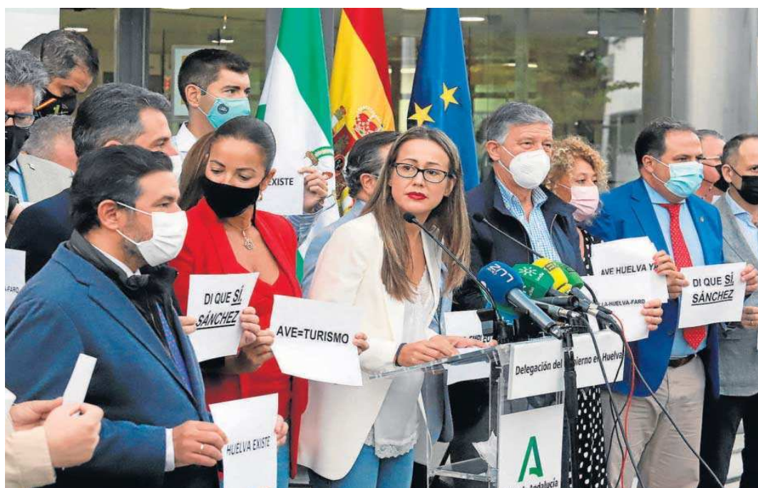
La delegada del Gobierno andaluz en Huelva, Bella Verano, fue la encargada de la lectura de un manifiesto en apoyo del AVE entre Sevilla, Huelva y Faro.

● La Cámara de Comercio de Huelva, delegados provinciales y cargos de PP y Cs exigen una implicación directa del Gobierno en defensa de la propuesta