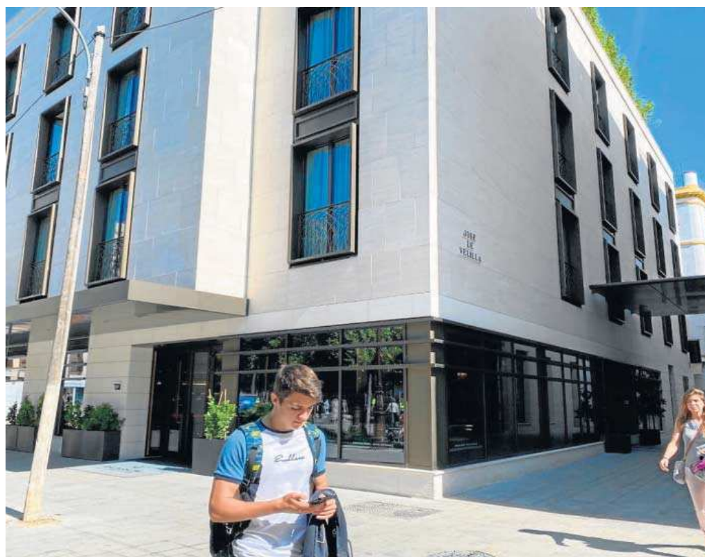
El edificio, transformado en hotel, en el que estaba situada la placa.

Según informaron a este periódico fuentes de esta prestigiosa institución, ayer mismo estaba previsto que enviaran un escrito con el requerimiento al Ayuntamiento, que hasta la fecha se ha limitado a decir que los responsables del hotel en el que se encontraba la placa iban a buscar la mejor ubicación junto a la delega-