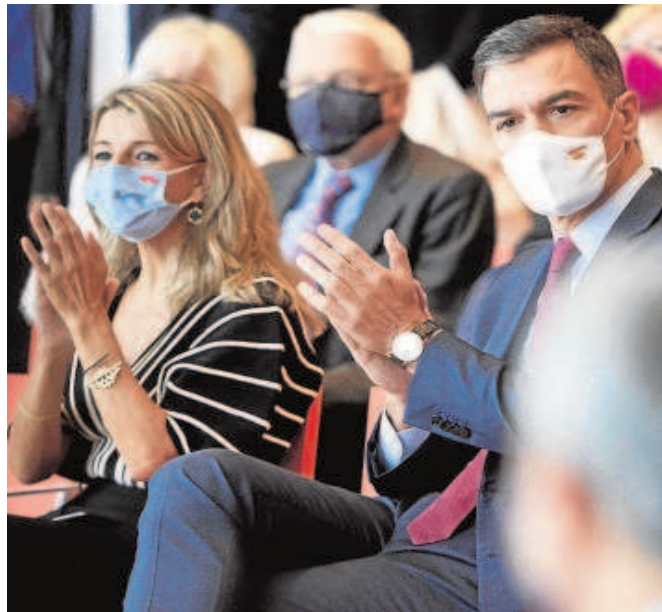
El presidente del Gobierno, Pedro Sánchez, junto a Yolanda Díaz

El Ejecutivo ultima, además de esta ley, medidas específicas para los jóvenes que se quieran independizar. El propio presidente del Gobierno, Pedro Sánchez, anunció ayer que aprobará un bono vivienda de 250 euros mensuales para los menores de 35 años que quieran independizarse y cobren menos de 23.725 euros anuales. «Vamos a destinar una política pública a reducir la edad de emancipación» remarcó el presidente. Eso sí, la medida, que emula el cheque vivienda puesto en marcha por Zapatero en 2010, no estará incluida en la ley de Vivienda, sino que se recogerá en los Presupuestos para 2022, que se aprobarán este jueves. El Gobierno mantiene bajo llave la letra pequeña de la norma. Aún así, el mundo económico ya se revuelve contra ella.