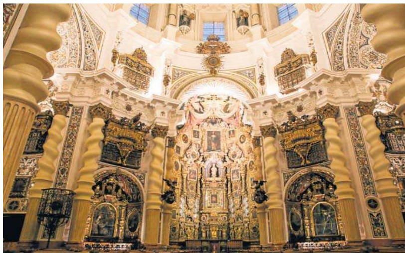
Interior de San Luis de los Franceses.

diferentes proyectos de adecuación de espacios para la próxima incorporación el año que viene al recorrido visitable de una exposición permanente, que dé visibilidad a todos los bienes histórico-artísticos que componen el patrimonio provincial heredado de las instituciones de beneficencia asumidas por la Diputación ya en el siglo XIX.