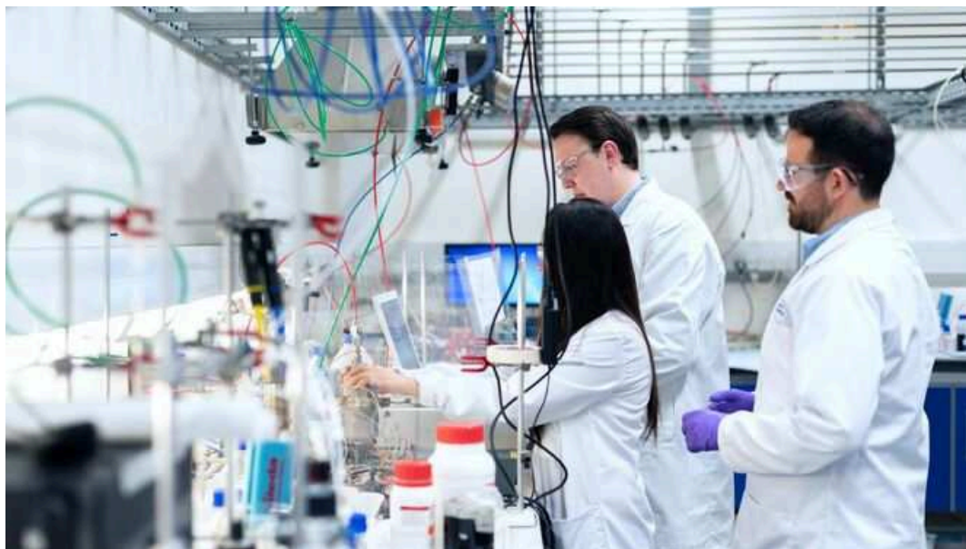
La Bioinformática toma forma de máster en la UNIA y la Hispalense

El valor de los datos está en auge. Algunas empresas los consideran el “nuevo petróleo” que acompaña la era de la Cuarta Revolución Industrial. Si bien, como venía ocurriendo con esta fuente de energía, extraer valor de la información implica un proceso de refinado para aprovechar todo su potencial. Algo a lo que cada vez se abrazan más sectores, generando un creciente nicho de empleo cualificado.