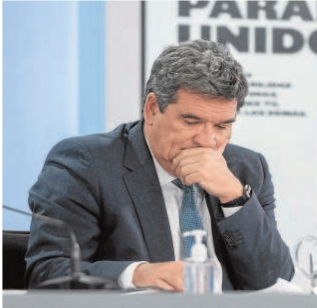
José Luis Escrivá, ministro de Seguridad Social