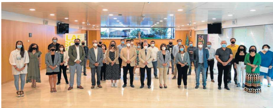
El presidente de la Diputación con artistas y gestores culturales participantes en la edición 2021 del Circuito Cultural de la Provincia.

En la página web de la Diputación https://www.dipusevilla.es/temas/cultura-y-juven-