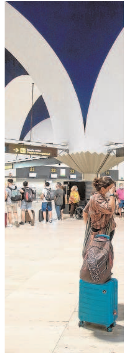
Viajeros con sus maletas junto a la zona de

Otro de los asuntos que aborda este plan son las previsiones para la carga aérea, otro de los negocios importantes para el aeropuerto de Sevilla.