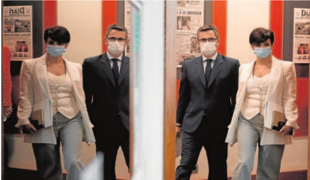
Félix Bolaños, en la imagen con Isabel Rodríguez, se reunió con Ione Belarra, Raquel Sánchez y María Jesús Montero