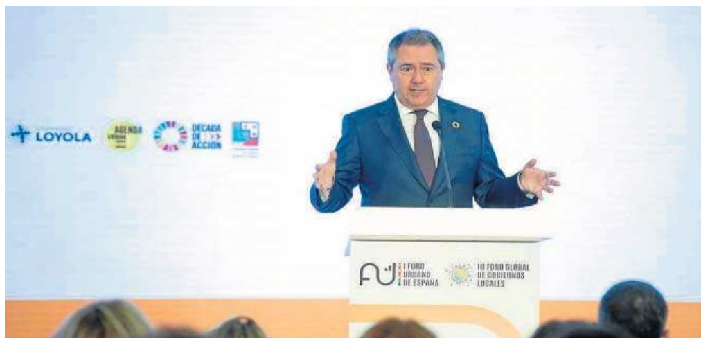
El alcalde de Sevilla, Juan Espadas, interviene en la inauguración del I Foro Urbano de España.