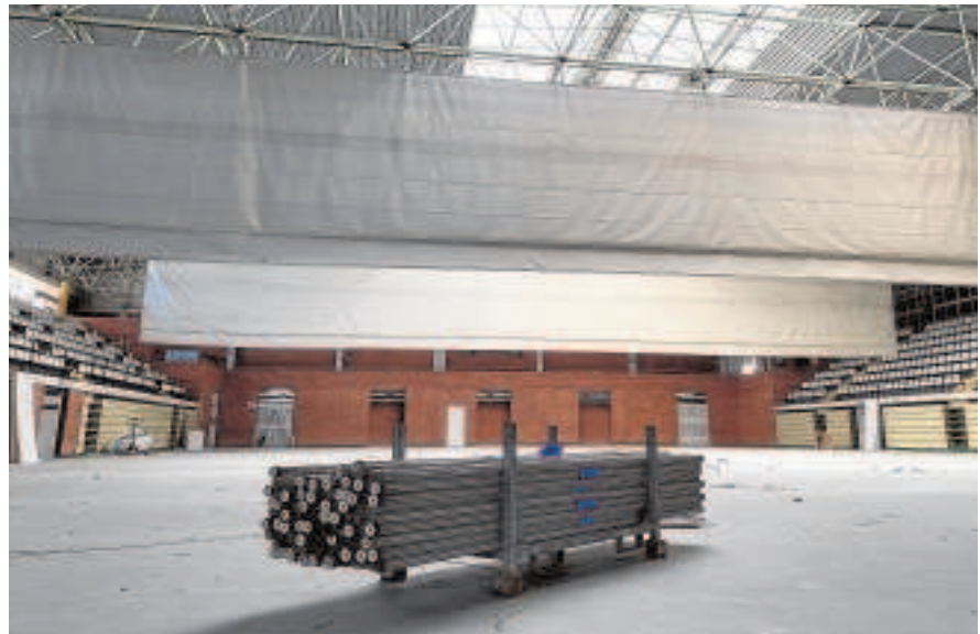
Desmontaje del hospital de emergencia de Carranque en Málaga

La situación actual de control sobre la quinta ola y baja incidencia ha recomendado el desmontaje de estas instalaciones extraordinarias. Ayer había ingresados en los hospitales andaluces 287 pacientes con Covid de los que 84 son críticos en UCI. Ocupan solo el 1,9 por ciento de las camas del sistema sanitario público de Andalucía -un 4,54 por ciento en el caso de las UCI-.