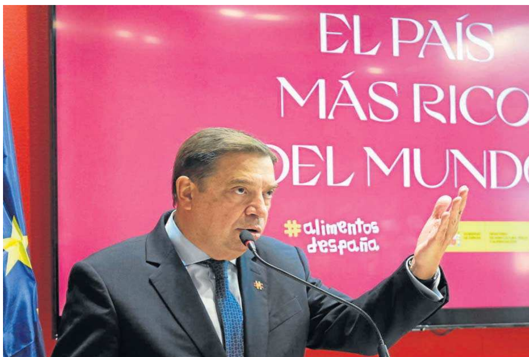
El ministro Luis Planas, durante su intervención en la inauguración de Fruit Attraction 2021, ayer en Madrid.

Firmas de 44 países presentan sus productos, 78 de ellas andaluzas