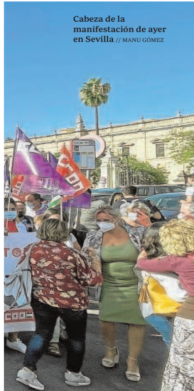
Cabeza de la manifestación de ayer en Sevilla

tores económicos también para mantener ciertas medidas contra el coronavirus (la mascarilla era obligatoria y los manifestantes guardaban ciertas distancias).