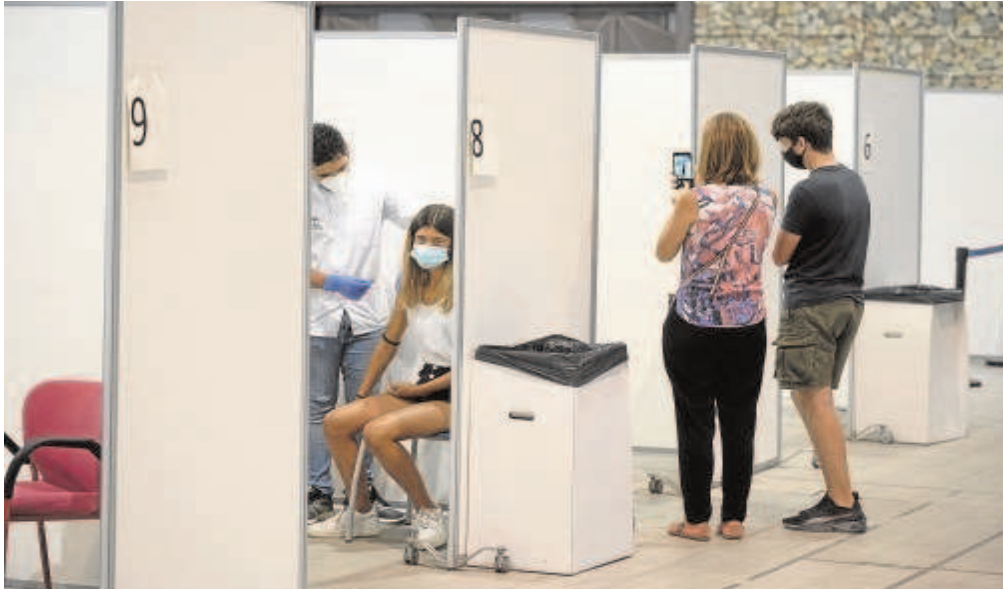
Jóvenes reciben la vacuna contra el Covid-19 en Málaga capital