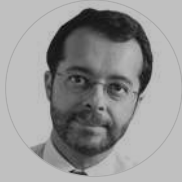
J. M. MARQUÉS PERALES ARTÍCULOS