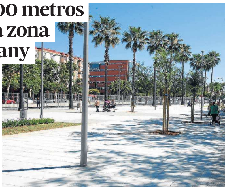
Varias personas en el parque de Juan Antonio Cavestany, en una imagen de archivo.

por una locomotora y dos vagones, un columpio cesta y cuatro pequeños elementos. Por último, el pavimento tiene un revestimiento de caucho en colores sobre base de caucho negro y subbase de solera de hormigón. “En general, se puede afirmar que la zona de juegos sobre la que se va a actuar está en perfectas condiciones de conservación, pero está situada alejada de la sombra de los árboles, con lo que en verano queda expuesta a las altas temperaturas”,