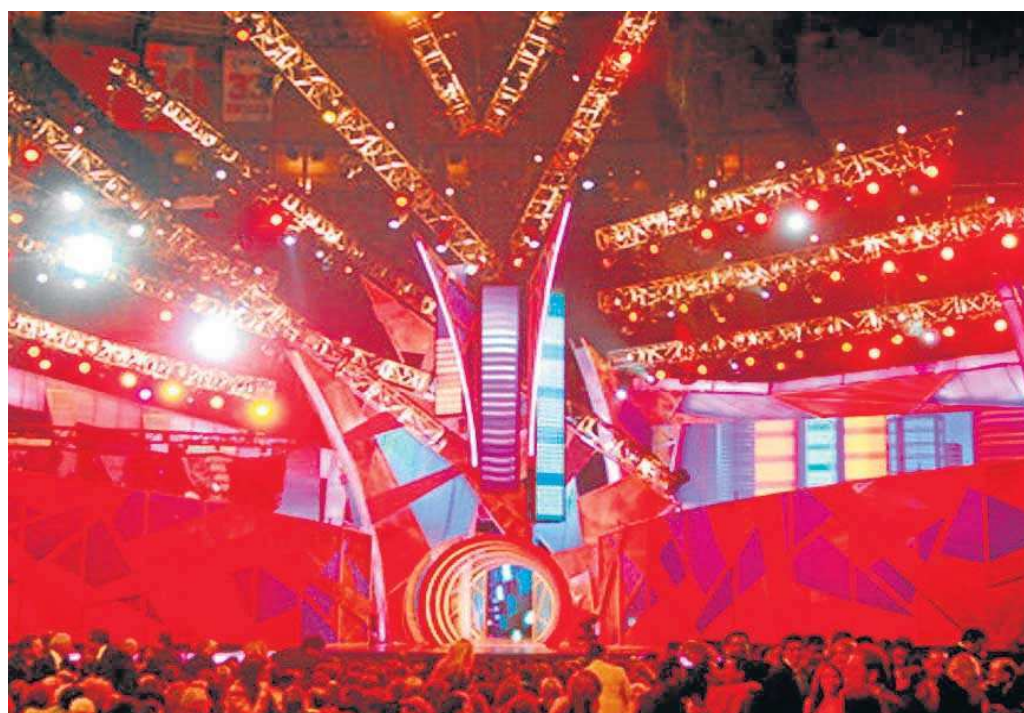
Una de las ediciones de los premios Grammy Latinos en Las Vegas.

Turespaña confía en la potencia del destino y en su capacidad para organizar grandes eventos y, aunque su relación suele ser con organismos regionales, en esta ocasión tiene hilo directo con la capital, lo que se traduce en un trato preferente entre sus 33 destinos emisores. También