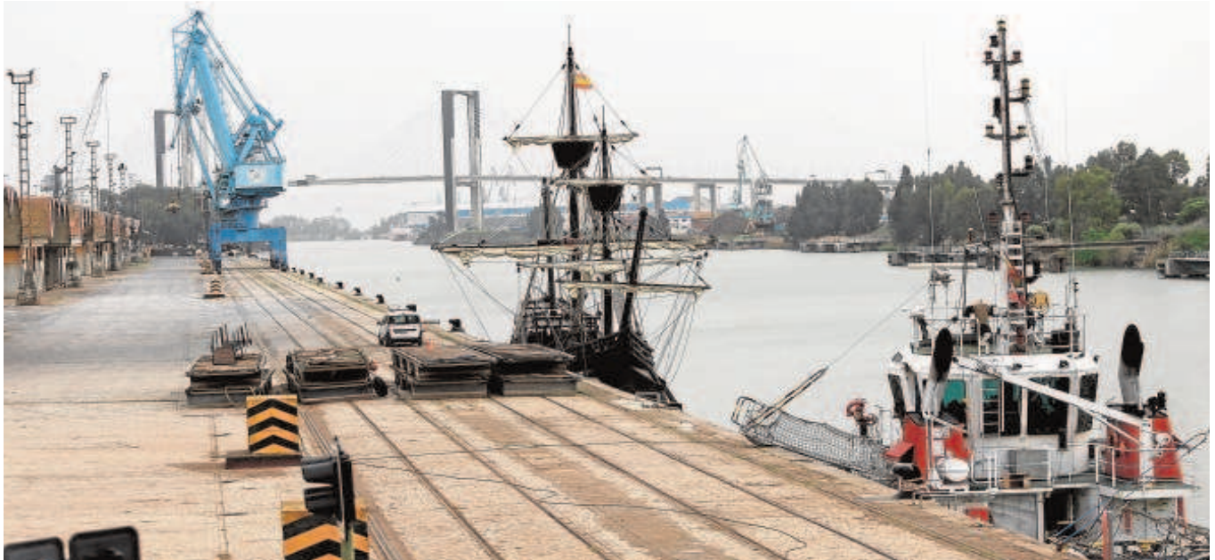
El Puerto irá liberando poco a poco el muelle de Tablada para rehabilitarlo y abrirlo a la ciudad