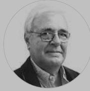
CARLOS COLÓN ARTÍCULOS