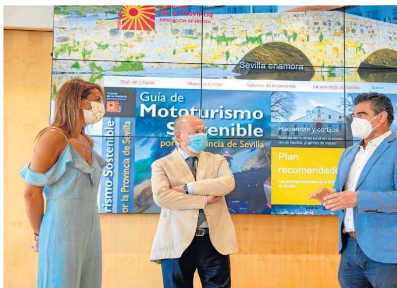
Imagen de archivo de la presentación de la nueva web de Turismo de la Provincia de Sevilla.

“Magnífico dato para un Puente que coincide con el fin de las restricciones en la provincia, dado que la totalidad de pueblos sevillanos han descen-