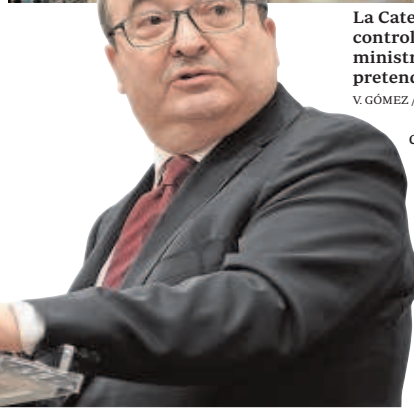
La Catedral y el Alcázar se salvan del control gubernamental al enterrar el ministro Iceta el anteproyecto que pretendía invadir sus competencias

de titularidad autonómica, municipal o privada. Esta medida afectaba a 15 monumentos andaluces, dos de ellos en Sevilla (la Catedral y el Alcázar, porque el tercero en cuestión, el Archivo de Indias, depende directamente del Ministerio de Cultura).