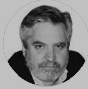
LUIS SÁNCHEZ-MOLINÍ ARTÍCULOS