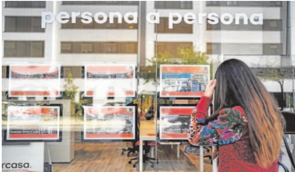
Las inmobiliarias han avisado que el nuevo bono puede inflar aún más los precios