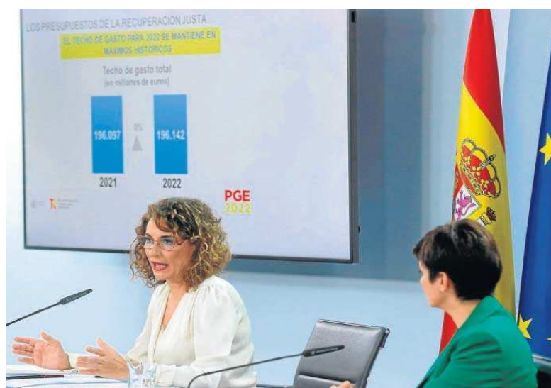
María Jesús Montero e Isabel Rodríguez, en rueda de prensa tras el Consejo de Ministros extraordinario de ayer.

Las políticas de juventud –dotadas con 12.550 millones, un 84,8% más– concentran buena