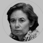
PILAR CERNUDA ARTÍCULOS