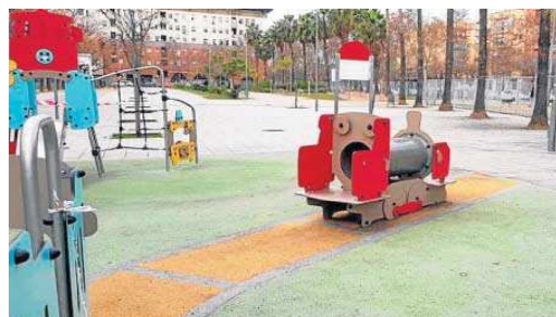
Estado actual de la zona infantil.

apuntan los técnicos en la documentación del proyecto.