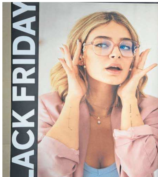
No hay sector que se resista al 'Black Friday'. También las ópticas.

Otra de las firmas señeras que ha decidido adelantar los descuentos ha sido El Corte Inglés, donde los clientes que posean su tarjeta de compra pueden desde ayer adquirir artículos rebajados de precio (hasta un 30%) en moda, lencería y zapatería. Además, podrán conseguir tiques regalos para los días 27, 28 y 29. Para todos los clientes de este gran almacén, el Black Friday comenzará mañana, 24 de noviembre, en los departamentos de belleza, perfumería, accesorios, joyería, relojería, bisutería, deportes, cultura, ocio, hogar y Bricor, con descuentos de hasta un 40%. Un día después se podrán encontrar