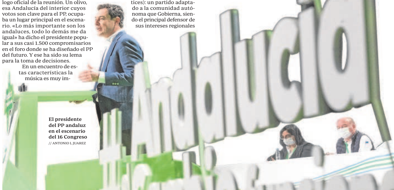
El presidente del PP andaluz en el escenario del 16 Congreso