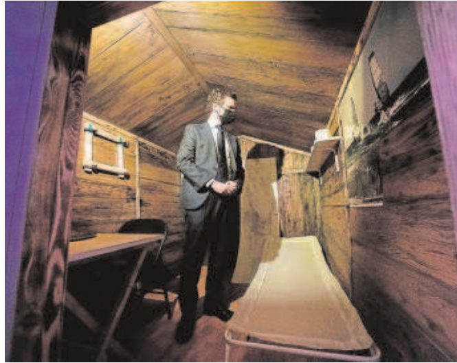
Pablo Casado, durante su visita a la réplica del zulo de Ortega Lara