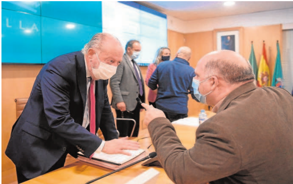
El presidente Villalobos dialoga con Juan Manuel Heredia, diputado de Empleado Público de la Diputación