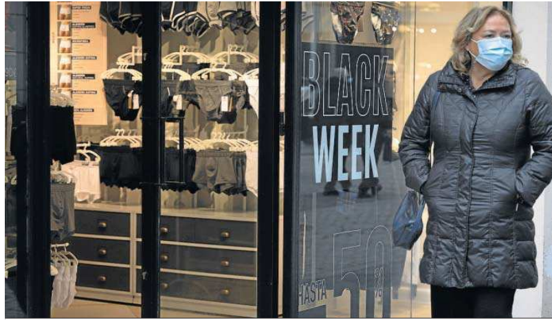
Artículos preparados para estas rebajas de otoño.

La estrategia seguida por Mediamarkt –firma especializada en productos electrónicos– constituye un claro ejemplo de que esta fecha de descuento se alarga cada vez más. Responsables de la tienda que esta marca posee en el centro comercial Lagoh recuerdan que el 3 de noviembre comenzó la campaña de ofertas con el Día Sin IVA, para seguir luego el 10 y 11 de este mes con rebajas del 20% en la venta on line . Desde ayer ya están disponibles las ofertas de su primer folleto del Black Friday . Se prevé que los productos más demandados esta semana sean los relacionados