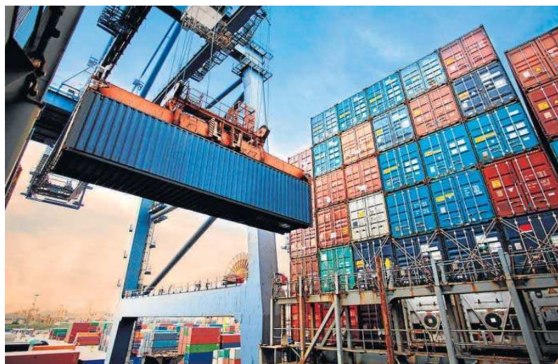
Trabajos de estiba de un contenedor en un buque.

El crecimiento del sector exterior andaluz entre enero y septiem-