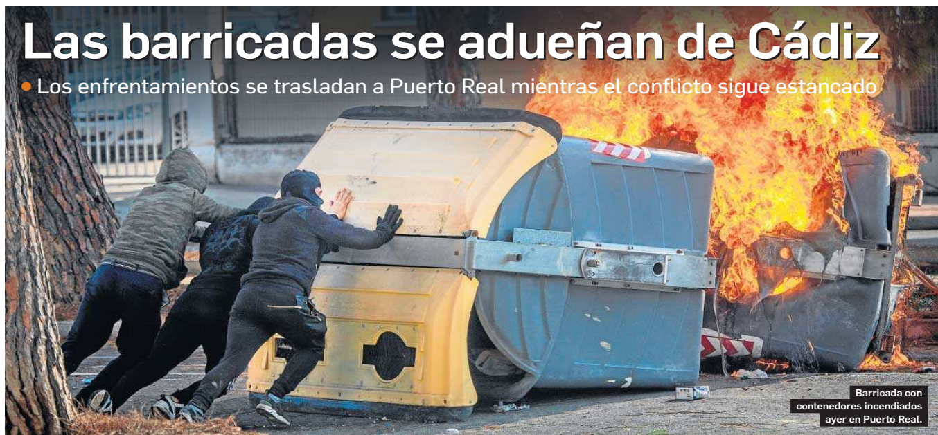
Barricada con contenedores incendiados ayer en Puerto Real.

• Los enfrentamientos se trasladan a Puerto Real mientras el conflicto sigue estancado