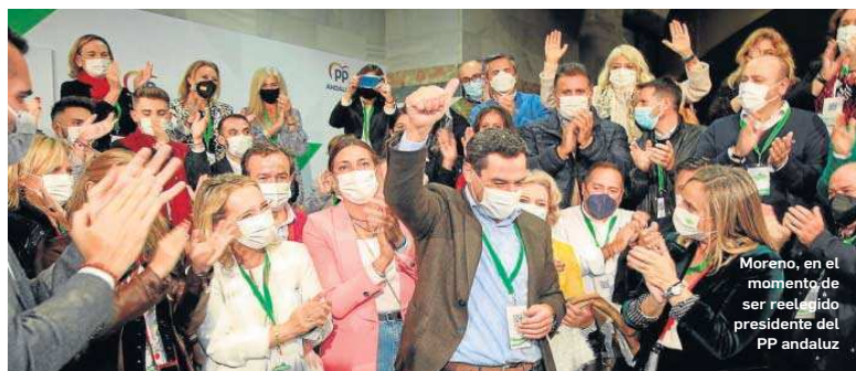
Moreno, en el momento de ser reelegido presidente del PP andaluz

Que el primer día de congreso acudiera al escenario el líder de Ciudadanos en Andalucía es para alegrarse. Juan Marín, vicepresidente de la Junta, acababa de ser descubierto en una traición flagrante al PP, su socio de gobierno en la Junta. Instó recientemente a sus diputados a demorar la aprobación de la ley que debe facilitar el desarrollo urbanístico de los territorios, una de las estrellas legislativas del Gobierno. Marín llegó el viernes y compartió escenario con Elías Bendodo. El malestar fue general, pero ya se sabe que en el PP nadie se atreve a hacerlo público. La disciplina en el centro-derecha