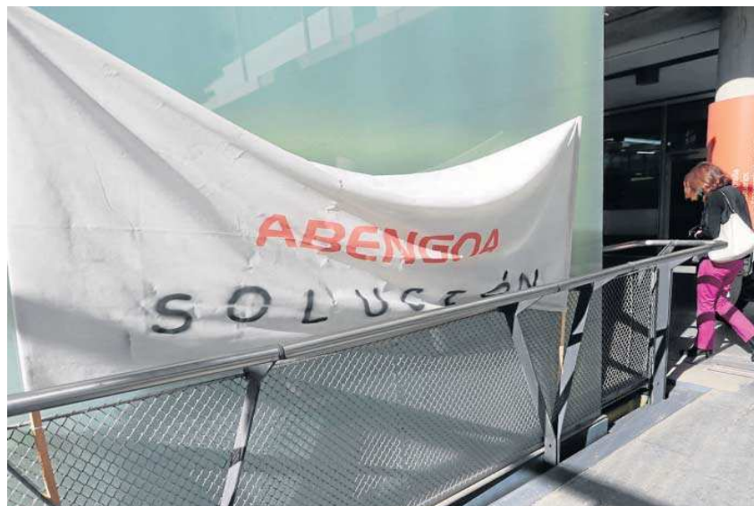
Una pancarta de las protestas de los trabajadores, colocada en la sede de Abengoa, el pasado lunes.