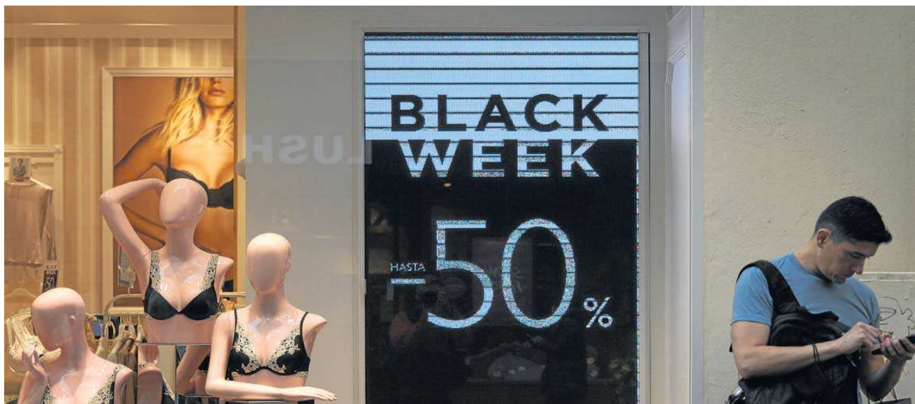
Los descuentos en algunas tiendas se mantienen durante toda esta semana.

El presidente de Aprocom reconoce que esta jornada de descuentos cubre la demanda que hace años realizó el sector para que hubiera una temporada de rebajas "intermedia", debido a la gran pérdida de ventas que sufrió esta actividad tras la crisis de 2008. "Lo ideal sería que no estuviera tan unida a la campaña navideña", refiere González, quien añade que aún hay establecimientos que se niegan a participar del Black Friday . "Lo siguen considerando una tradición americana, como Halloween , pero lo cierto es que esto es un tsunami, o te sumerges o te arrastra", admite el representante de los comerciantes sevillanos.