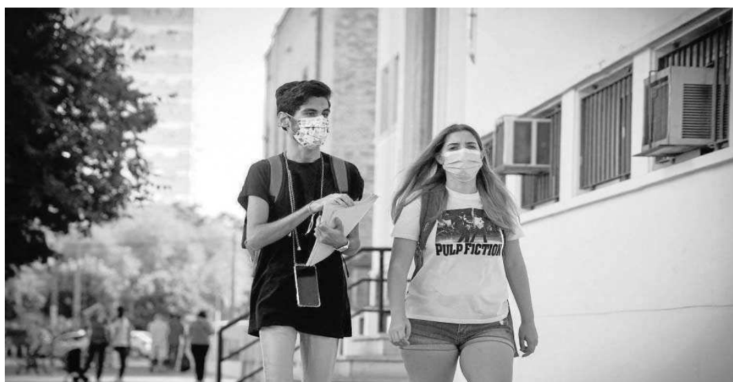
Dos jóvenes caminan en el distrito Macarena.

● El órgano asesor alerta de que el desempleo entre los jóvenes ha aumentado más de un 51% en 2020 ● Recuerda que la ciudad tendrá más inversiones e ingresos si gana habitantes