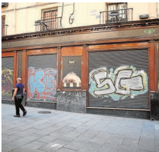
Comercios cerrados en el centro de Madrid

Según el Banco de España, hasta un 18,7% de las empresas españolas podrían estar en situación de insolvencia a finales de año por el impacto económico de la pandemia. De acuerdo al peor escenario de los análisis de la institución, una de cada 10 son zombis inviables y la proporción