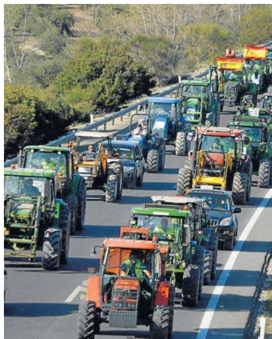
Tractorada de protesta por las carreteras andaluzas.