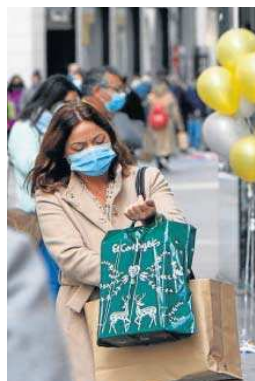
Una imagen del 'Black Friday' 2020.

artículos rebajados de coste en la sección de juguetes.