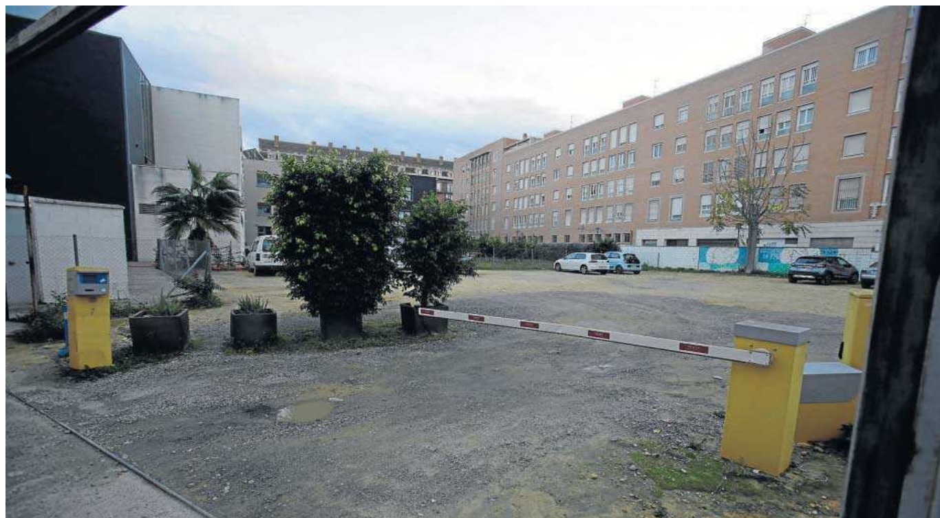
La parcela se encuentra detrás de la residencia Gerón, en la calle San Juan Bosco.