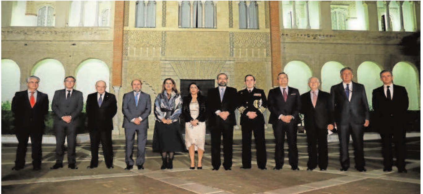
Autoridades y galardonados ayer en el patio de la Montería del Real Alcázar de Sevilla