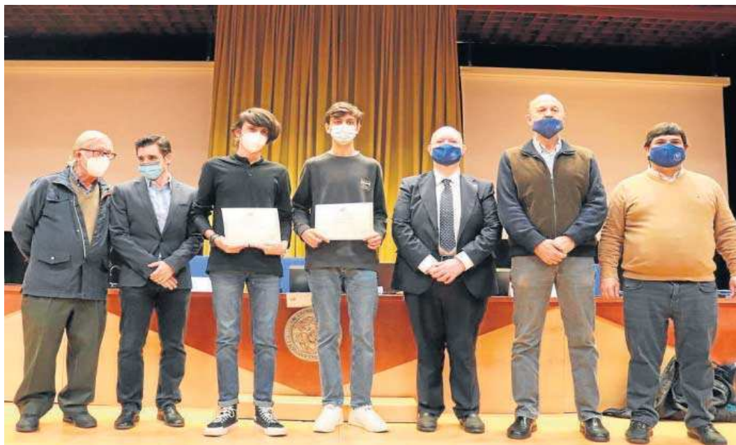
Los dos alumnos premiados exhiben sus diplomas.