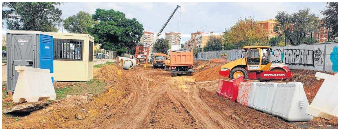
Los terrenos de Guadaira Sur cuentan con una edificabilidad de 35.700 metros cuadrados.