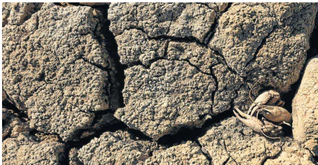
Un cangrejo en un humedal sin agua de Sanlúcar la Mayor.

También fue claro sobre la gravedad de la situación, “preocupante, compleja y complicada”, con datos que evidencian que Andalucía lleva “25 años en el cambio climático”. Como habían advertido