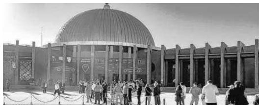
Visitantes en las puertas del Palacio de Exposiciones y Congresos.

de la organización se han cumplido finalmente, registrándose unas ventas de más de 1.800 vehículos, a los que habrá que sumar más de un 20% de operaciones pendientes de cierre en los próximos días, con lo que se alcanzarían unos resultados simi-