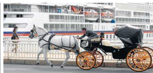
Un coche de caballos cruza el puente con un crucero en fondo.

Desde Suncruise Andalucía se trabaja para potenciar también la industria del crucero. Por ello, hace un año lanzó un reto a las universidades españolas para que plantearan una solución que permitiera medir la experiencia del crucerista, el último eslabón de una cadena sin el que no existiría dicha industria. La intención es tener todos los datos posibles de este viajero: desde que empieza a soñar con el crucero (búsquedas en la red), hasta que se sienta a comprarlo (agencias de viajes), cuando diseña los itinerarios y experiencias en tierra (turoperación), cuando elige la naviera, el tipo de barco y navegación (tipo de sector, generalista o premium...); y luego, midiendo también el postcrucero, cómo ha sido la experiencia del crucerista, donde entran detalles como la sostenibilidad o la digitalización. El reto lo ganó la Universidad Católica de Murcia, que definió qué se puede medir exactamente y qué no. "A partir