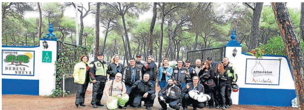
Los participantes en una de las rutas organizadas con la colaboración de Prodetur.

Concretamente, fueron cinco rutas las que han recorrido los asociados durante su estancia en la provincia, en un itinerario que