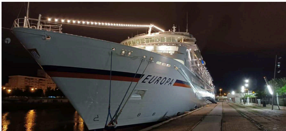
Crucero Europa atracado en el Muelle de las Delicias. PUERTO SEVILLA