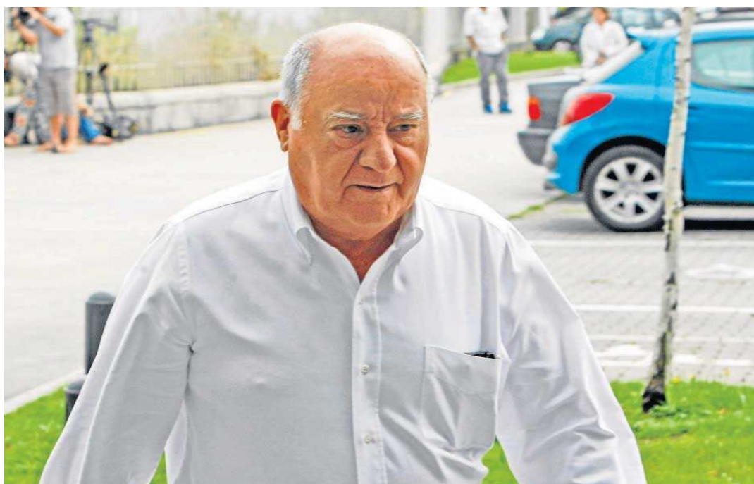
Amancio Ortega, fundador de Inditex.

● El presidente de Inditex posee una fortuna de 67.000 millones, 10.000 millones más que en 2020, y lidera la lista de 'Forbes', en la que Juan Roig ocupa la cuarta posición, con 3.700 millones