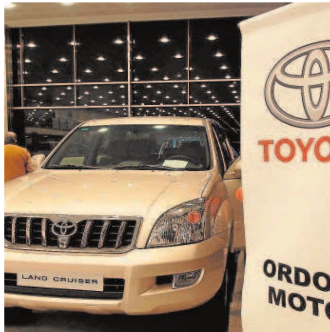
La marca Toyota es la más vendida en la provincia de Sevilla