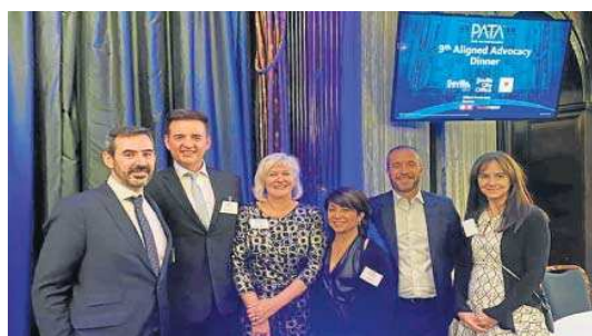
Algunos de los participantes en la cena donde se selló el acuerdo.

“Sevilla se sitió arropada en este encuentro, dado que las organizaciones internacionales del turis-