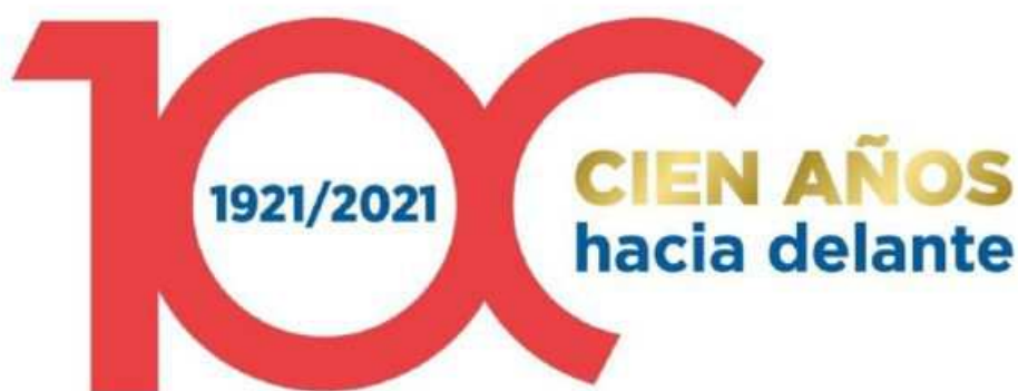
Logo conmemorativo de los 100 años del Grupo RUSVEL / Grupo RUSVEL

Entre sus filiales destaca HELIOPOL , empresa constructora y cabecera del grupo, además de otras firmas como RGI , especializada en la gestión y promoción de activos inmobiliarios, o MAREA , dedicada al ciclo integral del agua. RUSVEL también desarrolla otras líneas de negocio en el ámbito de las energías renovables, el mantenimiento fluvial y marítimo o las infraestructuras ferroviarias .