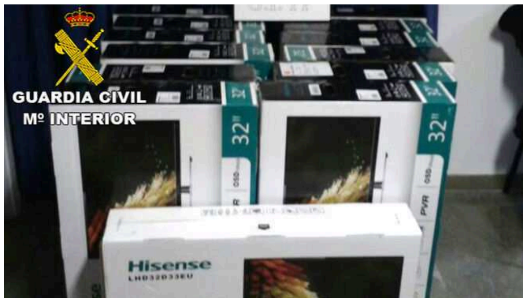
Televisores sustraídos en Écija y recuperados por la Guardia Civil en 2014.

Una banda de delincuentes asaltó la madrugada de este martes un camión cargado de televisores. Los ladrones sustrajeron varias unidades y huyeron en un vehículo, después de que estrellaran en otro en la zona en la que ocurrieron los hechos. El asalto se produjo en las inmediaciones del aeropuerto de San Pablo, en el término municipal de La Rinconada.