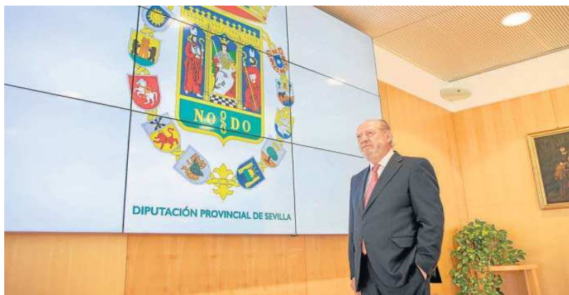
El presidente de la Diputación, Fernando Rodríguez Villalobos.

Además, el Equipo del Gobierno Provincial constató la comunicación del Ministerio de Hacienda del Gobierno de España, muy favorable en lo que se refiere a los ingresos del Estado para la provincia.