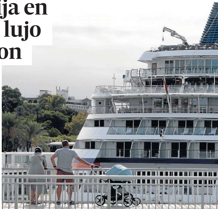
El crucero 'Europa', uno de los mayores que llegan al Puerto de Sevilla, atracó ayer en el Muelle de Las Delicias.

El Puerto de Sevilla recibió en 2019 a casi 21.000 cruceristas, lo que supuso una fuerte subida del 36% con respecto al año anterior. Este tipo de tráfico empezó a subir en Sevilla a medida que se ganaron nuevas infraestructuras en el