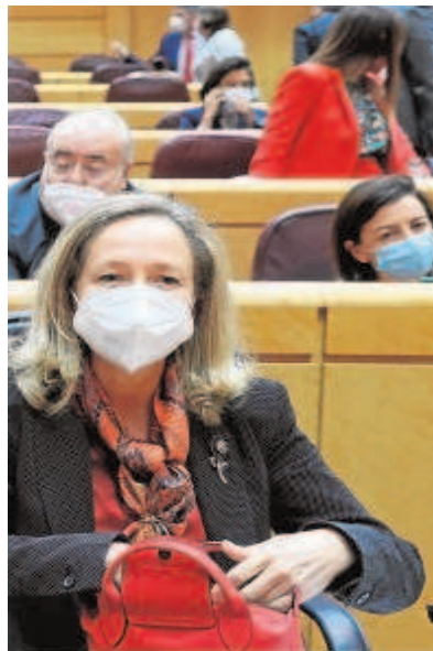
Las ministras de Trabajo y Economía, Yolanda Díaz y Nadia Calviño

pecto a lo que Trabajo venía negociando desde marzo. Y desde el departamento de Díaz se apuntaba a la intervención de Calviño reivindicando el liderazgo en la negociación. Al final, la consecuencia ha sido uno de los pulsos más prolongados de los casi dos años de coalición. La sombra de la construcción del nuevo proyecto político de Yolanda Díaz ha sobrevolado todo este tiempo. Unos dicen que ha utilizado esta estrategia para reforzar su perfil político. Los otros que el PSOE recela de la popularidad en las encuestas de la titular de Trabajo.