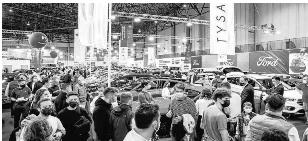
En 2021 la cita ha reunido a un total de 50 expositores, entre concesionarios, financieras y otras casas afines al sector de la automoción.

● El evento cerró con datos optimistas: más de 1.800 vehículos vendidos y 53.080 visitas