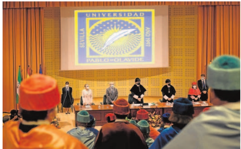
Sobre estas líneas, una imagen de la inauguración del curso el pasado septiembre