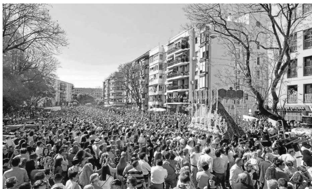
El paso de palio de la Virgen de la Encarnación, en la tarde del Martes Santo de 2019.

● Desde la Junta de Andalucía se advierte de que su desarrollo dependerá de la "evolución" de esta cepa ● El Ayuntamiento sigue trabajando con normalidad en los preparativos