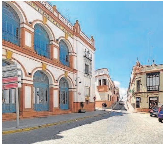
La calle La Mina de Alcalá de Guadaíra durante el estado de alarma

Uno de ellos ha sido el Ayuntamiento de Alcalá de Guadaíra, que acaba de anunciar una nueva convocatoria de ayudas directas, que con un montante de 900.000 euros, pueden solicitar desde el pasado miércoles hasta el próximo 12 de enero. Las ayudas que ahora se han puesto en marcha consisten en subvenciones directas de hasta mil euros para autónomos con el único requisito de haber mantenido la actividad durante el periodo de restricció-