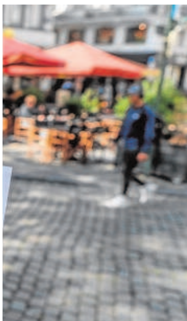
El certificado Covid ha sido vital para moverse por Europa

Ómicron, pero la gravedad de la situación militar respecto a las tensiones con Putin hacía imposible una reunión telemática