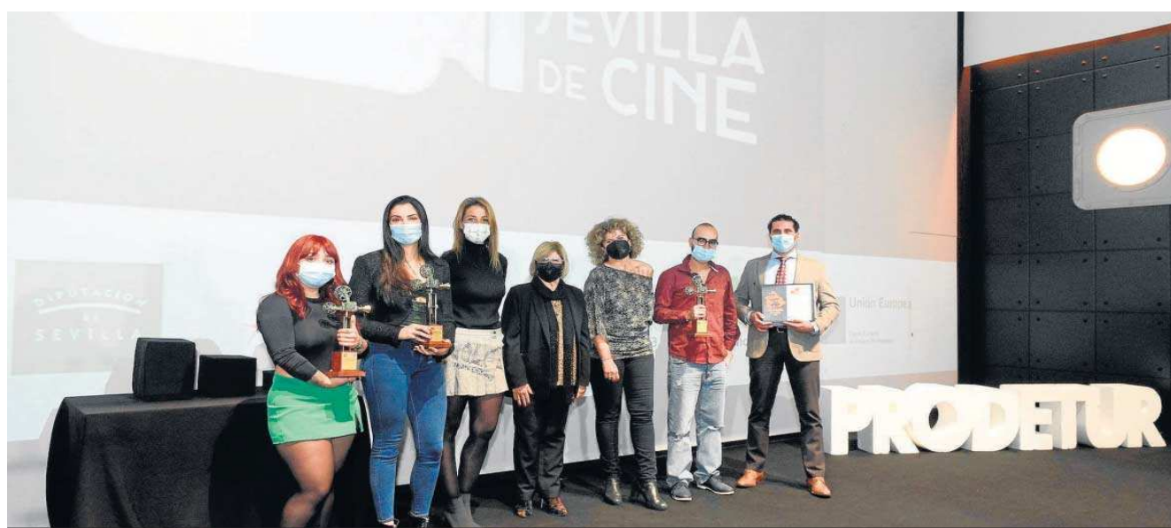
Foto de familia con todos los premiados y la vicepresidenta de la Diputación de Sevilla, Isabel Herrera (en el centro).