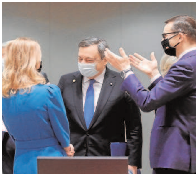
Los líderes de Estonia, Italia y Polonia, ayer en la cumbre de Bruselas

El martes la Comisión lanzó un guiño a la pretensión española de compra conjunta de gas, pero se quedó en solo un guiño