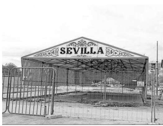
La caseta de Sevilla, montada estos días en el Real de Los Remedios.

A la espera de ver cómo es la evolución de la temida ómicron, en Sevilla los distintos estamentos e instituciones que trabajan para la organización de las fiestas lo hacen con normalidad. Desde el Ayuntamiento explicaron a este