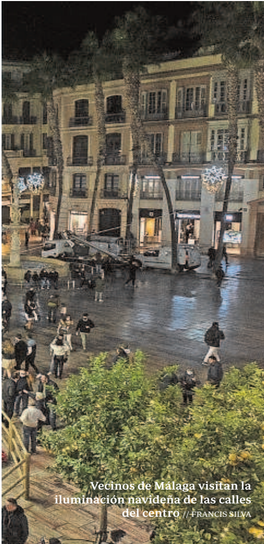
Vecinos de Málaga visitan la iluminación navideña de las calles del centro

tre sus familiares en las reuniones de estas fechas.