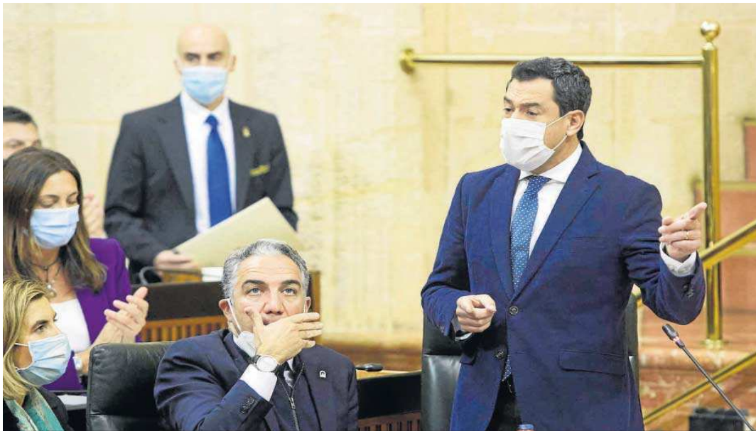
Juanma Moreno, ayer, durante la sesión de control al Gobierno en el Parlamento.