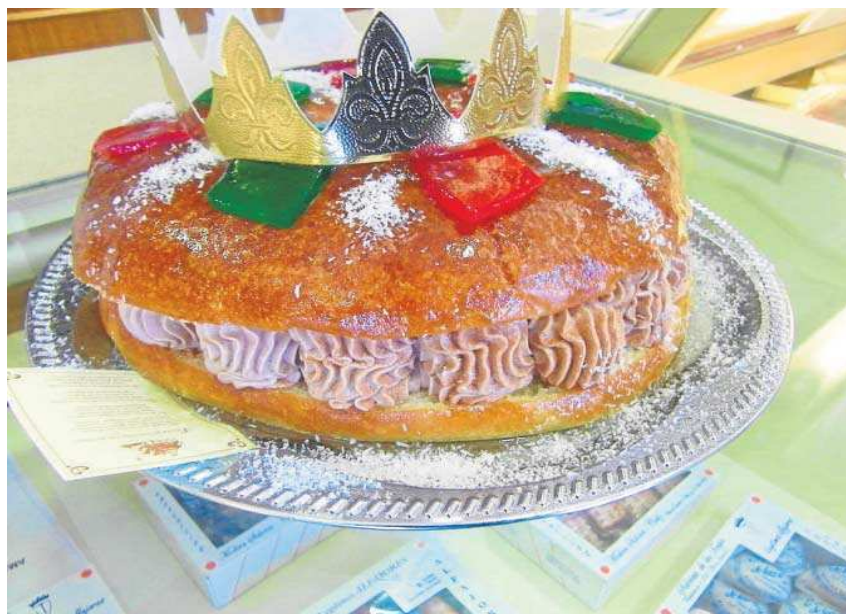
El jurado estará presidido por el prestigioso repostero Manu Jara.