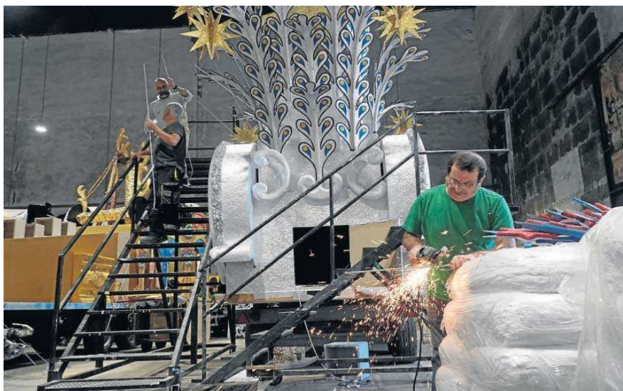
Los operarios del Ateneo trabajando ayer en la construcción de las carrozas de la Cabalgata.

● El Ateneo trabaja a destajo para la salida del Cortejo de la Ilusión y el Heraldito y no contempla cambios