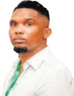
Samuel Eto'o Exfutbolista