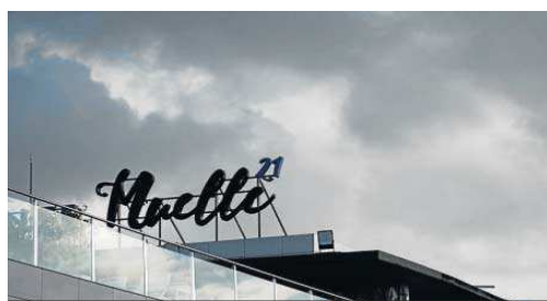
El restaurante Muelle 21 celebrará cena y cotillón.

El hecho de que muchos clientes que habían comprado la entrada para acudir a uno de estos cotillones hayan dado positivo o el temor a contagiarse está provocando que las reventas, ante la imposibilidad de que les devuelvan el dine-