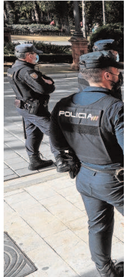
Arriba una concentración de policías frente a la delegación del Gobierno; a la derecha, la actual comisaría de Nervión que se ubica en un local.

No es la única asignatura pendiente que queda en materia de seguridad. A nivel de infraestructuras, Sevilla sigue sufriendo el incumplimiento de los planes de renovación de algunas de sus comisarías. Para este 2021 estaba prevista la inauguración de la nueva sede que debe dar cobertura al Polígono Sur;