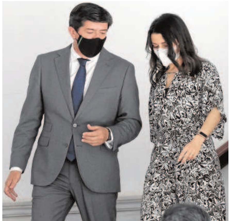
Juan Marín con la presidenta de Ciudadanos, Inés Arrimadas

Juan Marín, coordinador regional de Cs, también contradecía a su jefa en Onda Cero: «No nos equivocamos, se negoció bien y el Gobierno funciona a la perfección, con una gestión que