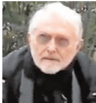
Agapito García Empresario

El exfutbolista del Fútbol Club Barcelona Samuel Eto'o entra en el listado de morosos de este año por deber más de 981.000 euros a la Hacienda de España. También se mantiene dentro de este fichero el futbolista Dani Alves, con una deuda pendiente que asciende a dos millones de euros.