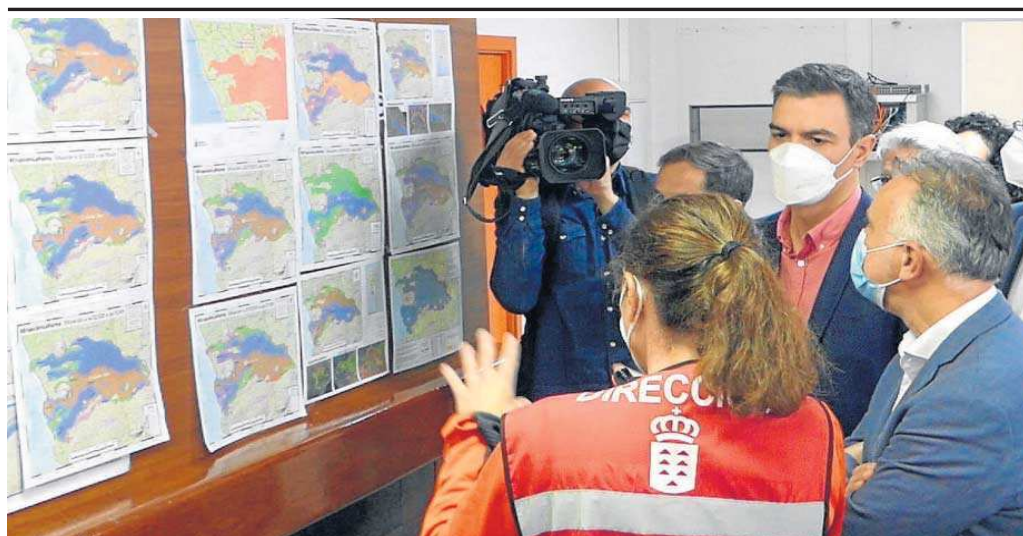
Pedro Sánchez, junto al presidente canario, Ángel Víctor Torres, atiende ayer a las explicaciones sobre el volcán durante su visita a La Palma.

Meritxell Batet da positivo por Covid y no podrá presidir el Pleno en la Cámara Baja