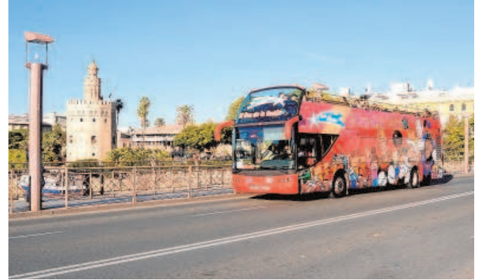
El Bus de la Ilusión recorre la ruta habitual de City Sightseeing

El Bus de la Ilusión saldrá todos los días cada 30 minutos desde la Parada 1 de City Sightseeing, en el Pa-