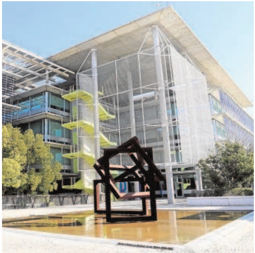
El campus de Palmas Altas es desde ayer propiedad de la Junta

La Junta ha comprado a Abengoa por 51,9 millones siete edificios y ha pagado 5,3 millones de euros por una parcela de 9.900 metros cuadrados, contigua al campus Palmas Altas, en la que se