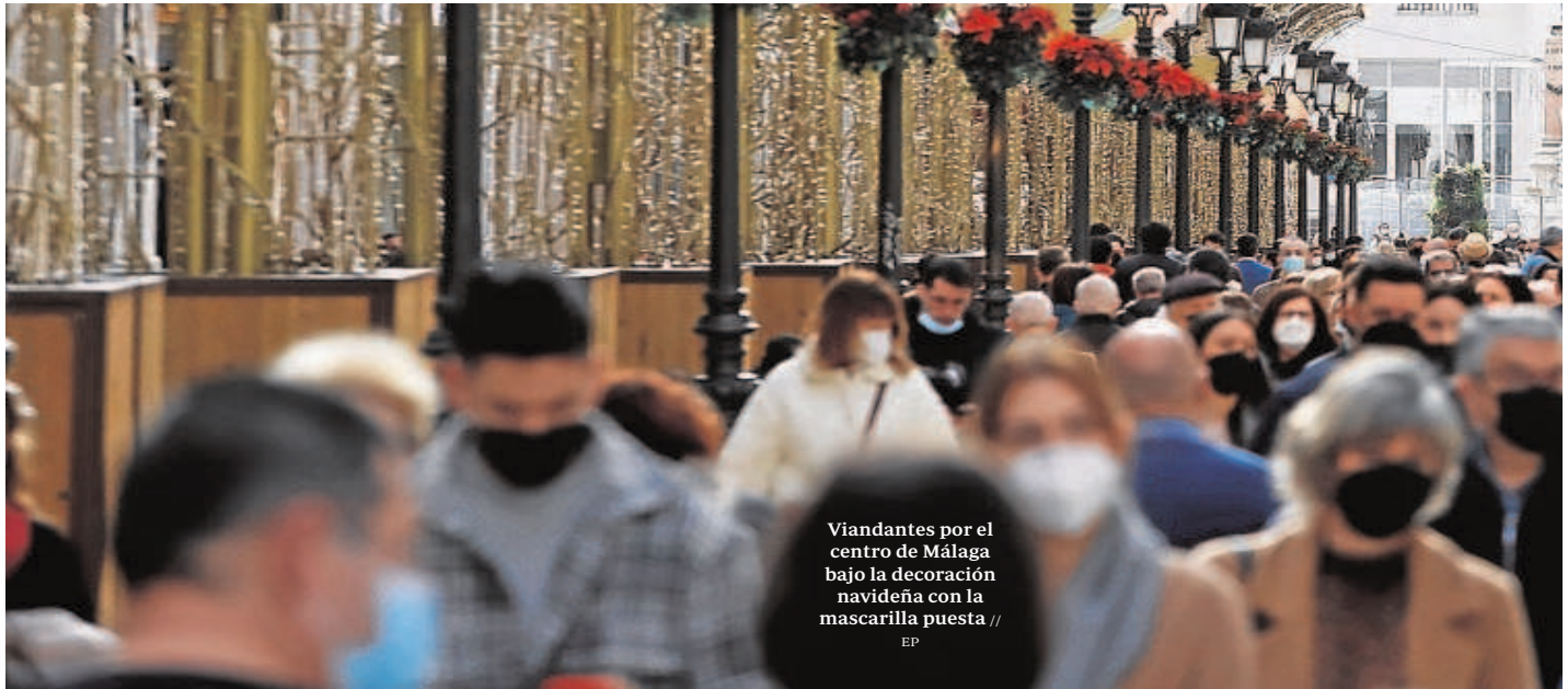
Viandantes por el centro de Málaga bajo la decoración navideña con la mascarilla puesta

Distribuido para CONFEDERACIÓN DE EMPRESARIOS DE SEVILLA * Este artículo no puede distribuirse sin el consentimiento expreso del dueño de los derechos de autor.