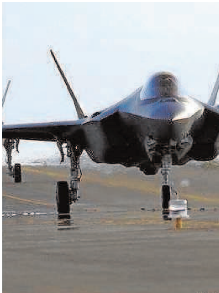
Aviones caza F-35 de EE.UU., en Abu Dabi en 2019

El contrato todavía podría revivir y esa es la intención de EE.UU. Pero EAU, un aliado de Washington en una región clave, ha tenido que elegir entre la cooperación tecnológica con China y un acuerdo militar con EE.UU. y, de momento, se inclina por lo primero. El problema para EE.UU. es que cada vez más países tomen ese mismo camino.