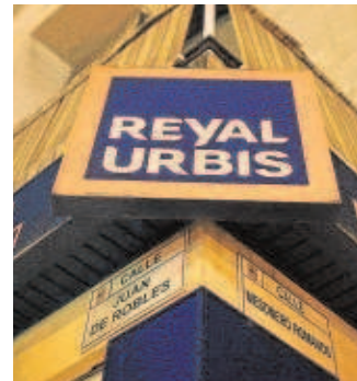
Reyal Urbis Inmobiliaria