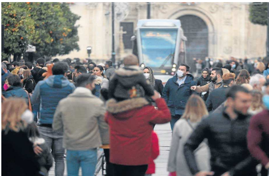
Numerosas personas caminan por la Avenida de la Constitución durante el Puente de la Inmaculada.