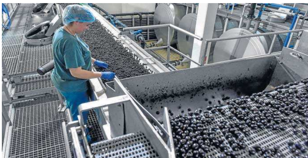
Manipulado de la aceituna negra.