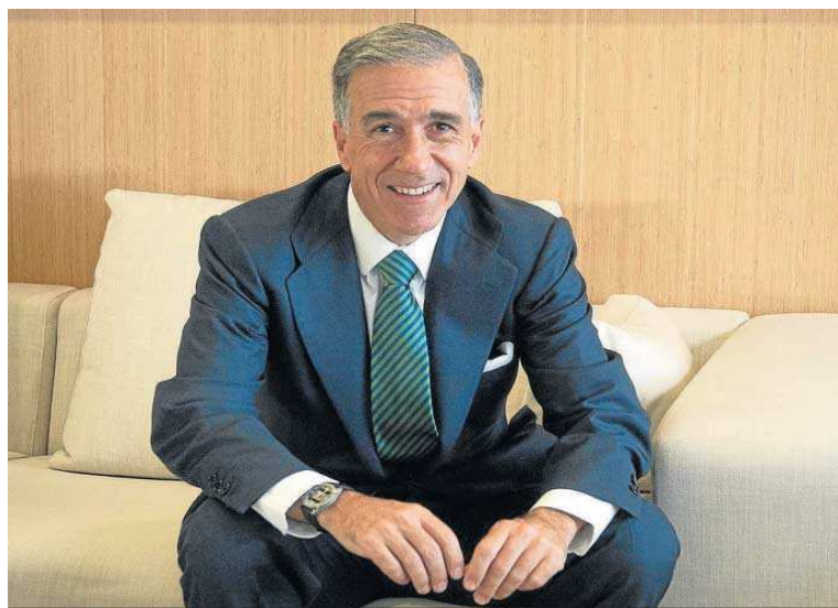
Gonzalo Urquijo, ex presidente de Abengoa.

● La juez se inhibe, como pedía la Fiscalía, al apreciar una "clara defraudación con grave repercusión para la economía nacional"