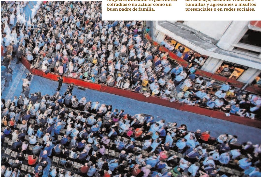
El misterio de la Bofetá parado en el palquillo de la Campana

Las faltas muy graves (suspensión de tres años a indefinido) se establecen por la cesión del derecho de adquisición a título oneroso o gratuito sin consentimiento del Consejo, conductas violentas, proferir insultos ya sean presenciales o en redes sociales a terceras personas o al Consejo, causar desperfectos, amenazar o coaccionar, agresión física, o generar riesgo grave a los vigilantes y personal encargado.