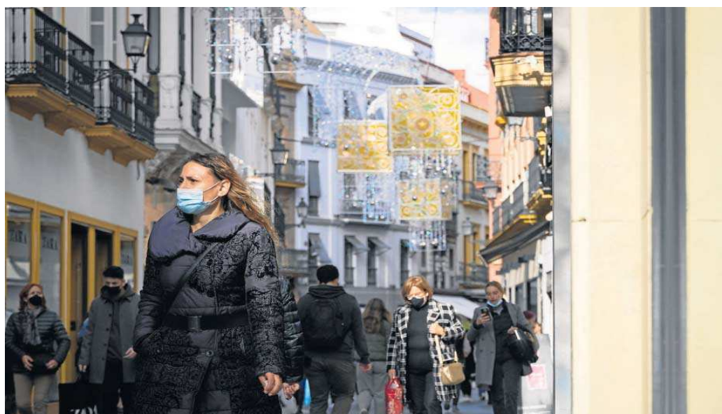
Varias personas caminan ayer por el centro con y sin mascarillas, tras la vuelta a la obligatoriedad de su uso en el exterior.

La evolución de la pandemia sigue mostrando que la variante ómicron, aunque es muy contagiosa según los expertos, no está teniendo una mayor letalidad, debido sobre todo a los avances de la vacunación. Así, ayer no se registró ningún nuevo fallecimiento, con lo que la cifra de defunciones en la provincia se sitúa en 2.362, según informó la Junta, que señaló asimismo que en las