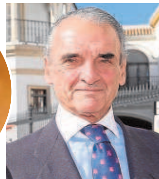
Mario Conde Exbanquero

Otro de los nombres más populares que se incorporan a la lista es el del cocinero Sergi Arola, quien debe más de 985.000 euros. Lo cierto es que el famoso chef ya se vio obligado a cerrar su restaurante en Madrid debido a los problemas que arrastraba con la Agencia Tributaria.