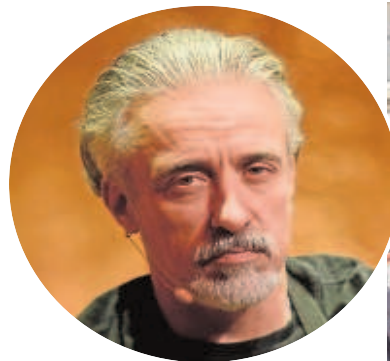
Sergi Arola Chef

Las mayores deudas las aglutinan empresas como las inmobiliarias Reyal Urbis (340 millones de euros) y Nozar (215 millones de euros), la empresa de distribución de combustibles Marillion (126 millones de euros) o la sociedad de bebidas Vittone 1842 (112 millones).