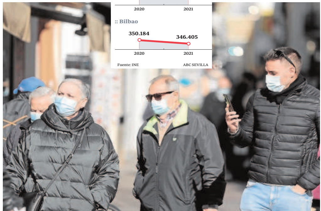
Sevilla tiene 7.161 vecinos menos que el año pasado // RAÚL DOBLADO

Sanz denuncia que «todo esto, lo único a lo que contribuye es a una constante pérdida de competitividad con respecto, incluso, a otras ciudades del área metropolitana». Por ello, «es necesario que se empiecen a atajar los verdaderos problemas de Sevilla y la pérdida de la población es uno de ellos». Sanz propone llevar a cabo un plan de consolidación y crecimiento demográfico que contenga, entre otras, «medidas fiscales de atracción de la población o ayudas para las familias. Esta será una de mis prioridades». «Sevilla necesita un alcalde que se preocupe por que la ciudad prospere, avance, en lugar de retroceder», concluyó.