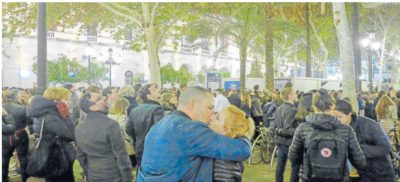
Aspecto que presentaba en 2018 la Plaza Nueva para recibir el año nuevo.