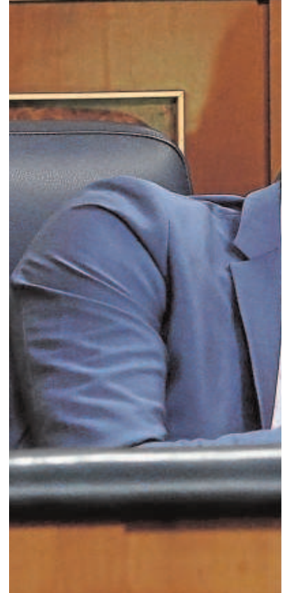
Sánchez y Díaz conversan durante el pleno del día 2 de diciembre

Esto entre bambalinas, claro, porque los dirigentes morados intentan ser más respetuosos con las declaraciones en abierto sobre sus socios parlamentarios. «Yo confío, pero vamos a tener que dialogar con nuestros socios (...) es importante cuidar la mayoría que hizo posible la investidura y los Presupuestos», valoraba el portavoz parlamentario de Unidas Podemos, Pablo Echenique, en TVE. Fuentes parlamentarias de Bildu se remitían ayer