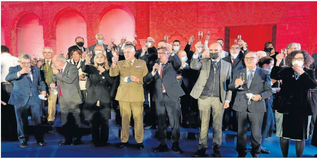
Los homenajeados brindan en el Patio de la Montería acompañados por las distintas autoridades que participaron en el acto.