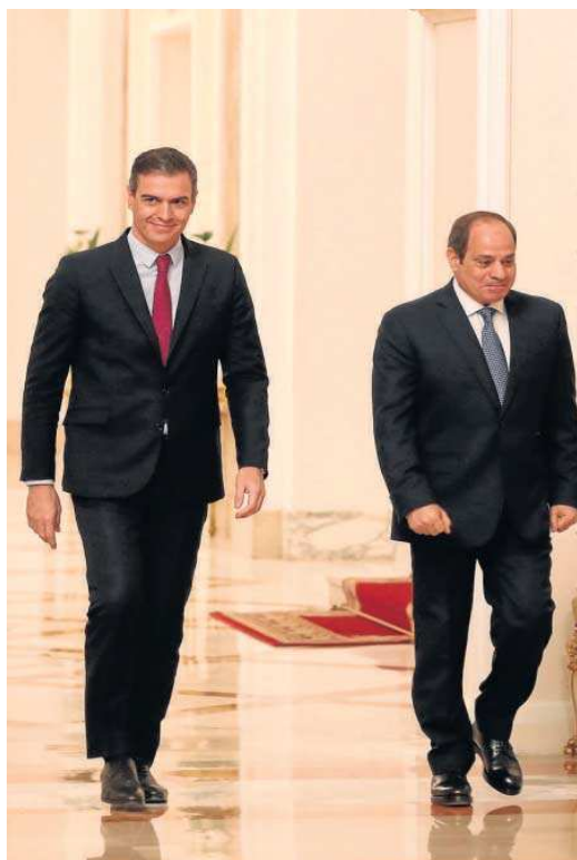
Sánchez y Al Sisi, ayer en El Cairo.

Más allá del capítulo económico, Sánchez y Al Sisi abordaron cuestiones como la estabilidad en el Mediterráneo. El presidente del Gobierno subrayó que España ve a Egipto como “motor fundamental de las relaciones con el Mediterráneo y con el mundo árabe. Queremos contribuir a unas relaciones euromediterráneas mucho más dinámicas, con una agenda positiva, que fomente y contribuya a la estabilidad y a la prosperidad compartida a ambos lados del mar que nos une”, recalcó Sánchez. A su juicio, España y Egipto tienen la capaci-