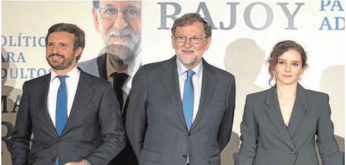
Mariano Rajoy, entre Pablo Casado e Isabel Díaz Ayuso, en la presentación de su libro, 'Política para adultos'