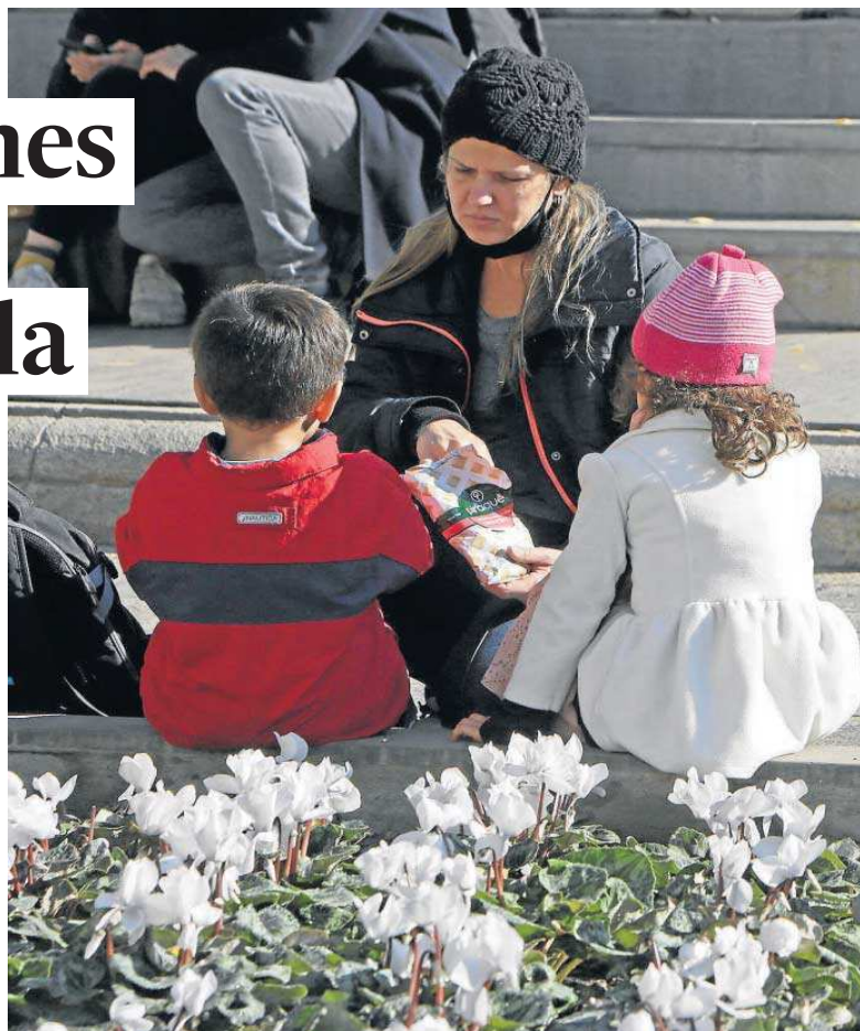
Una mujer junto a dos menores en el entorno de la Catedral de Sevilla.

● Los sevillanos de 40 a 49 años son el grupo con la mayor incidencia, coincidiendo con la edad de los padres de los menores de 12, aún sin vacunar y el segundo grupo con más contagios