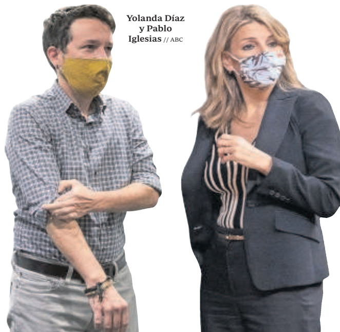
Yolanda Díaz y Pablo Iglesias

Las dirigentas de Podemos fueron invitadas a la asamblea de los comunes junto a Díaz, Garzón, Colau y Oltra. Pero dijeron que no podían asistir y Belarra participó mediante un vídeo en el que no mencionaba a Díaz. Tampoco fueron a la 'Escuela de Otoño' de IU esos días. A las citas acudió Lilit Verstrynge, número tres. Las confidencias y los aliados han lanzado mensajes velados a Podemos tras estos gestos. Garzón dijo en el acto de los comunes que «hay que hablar antes del qué y no del quién». Colau recordó que a Díaz le había «tocado» ser candidata a presidir el Gobierno porque Iglesias la puso frente cuando dejó la política. Empezará con su proyecto en 2022. «Nunca me he peleado por estas razones ni lo voy a hacer, como suceda esto o exista ruido es probable que yo me vaya», advirtió Díaz en septiembre. Vamos, que lo veía venir.