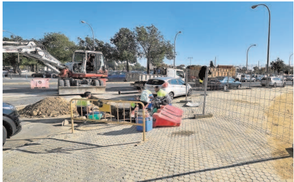
Colocación del vallado durante la mañana de ayer en el entorno de la calle Antonio Bienvenida

Todo hace indicar que la Feria de 2022 será una realidad después de dos años consecutivos sin celebrar una de las fiestas grandes de la ciudad. Aunque en un principio durante los años 2020 y 2021 hubo planes para celebrar la fiesta en otras fechas, como el mes de septiembre, ninguna de esas propuestas cuajó. Este año 2021, durante la semana que debía ser la Feria, se permitió el montaje de «Vive Park», un parque de atracciones con noria, coches de choque y otras numerosas atracciones en la misma zona donde se montaba tradicionalmente la calle del infierno. Para el próximo año 2022, si ninguna variante del Covid lo impide, habrá Feria de abril otra vez.