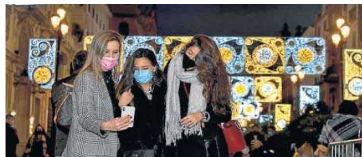
Varias jóvenes se hacen un 'selfie' bajo el alumbrado navideño.

lud mantuvo ayer en el nivel 0 de alerta a todos los distritos sanitarios de la provincia de Sevilla. Una situación que seguirá vigente, al menos, hasta que concluya el puente festivo.