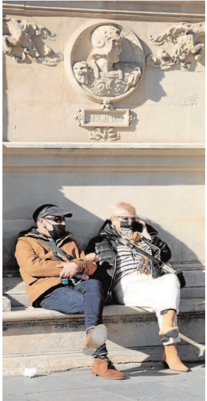
Una pareja de turistas descansa junto al Ayuntamiento

La previsión de los alojamientos para este puente es, por el momento, buena, indica, como muestra la encuesta que ha realizado su departa-