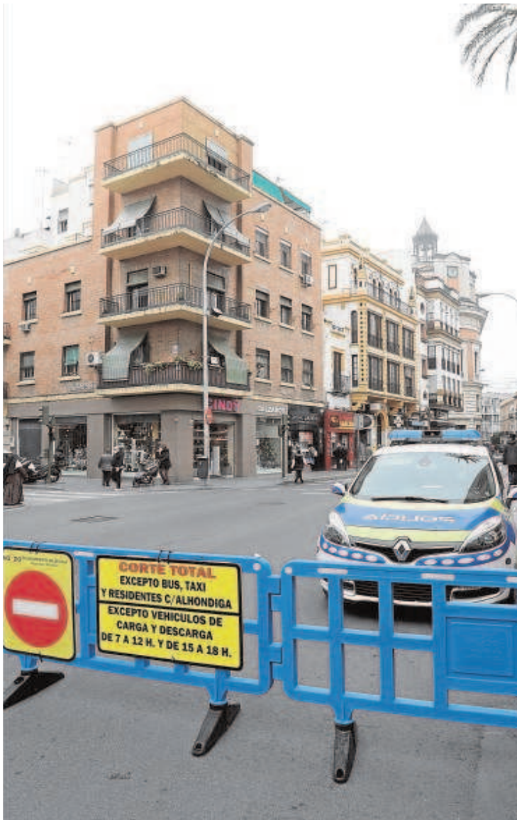
Este viernes en una primera fase menos restrictiva