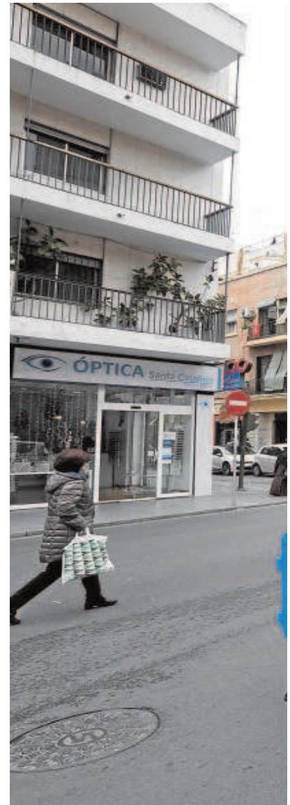
El plan de tráfico para la Navidad entra en vigor

Mientras se sigue retrasando el proyecto de los nuevos aparcamientos,