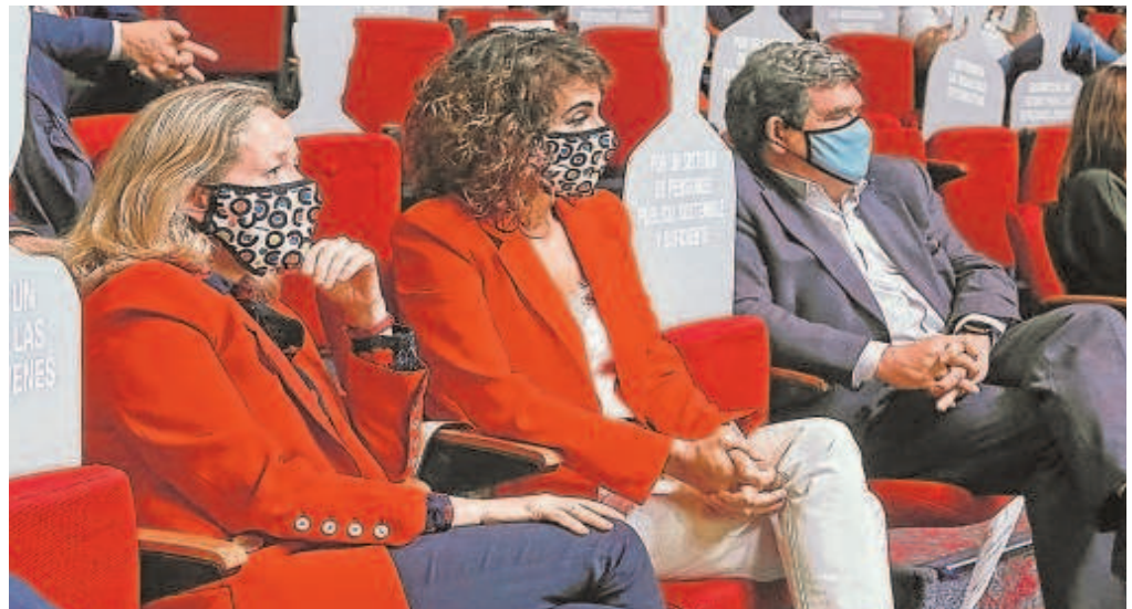
La vicepresidenta Nadia Calviño (izq.) y los ministros María Jesús Montero y José Luis Escrivá

Dicho informe sirve a Hacienda para pasar la bola caliente sobre cualquier materia impositiva. La ministra Montero siempre se escuda en que para tomar cualquier decisión será necesario conocer las conclusiones de los exper-