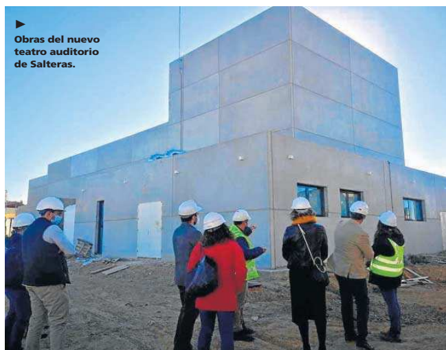
▶ Obras del nuevo teatro auditorio de Salteras.

Este plan forma parte de los programas de desarrollo que desde hace más de diez años promueve la Fundación CLC en la comarca, con una inversión global superior a los 10 millones de euros. El objetivo es ayudar a las economías locales a recuperarse de los efectos de la pandemia del Covid-19, ade-