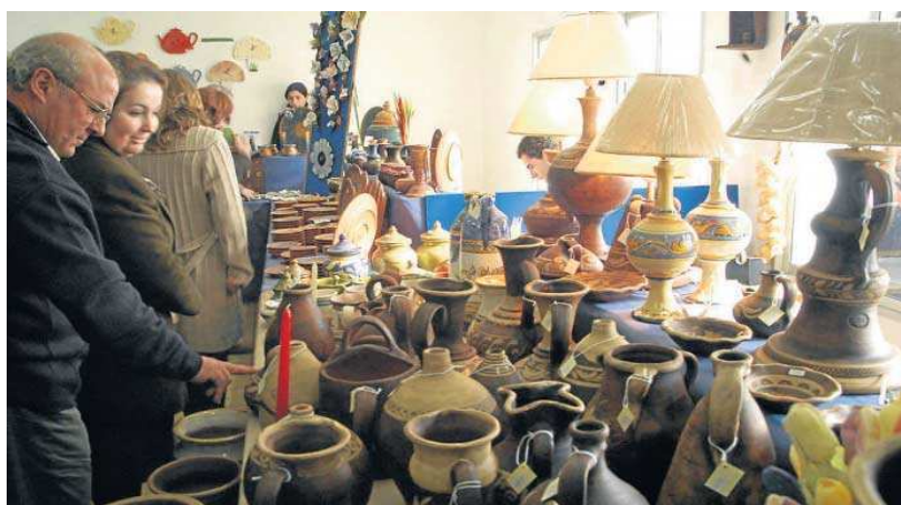
Artesanía a la venta.

Villalobos felicitó al alcalde de El Pedroso por una iniciativa "pionera y con visión de futuro, en hacer un producto de