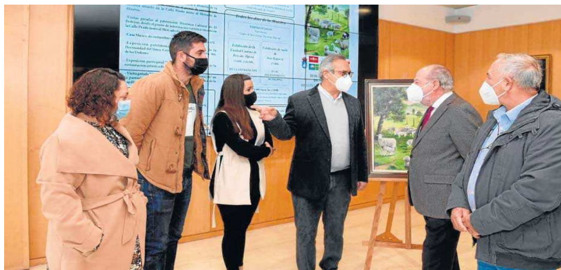
Presentación de la Feria de Muestras.

El número de plazas de aparcamiento que se ponen a disposición de los visitantes asciende a más de 3.300, distribuidas entre el terraplén existente frente a la estación de Renfe, el gran solar frente a la Ermita de Ntra. Sra. del Espino, la gran explanada situada a 50 metros del recinto ferial y el terreno de la antigua fábrica de tapones, para que todo aquel visitante que se desplace hasta el municipio en su coche particular no tenga demasiados problemas a la hora de aparcar. Y el Ayuntamiento cofinancia autobuses y trenes diarios especiales desde Sevilla que, unidos a la oferta diaria de trenes, ponen más de 5.000 plazas a disposición de los interesados en acudir a visitar la feria por estos medios. Reserva de plazas en el número de teléfono 689918629.