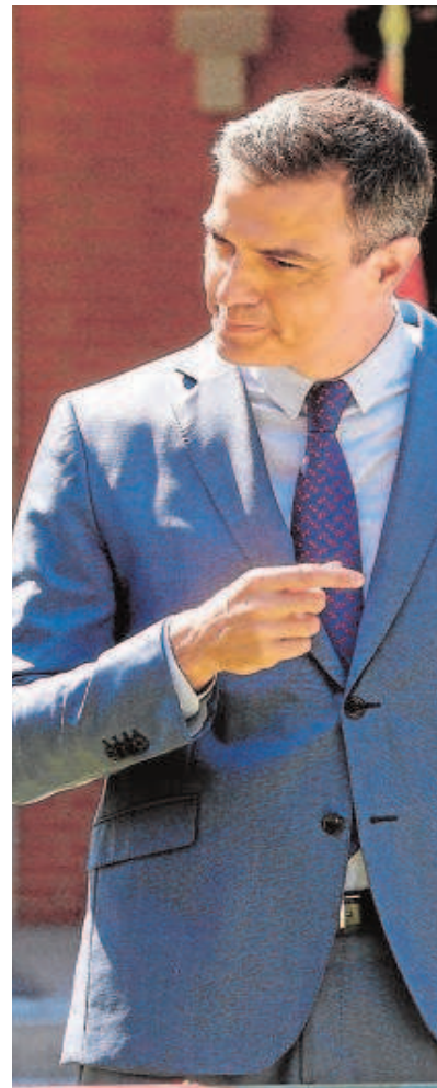
Antonio Garamendi (a la derecha) y Pedro Sánchez

Resaltan por ejemplo que la obsesión del Gobierno por garantizar el control de las convocatorias de ayudas por parte del Estado está impidiendo a los gobiernos autonómicos adaptarlas a las necesidades específicas de su tejido productivo, dificultando el paso a las empresas locales, o que en algunos casos se fijan plazos tan cortos para presentar proyectos, que la operativa expulsa de forma directa a pymes y autónomos.