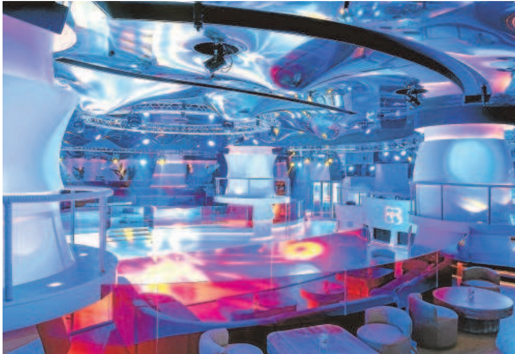
Las discotecas Pachá han recibido ayudas del Fondo de Recapitalización para empresas afectadas por el Covid