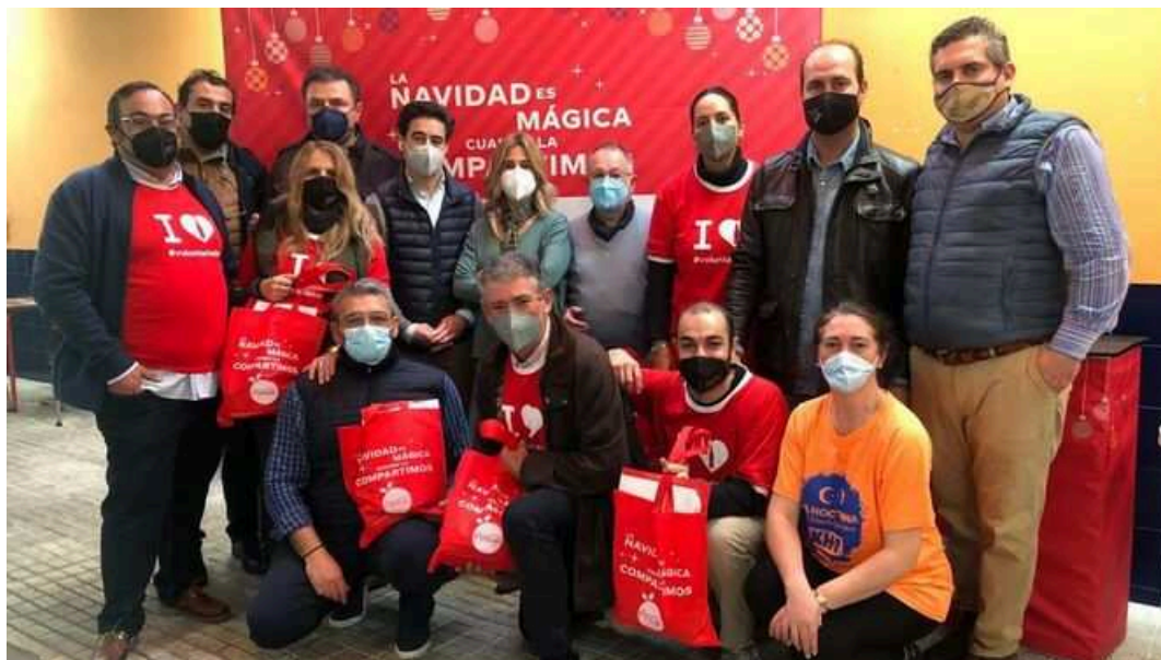
Voluntarios de 'La Navidad es mágica cuando la compartimos'.

Con la mirada puesta en hacer realidad la ilusión de que La Navidad es mágica cuando la compartimos , más de 50 entidades están difundiendo este espíritu navideño y compartiendo más de 15.000 comidas con personas en situación de vulnerabilidad los días 20, 21, 22, 23 y 24 de diciembre. Esta iniciativa se está desarrollando en diversos lugares de 21 ciudades españolas y cuenta con la colaboración de Coca-Cola. En concreto, en Sevilla, la entrega de 1000 comidas, que tendrá lugar los días 21, 22, 23 y 24 de diciembre, se ha realizado de la mano de las entidades Asociación de Hosteleros de Sevilla y provincia y la Asociación de Vecinos Tres Barrios, de la que forman parte La Candelaria, Los Pajaritos y Madre de Dios.