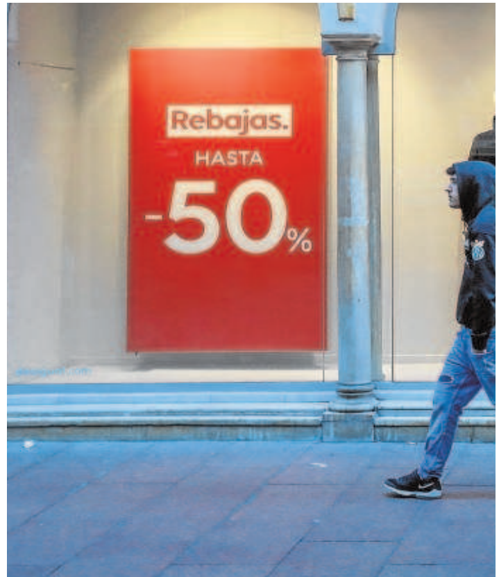
Una tienda de Sevilla ya en rebajas la pasada semana que mantiene los mismos carte-

Por eso mismo las patronales del comercio como Aprocrom muestran