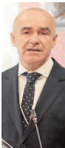
ANTONIO MUÑOZ MARTÍNEZ Alcalde entrante del PSOE