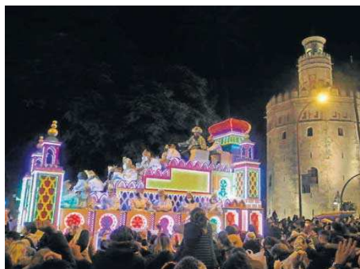
La Cabalgata discurre junto a la Torre del Oro.

Así, el cortejo partió a las 16:15 desde la Universidad de Sevilla para proseguir por la Ronda Histórica. Una vez alcanzada la Resolana, en vez de acceder al centro histórico por la calle Feria como es tradicional, continuó en dirección a la Barqueta para discurrir de forma excepcional por la calle Torneo. Antes de llegar al paso inferior por San Laureano, Marqués de Paradas y Reyes Católicos para llegar al Paseo de Colón y avanzar hasta el Palacio de San Telmo, donde giró a la izquierda hacia Avenida de Roma y Palos de la Frontera y sin entrar tampoco ni en Triana ni en Los