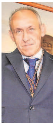
JOSÉ MARÍA SORIANO Alcalde entrante del Partido Popular