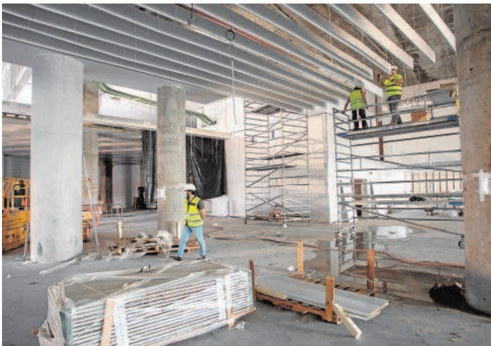
Obras en la nueva zona de embarque de San Pablo que se sitúa en el ala sur de la terminal

Y finalmente, hay que destacar el recrecido y actualización de la pista de vuelo, una de las más largas de la red de aeródromos españoles, que cuenta ahora con todos los sistemas nuevos de drenaje y cableado eléctrico. Este complejo proyecto absorbió 10,9 millones de euros de inversión y se desarrolló en tres grandes fases. El grueso de los trabajos se concentró en horario nocturno, con el objeto de minimizar su impacto en la operativa habitual del recinto. Otra actuación relacionada con el campo de vuelo será la reconfiguración de la plataforma de estacionamiento de aeronaves, que comenzará en breve para ampliar también su capacidad y mejorar el acceso de las aeronaves.