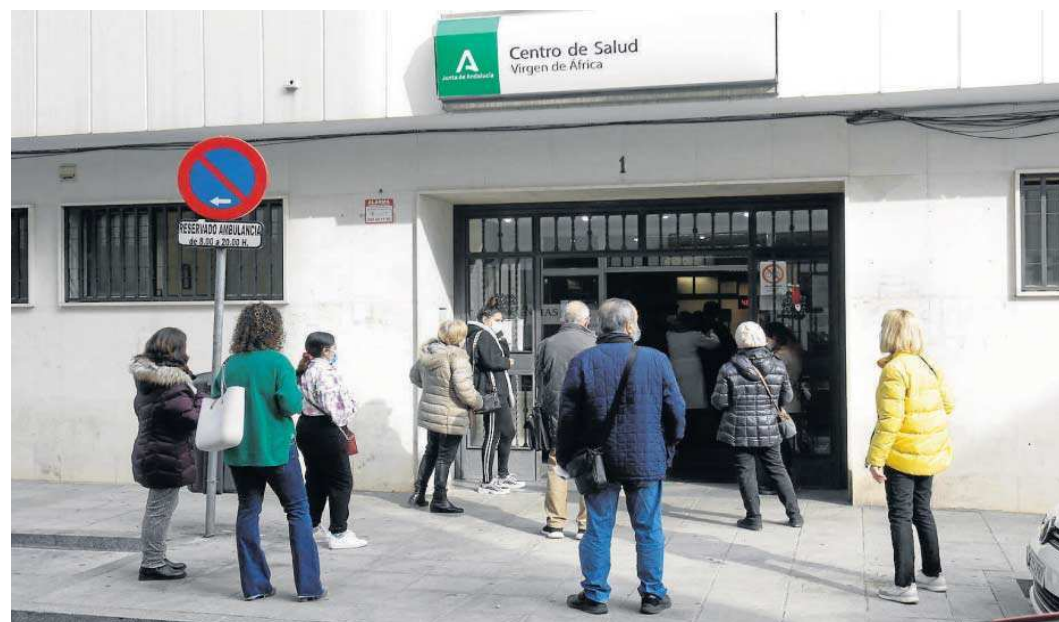
Varias personas se agolpan a las puertas del centro de salud Virgen de África, una imagen habitual en los últimos días en el resto de ambulatorios.

● El Covid-19 vuelve a poner en jaque a la sanidad sevillana, y personal y sindicatos lamentan, de nuevo, la falta de recursos ● Las consultas se siguen retrasando entre 10 y 15 días por la saturación de los ambulatorios