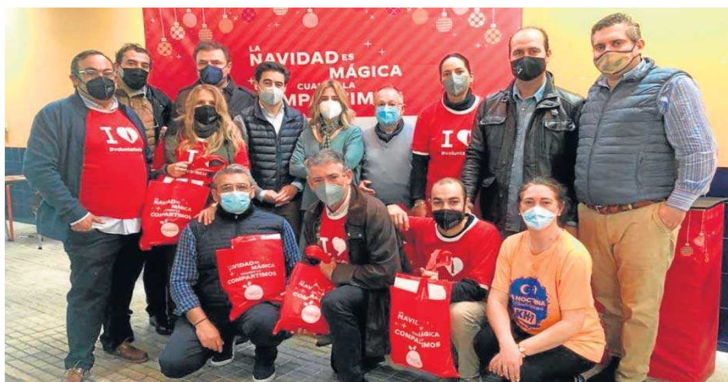
Voluntarios de 'La Navidad es mágica cuando la compartimos', desarrollada en el Mercado de la Candelaria.