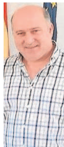
JUAN MANUEL HEREDIA BAUTISTA Alcalde saliente del PSOE