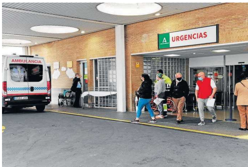
Los accesos a los Urgencias del Hospital Virgen del Rocío.