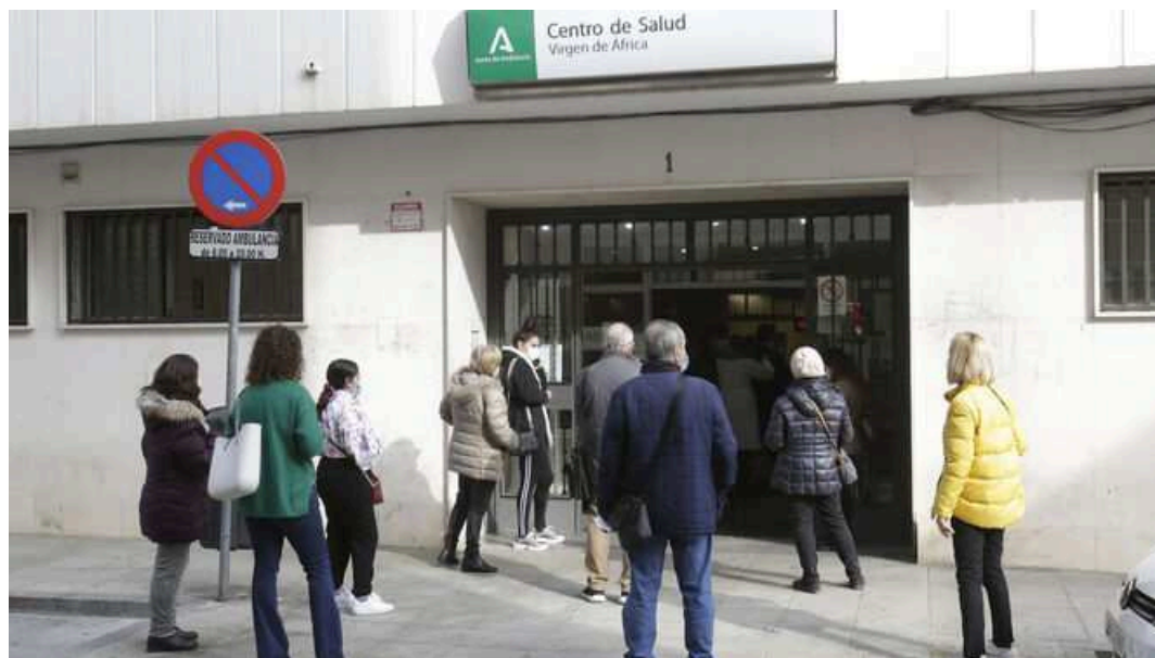
Colas en el acceso del centro de salud Virgen de África en la capital.

La explosión inusitada de infecciones más leves causada por la variante Ómicron ha cargado la sexta ola de la pandemia sobre los castigados hombros de la Atención Primaria y avanza, más lenta que las anteriores, hacia los hospitales . La alta transmisibilidad de la nueva variante, ya predominante en Andalucía, justo en el momento del año de mayor actividad social y familiar se ha convertido en la tormenta perfecta para que los centros de salud vuelvan a situarse en el centro de las tensiones asistenciales , cuyo colapso se proyecta ya hacia las Urgencias hospitalarias, a donde los usuarios se dirigen cuando no encuentran respuesta en su ambulatorio.