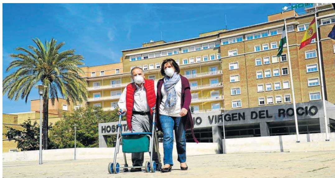
Dos personas salen del Hospital Virgen del Rocío, en Sevilla.

De esos 1.388 enfermos en los hospitales andaluces, 1.198 están en las plantas convencionales y 200 requieren una atención más específica en las UCI, según los números oficiales de la Consejería de Salud. Estas cantidades se