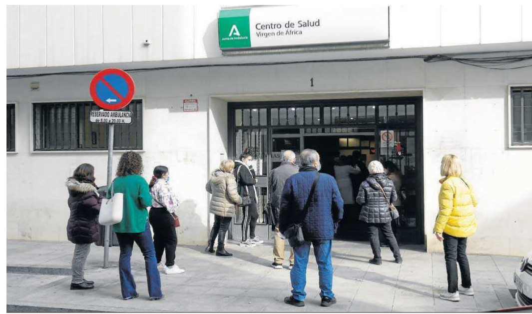
Varias personas se agolpan a las puertas del centro de salud Virgen de África, una imagen habitual en los últimos días en el resto de ambulatorios.

● El Covid-19 vuelve a poner en jaque a la sanidad sevillana, y personal y sindicatos lamentan, de nuevo, la falta de recursos ● Las consultas se siguen retrasando entre 10 y 15 días por la saturación de los ambulatorios