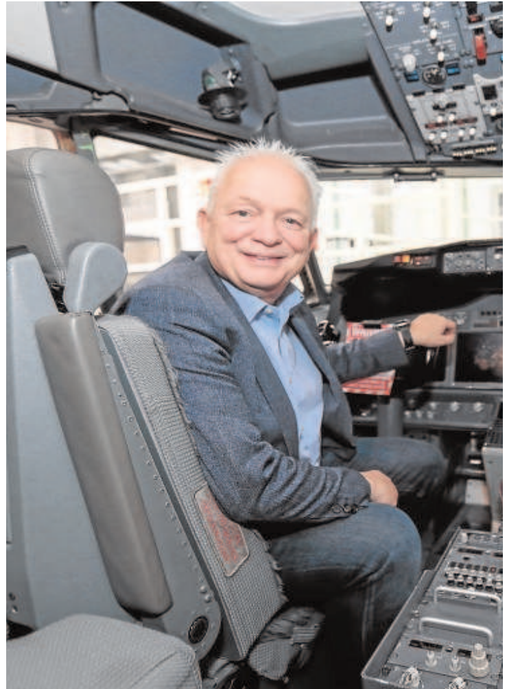
El CEO de Ryanair, Eddie Wilson, durante su última visita a Sevilla para inaugurar el

«Nos gustaría crecer más en Sevilla y en España en general, pero la política del Gobierno no ayuda»