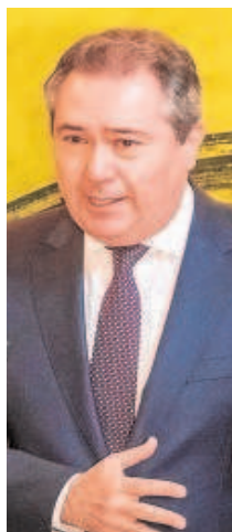
JUAN ESPADAS CEJAS Alcalde saliente del PSOE