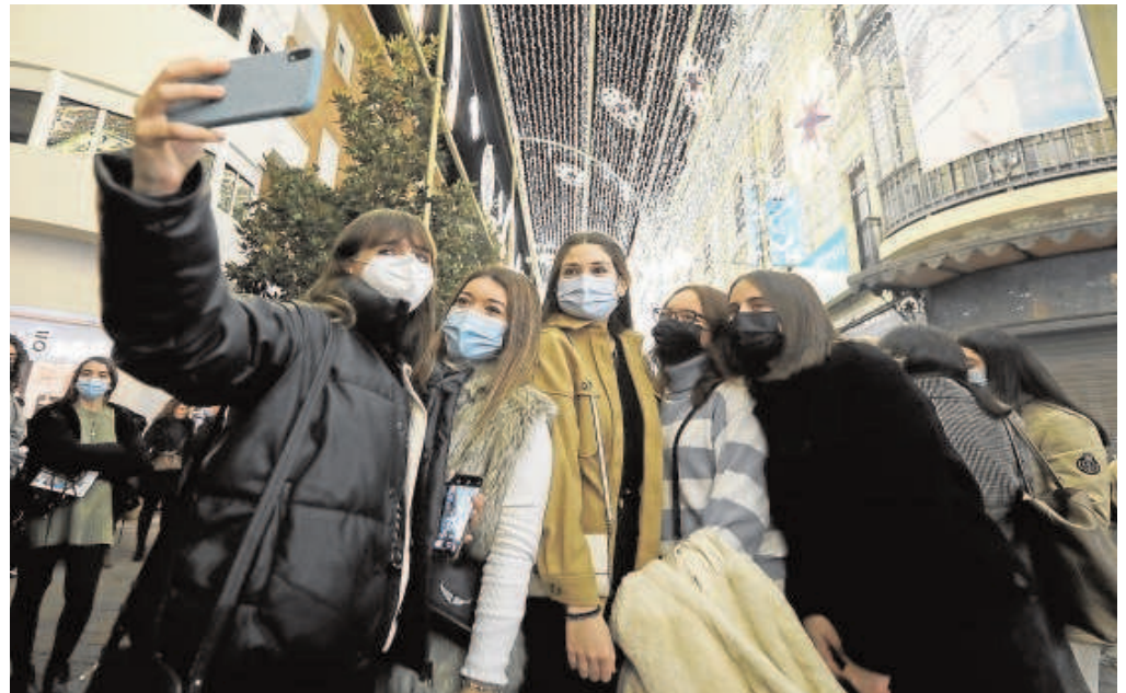
Jóvenes se hacen una foto en la céntrica calle Cruz Conde de Córdoba

Gracias a la barrera de protección de la vacunación, la explosión de contagios de la variante ómicron no está tensionando los hospitales como en las anteriores olas, aunque sí está impactando en la atención primaria, hasta el punto de que la Junta ha renunciado al seguimiento clínico activo de los pacientes asintomáticos o sintomáticos leves y sin factores de riesgo. Ayer se registraron 55 ingresos más, hasta alcanzar los 1.388 pacientes confirmados con Covid-19, de los que 200 están en la UCI. Además, se produjeron ocho muertes por la enfermedad.