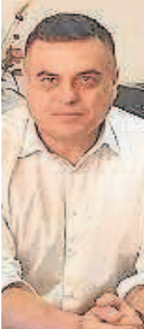
PEDRO OROPESA VEGA Alcalde entrante del Partido Popular