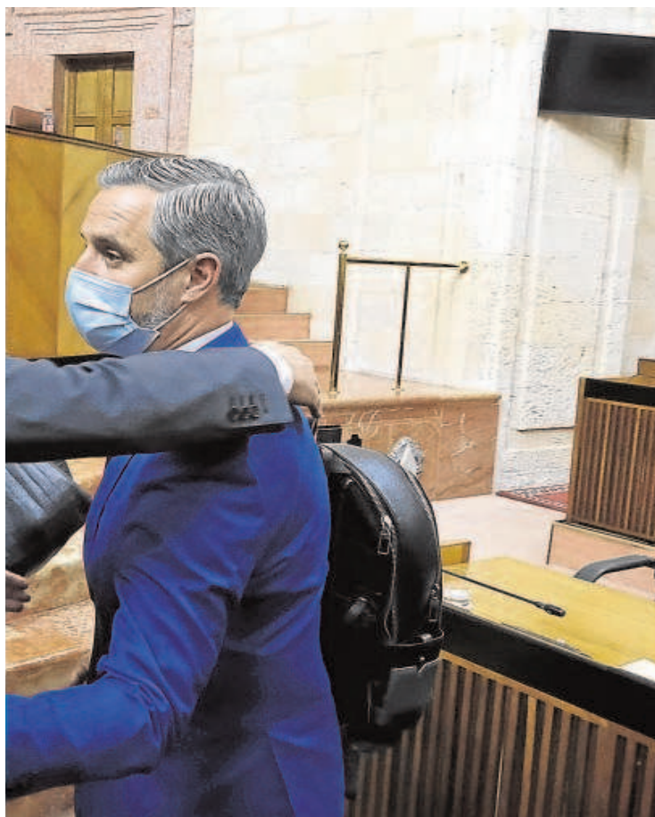
Juanma Moreno, en el Parlamento

El nuevo gobierno se encontró al llegar con libramientos pendientes de justificar desde el año 1987. La bola de nieve fue engordando a raíz de las irregularidades detectadas en las subvenciones repartidas entre entidades dedicadas a dar cursos de formación. El Servicio Andaluz de Empleo alega que de los 192,5 millones que tenía sin acreditar a 31 de diciembre de 2020, ha logrado justificar 158,34 millones de euros durante el año 2021, lo que deberá aparecer en la cuenta general del citado ejercicio. En febrero de 2020, la Secretaría General de Hacienda puso en marcha un plan de seguimiento para revisar y recuperar el dinero.