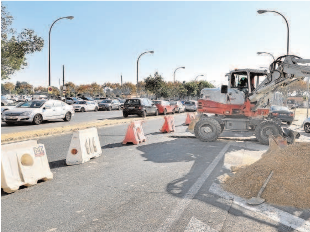
Preparativos del Ayuntamiento para la Feria de Abril de este año