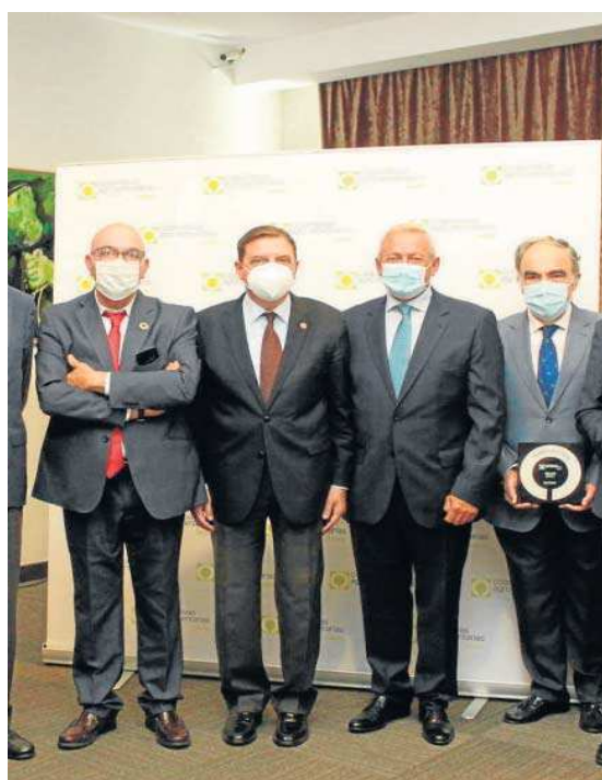
El ministro Planas, en el 15º Symposium con algunos de los premiados.

Las normativas más recientes en materia de sanidad vegetal, la problemática fitosanitaria derivada de la aparición de nuevas amenazas y en cultivos emergentes, así como la percepción ciudadana sobre la producción de alimentos serán los pilares fundamentales sobre los que pivotará la agenda de debate de este Symposium, que cuenta con el patrocinio tanto del Ministerio de Agricultura, como de la Consejería de Agricultura de la Junta de Andalucía.