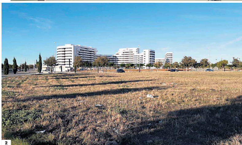
UBICACIÓN DE LAS VPO. El proyecto de Hacienda del Rosario se edificará sobre un solar (2) de superficie construida de 30.000 metros cua-

drados que acogerá 218 viviendas en alquiler con 283 garajes y 261 trasteros (1) destinadas principalmente a jóvenes y nuevas familias.