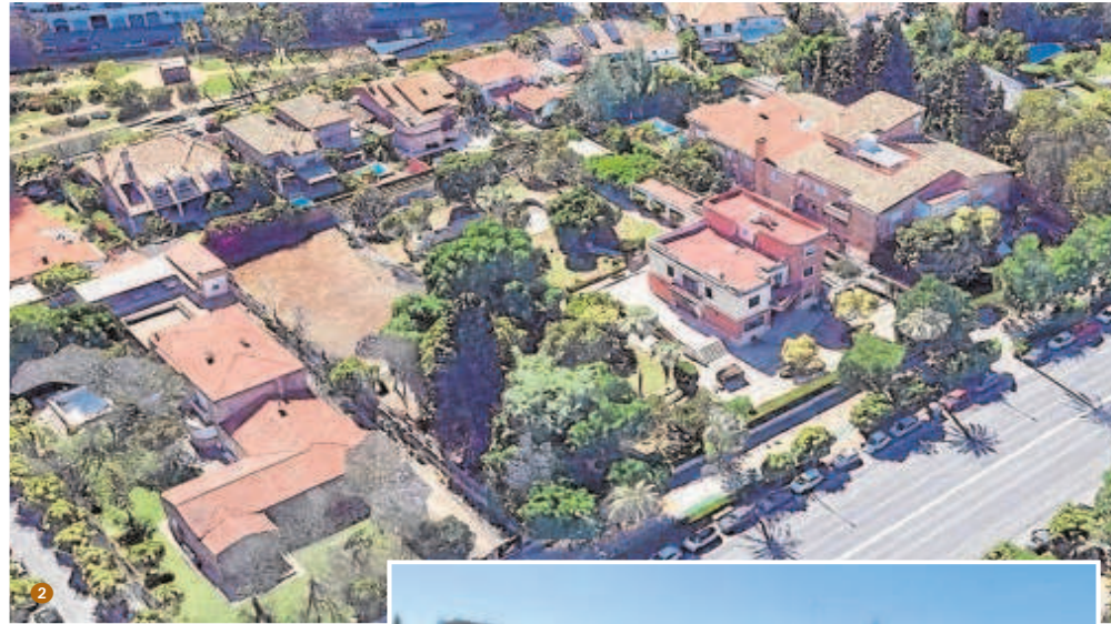
1 Representación volumétrica de la futura residencia de la avenida de la Palmera 38 2 Imagen aérea de la misma parcela, antes del derribo ejecutado a finales de 2021 3 El solar, ya completamente vacío, antes de la excavación que se va a realizar de dos plantas bajo rasante