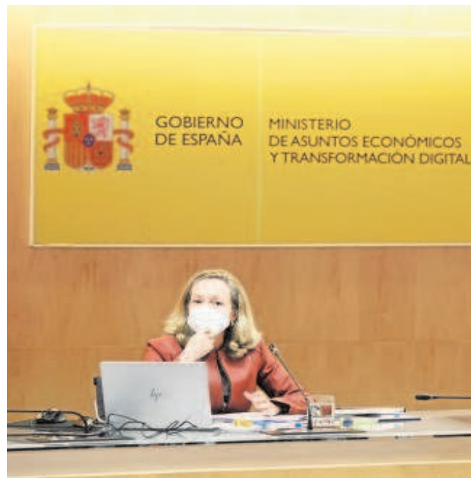
La vicepresidenta económica del Gobierno, Nadia Calviño

Lo que indica la orientación de la política de endeudamiento del Gobierno son las emisiones netas y estas aumentarán en 2022 en 75.000 millones, cantidad casi idéntica por cierto a las de 2021. El manual básico de gestión de la deuda pública establece una relación directa entre las emisiones netas y el nivel del déficit público, pero este año el Tesoro ha optado por mantener, al menos sobre el papel, las mismas emisiones netas que el año pasado pese a que se prevé una reducción del déficit de la Administración Central de más