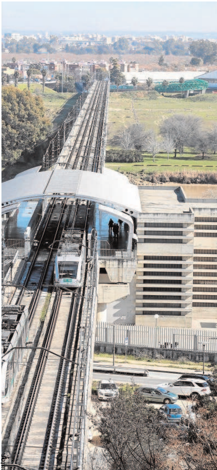
problemas de financiación // RAÚL DOBLADO