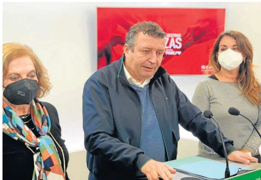
El secretario general del PSOE de Sevilla, Javier Fernández, durante su comparecencia de ayer.