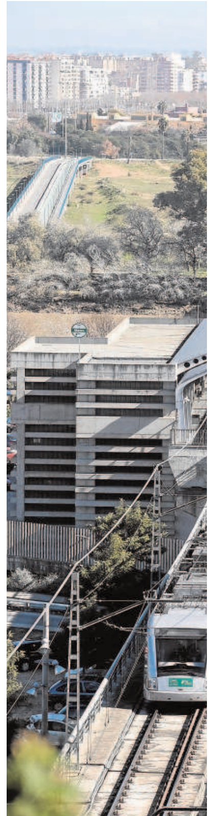
La línea 1 del metro sigue arrastrando

Por el momento retomar la ampliación del metro de Sevilla ha supuesto un desembolso de más de cuatro millones de euros para la actualización de los proyectos. El dinero lo ha puesto la administración andaluza que había consignado también otros cuatro millones en sus cuenta de 2022 que fueron rechazadas en el Parlamento el pasado noviembre.