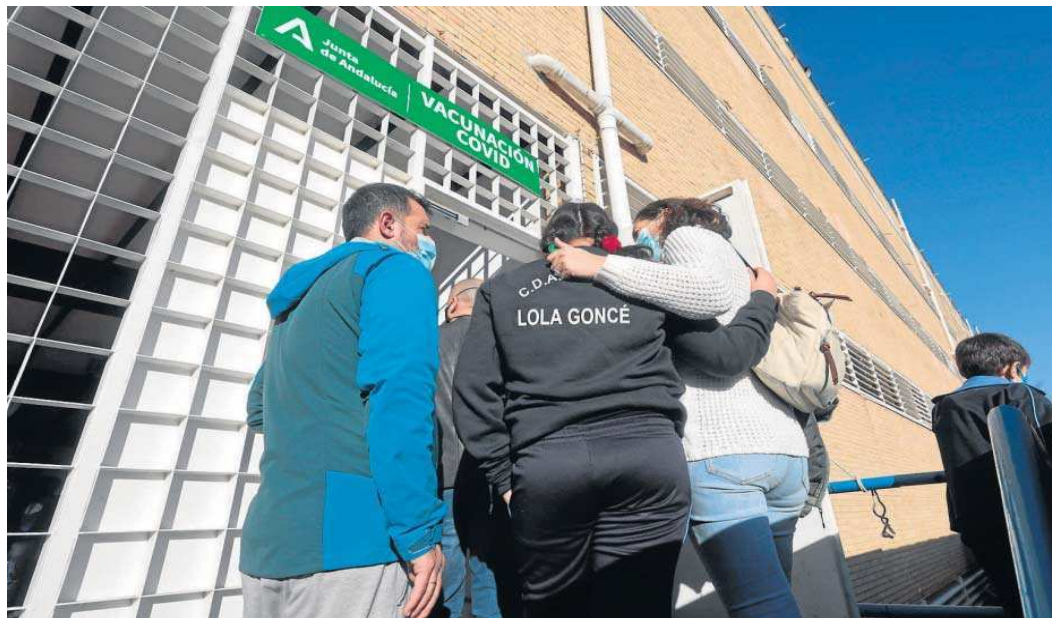
Uno de los puntos de vacunación que se abrieron para los menores.

● Hay 18 personas menos ingresadas en los hospitales y la tasa de incidencia a siete días adelanta una estabilización ● Salud aconseja utilizar criterios diferentes a los de los contagios