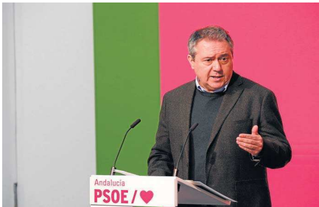
Juan Espadas, ayer en la sede del PSOE andaluz en la calle San Vicente.

Los ejes sobre los que gira la propuesta de Espadas parten de la base del aumento del gasto, pero también incluyen medidas concretas, como un refuerzo del plan de salud mental, la consoli-