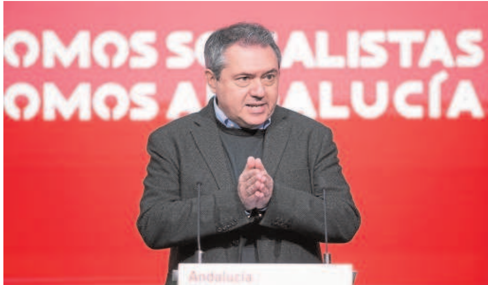
Espadas, nuevo secretario general del PSOE-A, en la rueda de prensa que dio ayer en Sevilla