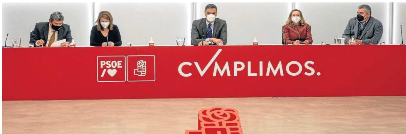
Pedro Sánchez, en el centro de la imagen, se reunió ayer con el equipo económico del PSOE para hablar sobre la reforma laboral.

Esta polémica ha acaparado la atención política tras el periodo navideño y al cumplirse el segundo año de mandato de Sánchez, quien recriminó al PP que protagonice una "oposición negacionista" y le advirtió de que esa actitud nure de votantes a la ultraderecha.