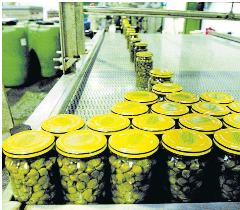
Envasado de alcaparras en una planta transformadora.

Andalucía, segunda comunidad por facturación en industria agroalimentaria