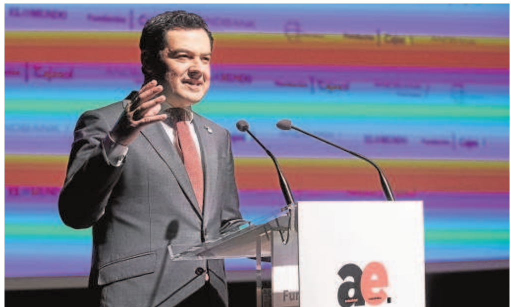
Juanma Moreno, presidente de la Junta de Andalucía

Bendodo subrayó que «toda esta bajada y eliminación de impuestos fue muy criticada y el socialismo nos decía que haciendo eso no tendríamos capacidad de mantener los servicios públicos porque no tendrán capacidad de recaudación», aunque ha asegurado que esto no ha sido así sino que «el modelo de bajada de impuestos funciona». Por otra parte, Moreno se refirió a la aprobación de la Lista (Ley de Impulso para la Sostenibilidad del Territorio de Andalucía), que marcará un antes y un después en la planificación urbanística ofreciendo salida a «situaciones atascadas durante décadas» en algunos casos, y al nuevo decreto de Simplificación Administrativa que es «un impulso definitivo para acabar con las trabas administrativas duplicadas e innecesarias y que durante años han frenado inversiones, proyectos, riqueza y empleo».