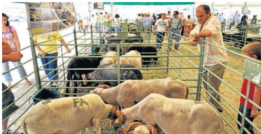
Real Feria de Ganado que se celebra en Loja.

se estudia la campaña 2019-2020, en la que se produjo un fuerte descenso en la producción de aceite, mientras que en aceituna (de mesa y de almazara que elabora la industria) se analiza la campaña 2020-2021.