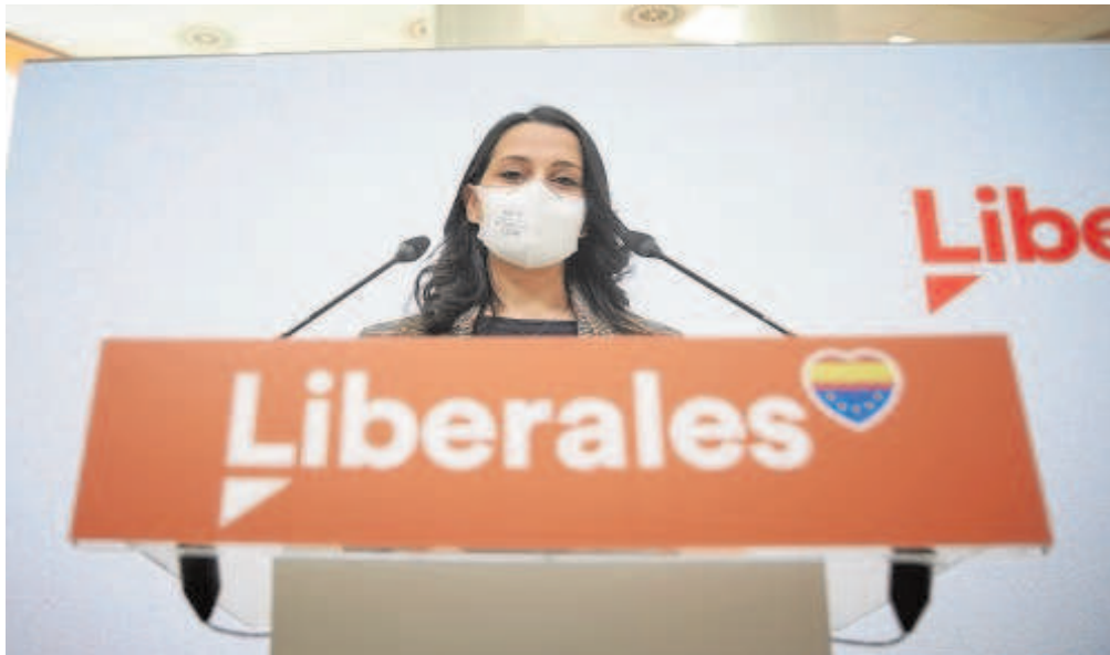
Inés Arrimadas, ayer, tras la primera reunión del año del Comité Permanente de Ciudadanos