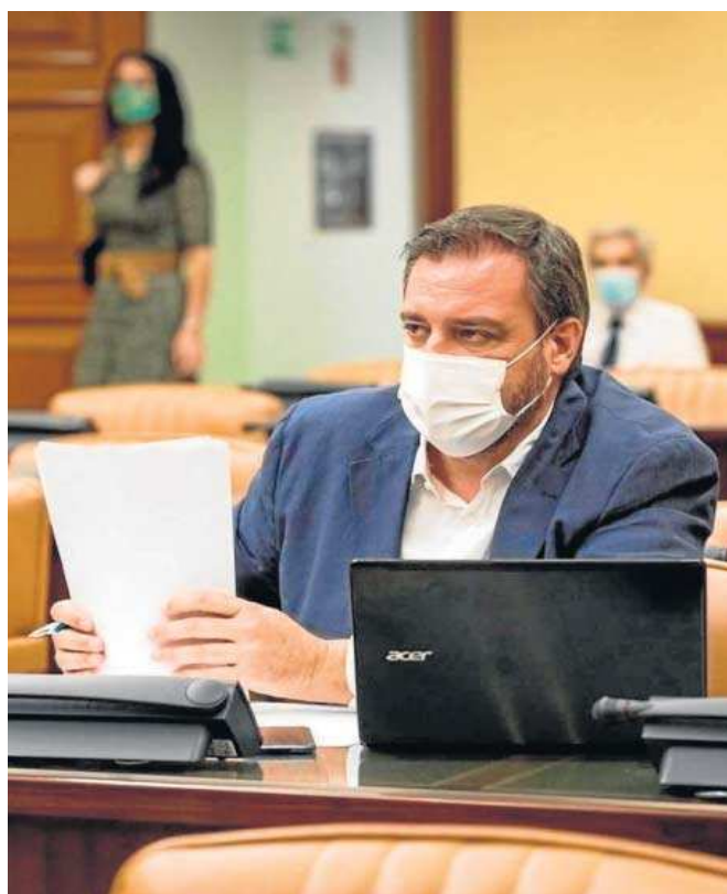
El diputado nacional de Ciudadanos (Cs) Juan Ignacio López-Bas .

López-Bas hizo hincapié en que “en verano de 2018 el entonces ministro de Transportes, José Luis Ábalos, manifestó su firme compromiso con la ampliación del Metro de Sevilla, así como de la voluntad del Gobierno de España de financiar, de forma compartida con el resto de administraciones implicadas, la ejecución del tramo de la línea 3 entre la estación del Prado de San Sebastián y el barrio de Pino Montano”. Sin embargo, el parlamentario de Ciudadanos criticó que “aquello parece que no fue más que otra promesa incumplida de los socialistas con la capital de Andalucía y otro ejemplo más de la falta de com-