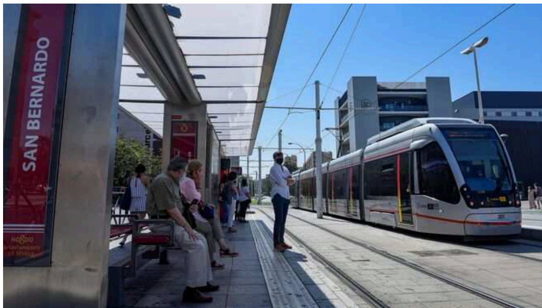
Parada del tranvía en San Bernardo. / Juan Carlos Vázquez

El Ayuntamiento de Sevilla acaba de licitar el contrato de equipamiento de las paradas de ampliación del tranvía y asegura que es el contrato que quedaba para cerrar todos los de la ampliación del Metrocentro, y que este último no es necesario para inicio de obras porque se trata de una actuación posterior.