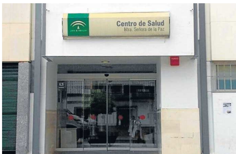
Entrada del centro de salud de San Juan de Aznalfarache.

La ampliación del centro de salud San Juan de Aznalfarache cuenta con un presupuesto de 2.023.331 euros. La ampliación que está pendiente de inaugurarse permitirá mejorar el área de Urgencias, generará nuevos espacios para cuatro consultas polivalentes, una consulta de enfermera gestora de casos, un nuevo espacio para Trabajo Social, la ampliación de la sala de cirugía menor, nueva sala de Fi-