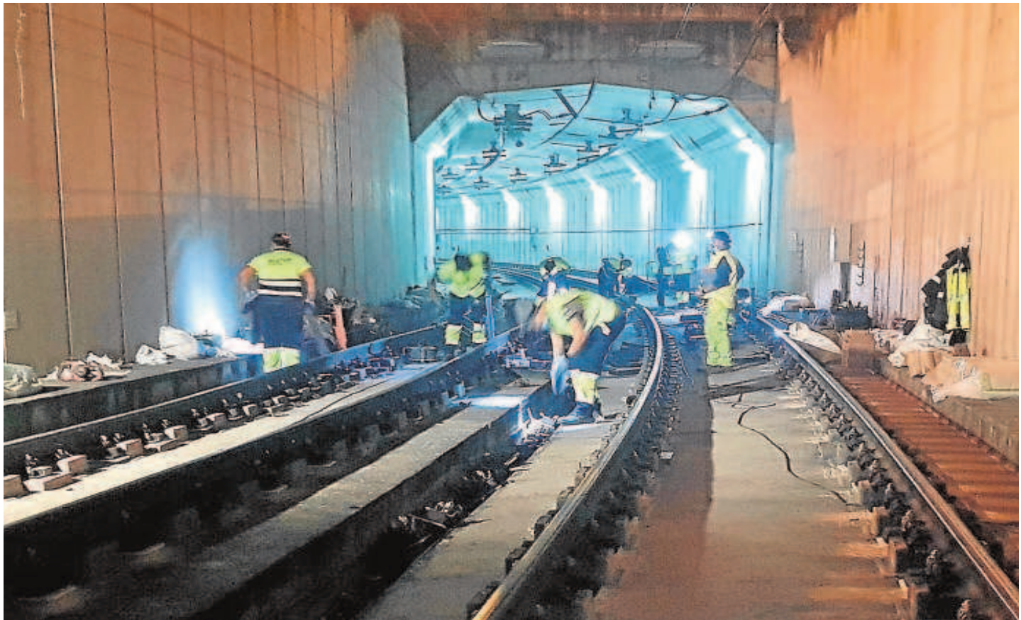
líneas de metro en Cataluña