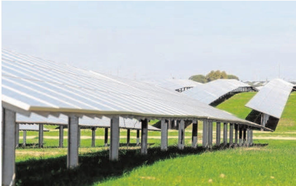
Imagen de una de las plantas fotovoltaicas promovidas y construidas por Prodiel