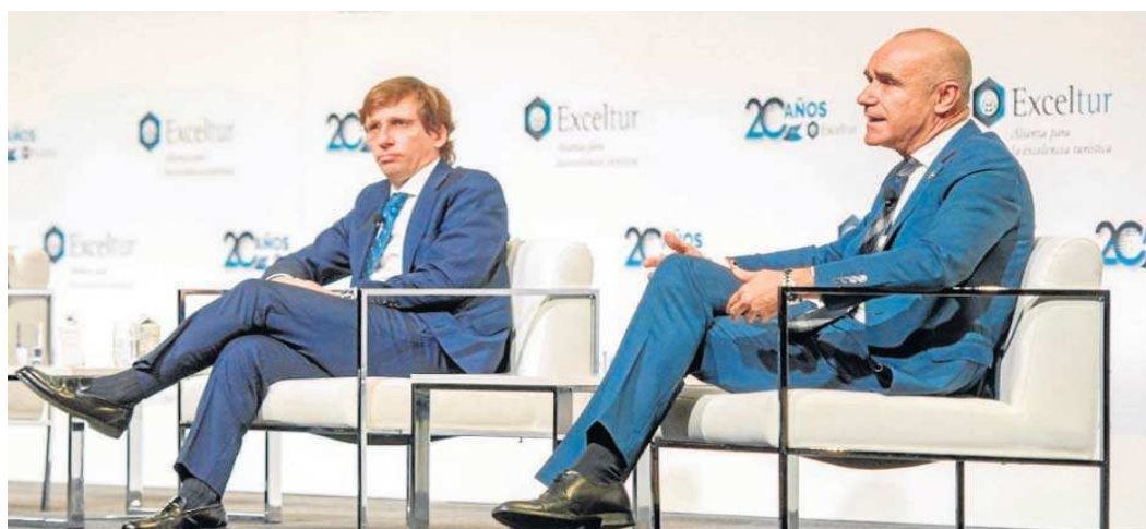
“UNO DE LOS NUESTROS”. El Foro Exceltur reunió ayer en Madrid, en la antesala de Fitur, a los alcaldes de Madrid y Sevilla, “dos de las capitales más importantes de España”, en palabras del presen-