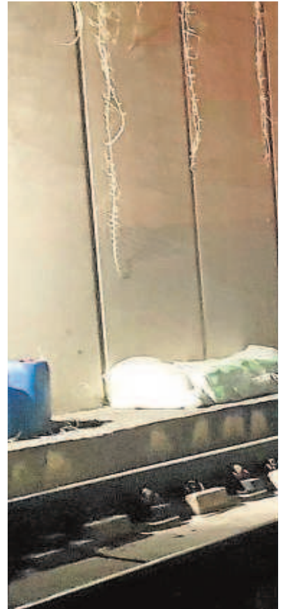
Obras que se vienen realizando en nuevas

El Ministerio de Transportes asegura en su escrito que hay fondos en los PGE, pero en realidad alude al canon por la línea ya construida