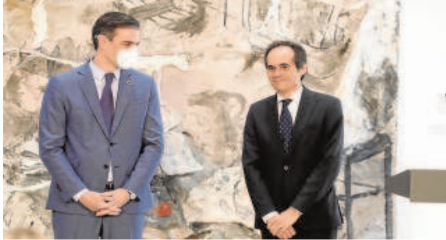
Valles, secretario de Estado de Comunicación, con Sánchez