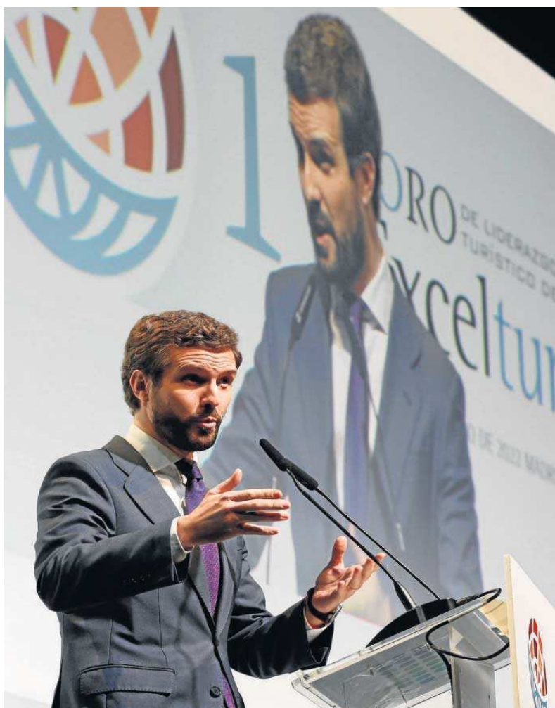
Pablo Casado, presidente del PP, interviene ayer en el Foro de Liderazgo Turístico Exceltur en Madrid.

Casado informó de que en su día ofreció a Sánchez un plan de reconstrucción en base a reformas estructurales y a un plan de choque a corto plazo en las industrias más afectadas por el Covid, como el turismo. Según dijo, ese plan de choque que necesita el turismo debe incluir bajadas fiscales. "El turismo de España es el mejor del mundo y creo que los poderes públicos lo que debemos hacer es apoyarlo o, por lo menos, no atacarlo", enfatizó.