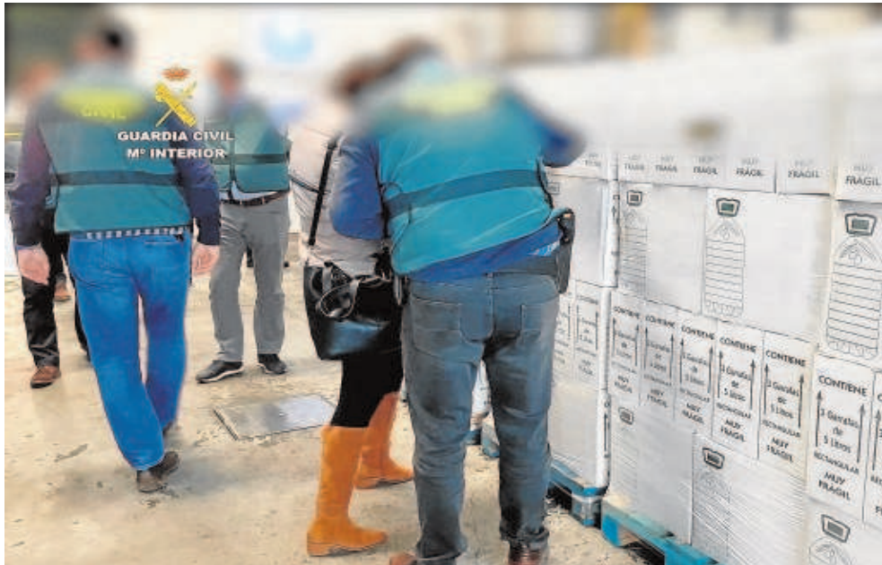
Agentes de la Guardia Civil inspeccionan las botellas de aceite virgen extra falso