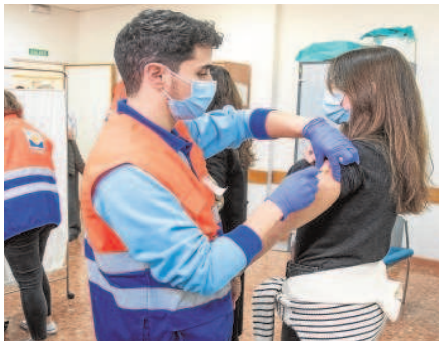
Un enfermero del SAS vacuna a una mujer

En el Aljarafe, la tasa de contagios a catorce días baja 69 puntos, hasta los 1.028 casos por cada cien mil habitantes, mientras que en el distrito sanitario Este la tasa disminuye 11 puntos, hasta los 909 casos entre los 24 municipios de la Sierra Sur y parte de la Campiña que lo conforman. Entre las localidades más pobladas de la provincia tras la capital que for-