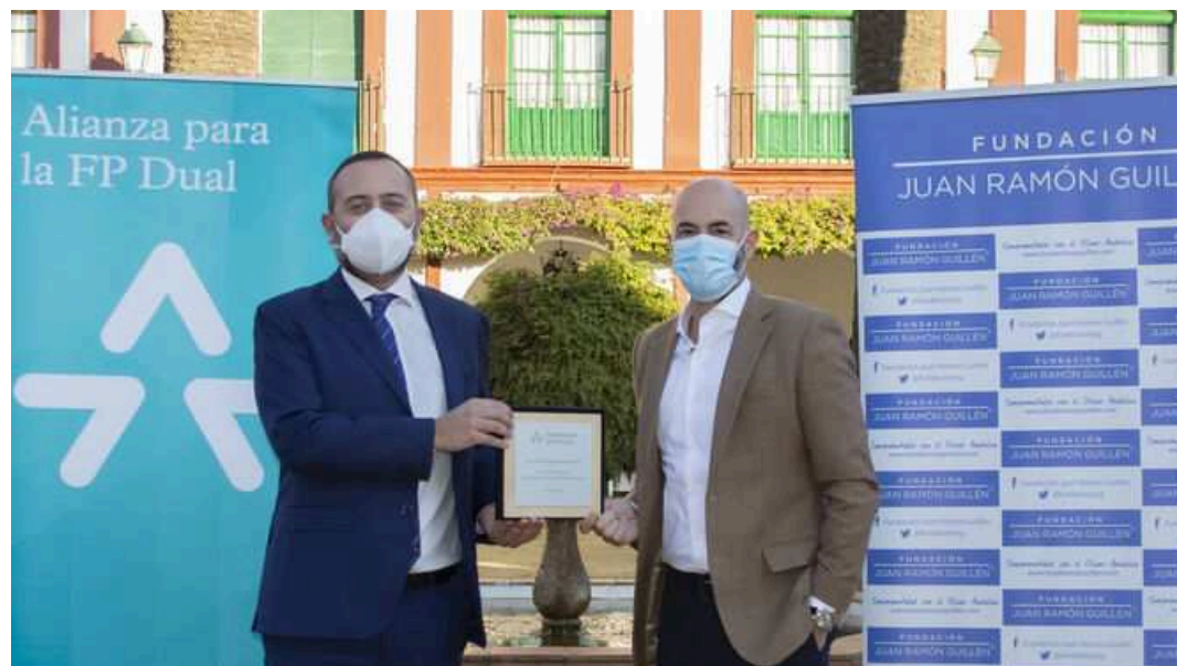
Acto de Adhesión de la Fundación Juan Ramón Guillén a la Alianza para la FP Dual.

Tras suscribir su incorporación a la Alianza para la Formación Profesional Dual, la Fundación Juan Ramón Guillén se ha comprometido a impulsar este modelo de formación en el sector olivarero, durante el acto celebrado en la Hacienda Guzmán, su sede en la localidad sevillana de La Rinconada.