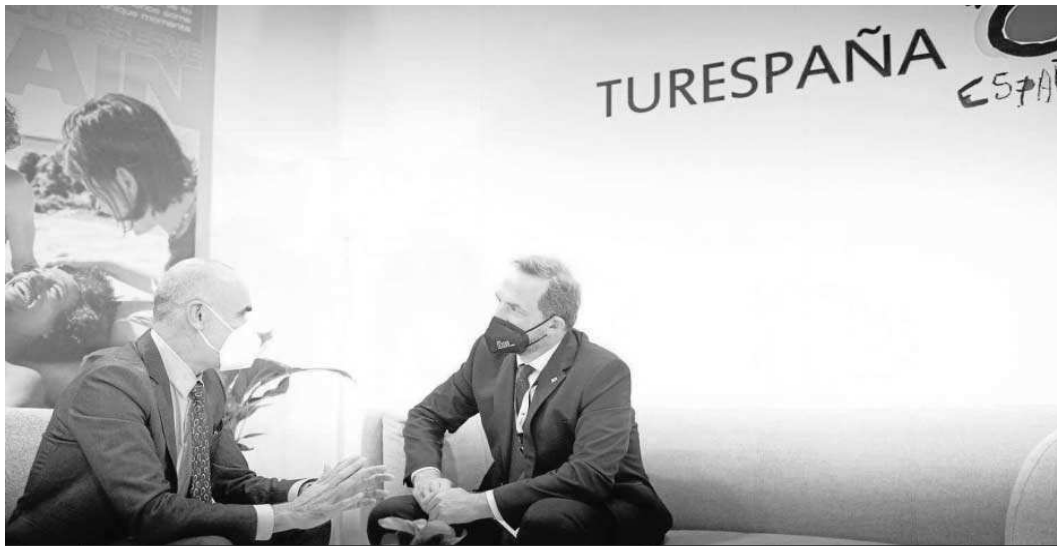
El alcalde de Sevilla, durante la reunión celebrada en el marco de Fitur con el secretario de Estado de Turismo, Fernando Valdés.

● Sevilla prepara proyectos para concurrir a dos próximas convocatorias de 'Next Generation' ● El Ministerio mediará para conseguir el vuelo a Nueva York