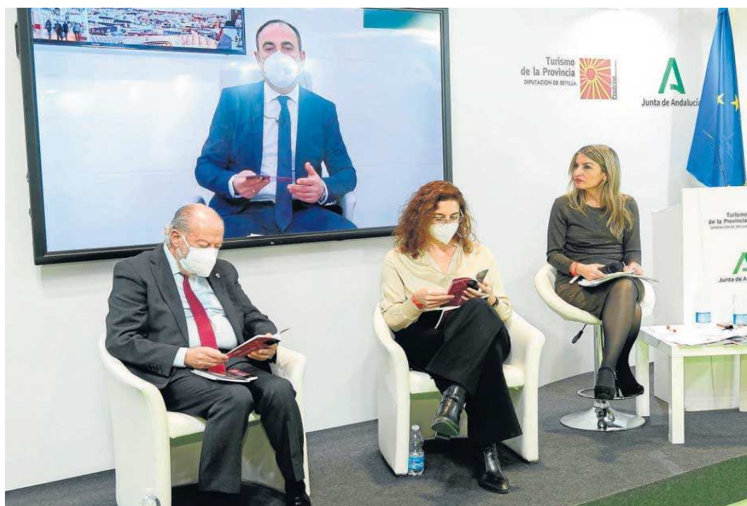
Presentación de la ruta Benedictina.

El camino llega a Sevilla desde Nerva por El Castillo de las