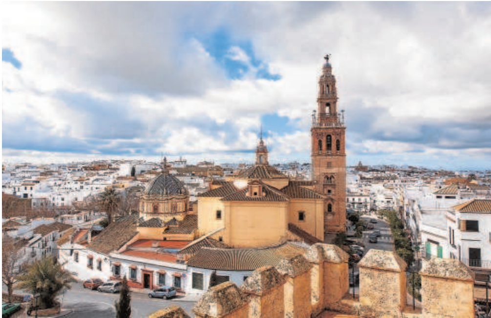
Carmona atesora un patrimonio único que resume la historia de Andalucía // ABC