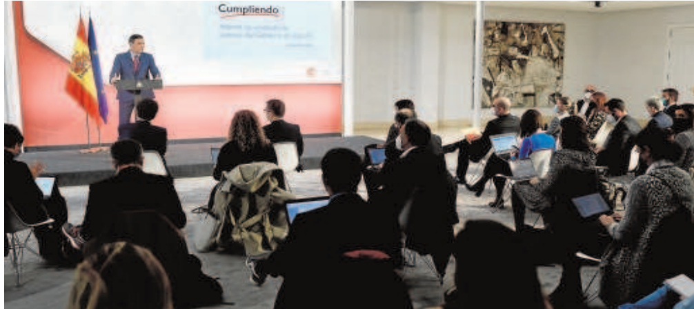
El presidente del Gobierno, Pedro Sánchez, en la presentación del plan 'España puede'