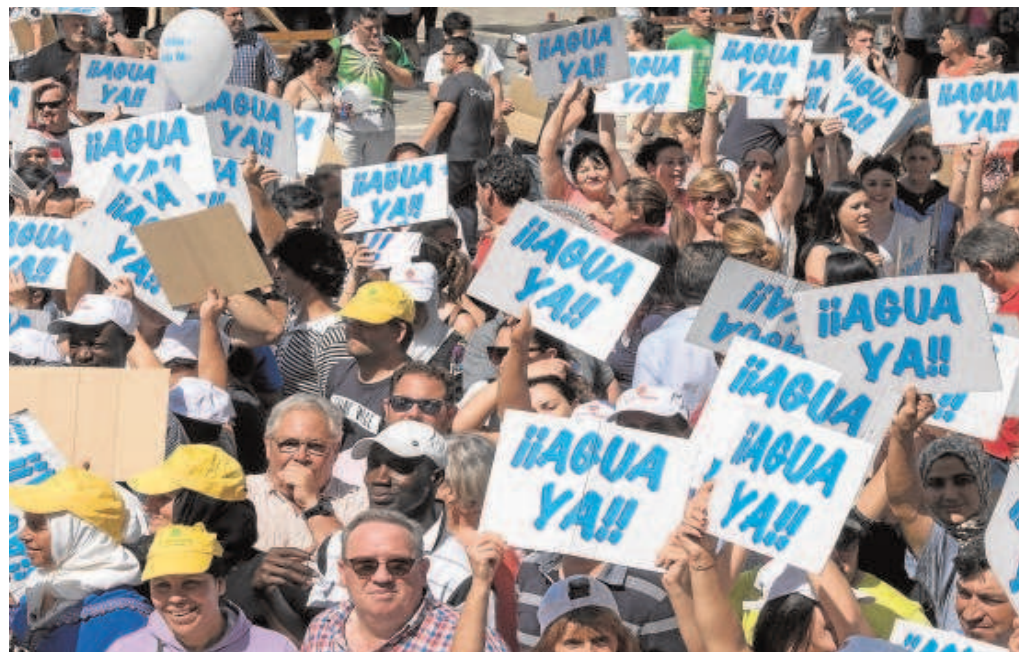
Miles de agricultores se manifestaron en 2017 pidiendo más agua y reconocimiento de sus derechos históricos