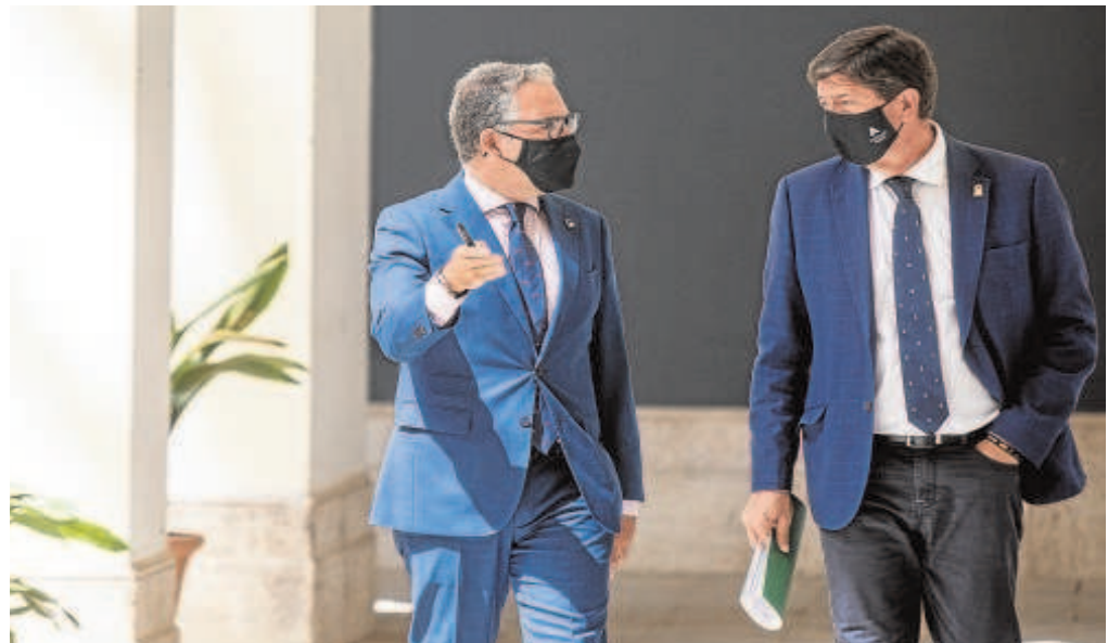
El consejero de la Presidencia, Elías Bendodo, y el vicepresidente andaluz, Juan Marín, en San Telmo

El gobierno heredó una Administración hipertrofiada que no ha dejado de crecer y de consumir dinero de los presupuestos en casi 37 años. En las agencias, consorcios, observatorios y empresas públicas han tenido cabida personas allegadas a los que las crearon y desarrollaron, a menudo a través de procesos selectivos opacos, sin respetar los principios de publicidad, igualdad, mérito y capacidad.