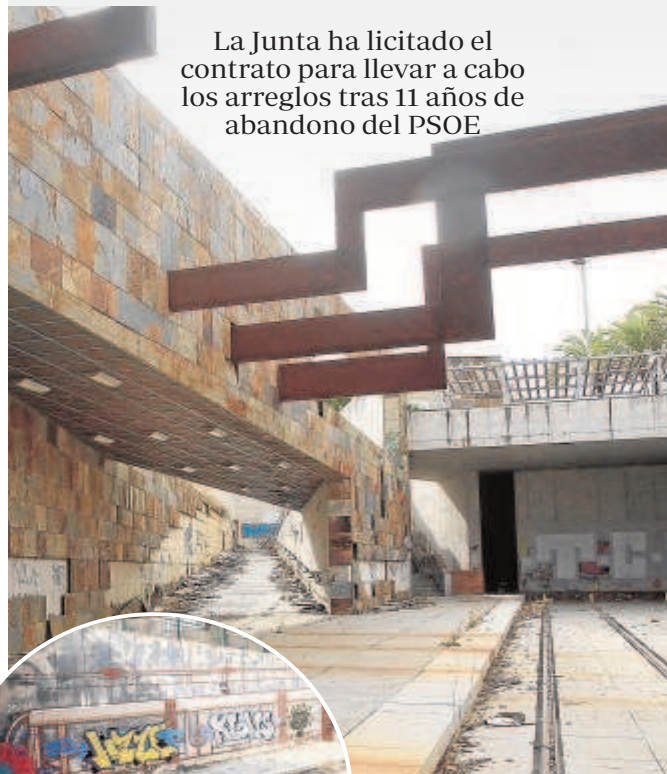
Sobre estas líneas, estado en el que se encuentran las vías y la estación

La Junta ha licitado el contrato para llevar a cabo los arreglos tras 11 años de abandono del PSOE