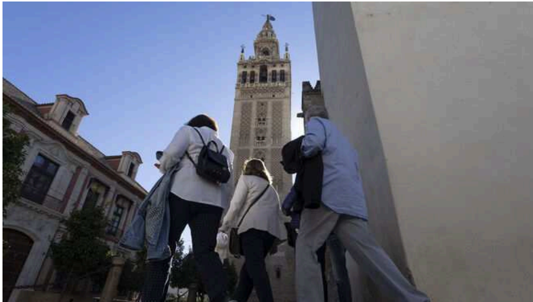
Turistas en las gradas de la Catedral.

Las visitas a la Catedral de Sevilla alzan el vuelo. Tras el parón sufrido a raíz de la pandemia del Covid-19, el templo metropolitano ha logrado recuperar el 70% del turismo previo a la Covid . Así lo verifican los datos que ha publicado el Arzobispado de Sevilla, que, además, constatan que dicha actividad retoma el pulso gracias, principalmente, a los visitantes nacionales .