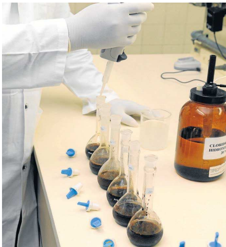
Una investigación en la Universidad de Sevilla.

desaparece a partir de abril, "no se sabe qué va a pasar con los nuevos contratos y los concursos en evolución", afirma el vicerrector de Investigación, que incide en que sólo en los meses de noviembre, diciembre y enero se han puesto en marcha 280 convocatorias de selección.