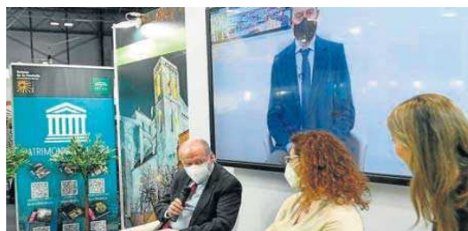
Guía para seguir los pasos de la Orden de Malta en la provincia de Sevilla.

una publicación turística adaptada a los nuevos tiempos, con una forma de adentrarse en ella muy relacionado con las nuevas tecnologías, pero a la vez con un di-