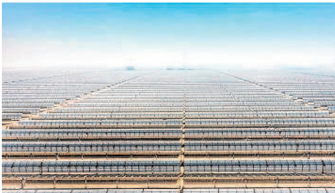
Planta solar construida por la multinacional sevillana Abengoa.

Abengoa ha sido el proveedor de la tecnología, el diseño, la ingeniería y la construcción de las tres plantas para Shanghai Electric Group Co. Ltd.