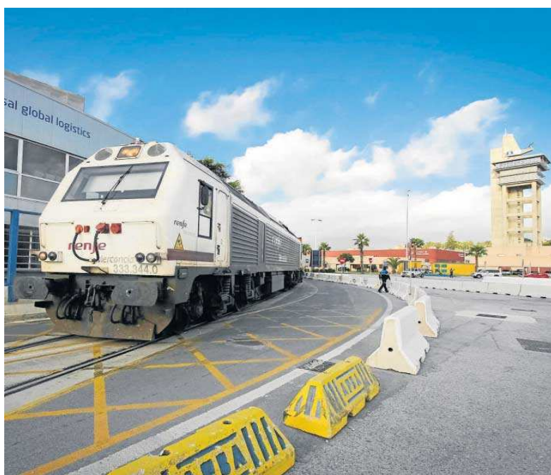
Un tren con contenedores en el puerto de Algeciras, donde creció la importación y exportación en 2021.

El avance del sector exterior andaluz hasta noviembre pasado