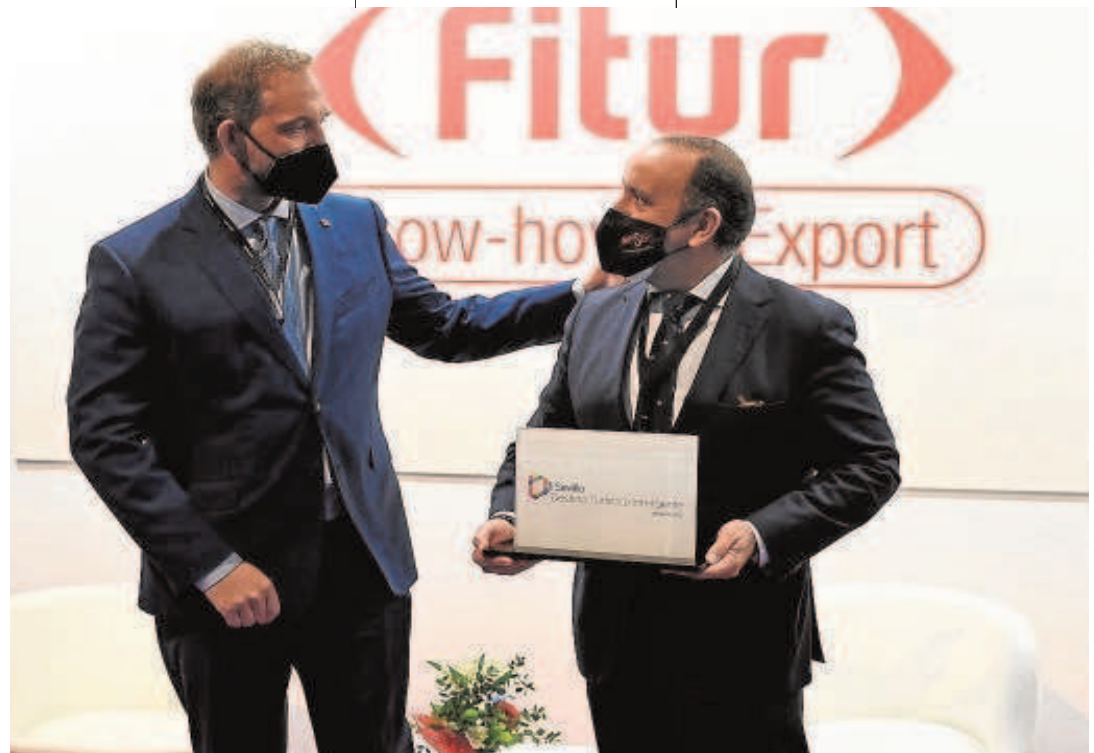
Sevilla recibió ayer el distintivo como Destino Turístico Inteligente que concede la sociedad estatal Segittur

La primera de ella seguirá el mismo modelo de la que se acaba de resolver y por la que Sevilla ha recibido tres millones de euros. La intención, según comentó, es conseguir más financiación para continuar con la estrategia de sostenibilidad turística. Mediante ese plan se llevarán a cabo once actuaciones como la mejora de la recogida selectiva en establecimientos de hostelería, la ejecución de un programa de choque de confort climático en el eje central del destino, la implantación de un sistema de iluminación monumental de alto rendimiento energético y con tecnología inteligente, iniciativas relacionadas