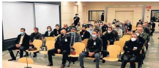
El banquillo de los acusados de Fitonovo.