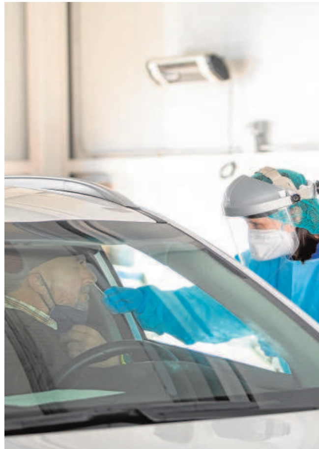
El conductor de un vehículo se somete a un test de antígenos

En el Aljarafe hay ahora 3.849 casos activos en los últimos catorce días, repartidos entre 32 municipios con Covid, lo que ha provocado la tasa de contagios a catorce días baje 73 puntos, hasta los 985 casos por cada cien mil habitantes. Entre las localidades con más positivos activos en las dos últimas semanas destacan Tomares con 220 contagios, Coria (312), Mairena (508), Olivares (182) o Camas (304).