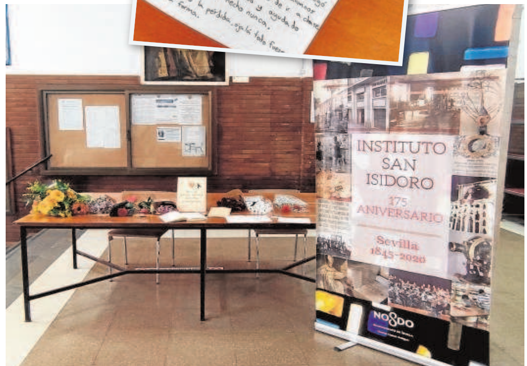
Sobre estas líneas, mesa con el libro de condolencias y flores y arriba la carta de un alumno