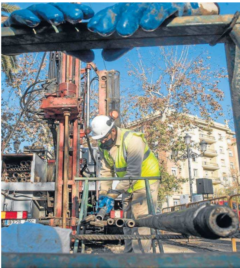
Trabajos geotécnicos de la línea 3 del Metro en la avenida de la Borbolla.

Ahora que se vuelve a ratificar el compromiso estatal para esa financiación, la Junta podrá llevar a cabo su plan para el que ha reservado dos millones de euros en