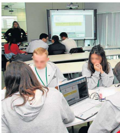
Un grupo de jóvenes en un curso sobre emprendimiento.

Se trata de un indicador que incluye tanto la fase de nacimiento de la empresa como la de su consideración como compañía nue-