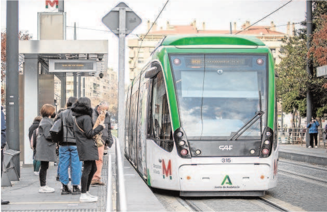
El Metro de Granada, junto a estas líneas. Abajo a la derecha, el tranvía de Jaén. A su izquierda, las obras del Metro de Málaga