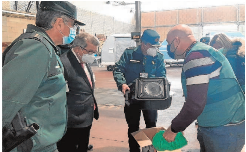
El subdelegado comprueba algunos de los escondites usados por los traficantes para enviar la droga

La operación policial que está desarrollando la Guardia Civil desde el año pasado está contando con la colaboración de las empresas de mensajería que usan los narcos para enviar sus paquetes de droga. Estas empresas son habitualmente desconocedoras de la mercancía que se esconde en los paquetes porque la droga suele ir camuflada. La colaboración de estas empresas es clave para que los agentes obtengan las primeras pistas que les sirva llegar hasta los traficantes, como identificar a las personas que tramitaron el envío de la mercancía.