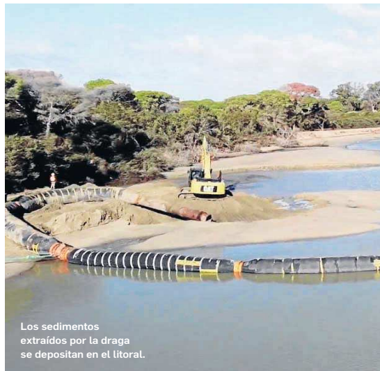
Los sedimentos extraídos por la draga se depositan en el litoral.

● El proyecto permite regenerar un litoral muy erosionado en el parque con las arenas extraídas en el dragado de mantenimiento