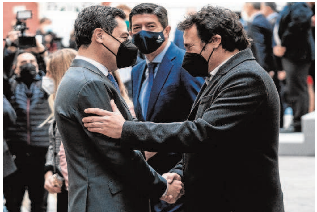
Moreno saluda al alcalde, José María González 'Kichi', en presencia de Juan Marín en las escalinatas del Oratorio

«Se apoyará la instalación de una planta de reciclaje de plásticos con inversión de 45 millones de euros»