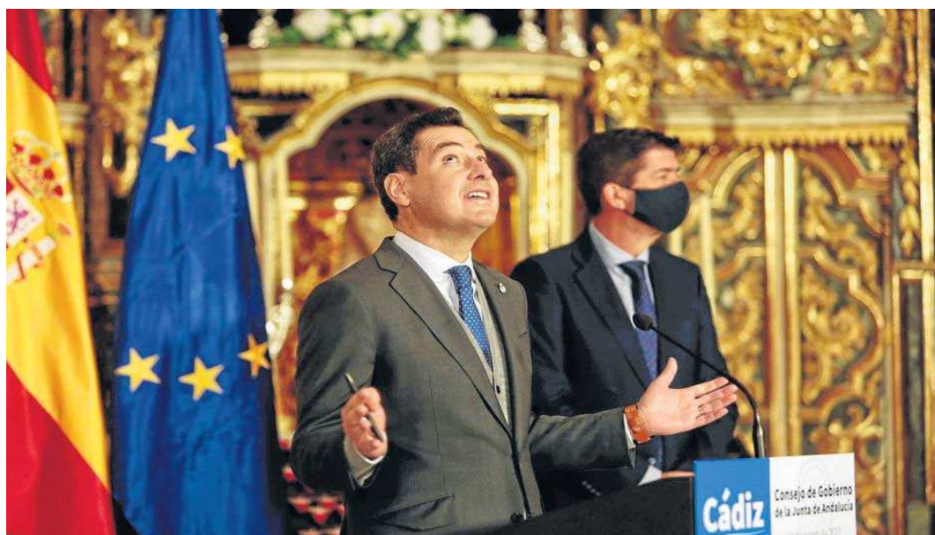
Juanma Moreno, ayer en la comparecencia posterior al Consejo de Gobierno celebrado en el oratorio de San Felipe Neri de Cádiz.

El Gobierno de PP y Cs se encuadra así en la estrategia coordinada desde Génova para atacar al Ejecutivo central por su gestión de los fondos europeos. Fue Isabel Díaz Ayuso la que inauguró esta estrategia con una denuncia en los juzgados que la Junta, según habían dicho, no descarta.