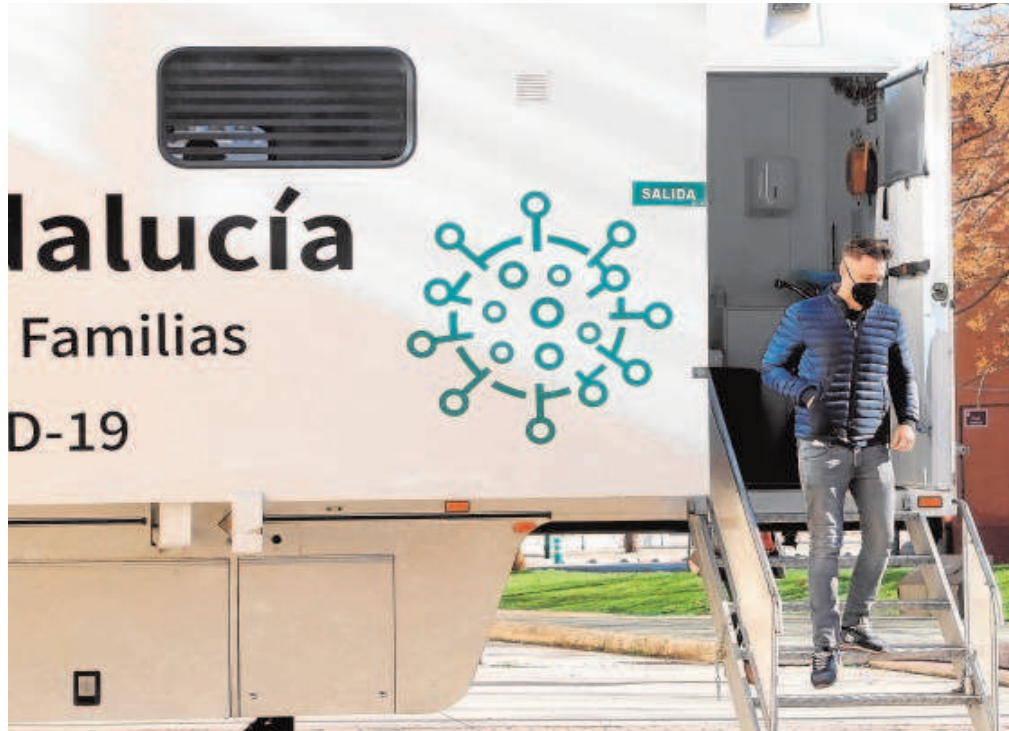
Un hombre sale de un puesto móvil de vacunación Covid en Córdoba