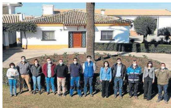
Un momento de la visita a la planta de BASF en Utrera.

La División de Soluciones Agrícolas de BASF invierte fuertemente en I+D y en una cartera de productos, que incluye semillas, protección de cultivos química y biológica, gestión del suelo, sanidad vegetal, control de plagas y soluciones digitales.