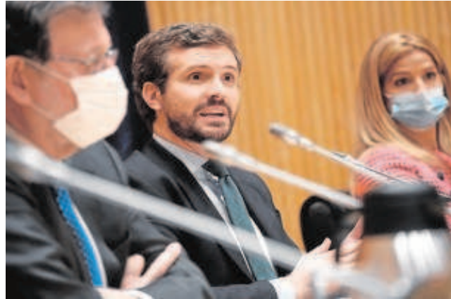
Pablo Casado, presidente del PP