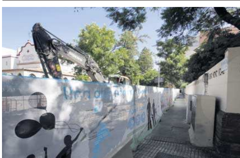
Excavadora en la obra de la avenida de la Cruz Roja.

Tras varios requerimientos formulados durante el año 2019 y 2020, con fecha 29 de junio de 2021, el Defensor recibió oficio del alcalde de Sevilla (entonces Juan