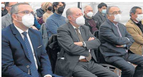
El alcalde palaciego, el presidente de la Diputación y el responsable de la Junta.