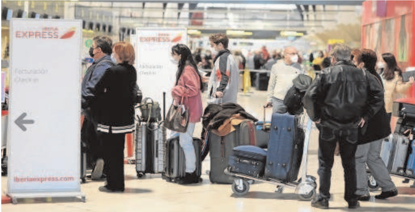
Trasiego de aviejeros en el aeropuerto de San Pablo en Sevilla