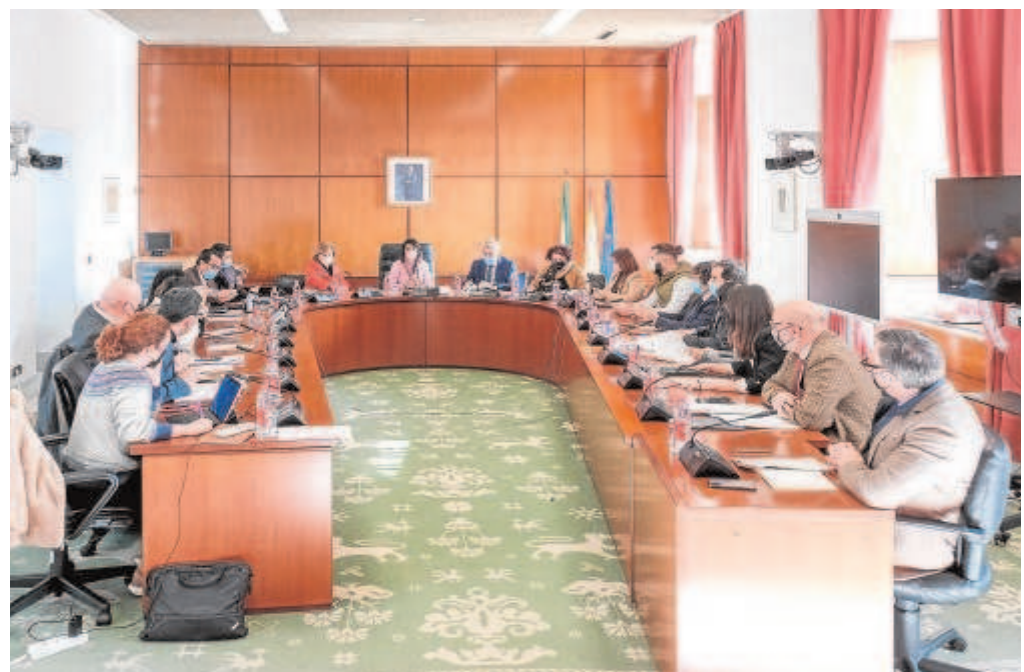
Los miembros de la Diputación Permanente del Parlamento, reunidos ayer