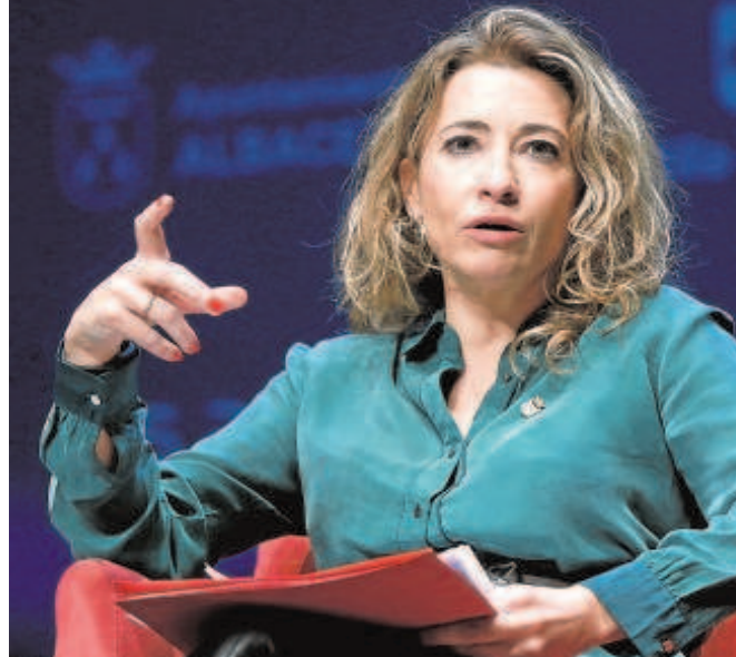
La ministra de Transportes, Raquel Sánchez, en un acto público

La ministra de Transportes no tenía agenda pública ayer, que era el día fijado para la reunión con la consejera y el alcalde