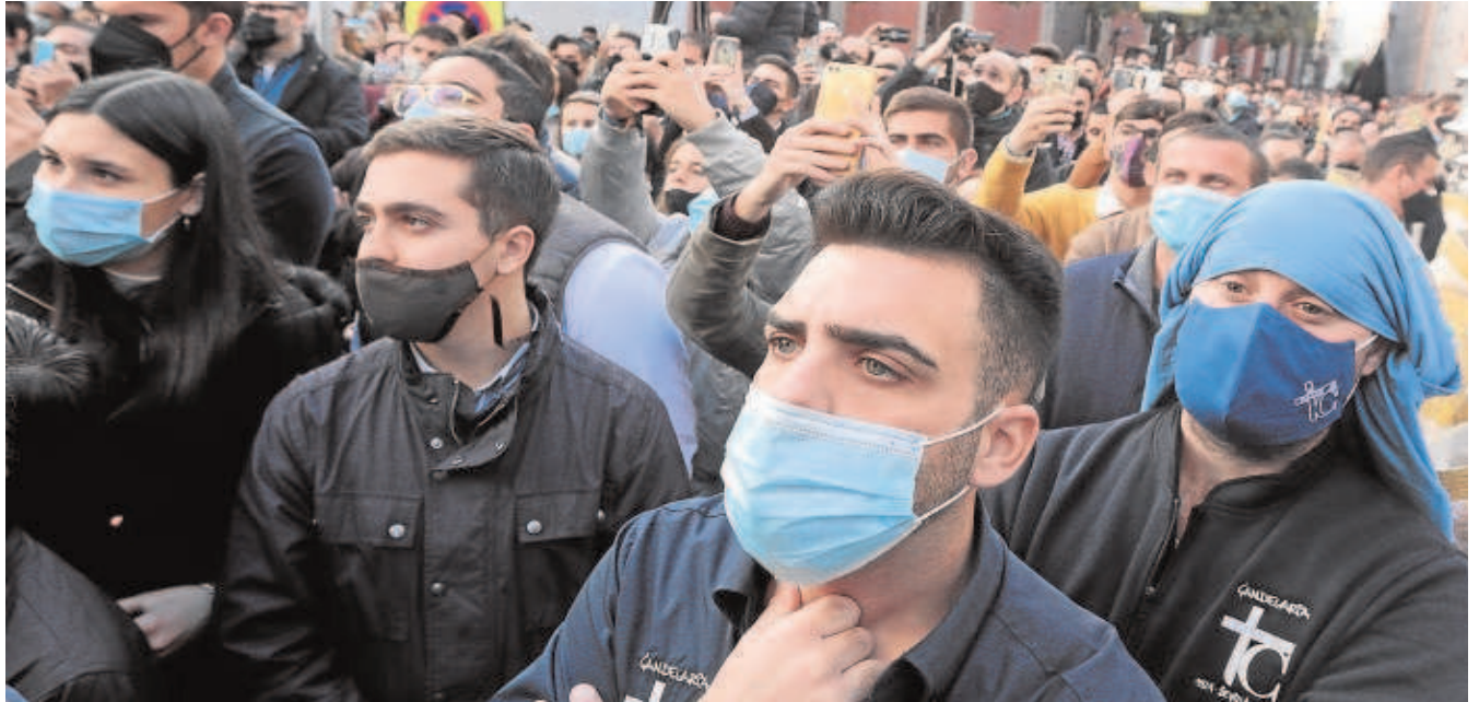
Costaleros entre el público durante la procesión de la Virgen de la Candelaria en Sevilla