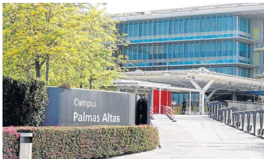
Sede del grupo Abengoa en Sevilla, en el Campus de Palmas Altas.