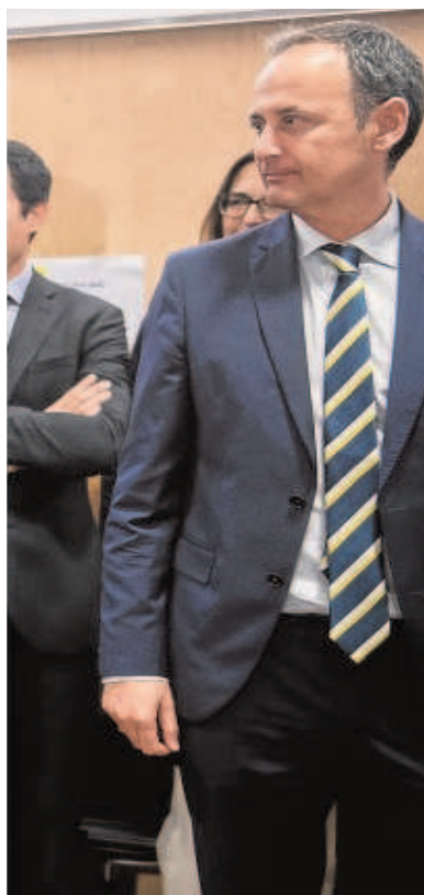
ontero, en una reunión en 2020

Bruto (PIB). Si en 2010, el FIC representaba el 0,29% del PIB regional, una década después equivale al 0,10%.