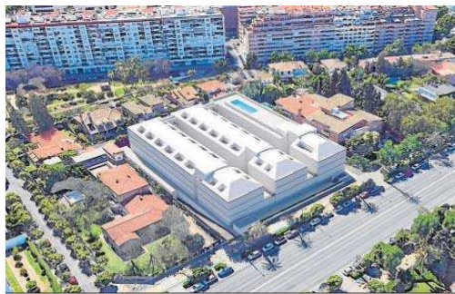
Recreación de la residencia universitaria que será construida.