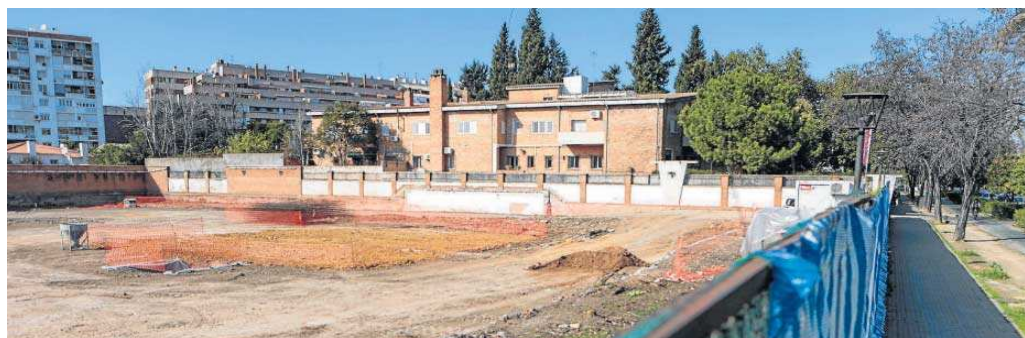
Estado actual de los trabajos tras el derribo del chalet.

Los técnicos de la Gerencia de Urbanismo están analizando estos días los razonamientos aportados por los ciudadanos (consideran que el edificio proyectado