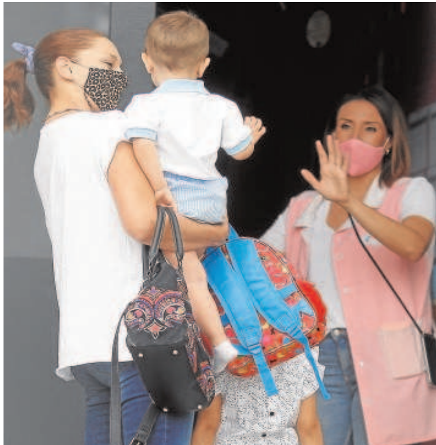
Una madre recoge a su hijo de una guardería

En la tercera semana de 2022 han tenido que ser hospitalizados diez menores de cuatro años en los centros de la provincia, frente a los cinco ingresados correspondientes a la franja de edad de 5-11 años, que presenta una incidencia de 1.005 casos tras el diagnóstico semanal de 770 menores. Entre los niños sevillanos de 12 a 19