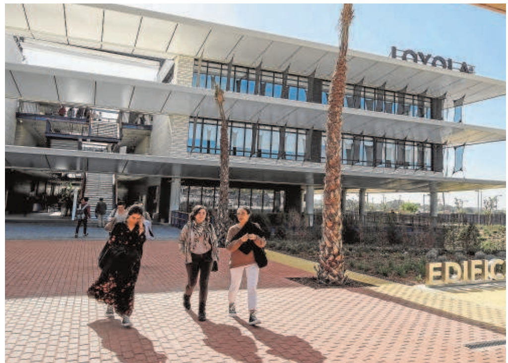
El campus de la Universidad Loyola en Dos Hermanas

En el caso de Ciencias de la Actividad Física y del Deporte, la Loyola sería el sexto centro de Sevilla donde se estudie, ya que el pasado curso se impartía en la Universidad de Sevilla (11,350 de nota de corte), en la Pablo de Olavide (11,2) y en tres centros adscritos, Cardenal Spínola (5), el Centro de Osuna (8,190) y San Isidoro (5). En cuanto a Nutrición hasta ahora únicamente la ofrecía la UPO y el pasado año tuvo una nota de corte de 11,377.