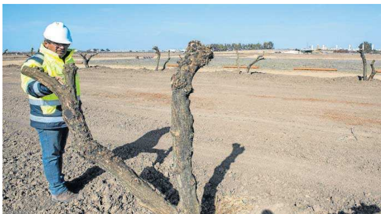
Las obras de urbanización ya se han iniciado en estos terrenos de la marisma del Guadalquivir.