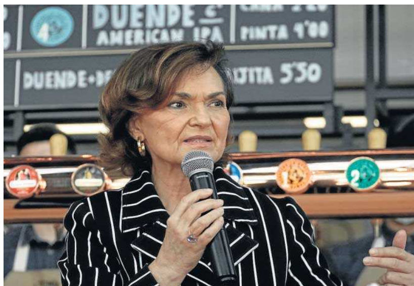
Carmen Calvo interviene en la inauguración de la factoría Cruzcampo antes del verano pasado. JUAN CARLOS MUÑOZ