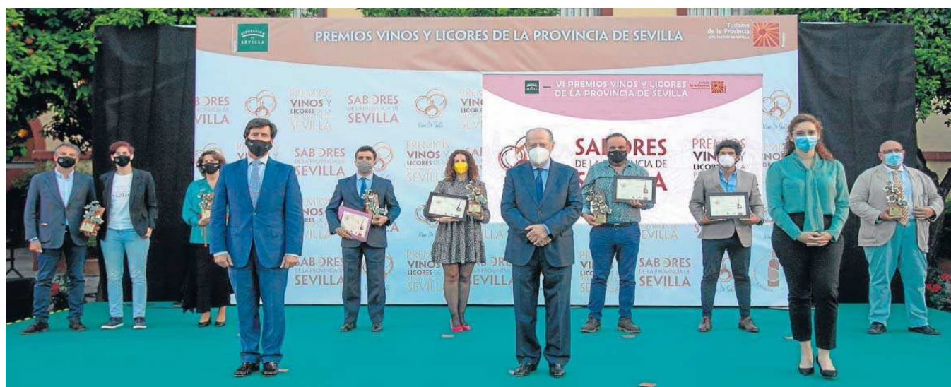
Los galardonados en la edición del pasado año 2021.

Plazo de inscripción. La entrega de muestras está abierta hasta el próximo 14 de marzo