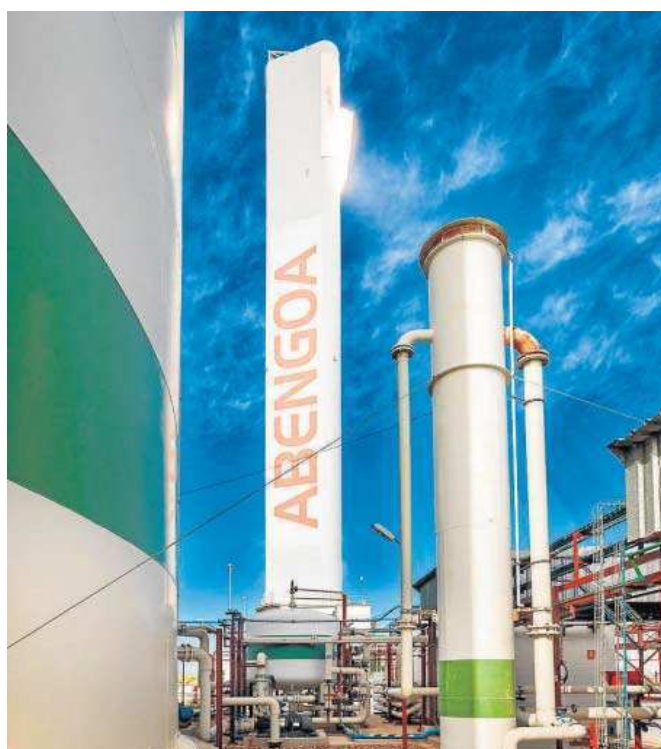
Planta termosolar construida por Abengoa en Sevilla.

Las mismas fuentes señalan que en ese documento acrecientan las dudas sobre la oferta, que fue modificada en noviembre pasado, momento desde el que retiró su compromiso inicial a dar una financiación interina a la filial operativa del grupo hasta que el Gobierno no apruebe, a través de la Sociedad Estatal de Participaciones Industriales (SEPI), conceder la ayuda de 249 millones solicitada al Fondo de Apoyo a la Solvencia de Empresas Estratégicas, y