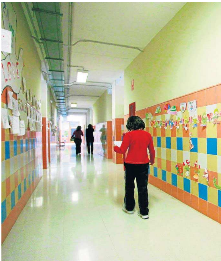
Varios alumnos transitan el pasillo de un colegio público.

Dicha cifra constata la tendencia negativa que sufre Sevilla en este ámbito demográfico y que tiene su incidencia en las escuelas. En 2015 nacieron en la provincia 19.512 bebés, en 2016 lo hicieron 19.035, y en 2017, 17.884. En 2018 este registro volvió a reducirse, al bajar a los