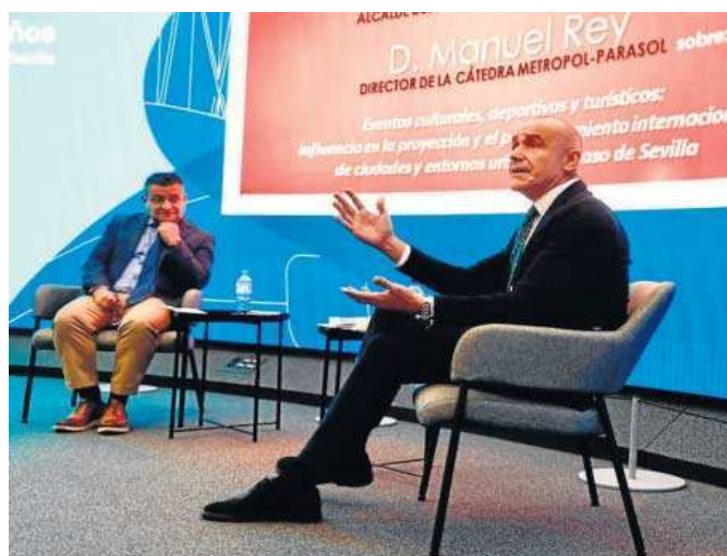
Antonio Muñoz, ayer durante su intervención en la Cátedra Metropol Parasol.

Las claves de esta estrategia fueron desgranadas ayer por el alcalde de Sevilla, Antonio Muñoz, en la Cátedra Metropol Parasol, ante un auditorio de estudiantes universitarios. En pocas