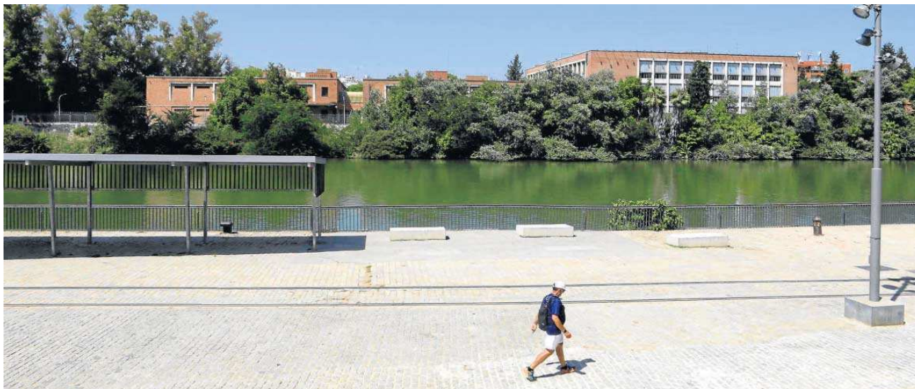
Vista de la antigua fábrica de Altadis desde el Muelle de Nueva York. El paisaje cambiará con al menos un edificio de hasta ocho plantas.