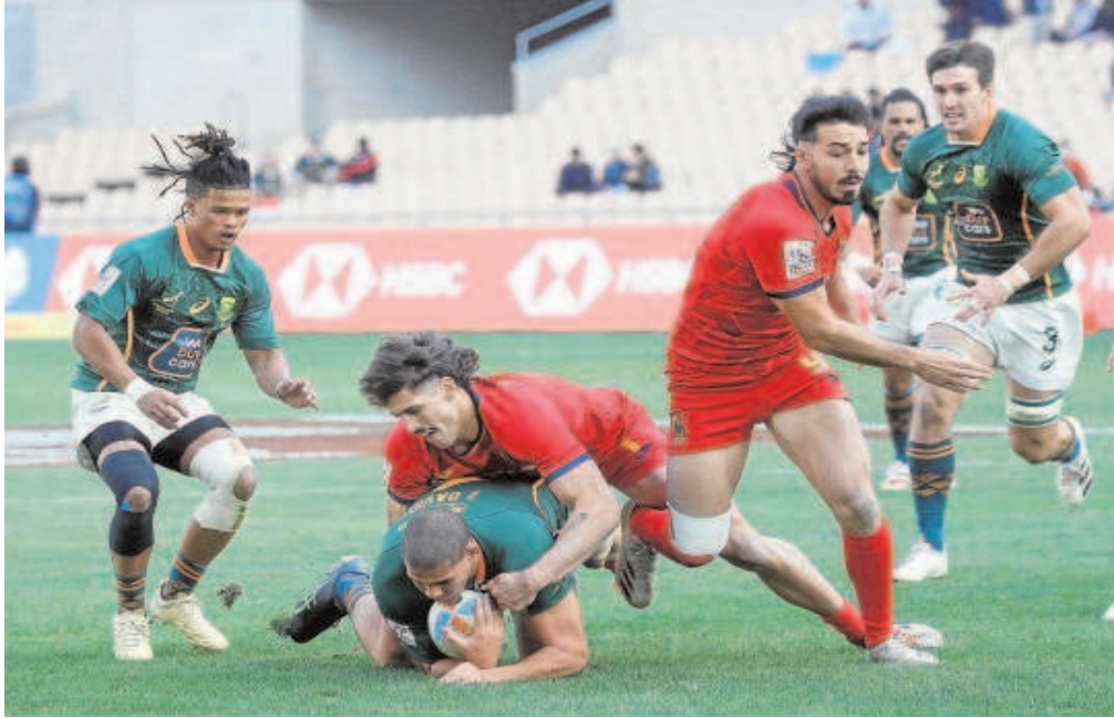
Un lance del España-Sudáfrica de las HSBC Spain Sevens celebradas en el estadio de la Cartuja