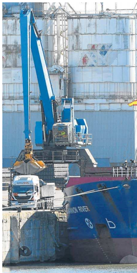
Descarga de arenas en el Puerto de Sevilla.

El PSOE cree que ha llegado el momento de plantearse el "cierre responsable" de esta instalación y que le corresponde a la Junta de Andalucía como administración competente en esta materia tomar las determinaciones que sean precisas para resolver la continuidad.