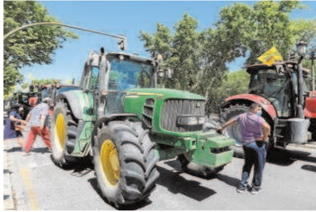
Tractores en una manifestación en la Plaza de España