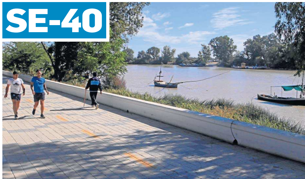
El Paseo Marítimo de Coria del Río junto al Guadalquivir, en una zona cercana al paso del río de la SE-40.

● La solicitud se envía al Consejo de Transparencia y el Ministerio está obligado a responder