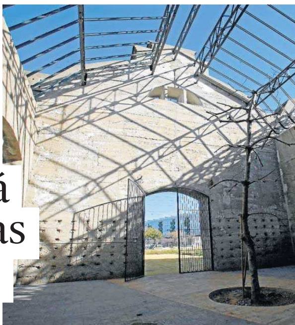
Una higuera que se ha mantenido como símbolo de los años de 'olvido' del edificio.

tructura que estará en disposición de acoger a las primeras empresas a finales de año. Éste es el calendario que baraja el Ayuntamiento de Sevilla que confirmó la vocación empresarial de un proyecto que ha tenido que superar algunos escollos desde su puesta en marcha en 2015. Fue en esa fecha cuando el entonces gobierno de Juan Espadas buscó el dinero necesario para recuperar las naves de Renfe a través del programa Edusi, con el objetivo de recalificar la zona norte de la ciudad. Y hubo un frenazo provocado por la rescisión del primer contrato de las obras que derivó en otra licitación que quedó desierta y fue necesario una tercera para encontrar una resolución. Los trabajos se iniciaron definitivamente hace justo tres años con la retirada de los paneles de ladrillo y placas de fibrocemento de la cubierta. En agosto de 2019 dio