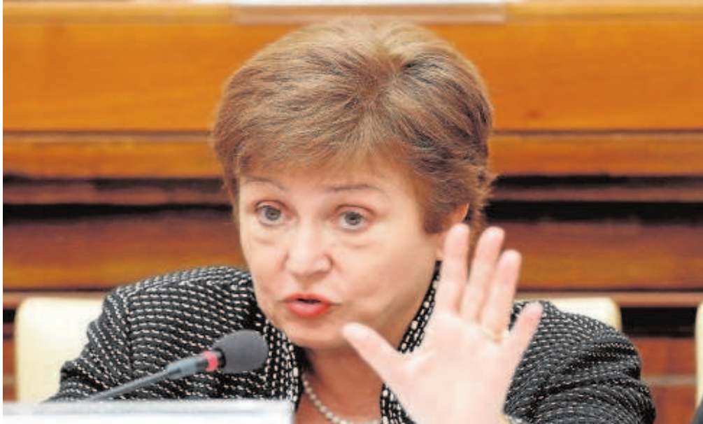
Kristalina Georgieva, presidenta y directora gerente del FMI