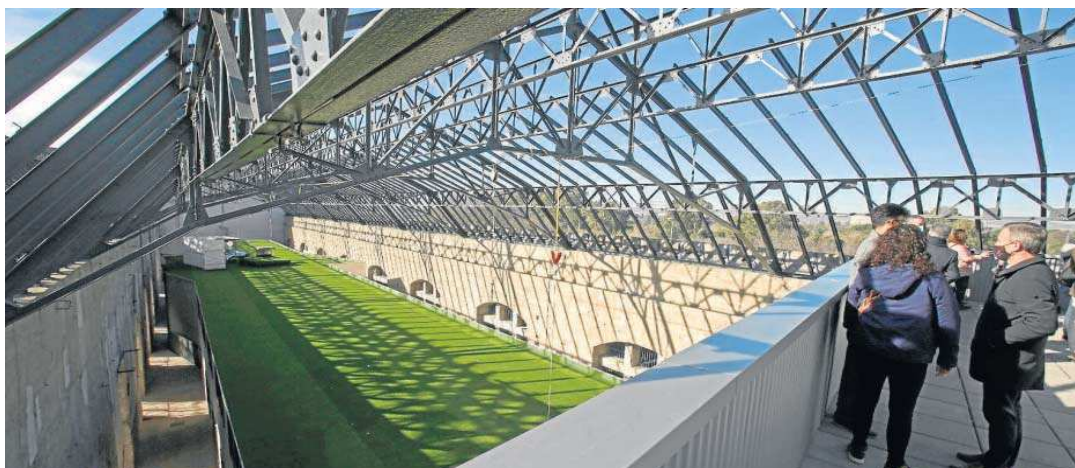
La estructura de madera, con un revestimiento aislante en el techo, ya culminada dentro del gran contenedor de la antigua nave de Renfe.