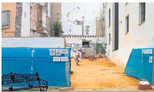
El acceso al llamado jardín alto con la entrada a la iglesia al fondo.

La actividad arqueológica preventiva realizada durante el transcurso de estas obras permitió corroborar que la presencia de pintura mural en San Laureano era más abundante que la que en un principio se suponía, y que aun a pesar de las dudas sobre su calidad, el estudio de las mismas sería muy interesante. Por ello, el Ayuntamiento, a través de la Gerencia de Urbanismo y Medio Ambiente, sacó a licitación un contrato para la realización del estudio y los trabajos previos para la restauración y recuperación de las pinturas murales. Estos trabajos, con un coste superior a 23.000 euros, fueron adjudicado el 16 de noviembre de 2021 a la empresa Artyco y para que arranquen sólo falta que la Comisión Provincial de Patrimonio —que lo estudia desde diciembre— de el visto bueno.