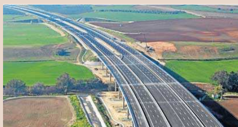
DE ALMENSILLA A DOS HERMANAS. Las imágenes muestran la segunda ronda de circunvalación construida en el tramo de Almensilla (Aljarafe), en el que se cruza con la carretera de Utrera (A-376) y el tramo de Alcalá-Dos Hermanas.