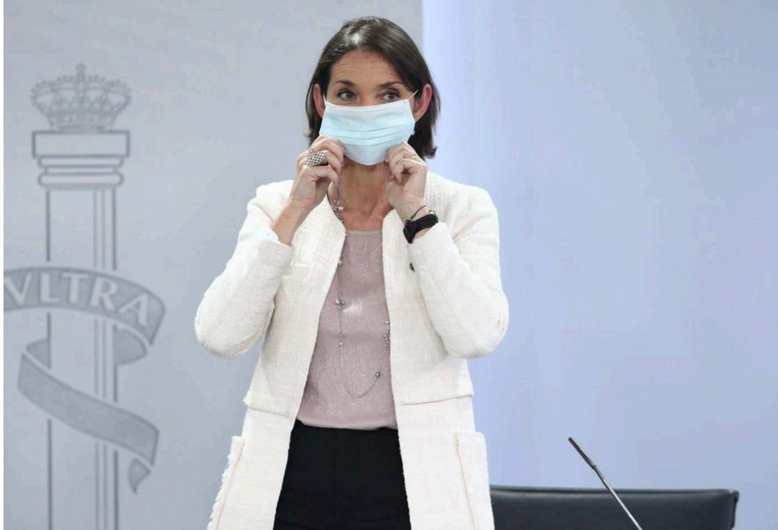
Reyes Maroto.

La ministra de Industria, Comercio y Turismo, Reyes Maroto, ha asegurado hoy que en las próximas semanas el Consejo de Ministros aprobará el Perte para la industria naval, cuyo objetivo es reforzar el sector, modernizarlo y transformar su cadena de valor.