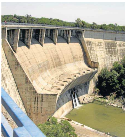
Imagen de archivo del embalse del Gergal.

“Mi llamamiento es doble: no hay que alarmar a la población pero sí pedir sensatez para que el consumo se reduzca”, comentó