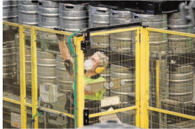
Un trabajador en la fábrica de Heineken de Sevilla