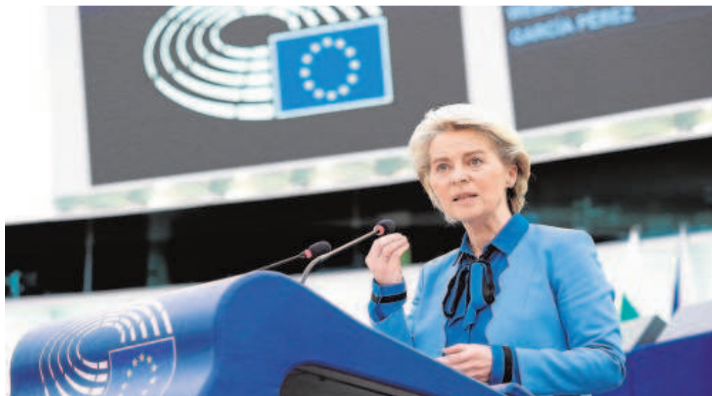
La presidenta de la Comisión, Ursula von der Leyen

El respeto de los principios democráticos es uno de los principales criterios exigidos para entrar en la UE y el Tribunal recuerda precisamente que «el respeto de estos valores no puede reducirse a una obligación que un Estado candidato debe cumplir para acceder a la Unión Europea y de la que puede prescindir después de la adhesión».