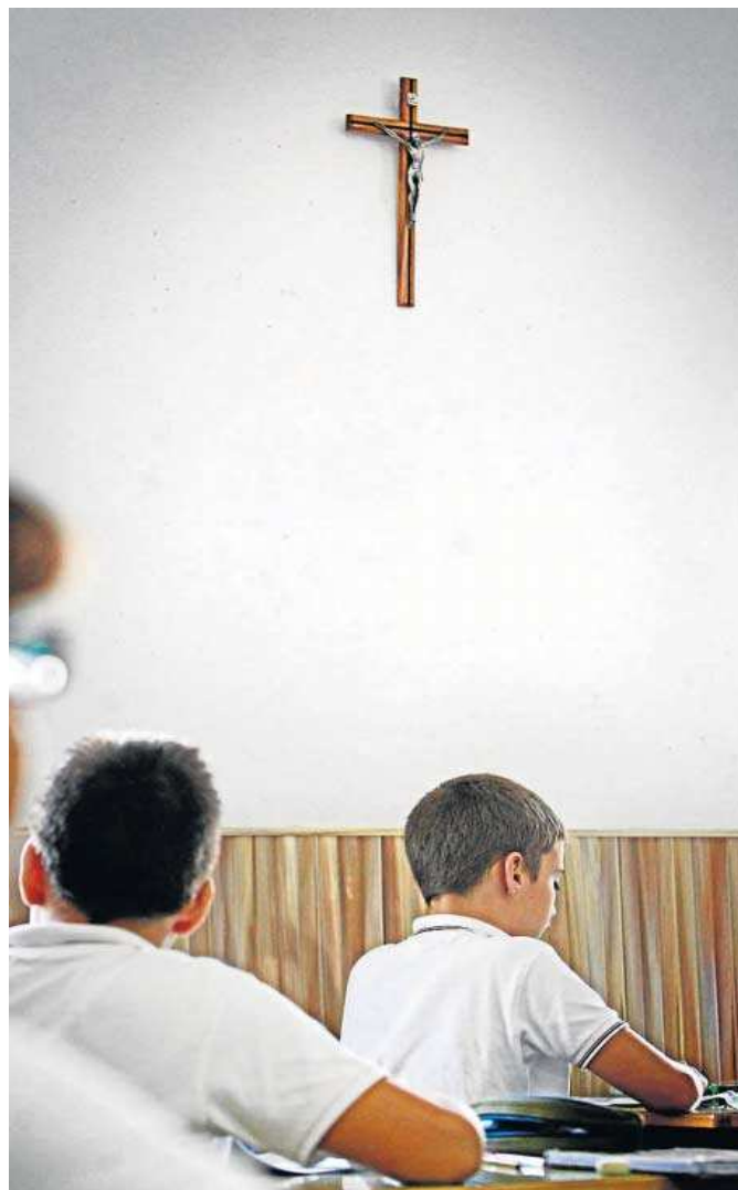
Alumnos de Primaria durante una clase de Religión.

rante las legislaturas socialistas al frente de la Junta ni parece que vaya a ocurrir con la del PP y Cs. Una circunstancia que ha vuelto a evidenciarse con el acuerdo sobre el convenio colectivo en los profesores de Religión, que, según anunció ayer la Consejería de Educación, mejorará sus condiciones laborales".