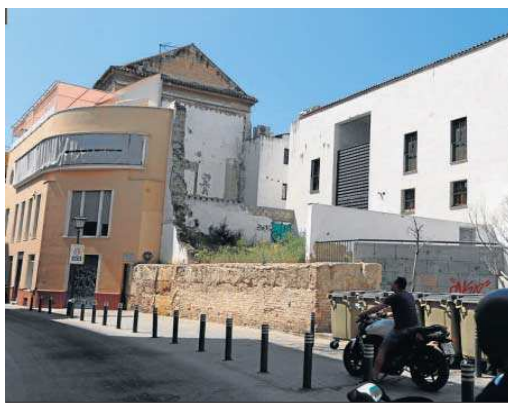
La muralla de Goles y el espacio que serían reurbanizados.