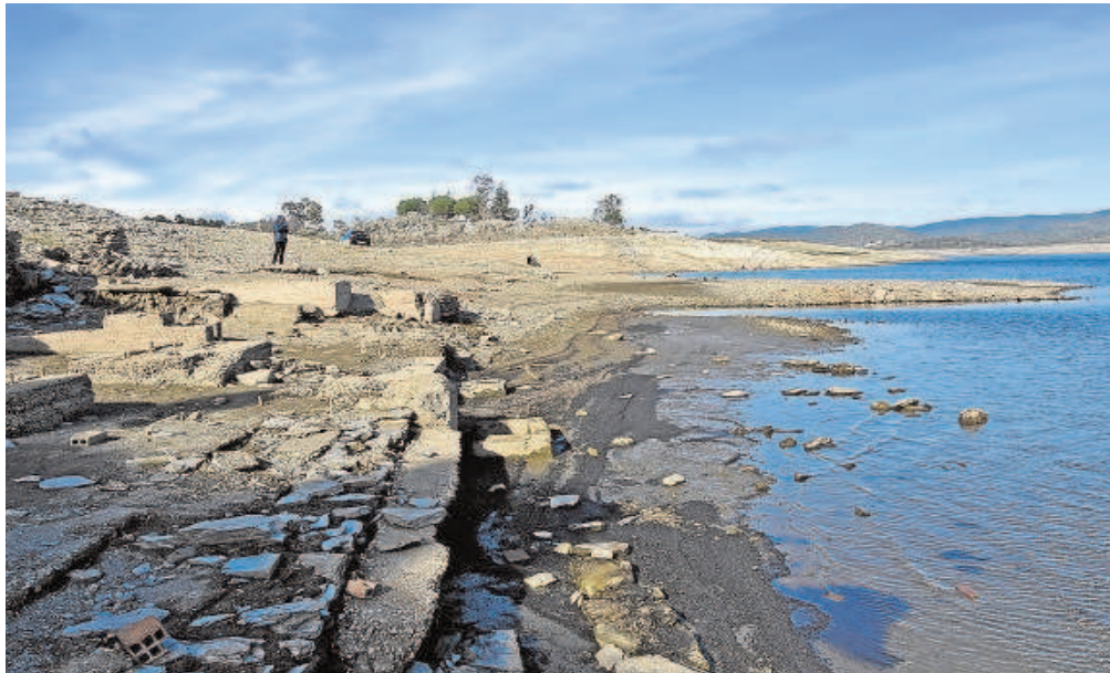
El pantano de Aracena ha bajado su volumen de agua del 52,56 % al 37,30% en el último año // BRAZO MENA

Aguas de Sevilla, S.A. (Emasesa). Estos seis pantanos tienen una capacidad total de 641,16 hectómetros cúbicos, de los que en la actualidad sólo quedan 331,53 hm 3 .