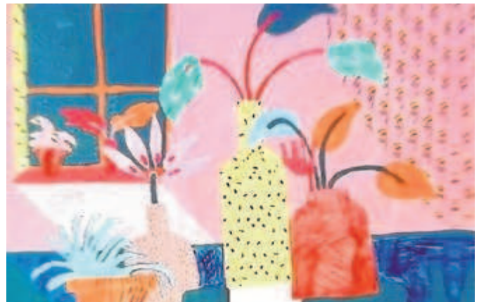
Uno de los cuadros que se exponen en la muestra //ABC

En el arte geométrico resulta medular la síntesis de la naturaleza de los seres respecto de las formas utilizadas, la estructura y el color.