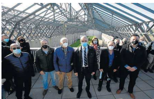
El alcalde posa con los representantes municipales y vecinales.

inicio otra fase que consistió en la reparación de los soportes metálicos de la cubierta para el posterior anclaje de los paneles solares fotovoltaicos. Y ya en noviembre de 2020, ya en plena pandemia, se iniciaron las obras en sí de lo que será el nuevo centro de emprendimiento Sevilla Futura. En verano ya se había culminando la instalación y adecuación de los módulos de madera de pino procedente del País Vasco en la nave oeste, una vez realizada la limpieza y consolidación de la estructura. Y en estos momentos sólo faltan remates que afectan a elementos de revestimiento e iluminación, así como