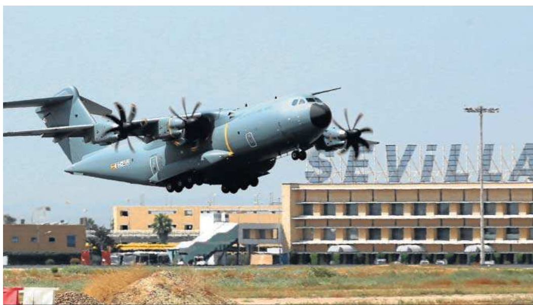
Un Airbus A400M despegando en Sevilla, donde la multinacional ensambla el modelo militar.

● Faury destaca el hito de la reanudación de las exportaciones del A400M, que ensambla en Sevilla, al hacer balance del año pasado