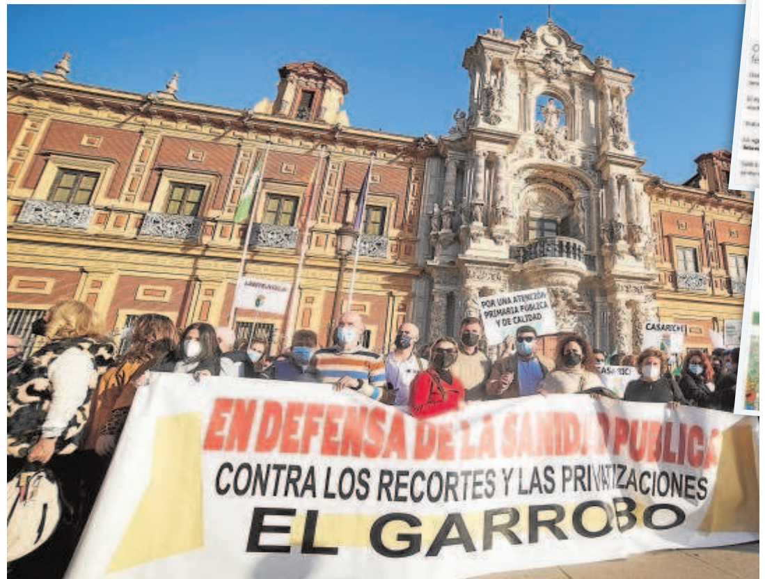
Protesta de los alcaldes de la provincia Sevilla por la Sanidad pública ante San Telmo

En Huelva, el Ayuntamiento de Aracena ha hecho saber a los vecinos la disponibilidad de autobuses para ir a la manifestación de la capital onubense, resaltando que se fletarán «tantos como sean necesarios». En este caso