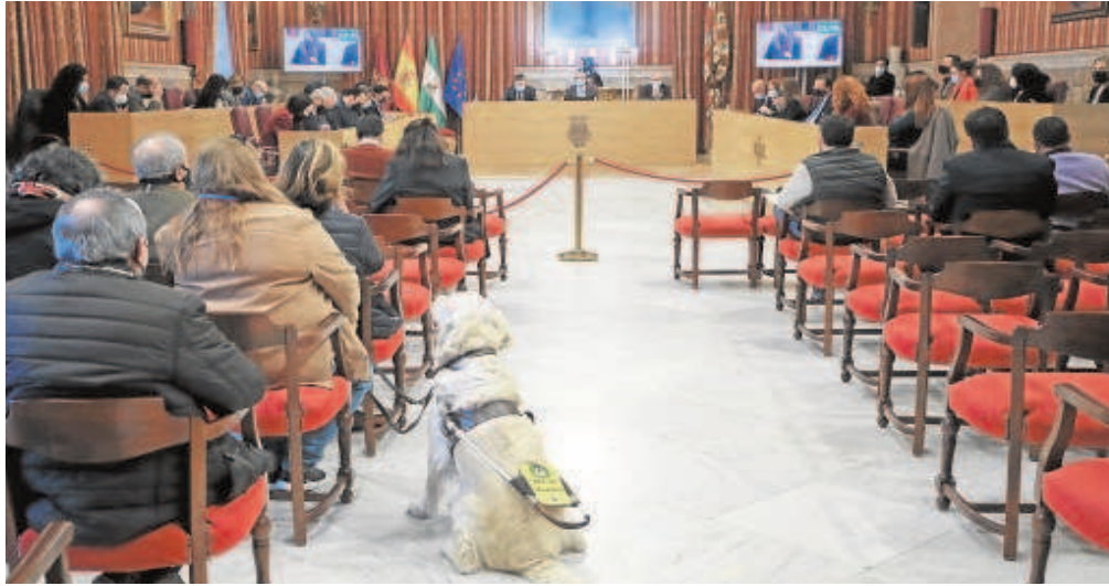
Panorámica de la sesión plenaria de ayer en el Salón Colón del Ayuntamiento de Sevilla