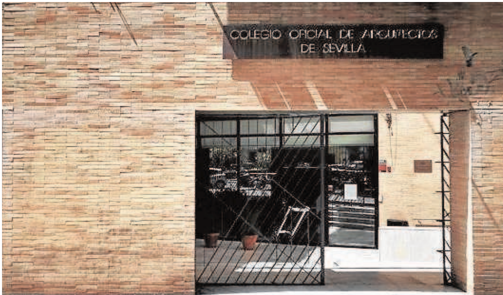
Sede del Colegio de Arquitectos de Sevilla, en la plaza del Cristo de Burgos