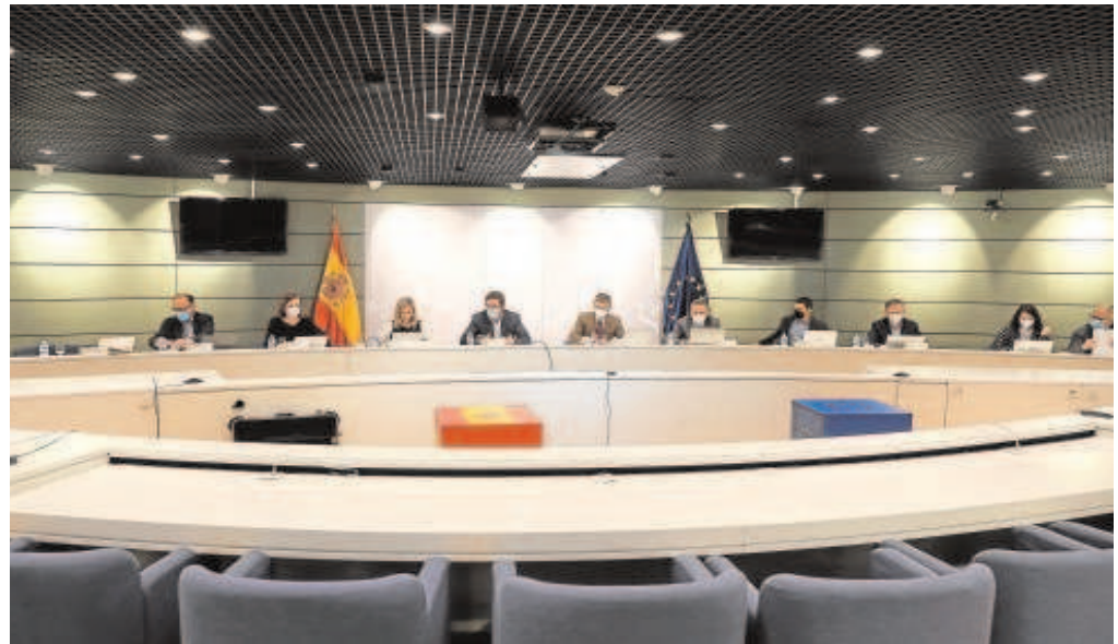
Reunión ayer del Gobierno con los agentes sociales en las negociaciones de los ERTE // ABC

Del nuevo escenario laboral que se abre a partir de marzo estarán muy pendientes los grandes grupos de agencias de viajes (Viajes El Corte Inglés, Ávoris y Nautalia), que están negociando