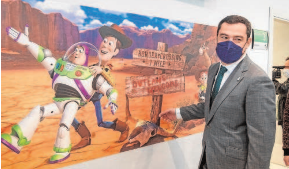
El presidente Juanma Moreno, ayer durante la inauguración de un centro de salud en El Puerto de Santa María