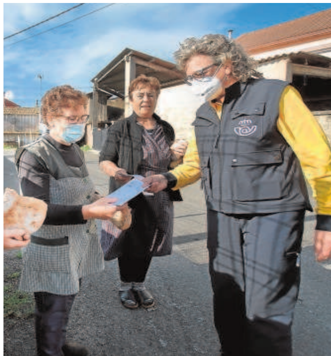
Un cartero rural en un pueblo de La Coruña

Fuentes bancarias confirman el trato con dichas dos entidades y amplían el abanico a todo el sector con presencia minorista en España. Correos no se ha parado solo en estos dos bancos, aunque sean su prioridad, sino que está a la caza de pactos con cuantos más puedan. En la empresa controlada por la SEPI defienden su estrategia como una manera de luchar contra la exclusión, aunque a ello también hay que sumarle que Correos necesita rentabilizar su red de puntos de atención al ciudadano, que suma más de 4.600 localizaciones entre oficinas y centros de atención rurales. Rentabilizar su red porque este tipo de acuerdos no son gratuitos para la banca sino que se les cobra por ello. Son una forma de aumentar los ingresos ante la caída del negocio postal tradicional de la empresa. Es más, Correos cada vez se parece menos a una empresa de envío de cartas y pasa más a ser un supermercado de servicios.