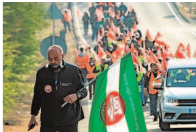
Manifestación de trabajadores de SBS contra los despidos

Cuando el 12 de julio de 2019 el Consejo de Ministros aprobó el contrato Dragón, que supondrá un gasto de 2.100 millones de euros, se emitió una nota pública en la que decía que consideraba a Santa Bárbara Sistemas como la contratista principal junto a Indra y Sapa, como subcontratistas de primer nivel. En ese comunicado se dijo que el contrato tendría un impacto relevante en la economía de Alcalá de Guadaíra, calculándose que la producción del nuevo vehículo blindado generaría unos 650 puestos de trabajo directos, y otros 1.000 indirectos, en todas las plantas con participación en el programa.