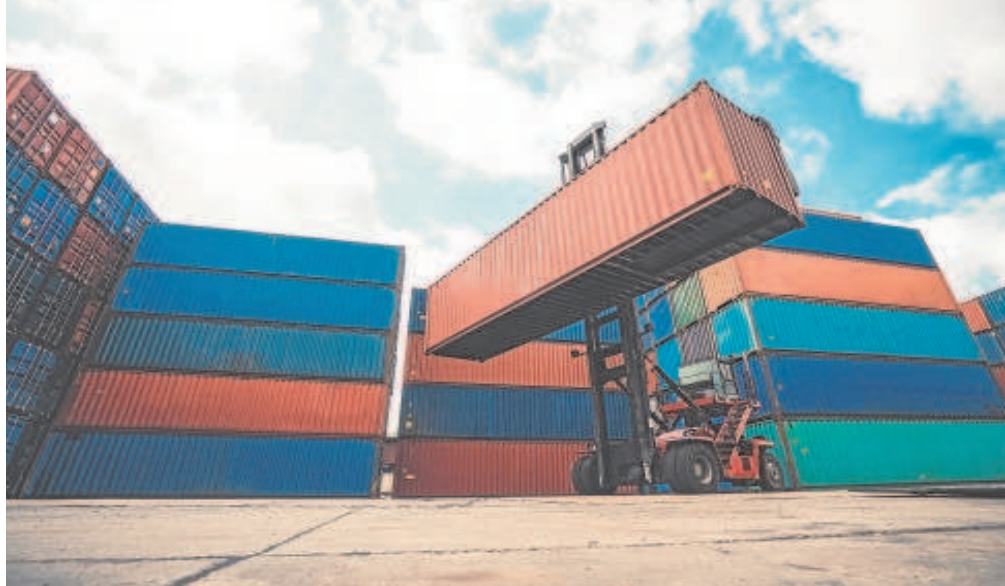
Contenedores en el Puerto de Algeciras, el principal de España por volumen de mercancías transportadas