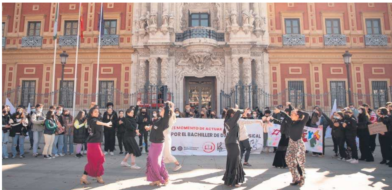
Alumnos de Música y Danza protestan delante de San Telmo, acompañados por sus familiares.