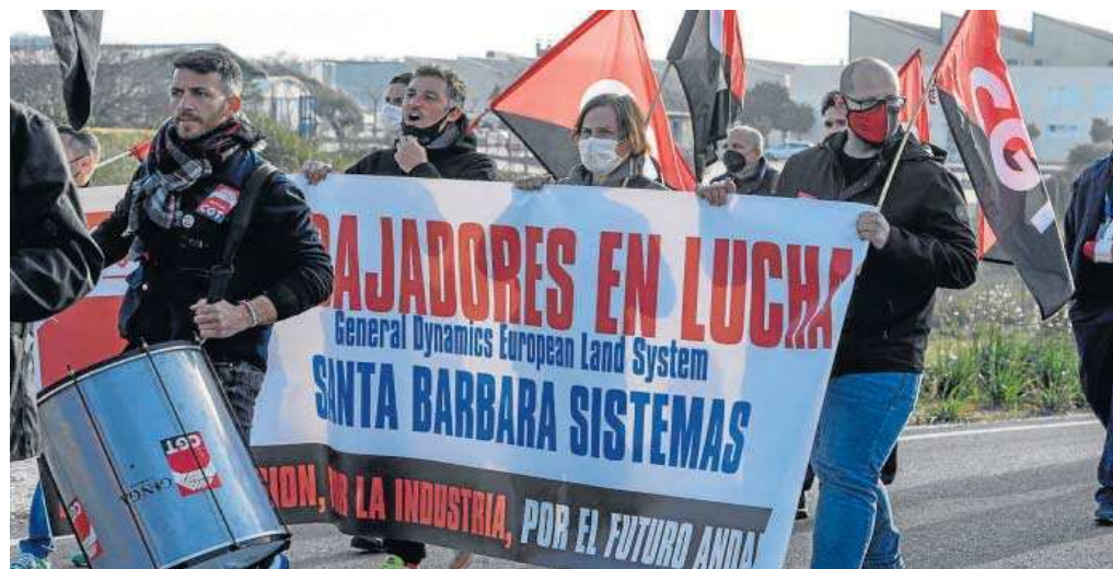
Protesta de los trabajadores de Santa Bárbara Sistemas, el pasado viernes en Alcalá de Guadaíra.

El comité se felicitó por esta decisión, que rectifica “una injusta medida aplicada unilateralmente,