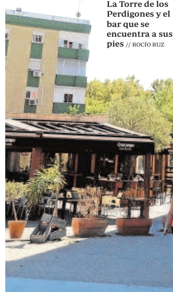
La Torre de los Perdigones y el bar que se encuentra a sus pies

En todo ese tiempo, la Gerencia de Urbanismo no fue capaz o dejó pasar la oportunidad de revocar la licencia tanto del bar como del mirador de la Torre de los Perdigones. Esta información adelantada por 'Viva Sevilla' hace ahora cuatro años, añadía que en 2016, la UTE presentó una carta de pago por valor de 124.232 euros, con un desglose de los cánones que estaban pendientes de pago desde que comenzó la explotación del espacio, así