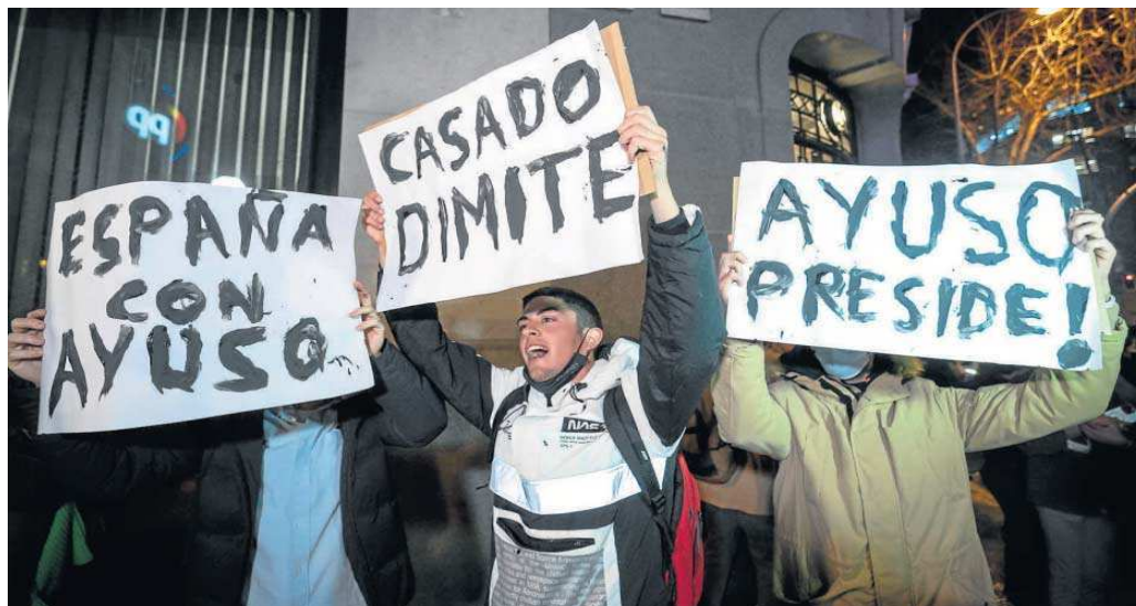
Manifestación espontánea junto a la sede del PP en Génova en apoyo de Ayuso.

Varios ministros, como Félix Bolaños, María Jesús Montero y Raquel Sánchez aprovecharon para hacer sangre, pero el presidente del Gobierno, Pedro Sánchez, evitó el tema.