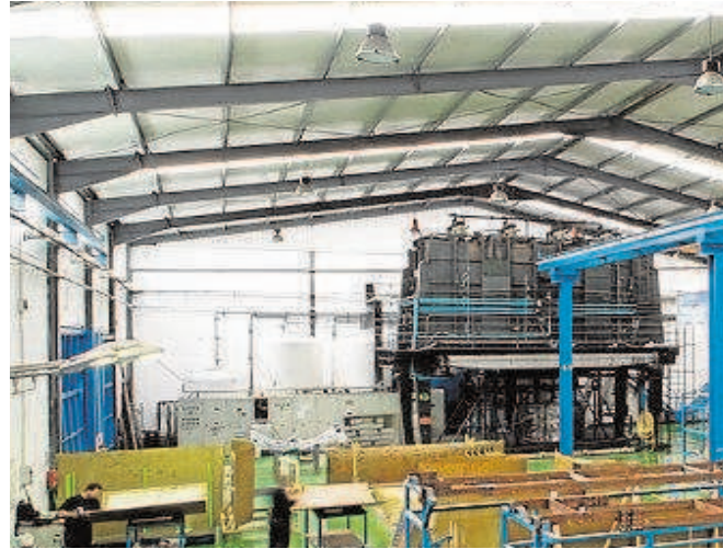
Instalaciones de Aercal en Santiponce (Sevilla)