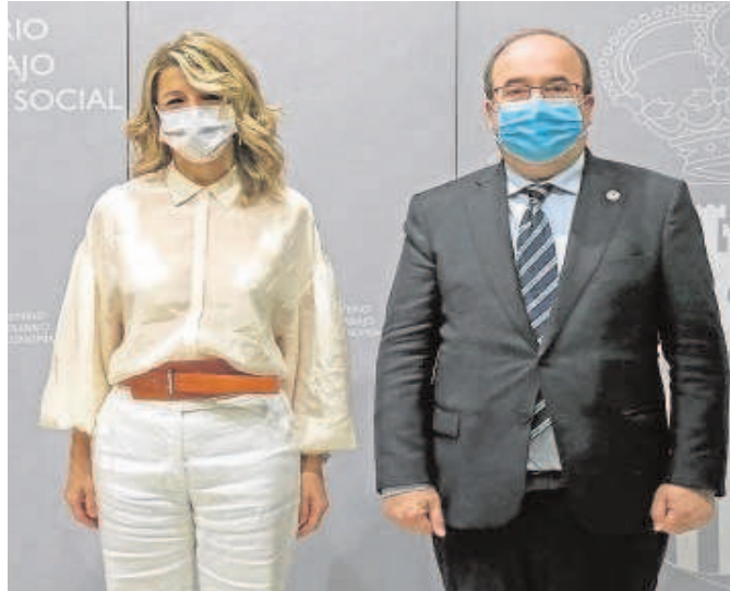
Yolanda Díaz y Miquel Iceta, el pasado mes de diciembre

Una veintena de asociaciones que representan a sectores como la música, el teatro, el cine o el circo ya han transmitido al Gobierno su inquietud por un problema «de una gravedad extrema». La desaparición de la obra y servicio deja al sector sin su modelo de contrato principal y la penalización prevista para los contratos inferiores a los 30 días encarecerá sensiblemente los costes. Este recargo ronda los 25 euros al día, lo que triplicaría el coste diario que existía hasta ahora. Al no contemplarse la obra y servicio, además, se impone la obligación de volver fijar los contratos de un mismo empleador que superan los 90 días. Es decir, si un actor se vincula a una producción por 92 días o un técnico acumula cuatro meses por distintos montajes en fechas separadas, la ley estipula que esos contratos deben volverse fijos. «Esto demuestra que no se tienen en cuenta las especificidades del colectivo