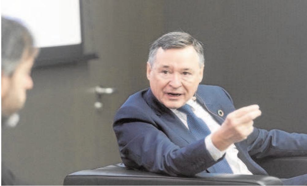
Ángel Simón, presidente de Agbar, en el foro de la Asociación Española de Directivos en CaixaForum