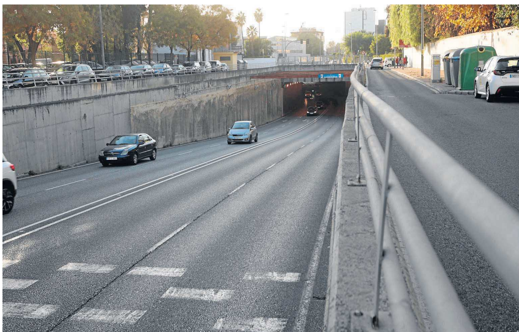
Varios coches circulan por el mismo sentido en el túnel de Cardenal Bueno Monreal.

Las obras para la construcción de los soterramientos de Bueno Monreal y Tamarguillo costaron inicialmente 5,9 y 5,8 millones de euros respectivamente. Sin embargo, debido a