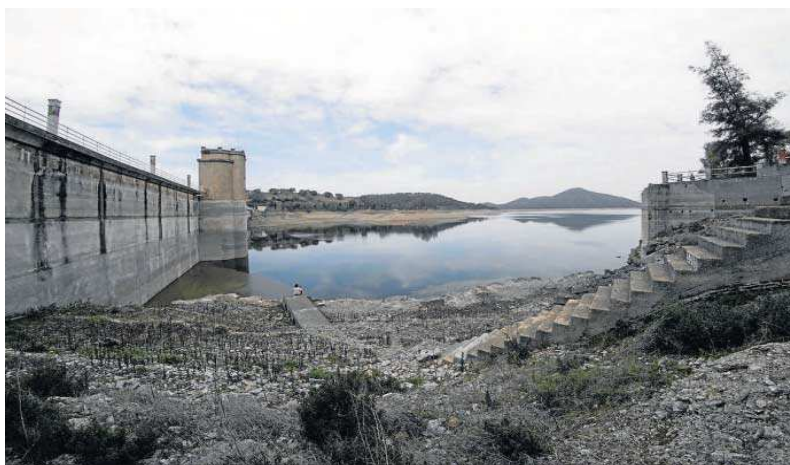
La falta de agua en el Pintado es más que evidente, como muestra la foto tomada este mes.

A la petición de Feragua, el presidente de la Confederación Hidrográfica del Guadalquivir (CHG), Joaquín Páez, respondió que la solución para afrontar la sequía actual no pasa por la construcción de nuevos embalses ni por la reducción del caudal eco-