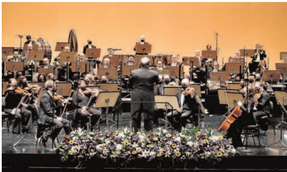
El incremento salarial de los trabajadores de Orquesta de Sevilla S. A. es el mayor de los últimos años // J.M. SERRANO

En 2019 se produjo un incremento del 1% del salario de los trabajadores, que se hizo extensivo a 2018. Ese mismo año, el Consejo de Administración de la Sinfónica «devolvió» la paga extraordinaria de Navidad que estaba pendiente por abonar del año 2012. En 2021 se produjo una subida del 0.9%. Ahora el incremento, al ser del 2%, es el máximo legal que se puede conceder a una empresa del sector público y el mayor que han obtenido los trabajadores de Orquesta de Sevilla S.A. en los últimos años.