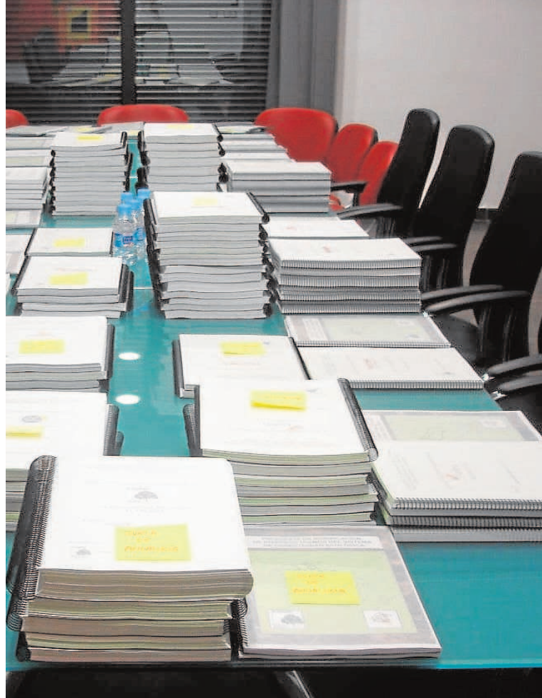
Ambiente de la Junta de Andalucía ni contestó