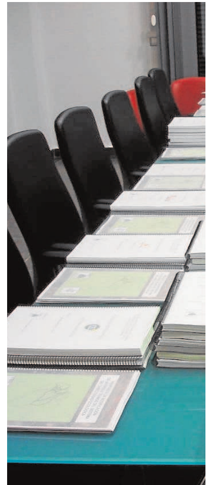
Los más de 4.000 expedientes que Medio

Para los regantes, Corehu, no les consta que la Confederación Hidro-