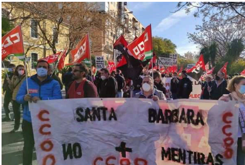
Manifestación de la plantilla de Santa Bárbara. CCOO SEVILLA

La dirección de Santa Bárbara Sistemas no garantiza el empleo a corto plazo en los distintos centros de trabajo y condiciona el futuro en el medio a la adjudicación de grandes contratos. Es una de las conclusiones a las que ha llegado el comité intercentros de la compañía tras la reunión que representantes de este órgano han mantenido este jueves con la dirección en Madrid.