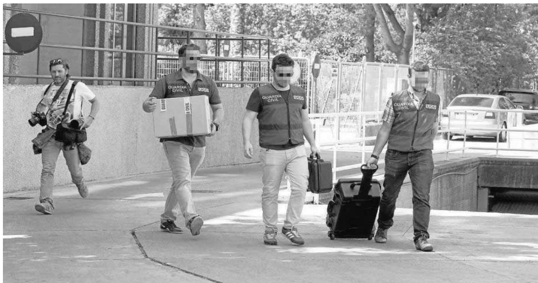
Agentes de la Guardia Civil salen de la sede regional de UGT con documentación.