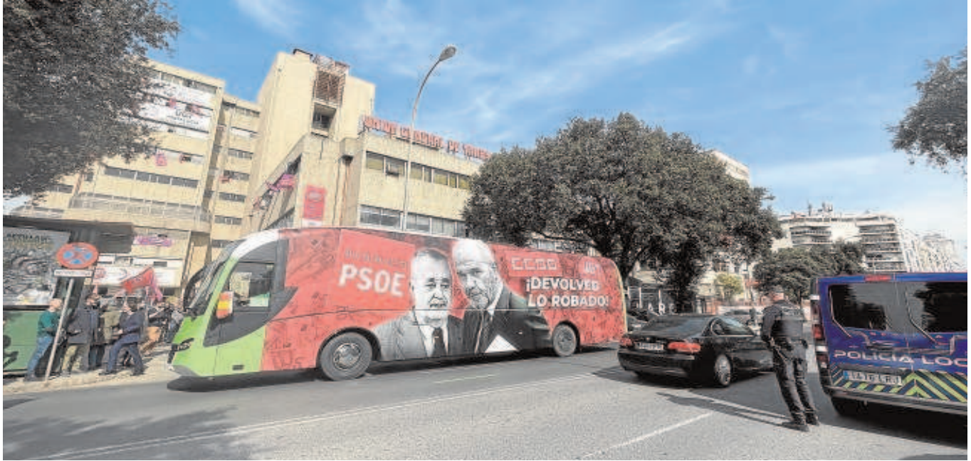
El autobús de Vox aparcado ayer ante la sede regional del sindicato UGT en Sevilla, donde fue recibido a los sones de la Internacional