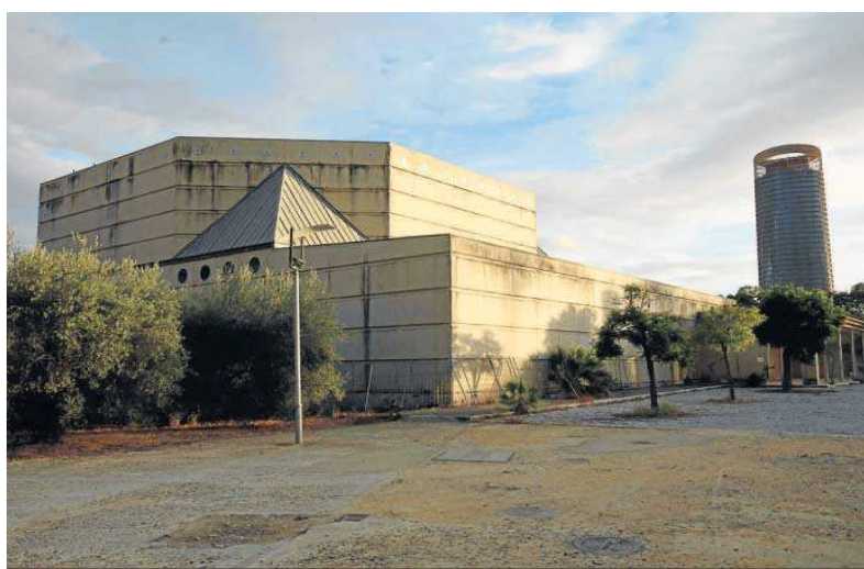
El Pabellón del siglo XV de la Cartuja, legado de la Expo 92.

Las obras de rehabilitación y adecuación del antiguo Pabellón del Siglo XV para su uso como al-