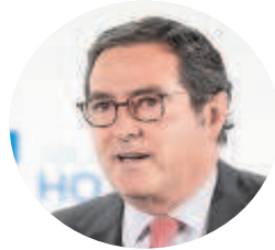
Antonio Garamendi Presidente de la CEOE

« La guerra en Ucrania puede agravar el problema que ya teníamos con la energía. Nadie va a poder parar la subida de precios »