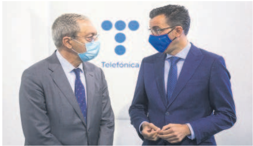
De izda. a dcha., el consejero de Transformación Económica y el director del Territorio Sur de Telefónica presentando la iniciativa

El alumnado seleccionado recibirá formación impartida por expertos sobre tecnologías habilitadoras como Blockchain, Inteligencia Artificial o Big Data, y sesiones especializadas en el ámbito empresarial sobre temas jurídicos, legales o de finanzas. Además, aprenderá la metodología de aceleración que le ayudará a desarrollar su idea de negocio a través de estudios de