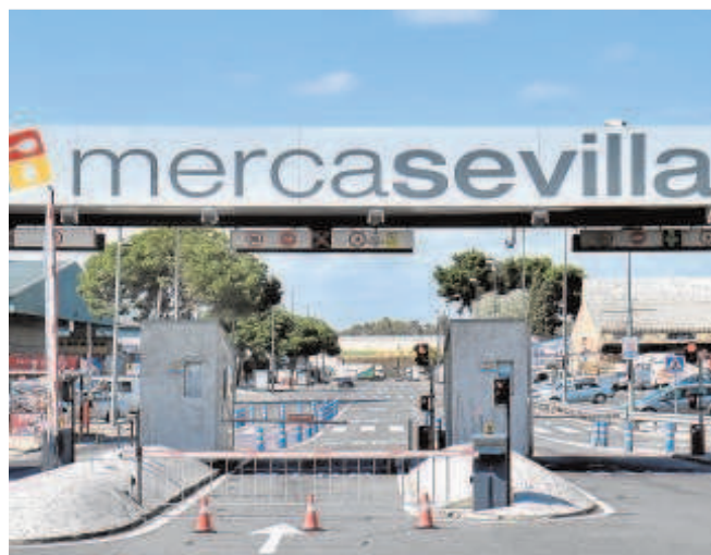
Acceso principal a las instalaciones de Mercasevilla

Esa reserva, registrada contablemente como gasto excepcional por 2.815.000 euros, es la que explica que la sociedad declarara un resultado negativo de 2,24 millones de euros frente al positivo de 527.569 euros de 2020. Ese «criterio de prudencia contable» llevó a la empresa a provisionar la totalidad de lo reclamado por el juzgado.