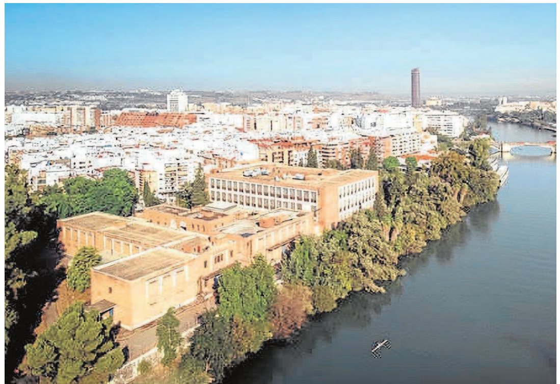
Panorámica de la vieja fábrica de tabacos de Altadis, junto al Guadalquivir, que desde ahora tiene consideración como suelo

El proyecto de KKH Property Investors para la vieja instalación fabril apuesta por un espacio principal público en la zona norte del complejo en torno a una gran plaza. El eje central será el edificio del 'Cubo', el inmueble principal, que conservará su volumetría y que se adecuará para su uso como equipamiento destinado a usos culturales y vinculados a la educación, ciencia, innovación