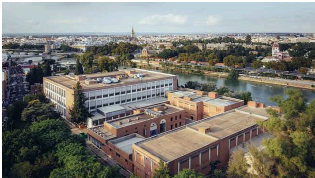
Vista aérea del estado actual de los terrenos de Altadis.

Inicio de obras antes de 2023 . Esa es la previsión que maneja el equipo de Antonio Muñoz para arrancar la transformación de la antigua fábrica de Altadis siempre que la Junta de Andalucía cumpla su compromiso y declare el proyecto como de interés estratégico, lo que aceleraría su tramitación. El gobierno socialista sostiene que la inversión de 200 millones en el inmueble enclavado en Los Remedios será un impulso para Sevilla equiparable al que tuvieron el Museo Guggenheim para Bilbao y la Ciudad de las Artes para Valencia.