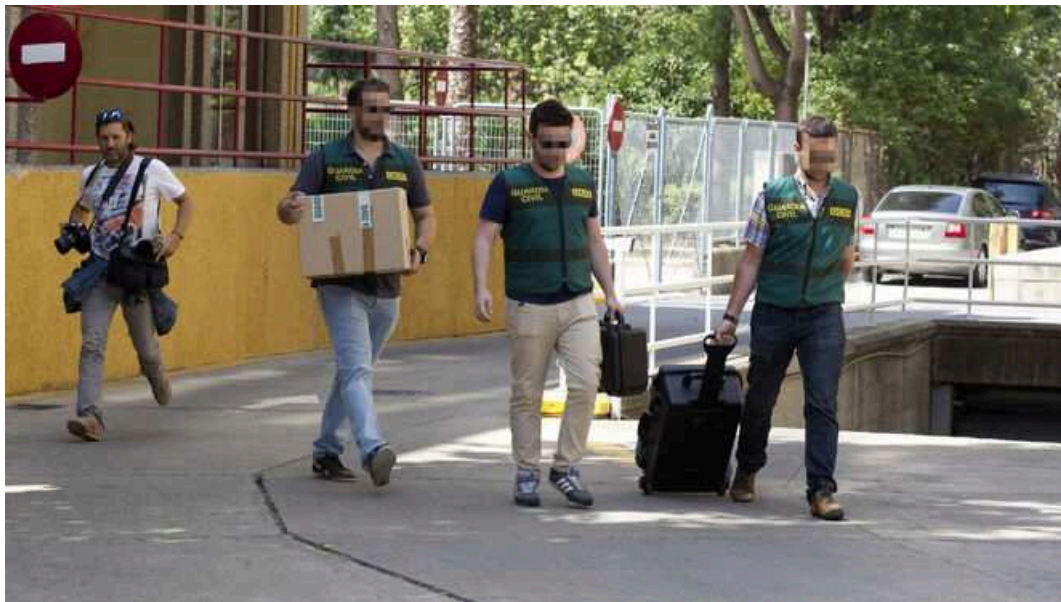
La Guardia Civil en un registro de una fundación de UGT-A por el caso de las facturas falsas.

La Junta de Andalucía ha perdido en el Tribunal Supremo un recurso para el reintegro de dos subvenciones por importe total de 895.000 euros concedidas al sindicato UGT-A, cuya devolución inició la Administración andaluza pero que fueron rechazadas por la Justicia al entender que había prescrito el plazo para poder reclamar dichas cantidades.