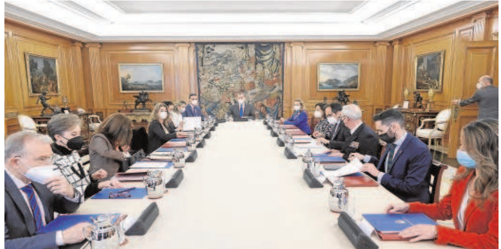
El Rey presidió ayer el Consejo de Seguridad Nacional en el Palacio de la Zarzuela