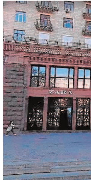
APUESTA POR EL TEXTIL

El mayor problema para España no son las inversiones ucranianas en España, sino las importaciones. No porque sean muchas, sino porque están concentradas la mayoría de ellas en los cereales. En 2019 las importaciones de aceite de girasol, maíz y, en menor medida, trigo, alcanzaron los 1.000 millones de euros. Asaja avisó ayer de que España importa anualmente casi el 30% del maíz que necesita de Ucrania.