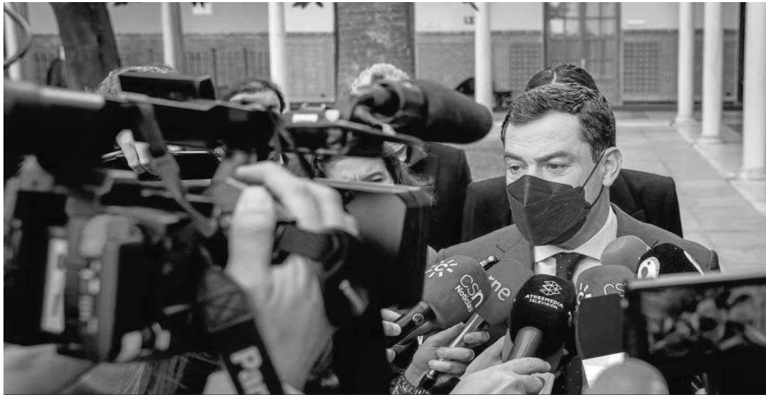
El presidente de la Junta, Juanma Moreno, atiende a la prensa el pasado miércoles en el Parlamento andaluz.