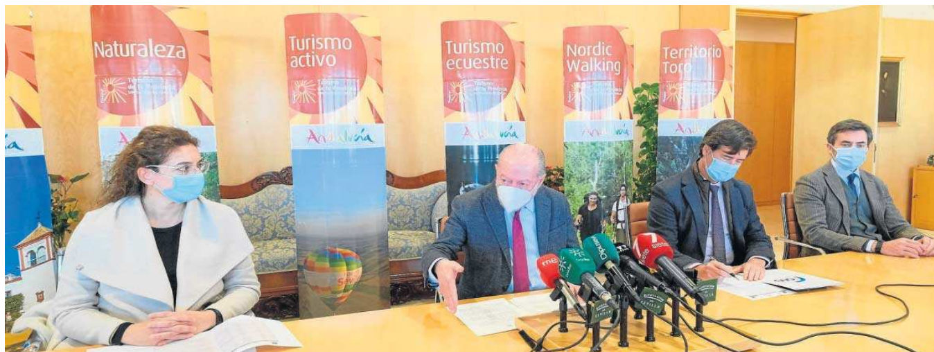
El presidente de la Diputación, Fernando Rodríguez Villalobos, en una comparecencia sobre coyuntura turística.

Mayor actividad. Los eventos y las visitas de profesionales turísticos crecieron más de un 22 % en 2021, así como los municipios visitados