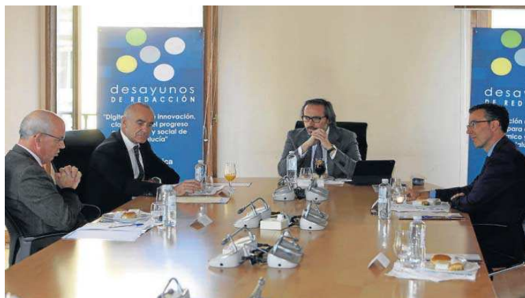
La sede de Telefónica en la Plaza Nueva de Sevilla albergó el desayuno de redacción del Grupo Joly.

“Aumentar la digitalización de una pyme produce un aumento de la productividad de entre el 15 y el 25%. Teniendo en cuenta que éstas son el 98% del tejido productivo en España, hablamos de un crecimiento de la produc-