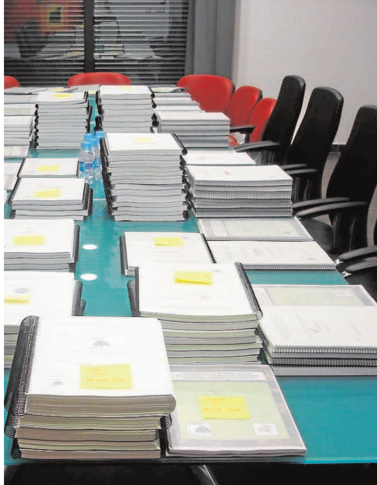
Ambiente de la Junta de Andalucía ni contestó