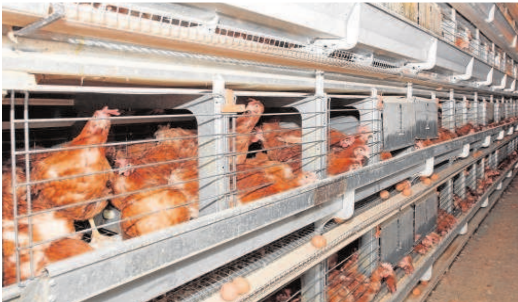
Decenas de gallinas ponedoras en una granja avícola en una imagen de archivo

La oposición del SAS celebra el pasado domingo derivó en denuncias de los aspirantes y del Sindicato Nacional de Técnicos Superiores Sanitarios (Tecnos) por «graves errores». El desorden provocado, según los denunciantes, hizo que algunos pudieran consultar las respuestas en el móvil. Según explicó ayer el consejero de Salud, Jesús Aguirre, el problema estuvo en una «errata» en los exámenes que, al ser detectada, se corrigió cambiando las preguntas. «Es un hecho singular que se abordó de forma eficaz», zanjó Aguirre.