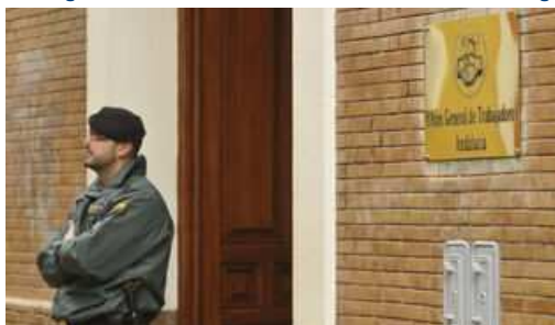
Un registro de la sede de UGT-A durante la investigación de presuntas irregularidades de UGT-A.

En la primera de las sentencias, el Supremo confirma la decisión del Tribunal Superior de Justicia de Andalucía (TSJA) que en mayo de 2020 falló a favor de UGT-A y declaró la prescripción del plazo para el reintegro de una ayuda de 700.000 euros ; mientras que en la