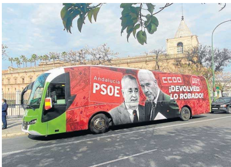
El autobús fletado por Vox, ayer junto al Parlamento andaluz.

Vox también es muy crítico con la gestión que ha hecho el Gobierno andaluz con el sector instrumental, "la tela de araña socialista" que, según Vox, sigue funcionando. No en vano motivaron su rechazo a la ley del Plan