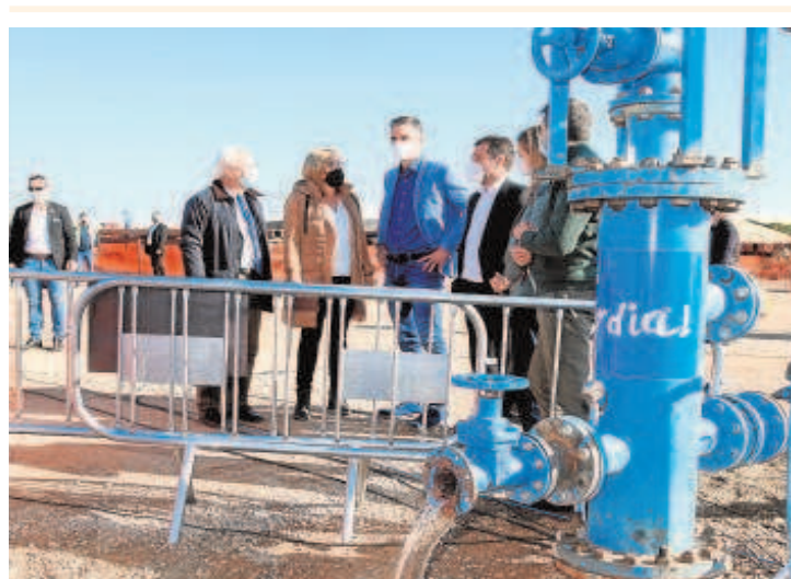
El presidente del Gobierno, Pedro Sánchez, en una empresa en Níjar

abordar este asunto ante la «demagogia» con la que se está planteando el debate. «No ha habido un gobierno que haya invertido más en Doñana que el que presido» dijo Moreno, que recordó que el propio PSOE está dividido ante el debate, y aseguró que no hay nadie con más interés que él en la conservación de Doñana.