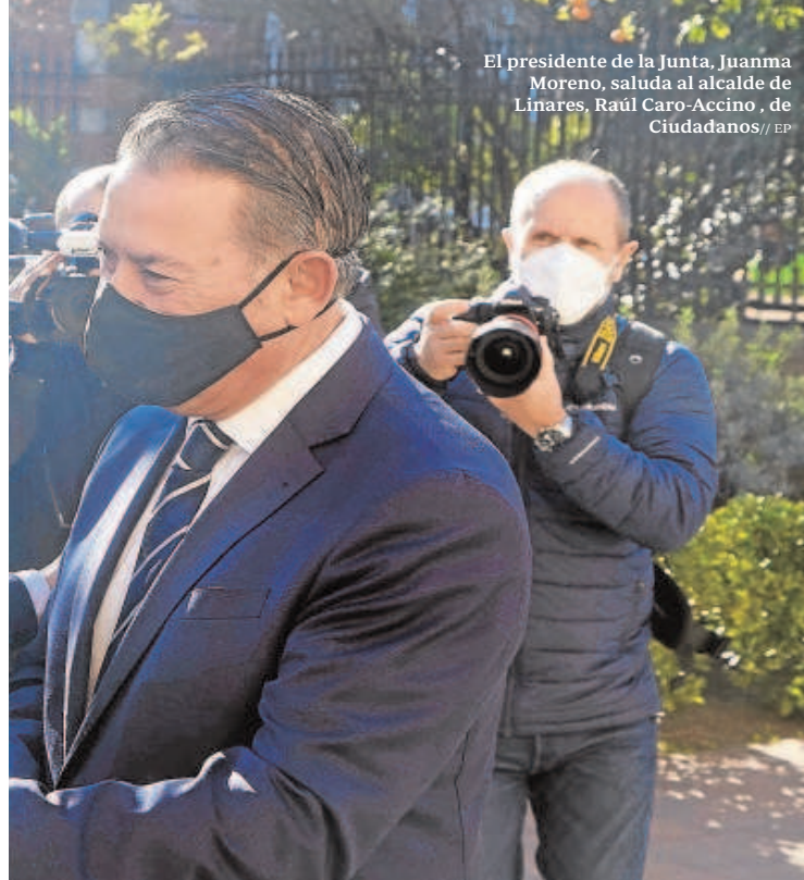
El presidente de la Junta, Juanma Moreno, saluda al alcalde de Linares, Raúl Caro-Accino, de Ciudadanos

perderá un minuto, porque el acuerdo se alcanzará a través del diálogo con todas las partes, como el propio Gobierno de España o los colectivos ecologistas y respetará siempre la legalidad.