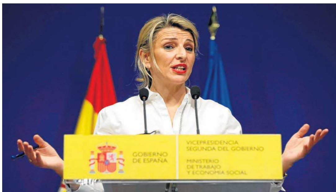
Yolanda Díaz, en su comparecencia ayer para informar sobre la negociación sobre el salario mínimo.

Díaz señaló a los periodistas que subir el salario mínimo interprofesional, una medida que beneficia a dos millones de trabajadores, es “una de las mejores herramientas para avanzar en la