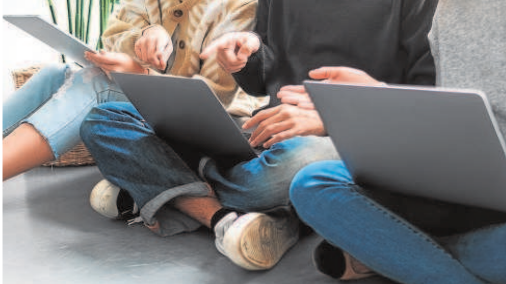
Un grupo de jóvenes con sus equipos portátiles