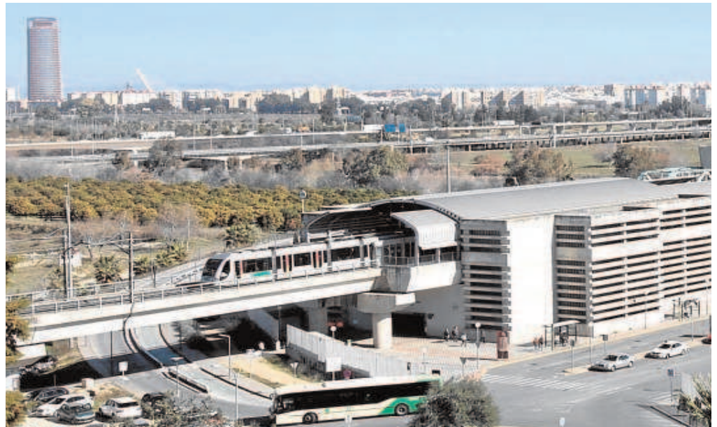
Estación de San Juan Bajo de la línea 1 de metro, la única que está construida

La Junta busca, además, otras vías de financiación mediante el Fondo Social Europeo (Fondos Feder) que inicia un nuevo marco. Ya lo han presentado como uno de los proyectos estratégicos que influye, además, en la movilidad sostenible y en las medidas contra el cambio climático. Y en última instancia, dispone de un crédito del Banco Europeo de Inversión (BEI) para estos fines.