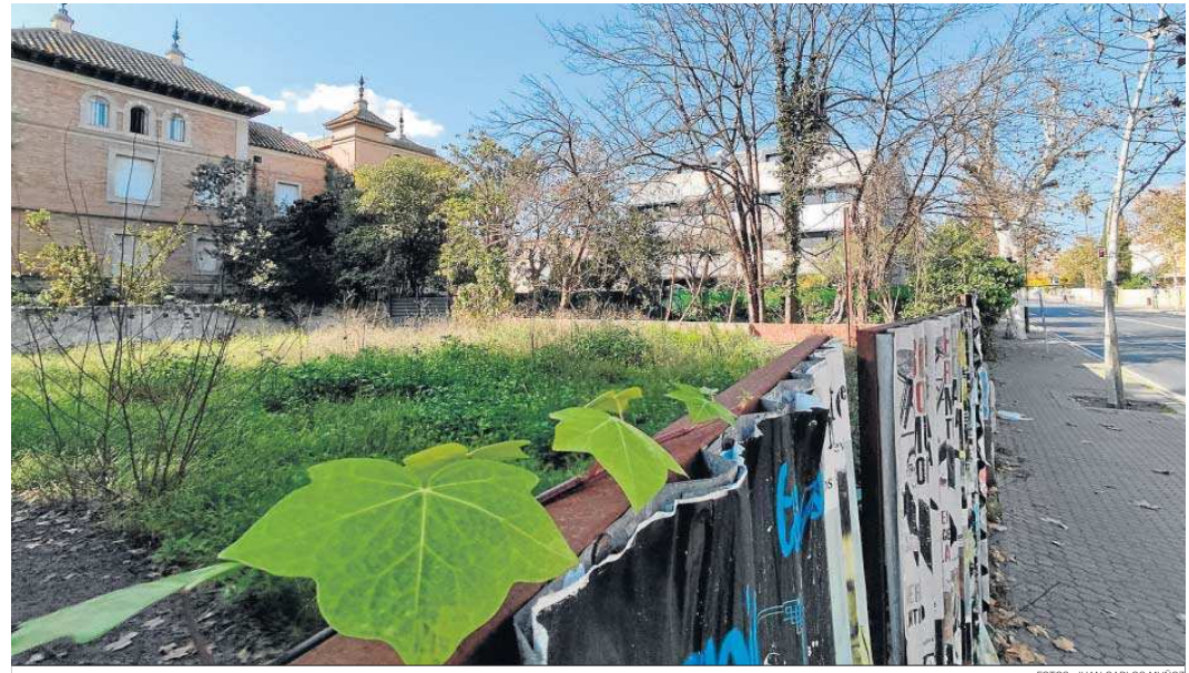
Estado actual de la parcela enclavada en el número 58 de la Avenida Manuel Siurot.

La licencia se otorga a la empresa Urania Enterprises S. L. a condición de que el acceso principal al edificio deberá ser accesible para personas con movilidad reducida, por lo que deberá colocarse un elevador homologado para salvar los escalones de la entrada con unas dimensiones mínimas de cabina de 1 por 1,25 metros. La finca se encuentra inscrita en el registro municipal de solares y está sin edificar. La edificabilidad teórica máxima de la parcela para tres plantas de altura permitidas es de 599,7 metros cuadrados. Desde Urbanismo apuntan que el inmueble no excede la edificabilidad aceptada por la calificación unifamiliar aislada de la parcela.