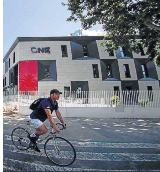
La residencia de estudiantes de la parcela que ocupaba el chái de la Botella.

La fachada de la futura residencia universitaria se dispondrá hacia la Avenida Manuel Siurot. Se trata de un edificio integrado en una manzana de grandes dimensiones donde principalmente se desarrollan equipamientos y construcciones de tipo dotacional de agentes privados. El edificio se integra perfectamente en la zona, de manera que su forma y volumen, así como su materialidad, son acordes con el entorno.