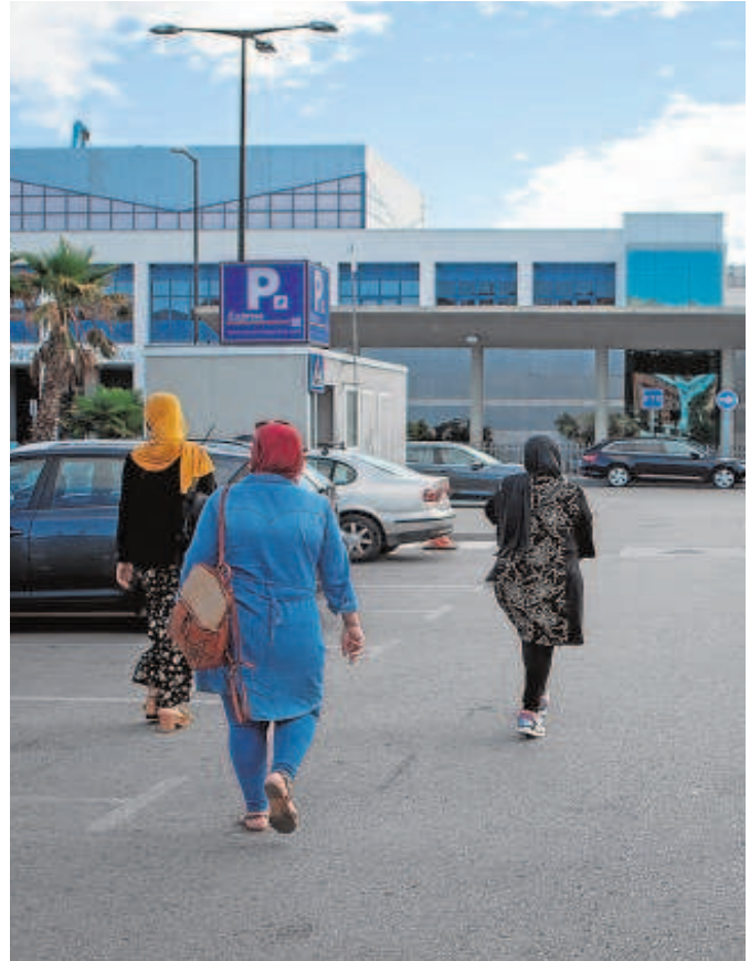
Varias mujeres, en el puerto de Algeciras para embarcar a Ceuta

Aunque la asociación no ha cifrado las pérdidas acumuladas, su presidente estima que cada una de las 13 agencias del puerto de Algeciras realizaba unas ventas de más de dos millones de euros cada año hasta que todo quedó paralizado.