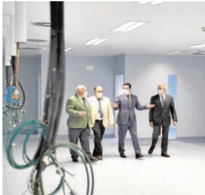
Juanma Moreno visita el Hospital de la Cartuja de Sevilla

El nuevo espacio público andaluz, dependiente del Hospital Universitario Virgen Macarena (HUVVM), que verá así incrementada su capacidad, albergará aquellos servicios relacionados con la asistencia de la infección por Covid o aquellos espacios asistenciales que permitan una expansión del área hospitalaria. Más adelante, cuando la evolución de la pandemia lo permita, el uso del centro se destinará al que está concebido inicialmente: ser el nuevo Hospital de la Mujer adscrito al Hospital Universitario Virgen Macarena.