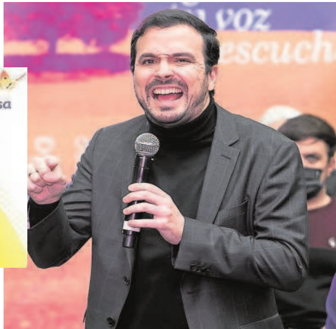
Alberto Garzón, ministro de Consumo

fecha se han sacado ya más de 500 procedimientos de licitación y ayudas/subvenciones. Estas convocatorias se encuentran en distintas fases: abiertas, cerradas o previstas para abrirse «próximamente».