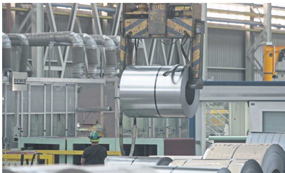
Un trabajador de Acerinox de la planta de Los Barrios vigila el movimiento de una bobina de acero inoxidable.

La compañía confirma que el resto de sus fábricas en otros países podrá hacer frente a los movimientos especulativos del precio del níquel, por lo que no prevé más cierres. Sí que ha paralizado la actividad comercial