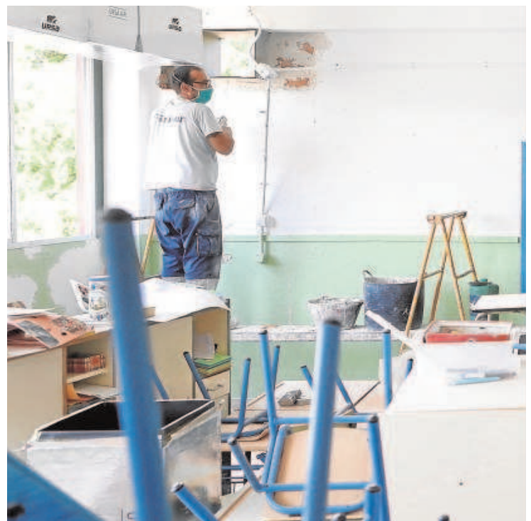
Obras de instalación de aparatos de aire acondicionado en el colegio Fernán Pérez de