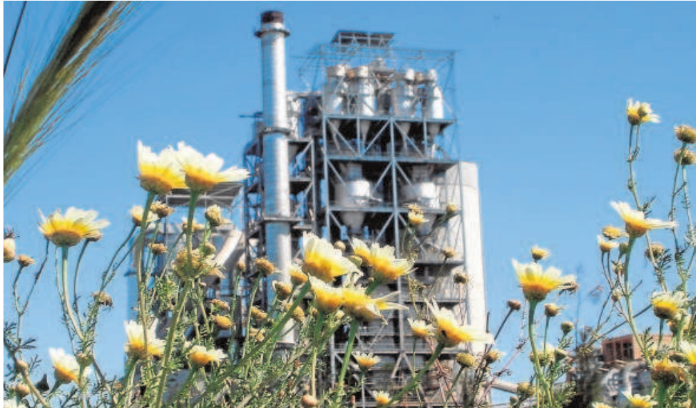
Planta de Cementos Portland Valderrivas en Alcalá de Guadaíra