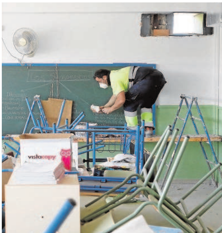
Oliva de Córdoba capital

cación explicó que al comienzo de la legislatura existía un volumen «muy importante» de obras pendientes de ejecutar, entre las cuales en estos tres años se han priorizado aquellas que respondieran a necesidades de escolarización y que permitieran la eliminación de prefabricadas o evitaran su instalación en el futuro. Asimismo, se han rescatado proyectos históricos que llevaban años esperando a ser ejecutados, como los conservatorios de Almería y Jaén. En los planes de infraestructuras aprobados desde 2019 se ha mantenido esta prioridad, incluyendo actuaciones para crear puestos escolares en las zonas de mayor demanda.