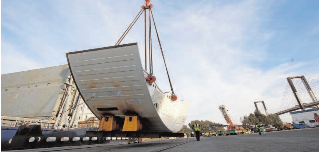
La tuneladora para la SE-40, el día en que llegó al puerto de Sevilla por piezas