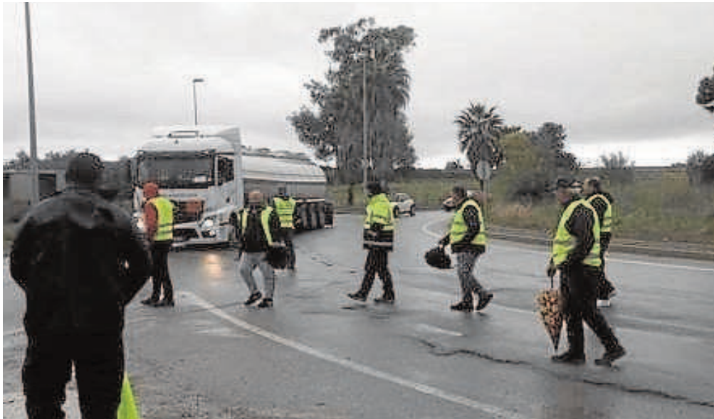
Piquetes en el Centro Logístico de Jerez ayer por la mañana