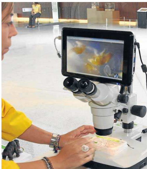
Ministerio y CCAA movilizarán 238 millones en I+D+i.

El objetivo de los planes complementarios es establecer colaboraciones y alinear los esfuerzos de la Administración central, las autonomías y los fondos europeos en áreas estratégicas, respondiendo a los criterios de la Unión Europea para la aplicación de medidas transformadoras para la economía en el Plan de Recuperación.