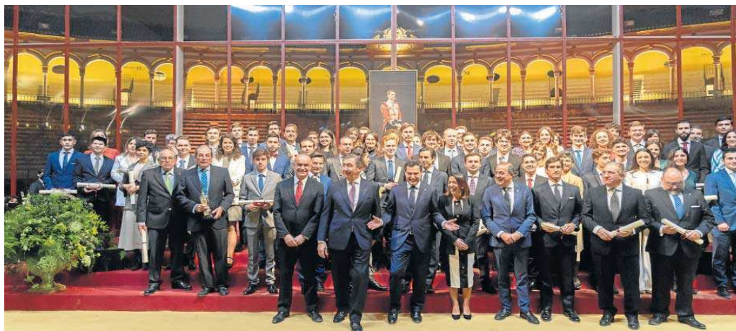
Foto de todos los premiados junto a las autoridades asistentes al acto de entrega.