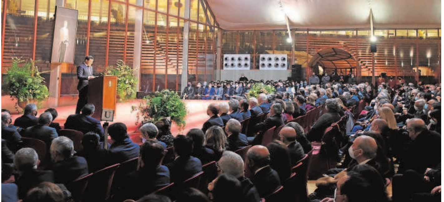
El presidente de la Junta de Andalucía, Juanma Moreno, durante su intervención, en una carpa instalada en el ruedo de la Real Maestranza de Sevilla