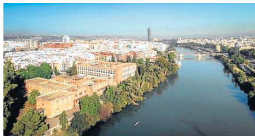
Vista aérea del estado actual de los terrenos de Altadis.

El Gobierno andaluz destaca "su impulso" para acelerar la tramitación