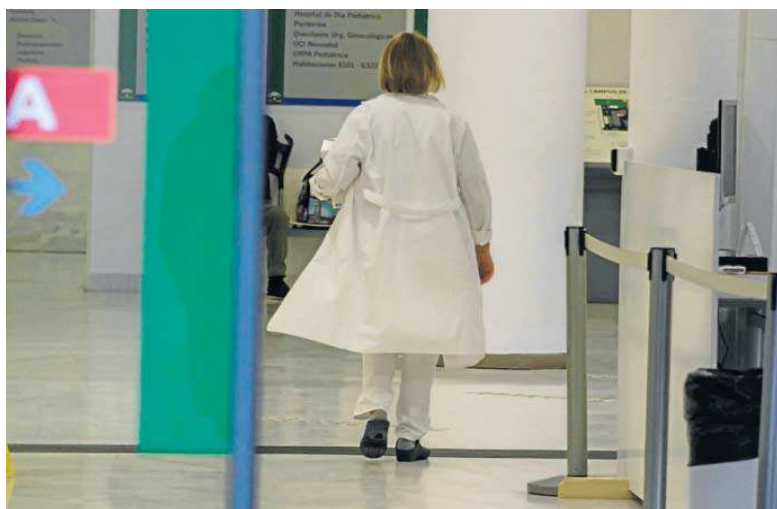
Una médica por los pasillos de un centro sanitario en la provincia.

Las agresiones a sanitarios son una realidad en el día a día de médicos, enfermeros y demás personal en los centros sanitarios. Es Atención Primaria, tanto en las consultas normales como en sus urgencias, la que mayor presión soporta en este sentido. Y cualquier pretexto sirve; pero son las discrepancias en la atención médica recibida o la no recomendación al tratamiento indicado por el propio paciente lo que más provoca su irritabilidad o de sus acompañantes. Sevilla registró el