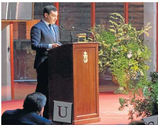
El presidente de la Junta, Juanma Moreno, durante su intervención.

sultaron premiados. Como dato curioso, ha de mencionarse que la mitad de ellos son mujeres, una proporción que hasta no hace mucho resultaba más dispar. El rector de la Hispalense reconoció el esfuerzo realizado por toda la comunidad universitaria, y especialmente por los estudiantes, que se han visto obligados a adaptarse a la normalidad que impuso la pandemia, con clases telemáticas.