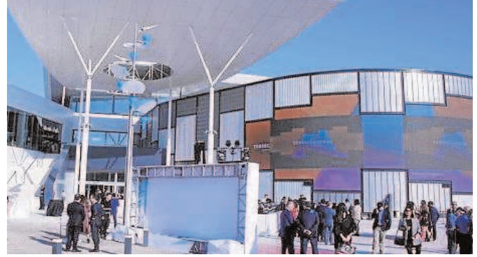
Centro comercial Torrecárdenas

Bogaris —especialista en la promoción de grandes superficies comerciales, logísticas e industriales en régimen de arrendamiento— invirtió 150 millones de euros en este megacentro de 150.000 metros cuadrados.