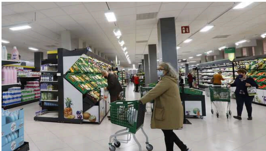
Supermercado de Mercadona / Josué Correa

No suele ser habitual que Juan Roig opine abiertamente sobre la actualidad. Normalmente se ciñe a sus zapatos, su empresa, y no se sale del guion más allá de discursos generalistas como el orgullo de pagar impuestos o la necesidad de buenos empresarios que creen riqueza.