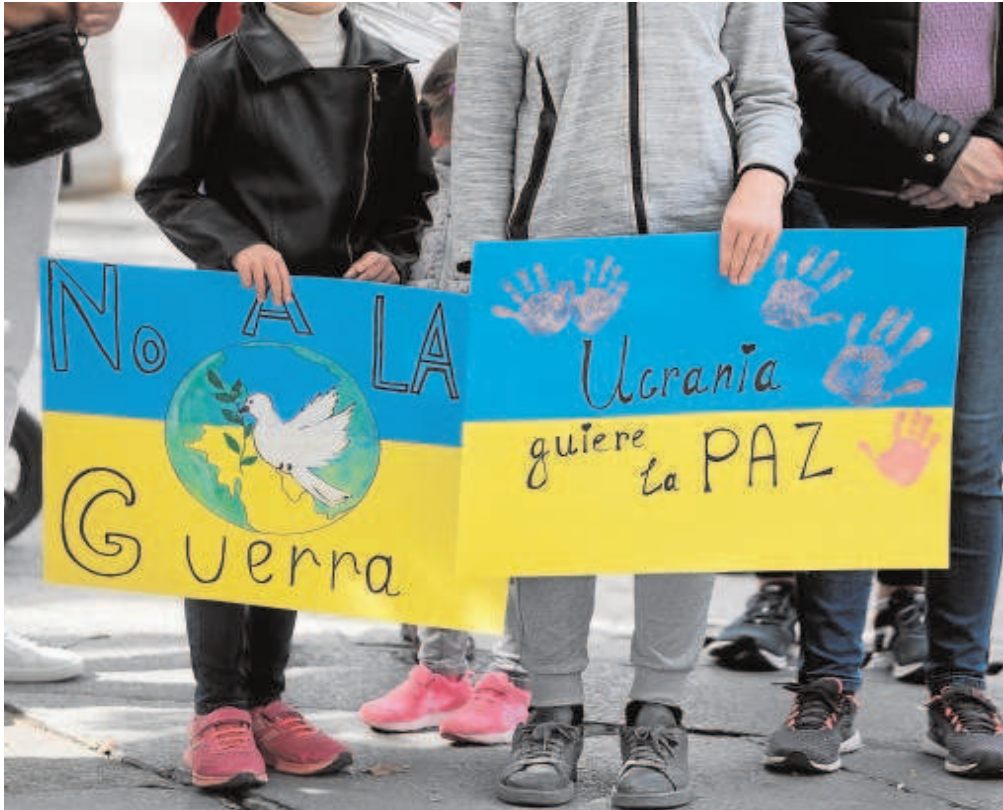
Ya hay niños ucranianos en los colegios de Sevilla

Ya han llegado a varios centros escolares de la provincia diez niños ucranianos de edades desde Infantil a ESO. Los refugiados se han ubicado cerca de sus familias de acogida