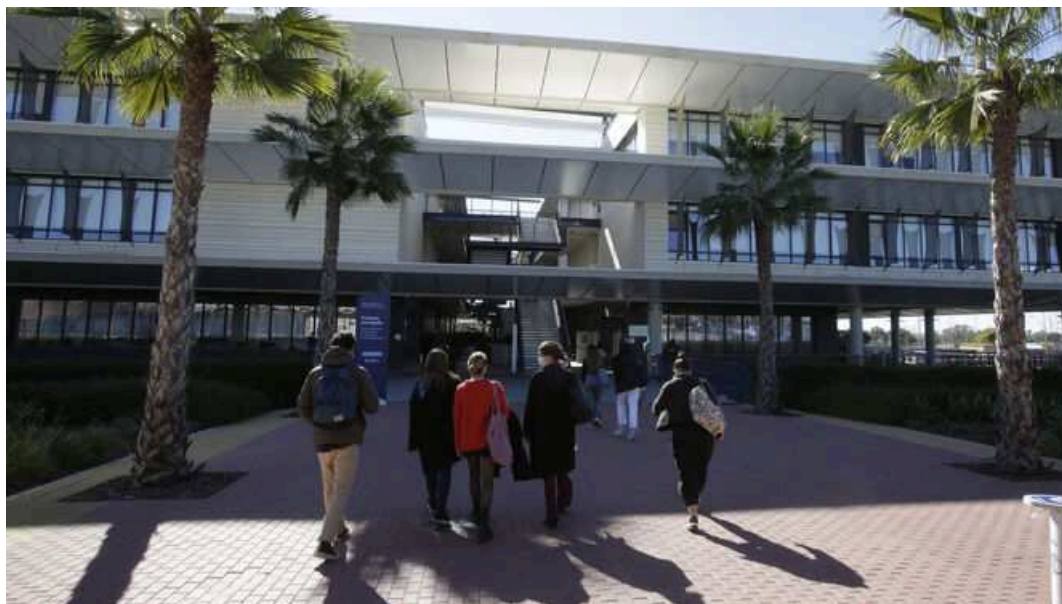
Primer edificio de la Universidad Loyola en el campus de Dos Hermanas.

La ampliación del campus sevillano de la Universidad Loyola , en el término municipal de Dos Hermanas , ya ha comenzado. La institución académica ha solicitado la licencia de obras al Ayuntamiento nazareno para comenzar a construir el nuevo edificio que acogerá el área de Ciencias de la Salud .