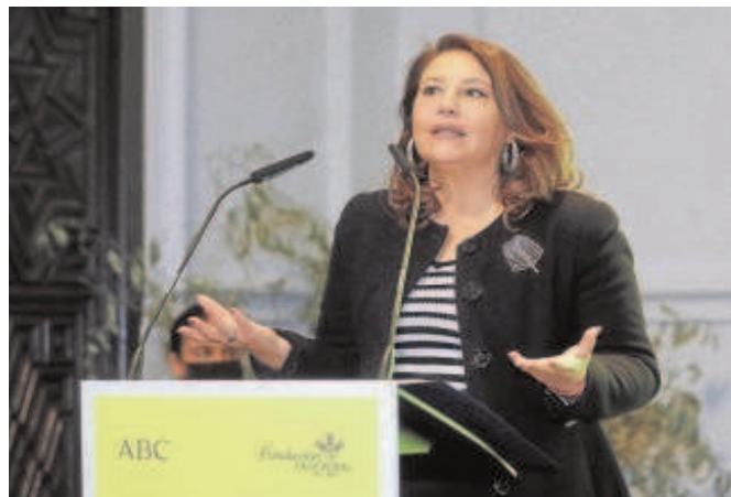
La consejera de Agricultura, Carmen Crespo