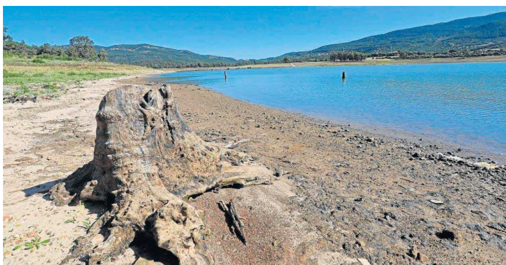
Embalse de Charco Redondo en la provincia de Cádiz.

En relación con la financiación de avales en explotaciones agrarias, el Ministerio de Agricultura, Pesca y Alimentación (MAPA) podrá poner a disposición de los operadores económicos, dentro de su ámbito de competencia, líneas de financiación de 2,7 millones de euros, en las que subvencionará, en régimen de concesión directa, el coste de los ava-