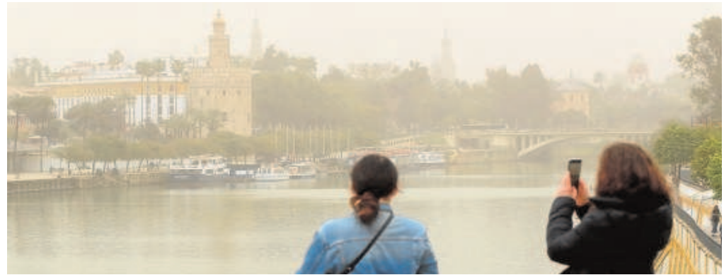
Vista de la Giralda y la Torre del Oro con la calima, ayer desde el Puente de Triana

Tras las últimas precipitaciones, los seis pantanos que abastecen Sevilla y su área de influencia, albergan 322,61 hectómetros cúbicos, encontrándose al 50,3% de su capacidad, 18 puntos menos que hace un año, cuando almacenaban 420,72 hectómetros cúbicos, según los datos registrados por la Empresa Metropolitana de Abastecimiento y Saneamiento de Aguas de Sevilla (Emasesa). A pesar de las lluvias registradas, que han dejado en siete días un total de 172,2 l/m 2 en estas presas de la provincia, las reservas de agua han descendido 18 puntos por debajo de la situación en la que se encontraban hace justo un año, en marzo de 2021, por entonces a un 68% de su capacidad. En la última década, sólo en 2017 se vivió una situación peor a la actual cuando el agua que acumulaban los pantanos era inferior al 50%, según informa José Manuel Brazo Mena.