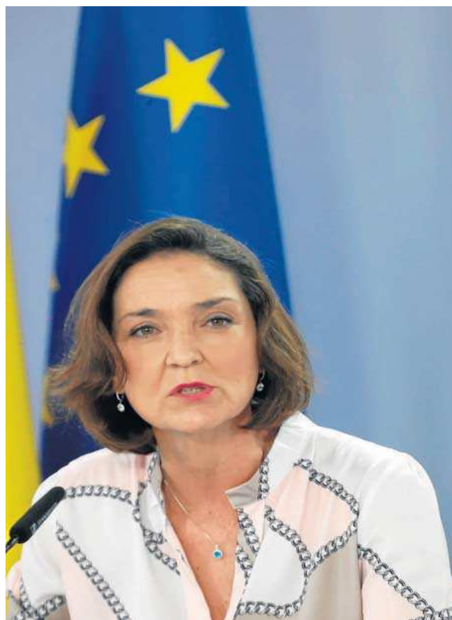
Reyes Maroto, ayer tras el Consejo de Ministros.

Sus objetivos son buscar su diversificación hacia las energías renovables marinas y la construcción de buques de bajas emisiones, digitalizar la cadena de valor, hacerlo más sostenible medioambientalmente y capa-