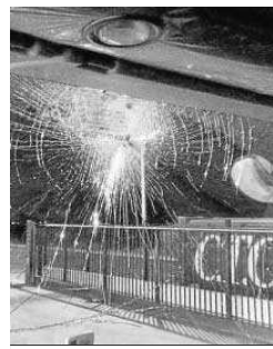
Pedrada en la luna de un camión.

El Gobierno central prometió el miércoles crear un Centro de Coordinación de Seguridad para garantizar que las empresas transportistas que no secundan el paro que comenzó el pasado lunes en el sector, que serían la mayoría según el Ejecutivo, puedan continuar con su trabajo y abastecer a las industrias, supermercados y resto de actividades productivas. Así lo avanzó el presidente de la Asociación de Transporte Internacional por Carretera (Astic),