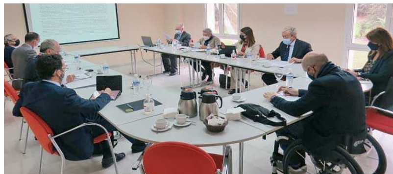
El consejo de administración del PTA celebrado ayer.