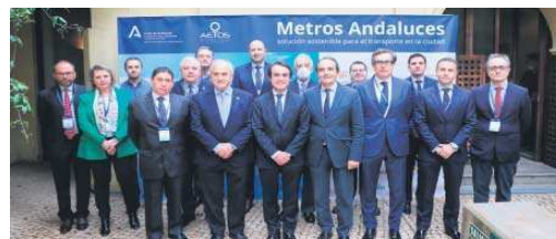
Participantes en las jornadas de metro celebradas ayer.

a través del Pitma 2030 y, además, están siendo bien valoradas por los fondos europeos, que priorizan en sus nuevas convocatorias a los modos de transporte más limpios y saludables.