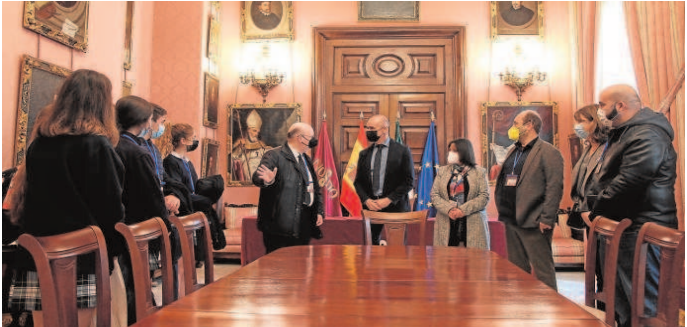
El alcalde, Antonio Muñoz, recibe a un grupo de escolares en el Ayuntamiento de Sevilla