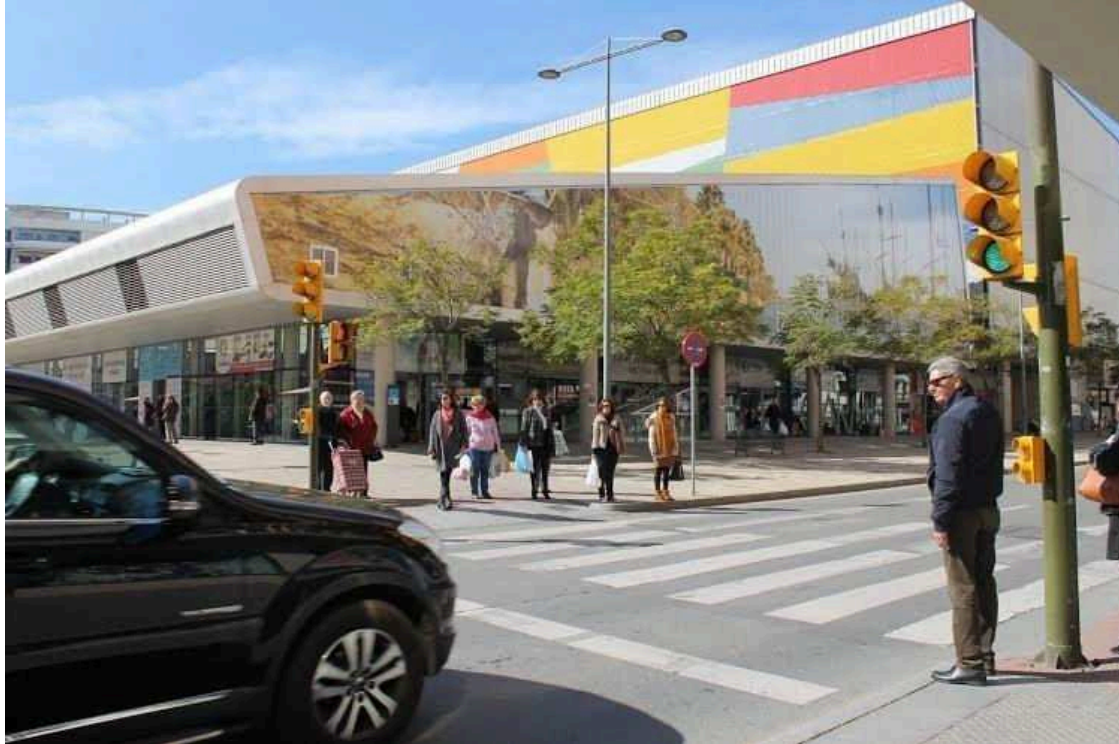
Mercado del Carmen en Huelva. VH

Los mercados de Huelva capital, el Mercado del Carmen y el Mercado de San Sebastián , han señalado que, de momento, están "abastecidos" , aunque ha indicado que "se empieza a notar" la huelga convocada por la Plataforma para la Defensa del Sector de Transporte de Mercancías y el amarre de la flota pesquera, por lo que ha bajado "la variedad de productos", toda vez que han mostrado su "preocupación" por los "daños colaterales" que conlleva la huelga.