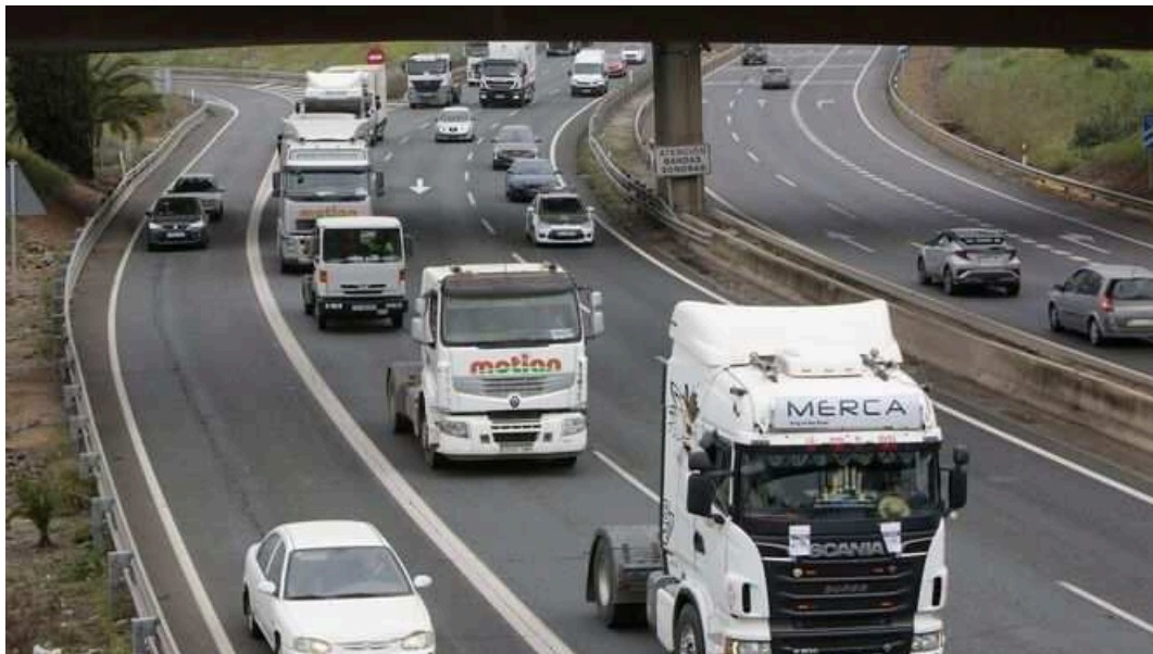
Caravana de protesta de transportistas por la SE-30 este jueves.

Desde la empresa de supermercados LIDL han declarado este jueves que la huelga de transportes está afectando al buen funcionamiento de la cadena de suministro española. En su caso, el impacto se está concentrando especialmente en las plataformas logísticas de Andalucía (Málaga y Dos Hermanas) y Galicia (Narón), "donde las concentraciones están impidiendo tanto la llegada como la salida de mercancía, con la consecuente afectación a parte de su red de tiendas".