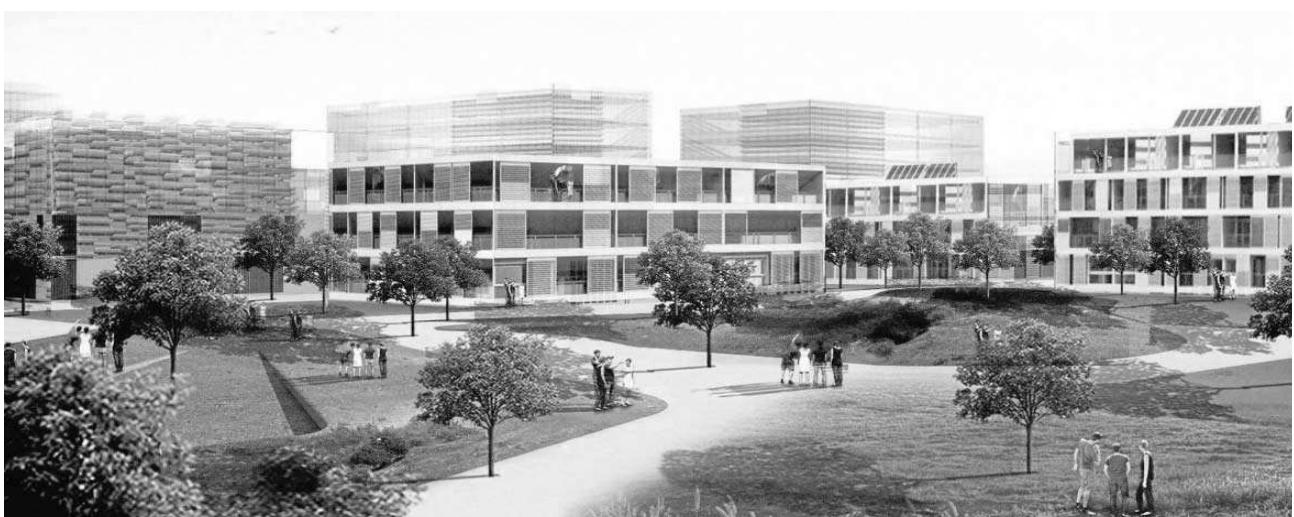
Recreación de cómo quedará el Pítamo, que tiene 208 hectáreas urbanizables.