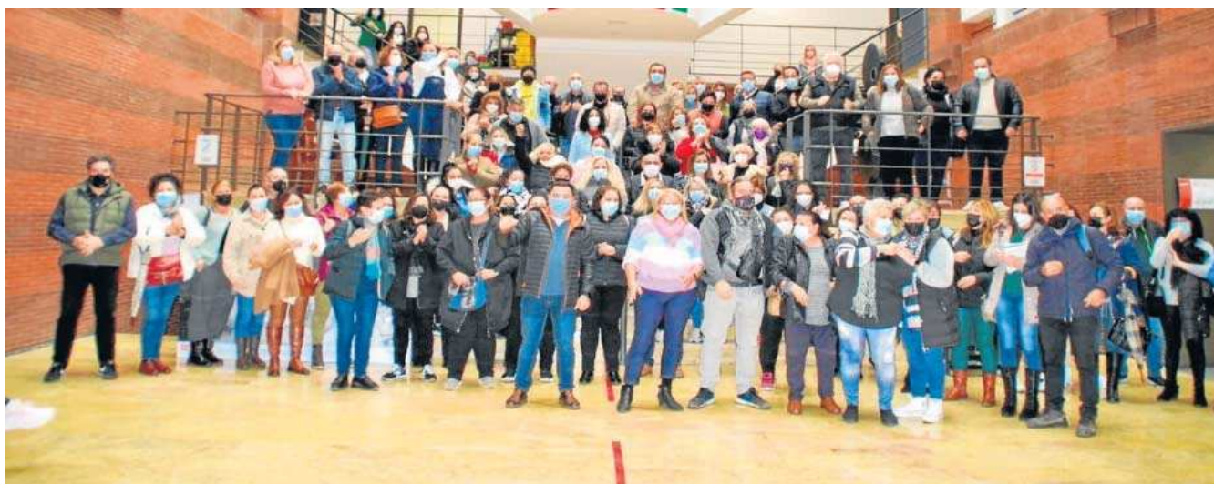
CCOO DE SEVILLA