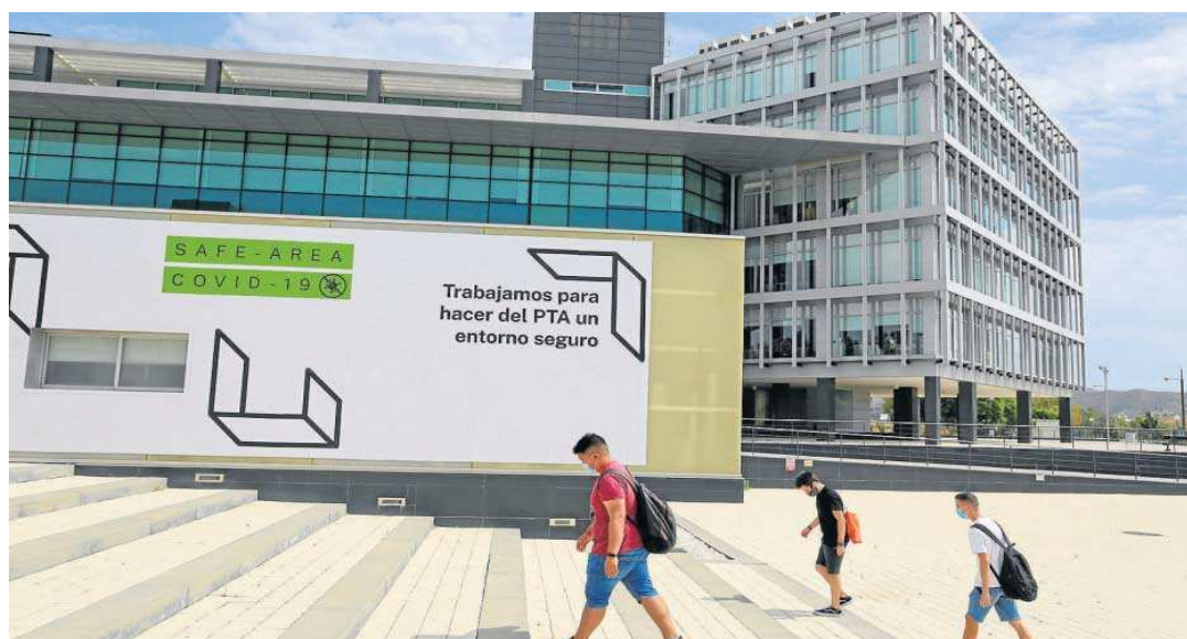
Empleados en el PTA.

En esa línea, desde Málaga Tech Park afirman que están inmersos en importantes proyectos que supondrán un nuevo revulsivo. El más destacado es la creación a inicios de este año de la Fundación Ricardo Valle de Innovación (Innova IRV), una alianza entre gran-