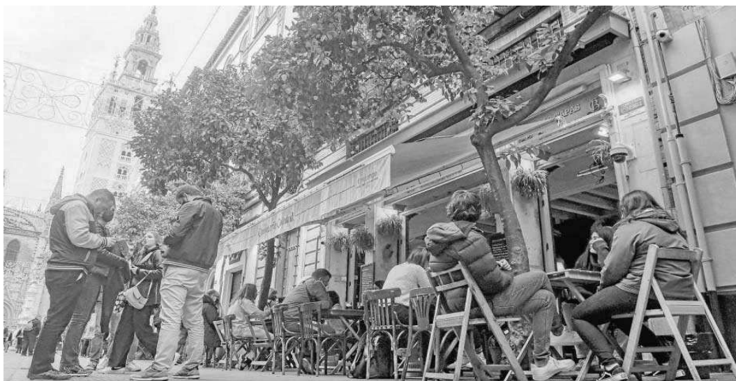
Cientes en un velador en la calle Mateos Gago, junto a la Giralda.