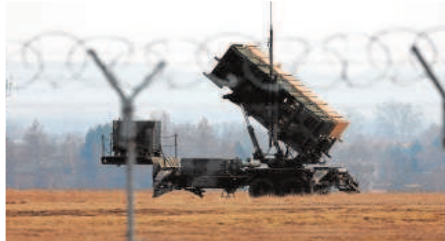
Lanzamisiles Patriot en la base polaca de Rzeszow-Jasionka