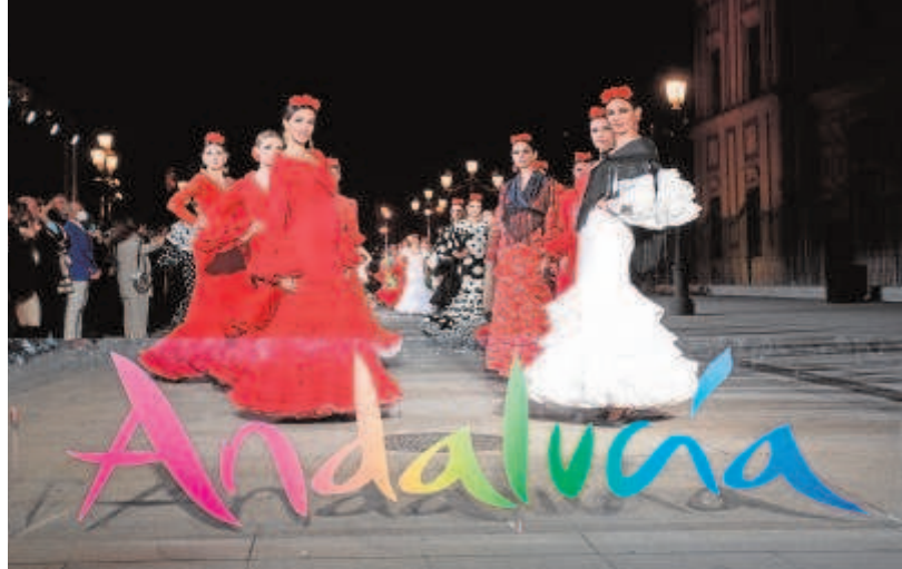
Este evento forma parte del proyecto «Andalucía, Destino de Moda».