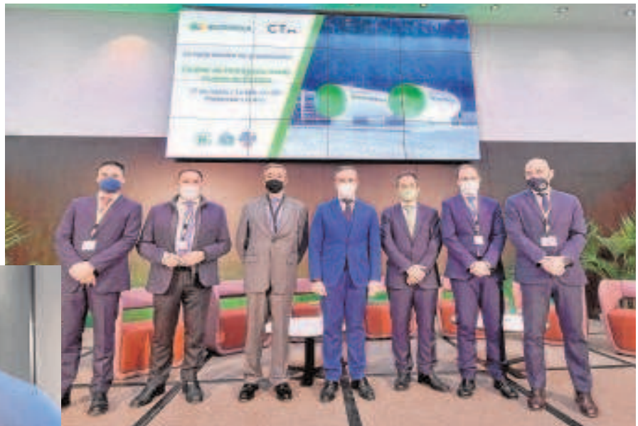
Presentación de las jornadas de CTA

El Clúster Puerto de Europa —liderado por Iberdrola, Fertiberia y la Universidad de Huelva— tuvo ayer su puesta de largo en Sevilla, donde se