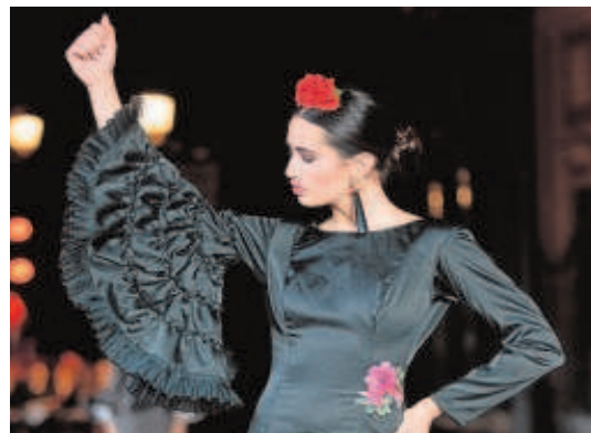
Una reivindicación del traje de flamenca

No es casualidad que la devastadora crisis económica sufrida por el sector durante la pandemia del Covid-19, junto al impulso institucional de la moda flamenca como interés turístico, haya conseguido que se presente uniendo la fuerza y el talento de todos sus actores principales. Un sector económico único dentro de la moda, como el producto que ensalza y crea puntada a puntada, que ha puesto todas sus esperanzas en este 2022 y sus próximas fiestas.